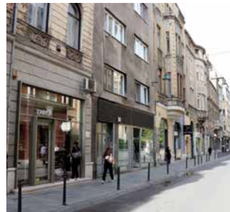
Ulica Zelene beretke