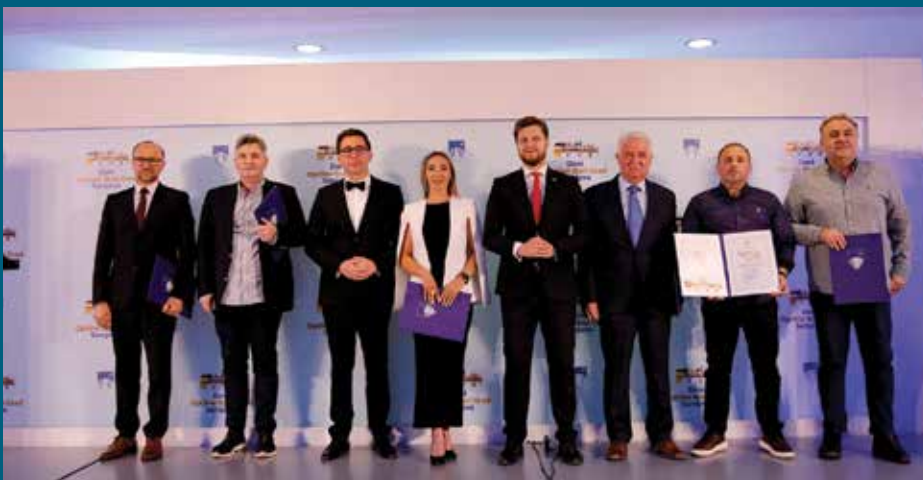
Dobitnici priznanja i povelja

Kolektivno priznanje - Zlatni sebilj pri-