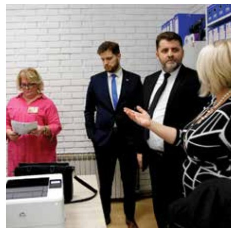
U obilasku Sektora za građanska pitanja