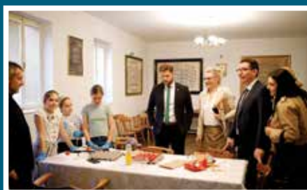
Posjeta Staroj pravoslavnoj crkvi