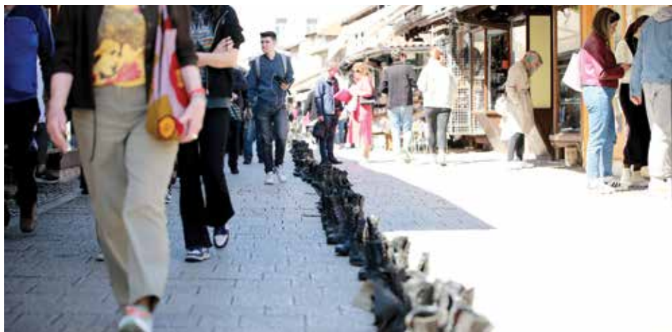
Staza sjećanja kao simbol koraka ubijene djece

U povodu 05. aprila, Dana početka opsade Sarajeva, duž rute od Trga djece Sarajeva do Baščaršije, postavljena je staza sjećanja koju čine cipele kao simbol koraka ubijene djece i građana opkoljenog Sarajeva te poginulih branitelja.