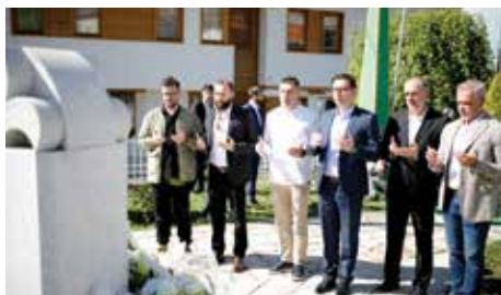
Odata počast šehidima i poginulim borcima

borci koji su dali svoje živote za odbranu BiH, te da je obaveza svih preživjelih da se sjećaju najboljih bosanskih sinova jer se cijena slobode koju danas imamo skupo plaćena. Odlukom Rijaseta Islamske zajednice od 23. januara, 1995. godine, u BiH je drugi dan Ramazanskog bajrama proglašen Danom šehida, kao dan sjećanja na sve one koji su dali živote braneći porodicu, čast, domovinu i vjeru od 1992. do 1995. godine. Taj dan se obilježava obilaskom šehidskih mezarja, posjetama šehidskim porodicama, učenjem hatme za sve šehide i podsjećanjem na njihovu žrtvu.