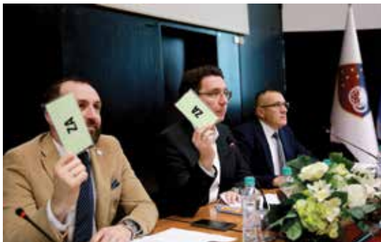
Osnovano Javno komunalno preduzeće

Općinsko vijeće Stari Grad Sarajevo je održalo svoju 34. redovnu sjednicu na kojoj su usvojene brojne važne tačke iz obimnog dnevnog reda. Jedna od ključnih odluka bila je osnivanje Javnog komunalnog preduzeća, koje će preuzeti upravljanje parkinzima u Starom Gradu. Također, usvojen je Nacrt odluke o privremenom korištenju javnih površina, s ciljem implementacije preporuka revizije i uvođenja javnih poziva. Općinski načelnik je pozvao sve zainteresovane strane da se aktivno uključe u javnu raspravu o ovom pitanju. U skladu sa preporukama revizije, donesene su odluke o utvrđivanju udruženja od posebnog značaja, transparentnom finansiranju neprofitnih organizacija i pokroviteljstvu načelnika. Osim toga, uređena je oblast plaćanja komisija i radnih grupa, kao i postupci vezani za poklone i reprezentaciju. Općinsko vijeće je također formalno dodijelilo objekat u ulici Čadordžina SOS Dječijim selima, koji će služiti kao dom za djecu bez roditelja koja studiraju.