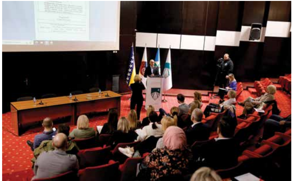
Konferencija "Zdrave zajednice u BiH"

Pilot projekat će trajati četiri godine, dok je plan da kompletan projekat 'Zdrava zajednica u BiH' traje 12 godina. "Uzimajući obzir u činjenicu da je za zdravstvo u Starom Gradu, ali i u svim općinama u Sarajevu nadležan Kanton Sarajevo, mi se trudimo da kroz preventivne programe i druga djelovanja u zajednici poboljšavamo zdravstveno stanje stanovnika naše općine. Kroz ovakve projekte nam se