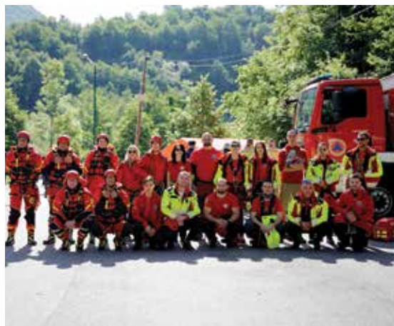
Gorska služba spašavanja Trebević