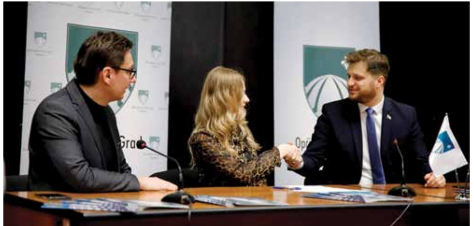
Za stipendije izdvojeno 615.000 KM

Nakon srdačnih riječi podrške i ohrabrenja, načelnik Čengić je zajedno sa maskotom Sportskih igara, Viktorom, zapalio plamen, označivši zvanični početak ovog sportskog spektakla. "Ulaganje u sport i mlade je naš strateški prioritet", ponosno je istakao načelnik Čengić, naglašavajući posvećenost Općine u promociji zdravog života i podršci mladim talentima. Već prvog dana, mališani iz