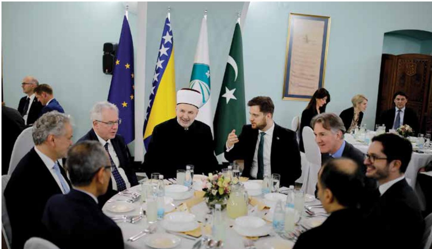
Iftar za visoke zvanice