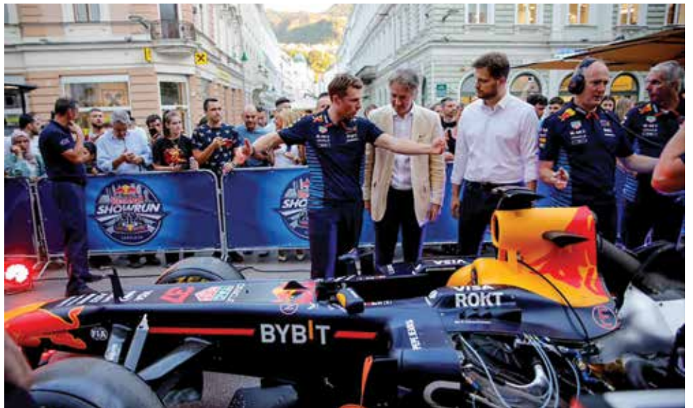
Izložen bolid F1 ispred Katedrale