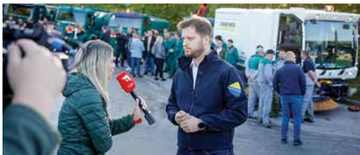
Sa akcije čišćenja lokacije

lokacije tokom Proljetne akcije čišćenja Ministarstva komunalne privrede, infrastrukture, prostornog uređenja, građenja i zaštite okoliša Kantona Sarajevo. Ova saradnja predstavlja temelj za daljnji razvoj projekta i očuvanje okoliša.