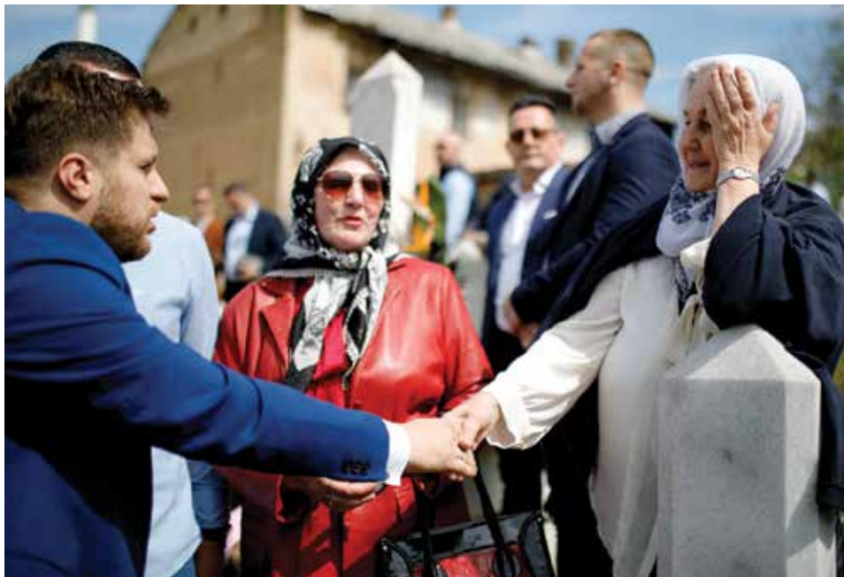
Obilježen Dan šehida na Kovačima

Prilikom okupljanja poručeno je da se nikada ne smiju zaboraviti šehidi i poginuli