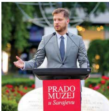
Izložba El Prado

Škaljić u posljednjem periodu održali su sastanke sa ambasadorima više prijateljskih zemalja. Cilj Općine je da sa ambasadama omogući prezentaciju država u Starom Gradu te sadržaj za građane i turiste kroz niz manifestacija. Sastanci su održani sa ambasadorima