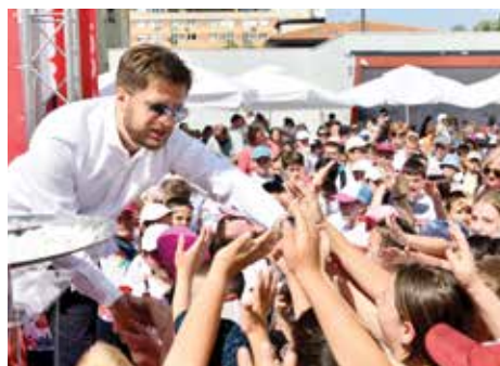
Svečano otvorene na Trgu Prve brigade policije

Projekat, kojim se svake godine izdvaja oko 360.000 KM, osigurava besplatan prevoz od prvog dana školske godine. Kroz Sporazum o saradnji, ova inicijativa pruža siguran i redovan dolazak na nastavu za 300 učenika iz škola "Vrhbosna", "Saburina", "Mula Mustafa Bašeskija" i "Šejh Muhamed ef. Hadžijamaković", koji se suočavaju s nedostatkom redovnog gradskog prevoza i žive na većim udaljenostima od svojih obrazovnih ustanova.