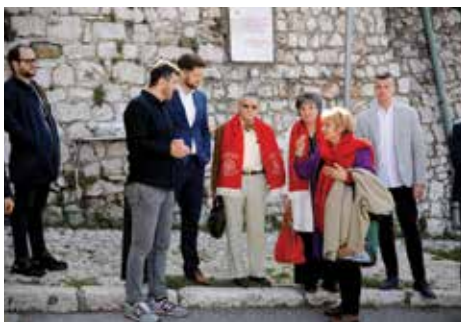
Godišnjica oslobođenja Sarajeva