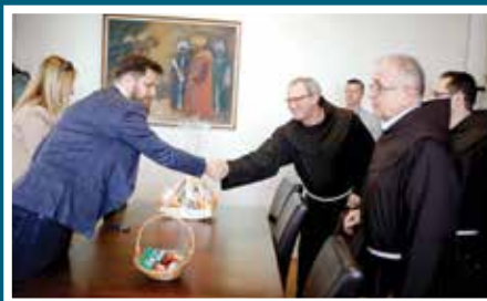
Posjeta Franjevačkom samostanu