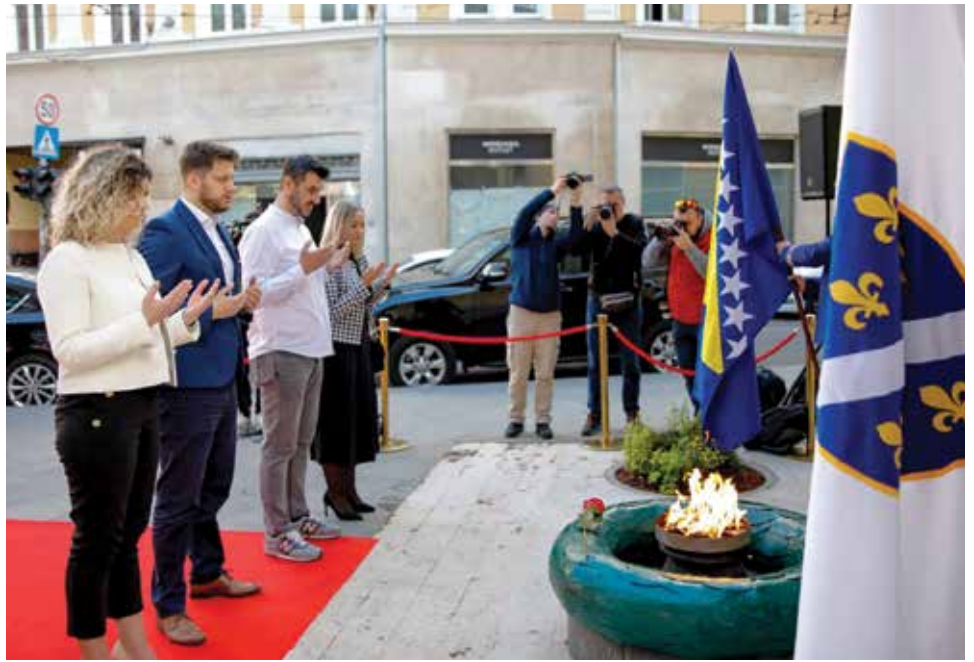
Spomen obilježje ispred Vječne vatre

Dana 06.04.1945. godine glavni grad Bosne i Hercegovine oslobođen je od fašističke okupacije. Historija se ponovila na isti datum 47 godina poslije. Tada su nove fašističke snage napale Sarajevo s okolnih brda. Uslijedilo je sistematsko uništavanje grada i višegodišnja opsada koja je trajala 1.425 dana i jedna je od najdužih u historiji modernog ratovanja, tokom kojeg je život izgubilo 10.514 ljudi, među kojima 1.601 dijete. Sarajevo se odbranilo, a država Bosna i Hercegovina je opstala.