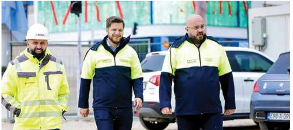
Izuzetno važan projekat za Općinu Stari Grad Sarajevo

Pored obnove same saobraćajnice i trotoara, u planu je i unapređenje infrastrukture, uključujući ugradnju novih ivičnjaka, poboljšanje sistema odvodnje, postavljanje nove vertikalne i horizontalne saobraćajne signalizacije te zamjena gumene izolacije tramvajskih šina.