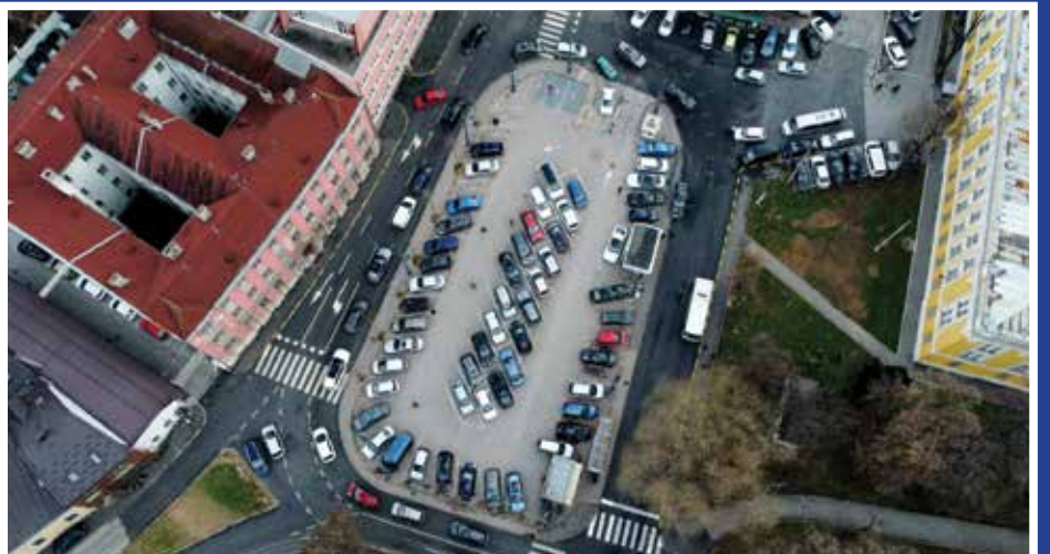
Efikasno upravljanje parkinzima u Starom Gradu

Planiram implementirati moderne tehnologije i strategije kako bismo osigurali optimalno poslovanje preduzeća i visok nivo kvalitete usluga. To uključuje korištenje softverskih rješenja za praćenje i upravljanje infrastrukturom, implementaciju pametnih sistema za upravljanje parkiralištima i ulaganje u obuku osoblja o novim tehnologijama i metodama rada. Ovakav pristup znatno će smanjiti troškove u smislu plaća i naknada koji proizilaze iz radno pravnih odnosa. Namjera nam je uspostavljanje Centra za nadzor i upravljanje svim kapacitetima na principima smart tehnologije, što će zahtjevati manji broj ljudi koji će raditi na naplati. Također kao što sam ranije naveo diversifikacija usluga je jedna ključna strategija, što znači da ćemo pored parkinga tražiti svoj prihod i u drugim djelatnostima koje su nam određene osnivačkim dokumentima.