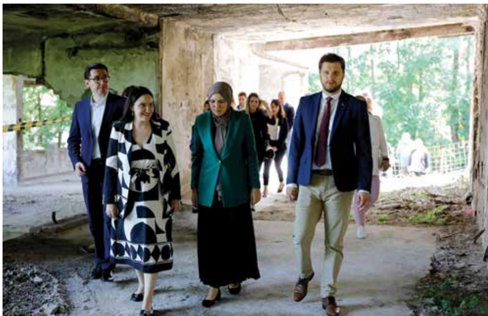
Ispunjenje dugogodišnje želje

“Dok su se drugi samo slikali i davali lažna obećanja bez ikakvog utemeljenja, mi počinjemo radove na objektu koji je potpuno uništen u ratu. Do dolaska