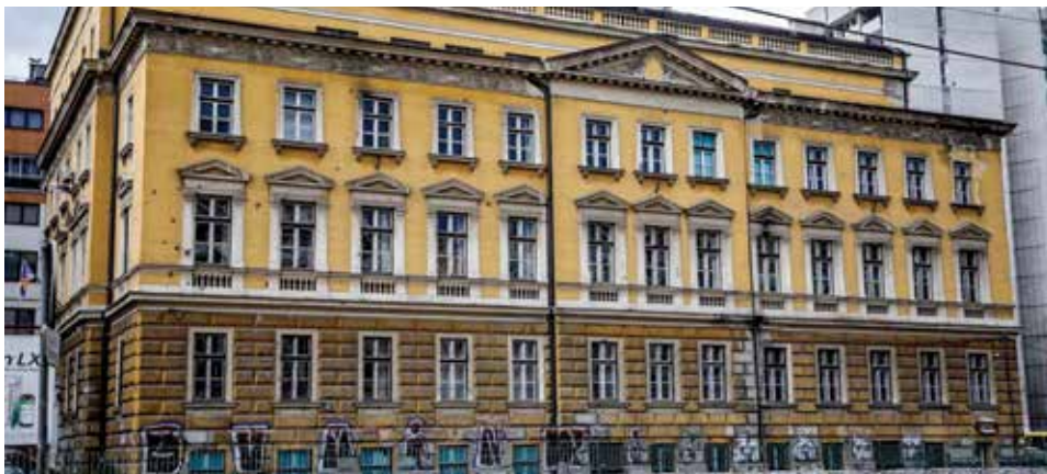
JU Srednja škola poljoprivrede, prehrane, veterine i uslužnih djelatnosti