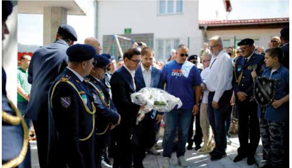
Odred Širokača osnovan 1992. godine

među kojima su bili i predstavnici Gradske uprave, Vlade Kantona Sarajevo, te antifašističkih udruženja.