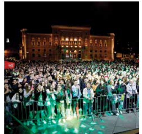
Prepun Trg Prve brigade policije