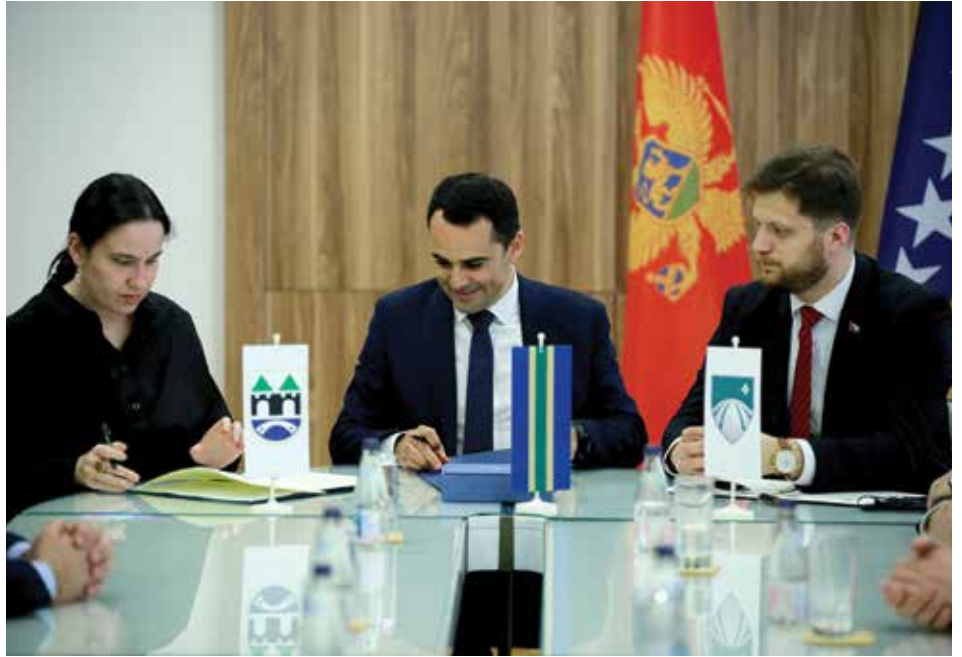
Sporazum o saradnji dvije lokalne zajednice