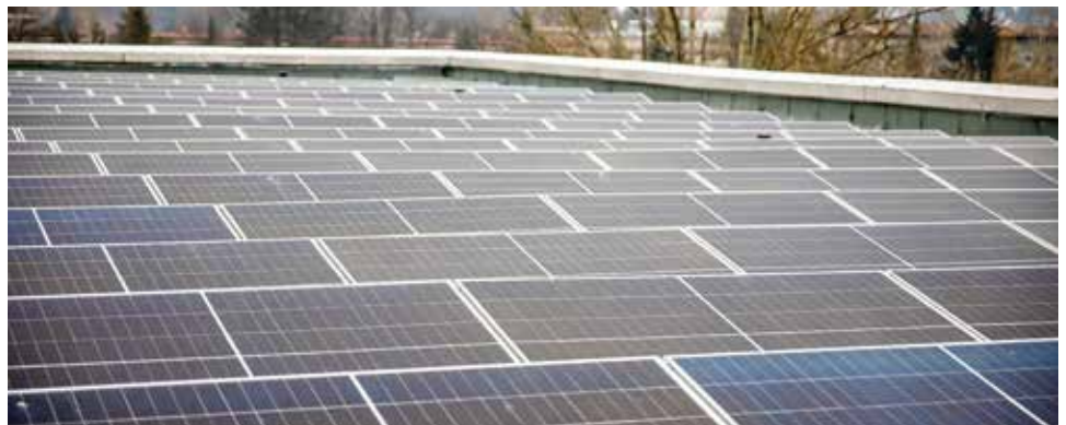
Solarni paneli na osnovnim školama

Jedan od ključnih elemenata projekta je planiranje korištenja proizvedene energije isključivo za potrebe škola. Time će se ne samo smanjiti njihova ovisnost o tradicionalnim izvorima energije već će se i znatno smanjiti ekološki otisak. Finansijska sredstva koja će biti uštedena putem ove inicijative bit će preusmjerena na druge aktivnosti koje