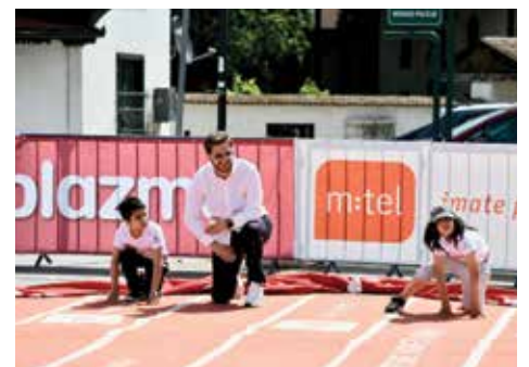
Podrška mladim talentima

Plazma Sportske igre mladih su postale neizostavan dio kalendara događaja u Starom Gradu, gradeći mostove među mladima i podstičući ih na aktivnost i timski duh. Zahvaljujući predanosti načelnika Čengića i Općine, ova manifestacija postaje sve veća i utiče na pozitivne promjene u životima mnogih mladih ljudi.