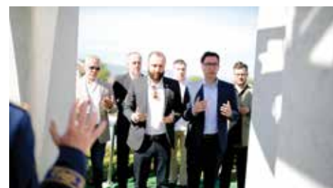
Mezar prvog predsjednika Alije Izetbegovića

U prisustvu brojnih delegacija i građana, na Šehidskom mezarju Kovači, svečano je obilježena 32. godišnjica formiranja Armije Republike Bosne i Hercegovine i 19. godišnjice 2. pješadijskog (rendžerskog) puka Oružanih snaga Bosne i Hercegovine. Polaganjem cvijeća i odivanjem počasti šehidima i poginulim borcima, prisutni su se prisjetili hrabrosti i žrtava koje su pripadnici Armije RBiH podnijeli u odbrani integriteta zemlje tokom rata.