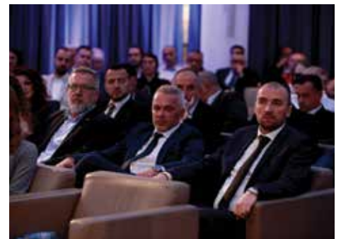
Vijećnici Općinskog vijeća Stari Grad

“Ovo je više od borbe za osvajanje novog mandata. Ovo je borba za budućnost naše Općine. Pokazali smo hrabrost i odlučnost da uplovimo u novo poglavlje, s jasno definisanom strategijom i projektima vrijednim preko 60 miliona KM. Stablnost i kontinuitet ključni su za uspjeh ove nove ere naše zajednice, jer su nas turbulencije u prošlosti usporavale. Ne smijemo dopustiti da nas nove turbulencije zaustave”, istakao je načelnik Čengić.