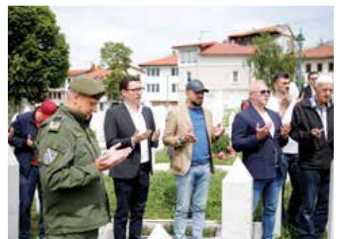
Šehidsko mezarje Kovači