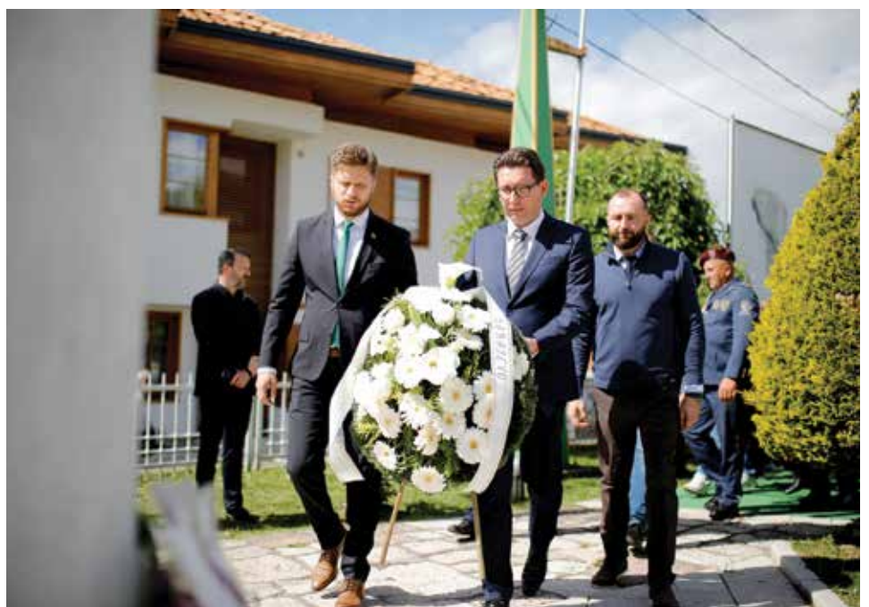
Odata počast i na Šehidskom mezarju Kovači

"Drugi maj je za mene dan kada smo odbranili grad, državu i slobodu. Danas i naredne dane želim da posvetimo kulturi sjećanja, ali i proslavi. Mi smo pobijedili, odbranili smo slobodu i to su za mene