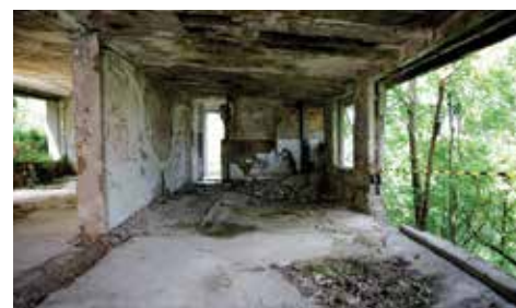
Projekat vrijedan oko dva miliona KM

ove vlasti, na lijevoj obali Miljacke u Starom Gradu nije postojao niti jedan obnovljen javni vrtić. Ovo je drugi vrtić nakon otvaranja vrtića “Bulbuli” na Bistriku 2021. godine, sa ukupnim ulaganjima od oko 3 miliona KM”, naveo je načelnik Čengić, te naglasio da su ove i slične aktivnosti ukinule beskrajnne liste čekanja za mjesta u vrtićima.