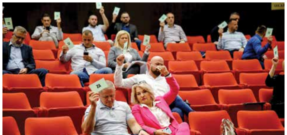
Sa sjednice Općinskog vijeća

Općinsko vijeće Stari Grad Sarajevo je održalo 33. redovnu sjednicu, na kojoj su usvojeni dokumenti koji su obećani da će se realizovati u prvih 100 dana mandata načelnika Irfana Čengića. Ključne odluke donesene na ovoj sjednici obuhvatale su širok spektar tema s preko 40 tačaka dnevnog reda. Najvažniji dokumenti koji su usvojeni obuhvatali su Prijedlog Budžeta Općine Stari Grad za 2024. godinu u iznosu od 35.536.020 KM, kao i konačnu Strategiju razvoja Općine za period 2024-2027. Načelnik Čengić istakao je da je usvajanje ovih dokumenata od vitalnog značaja za smjer daljeg razvoja općine, naglašavajući da su oni rezultat obećanja datih tokom kampanje. Jedna od ključnih odluka bila je i usvajanje Pravilnika o unutrašnjoj organizaciji i sistematizaciji službi Općine, čime se organi uprave vraćaju u okvire zakona, kao što su preporučili Ustavni sud FBiH, Federalno ministarstvo pravde i Ured za reviziju institucija FBiH. Također, utvrđen je Nacrt novog Statuta Općine Stari Grad, koji