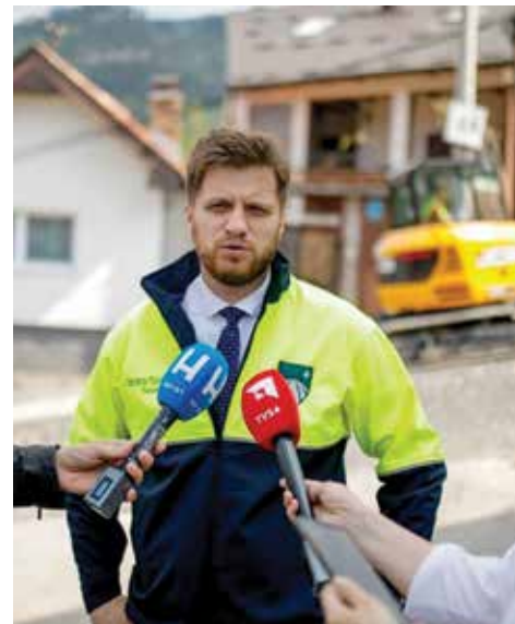
Sa obilaska radova

U toku su radovi na sanaciji dijela ulice Za Beglukom – plato Širokača, čija vrijednost iznosi oko 260.000 KM, a površina radova obuhvata oko 1.450 m 2 . Ovi radovi obuhvataju niz aktivnosti usmjerenih ka osiguranju stabilnosti i dugotrajnosti ceste, kao i njenom optimalnom funkcionisanju u svim vremenskim uslovima. Među tim aktivnostima su uklanjanje dijelova asfalta i zamjena granitne kocke, čišćenje šahtova i slivnika, te izrada poprečne drenaže. Posebno