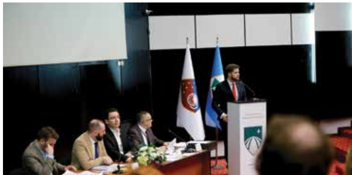
Usvojene desetine tačaka

Na 35. sjednici Općinskog vijeća Stari Grad Sarajevo, naglašena je kontinuirana saradnja između Vijeća i Načelnika, a usvojene su desetine ključnih tačaka koje implementiraju politike i obećanja. Evo pregleda najvažnijih odluka: Rebalans Budžeta Općine Stari Grad Sarajevo za 2024. godinu usvojen je kako bi se uključila prenesena sredstva, pružajući bolje finansijske perspektive; Imenovani su vršioci dužnosti predsjednika i članova Nadzornog odbora JKP "Općine Stari Grad" d.o.o. i Odbora za reviziju JKP "Općine Stari grad" d.o.o., osiguravajući stabilnost i efikasnost funkcionisanja preduzeća; Potpisivanje ugovora s Arhitektonskim, Mašinskim i Fakultetom za saobraćaj i komunikacije planira se radi jačanja saradnje i realizacije projekata predviđenih Strategijom razvoja Općine; Odluke o privremenom korištenju javnih površina, kao i plan korištenja javnih površina u 2024. godini, donesene su s ciljem suzbijanja zloupotreba koje su dovele do krivičnih postupaka; Povećan je grant boračkim udruženjima za 16%, pružajući veću podršku veteranima; Usvojene su odluke o kriterijima i postupku dodjele sredstava za projekte elektronskih medija, te visini naknada za različite namjene; Donesen je Pravilnik o utvrđivanju uslova i postupka za ostvarivanje prava na novčane podsticaje u poljoprivrednoj proizvodnji, podržavajući razvoj lokalne poljoprivrede itd.