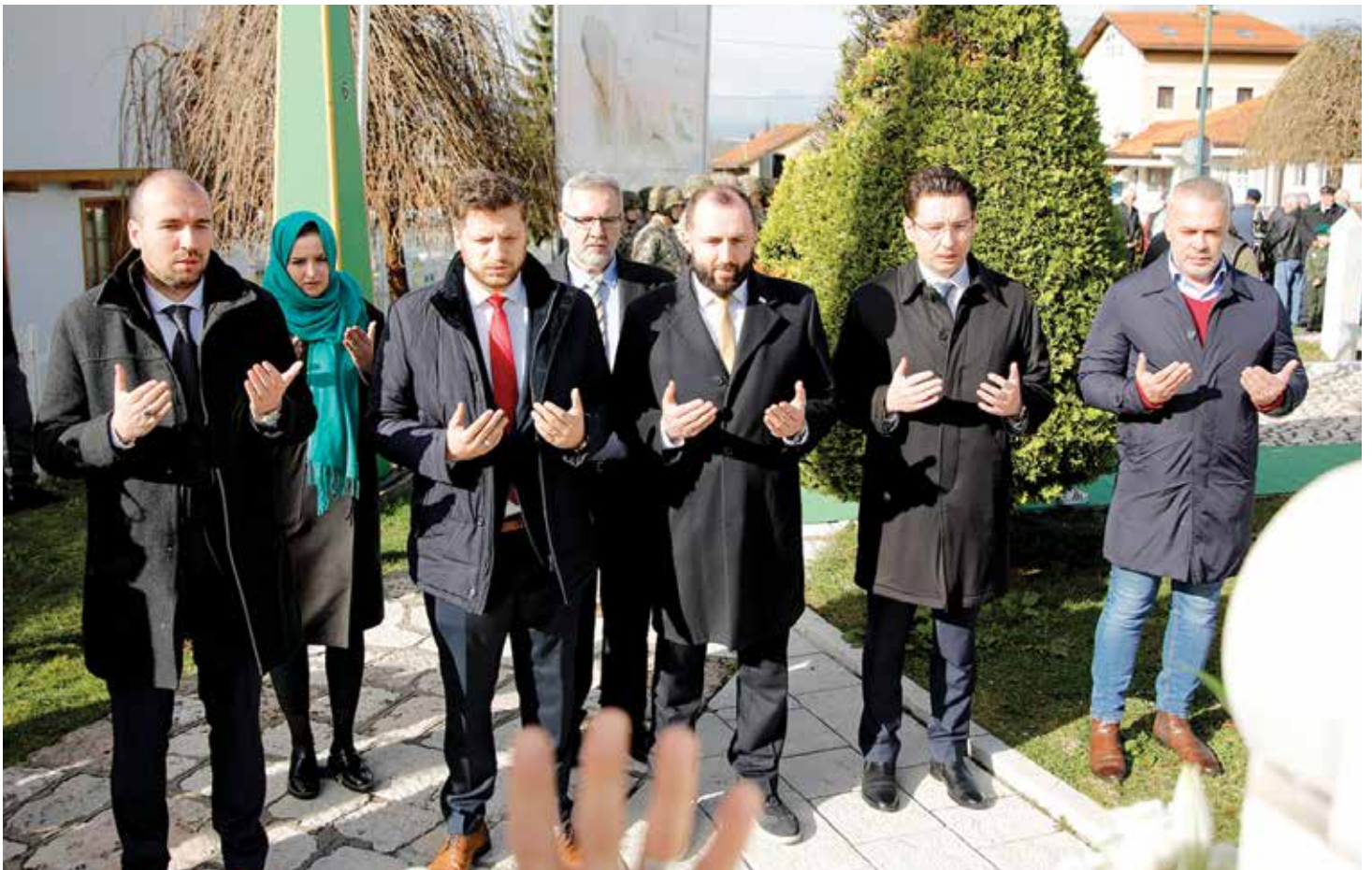
Delegacija Općine Stari Grad na Šehidskom mezarju Kovači

Obilježene brojne godišnjice iz perioda agresije ● Čuvanje sjećanja i na antifašističku borbu 1941-1945 ● Kanton Sarajevo, boračka i građanska udruženja organizatori obilježavanja