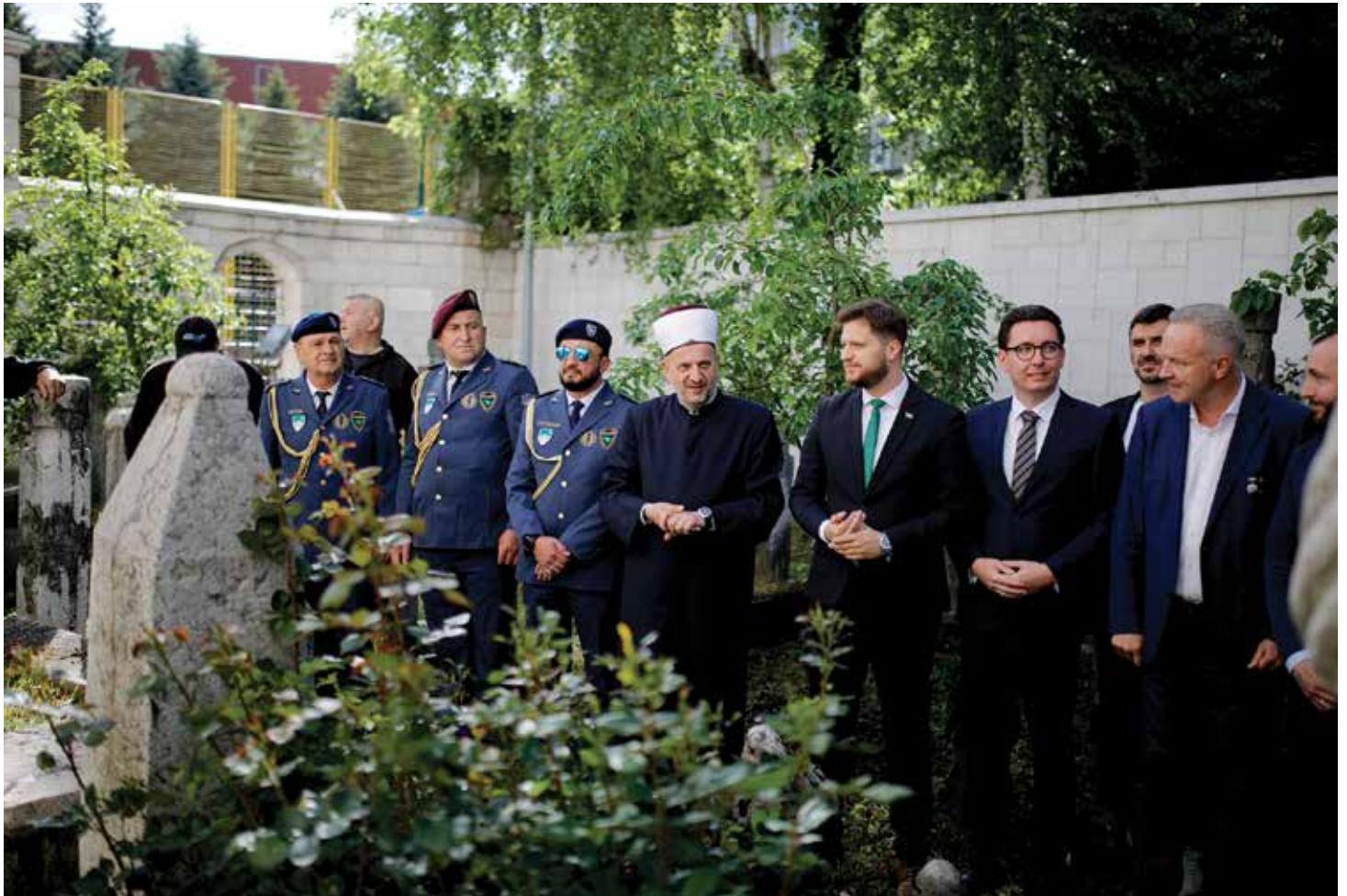
Mezar Isa-bega Ishakovića

je Izetbegovića i Šehidskom mezarju Kovači.