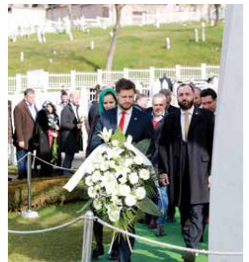
Odata počast na mezarju prvog predsjednika

aktivnosti i da gradimo i čuvamo našu domovinu. Nikada nemojte poistovjetiti državu i vlast. Na vlast možemo biti ljuti i