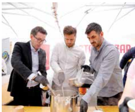
Događaj namjenjen građanima

Pred Katedralom održan je Gastro događaj “Okusi Starog Grada”, koji je obogatio obilježavanje Dana Općine uz podršku Turističke zajednice Kantona Sarajevo. Ova manifestacija okupila je lokalne privrednike Starog Grada, uključujući poznata imena poput Mrvica Cafe&Bakery, Pekare “Poričanin” te Amko komerca, koji su predstavili svoje proizvode i ponudili okuse i specijalitete na posebnom štandu.