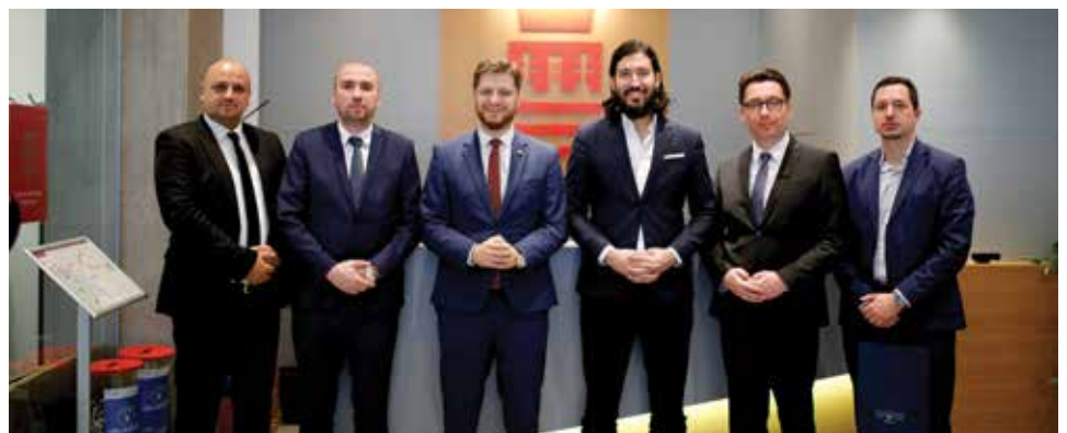
Rukovodstvo Općine u posjeti Općini Stari Grad Beograd