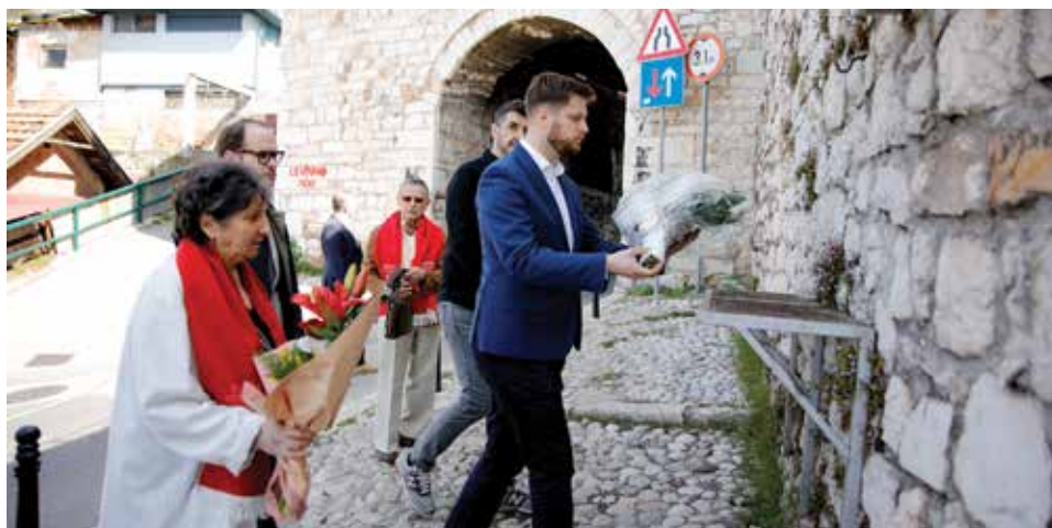
Načelnik Čengić položio cvijeće na spomen obilježje

Memorijalna šetnja organizovana je u okviru obilježavanja ovog dana s ciljem da se na dostojanstven način oda počast svim žrtvama.