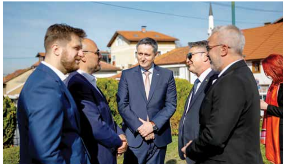
Šehidsko mezarje Kovači