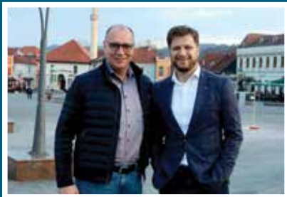
Lugavić i Čengić

Načelnik Općine Stari Grad Sarajevo Irfan Čengić nedavno je posjetio gradonačelnika Tuzle, Zijada Lugavića, u sklopu radne posjete koja je imala za cilj unapređenje saradnje. Tokom njihovog susreta, koji je protekao u atmosferi konstruktivnog dijaloga, razmijenjena su mišljenja i ideje s fokusom na zajedničke projekte i inicijative usmjerene za dobrobit građana. Jedan od ključnih aspekata njihovih razgovora bila je razmjena iskustava između Općine i Grada, s ciljem identificiranja najboljih praksi i mogućnosti za projekte. Obojica su iznijeli svoje vizije za buduću razvoj svojih zajednica te su istaknuli važnost saradnje u ostvarivanju tih ciljeva.