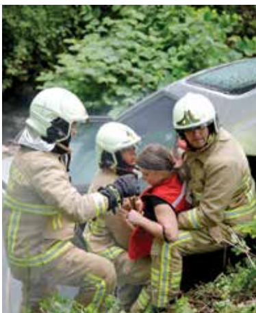
Vježba Civilne zaštite