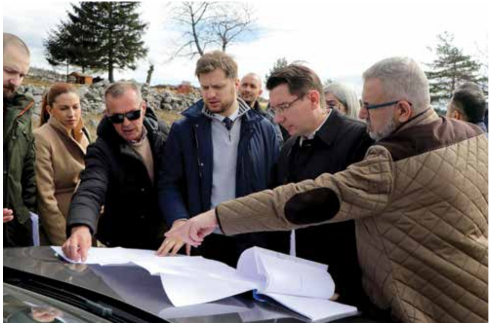
Sporazum o zajedničkoj investiciji izgradnje vodovodnog sistema Hreša

Općina Stari Grad Sarajevo planira još jedan veoma važan kapitalni projekat ove godine - rekonstrukciju lokalne ceste Sedrenik – Barice – Čavljak. Projekat obuhvata dio ceste od raskrsnice na Sedreniku do parkirališta na Baricama, s ukupnom dužinom dionice od 3.500 metara. Ova cesta, osim što povezuje ove lokalitete, ima i širi značaj, budući da su Barice poznato izletišta nadomak grada, posjećeno kako od strane lokalnog stanovništva tako i turista. Na nedavnom zboru građana, rekonstrukcija ove ceste izdvojena je kao prioritetna tema. Očekuje se da će sanacija ove saobraćajnice poboljšati ne samo kvalitetu života stanovnika ovih područja već i sigurnost, što je posebno važno s obzirom na povećan turistički promet prema Baricama. Barice, kao omiljeno izletišta, privući će još veći broj posjetitelja uz kvalitetniju saobraćajnicu