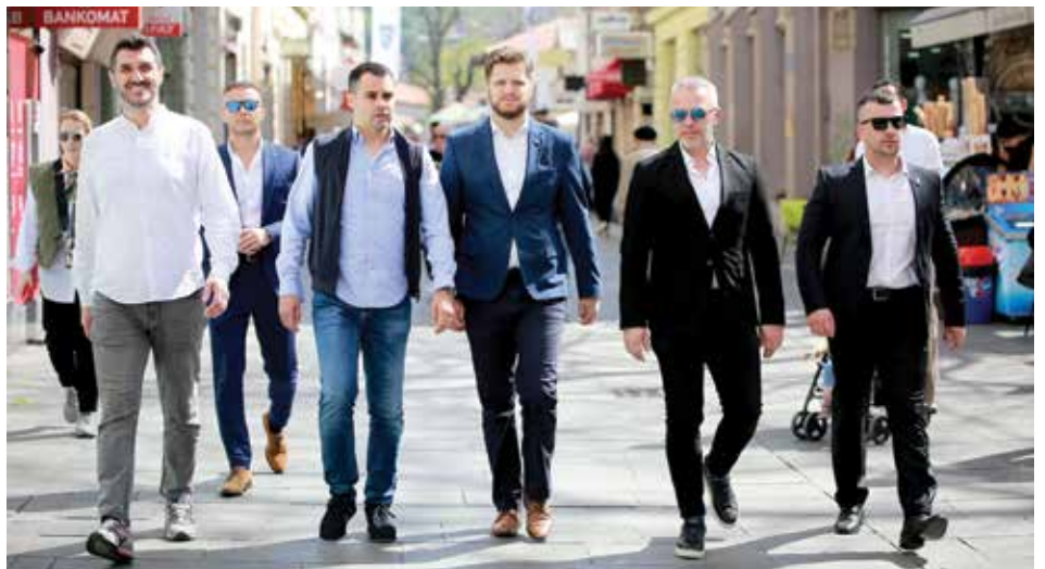
Dogovorena saradnja u oblasti turizma