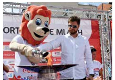
Načelnik Čengić sa maskotom zapalio plamen