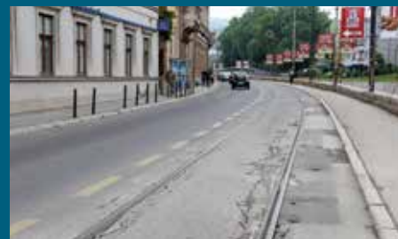
Ulice uz tramvajske šine