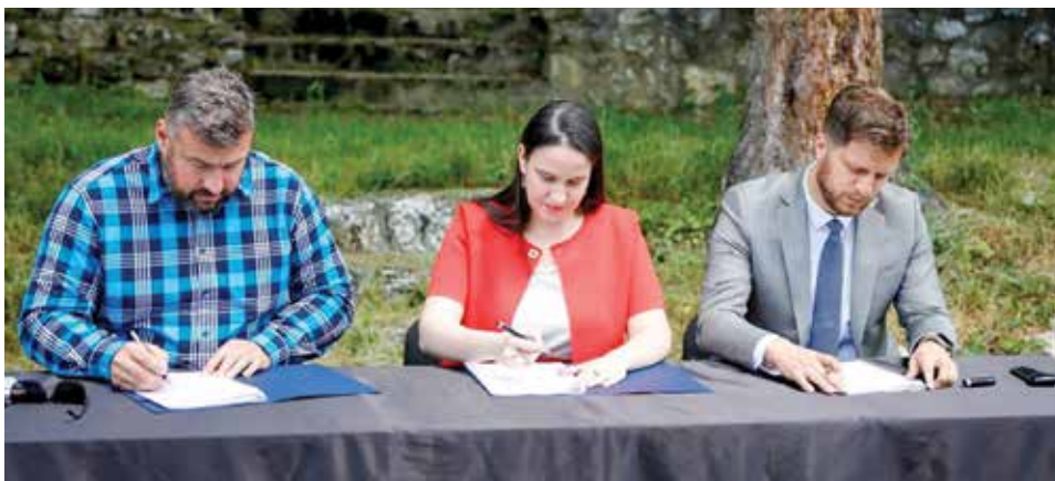
Sa potpisivanja ugovora za obnovu igrališta Medrese

Općina Stari Grad Sarajevo će dobiti značajna sredstva za obnovu fasada i unapređenje energetske efikasnosti. Projekti pod vodstvom Grada Sarajeva, uz podršku Kantona Sarajevo i Općine Stari Grad, imaju za cilj revitalizaciju nekoliko objekata, doprinoseći tako kolorističkoj obnovi fasada i energetske efikasnosti. Projekti obuhvataju uređenje fasada na