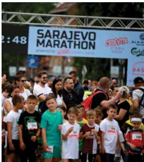
Učestvovalo 2.200 takmičara

U okviru svečanog obilježavanja 2. maja, Dana Općine Stari Grad, u program je uvrštena najmasovnija sportska i trkačka manifestacija u BiH „Sarajevo marathon“, koju organizuje Udruženje „Dečki u plavom“. Startna pozicija za više od 2.200 takmičara i 44 države svijeta bila je Trg Prve brigade policije, a početak utrke označio je Općinski načelnik Irfan Čengić.