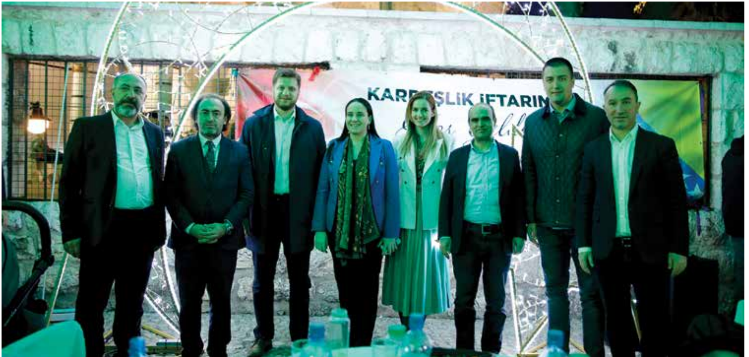
Zajedničkim snagama organizovan iftar