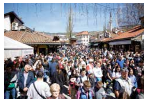
Općina podržala Memorijalnu šetnju