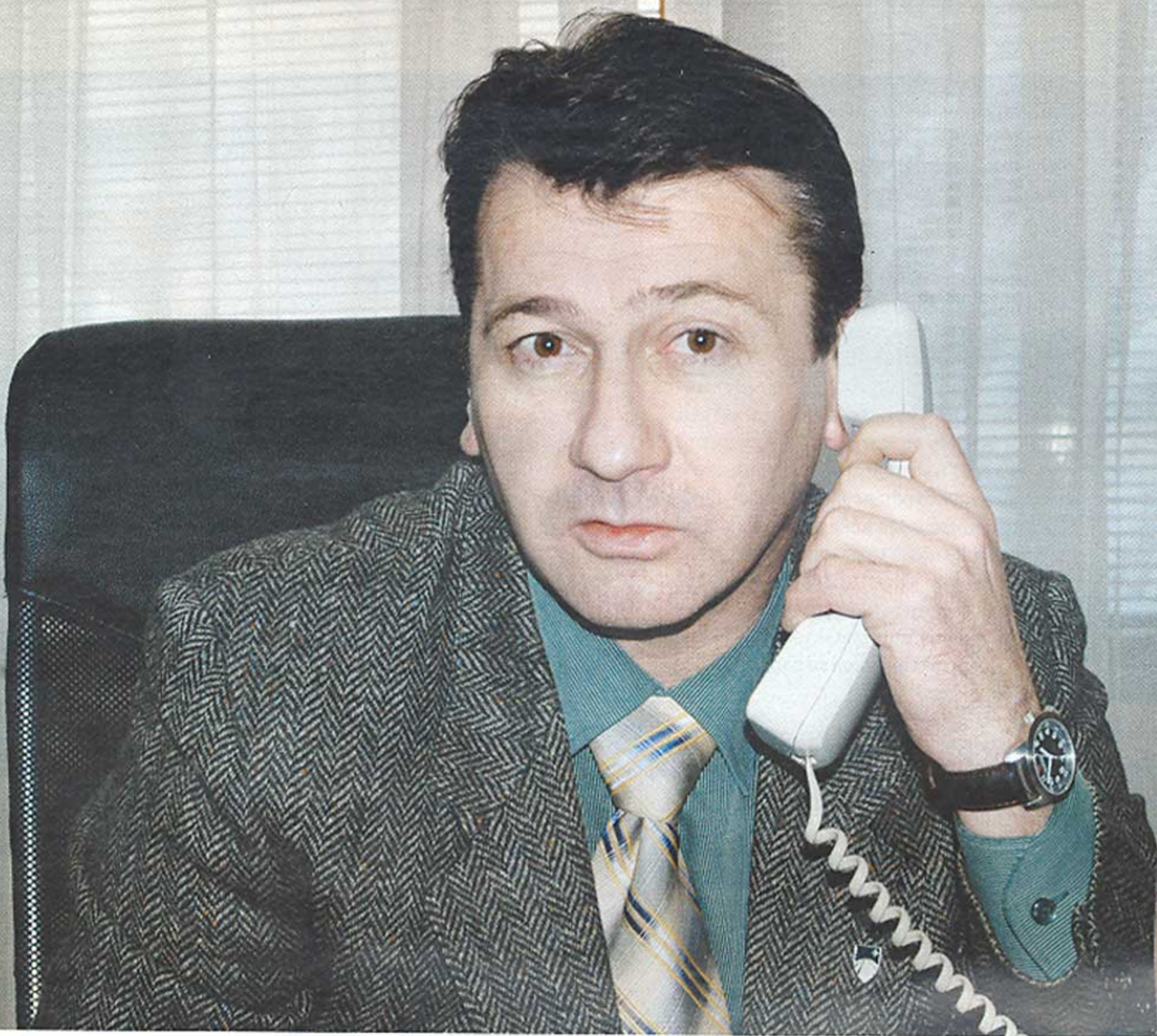
Ferhadija je završena samo u onom dijelu, ne mogu reći ni krpjenja, već održavanja, od Slatke čoše do Katedrale. To je i bilo završeno, a mi smo ove godine odredili određena sredstva po pitanju održavanja.

pravili u saradnji sa jednom eminentnom kućom „Grafo-Art“. Mislim da je trenutno naša web-stranica možda najbolja i najjača u regiji, čak uzimajući i šire područje bivše Jugoslavije, gdje vršimo ažuriranje svakodnevno. Od građevinskih je urađeno preko 140 projekta. Govorimo o tim vidljivim stvarima, pošto ima i onih nevidljivih stvari, kroz razna udruženja, nevladine organizacije, manifestacije, gdje smo se mi svakako uključili onoliko koliko smo mogli, u skladu s našim finansijskim sredstvima. Najviše je urađeno, dakle, po pitanju infrastrukture i određenih objekata. Urađen je, recimo, objekat na Mošćanici, koji je koštao oko 240.000 maraka, za smještaj romskih domicilnih porodica, gdje smo na jedan kvalitetan način riješili šest familija, a oni broje preko 30 domaćinstava. U Besarinoj Čikmi privodi se kraju kuća, odmah do Stare pra-