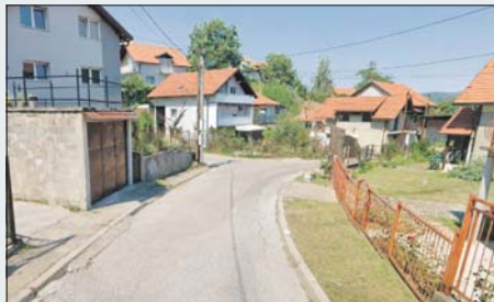
Radovi na sanaciji