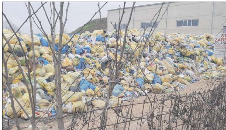
Potrebna velika sredstva

Kako bi se stanje koliko-toliko održalo i smanjili troškovi, prošle godine je na lokaciji Grabovac započeta gradnja sortirnice s ciljem razdvajanja otpada kako bi se mogla organizirati