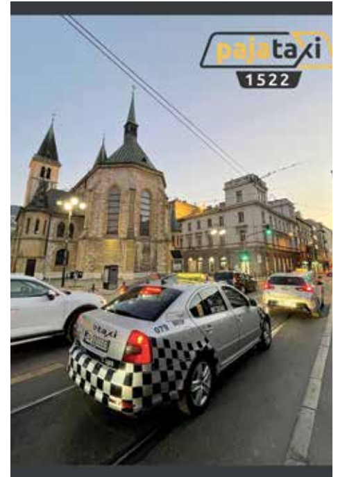
Prepoznatljivi po sivoj boji vozila

Proveli smo sve potrebne mjere zaštite sa detaljnom dezinfekcijom vozila, tako da se u našim vozilima svi građani mogu osjećati sigurnim“, poručuje Almir. Njihov slogan je „Brzo i sigurno do vaše adrese“, a u svako doba dana građani ih mogu dobiti putem broja 1522.