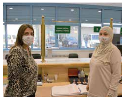
Uposlenici Općine kupili maske "Budi zlatan"