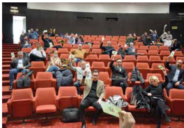
Izbor vijećnika za Gradsko vijeće