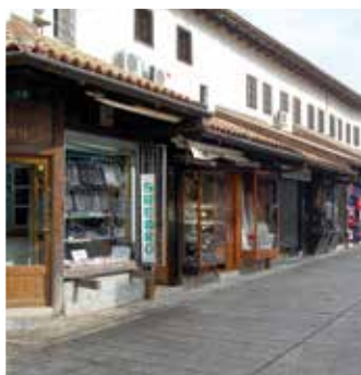
Umanjene zakupnine zanatlijama

Općinsko vijeće je raspravljalo i o rješavanju imovinsko-pravnih odnosa u predmetu izgradnje stambeno-poslovnog objekta u ulici Dženetića čikma.