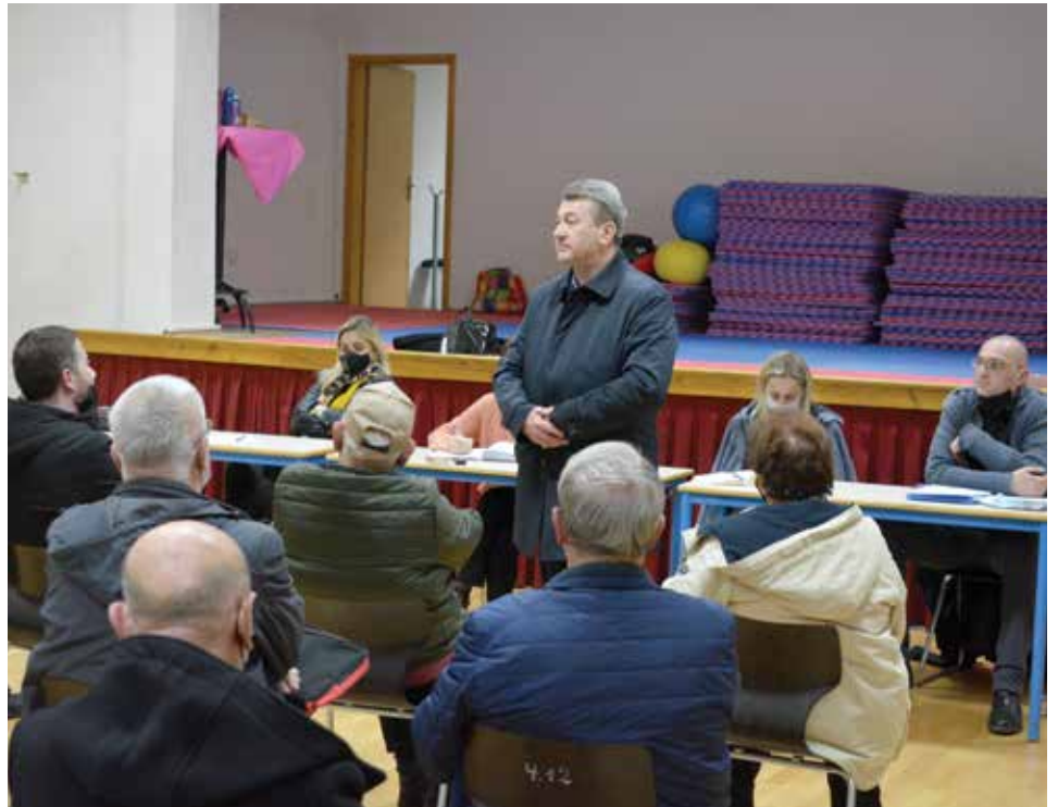
Sa građanima mjesne zajednice Vratnik