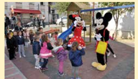
Finansirali igralište u Logavinoj

Općine Stari Grad u mjesecu maju, odnosno u Karpošu u novembru, kada se obilježava Dan Općine Karpoš.