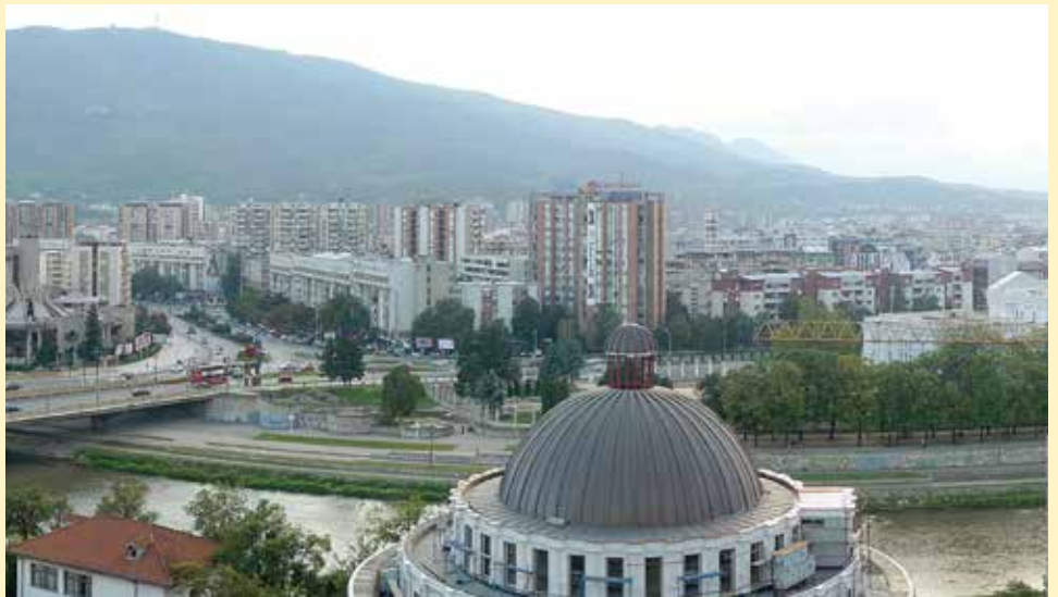
Karpoš, jedna od devet gradskih općina Skoplja

Ovaj dio Skoplja je i prije zvanično formiranja lokalne samouprave 1976. godine dugo vremena nosio naziv Karpoš, i to