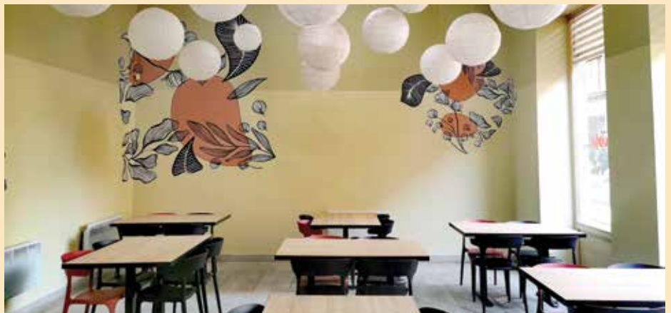
Restoran u obnovljenom prostoru u ulici Mula Mustafe Bašeskije