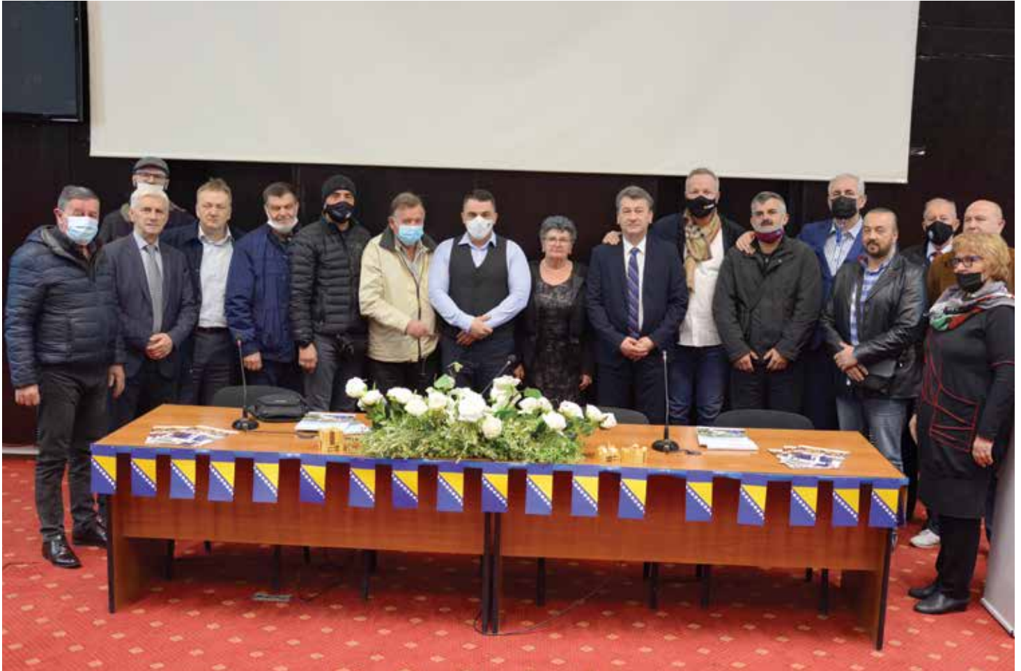
Sa predstavnicima boračkih udruženja iz Starog Grada