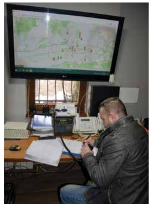
Sjedište firme u ulici Brajkovac

Almir Karišik je neko ko zadovoljstvo korisnika stavlja na prvo mjesto, a kako bi to postigao provodi anketiranje. Prema internom istraživanju koje su uradili 2019. godine čak 100% ispitanika potvrdilo je da imaju kvalitetnu uslugu, 98% ispitanika potvrdilo je da su im vozila udobna i prostrana za dodatni prtljag, te su uslugu uposlenika ocijenili sa visokih 100%.