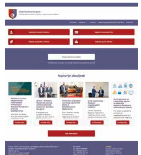
Registri Ureda za borbu protiv korupcije

“Za nas, kao jedinicu lokalne samouprave, ovo ne predstavlja ništa novo već je samo sublimacija svih naših aktivnosti koje smo do sada radili. Registar javnih nabavki je već postojao na našoj web stranici i sve je bilo transparentno, ali sada ćemo kroz jedan jedinstven program moći to da prenesemo i u Ured za borbu protiv korupcije i svi podaci će se nalaziti na jednom mjestu, pa će ih sa tehničkog aspekta biti puno lakše pratiti,” kazao je Hadžibajrić.