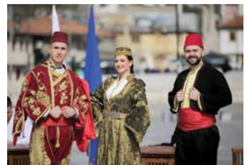
Članovi KUD "Bašćaršija"