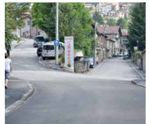
U planu je nastavak sanacije Savjet-bega Bašagića

Od projekata koji su planirani za realizaciju 2021. godine najavljeno je: rekonstrukcija Trga oslobođenja - Alija Izetbegović koji će postati jedno od najreprezentativnijih mjesta u gradu; izgradnja nove vodovodne i kanalizacione mreže kroz ulice Alifakovac, Maguda, Megara čikma i dijelove ulica Isa bega Ishakovića i Veliki Alifakovac; rekonstrukcija ulica Za beglukom i Bjelavica; sanacija ulice Braće Muhić; nastavak sanacije jedne od najdužih ulica u Starom Gradu, a to je ulica Savjet-bega Bašagića na dijelu od broja 143 do 161.