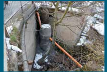
Sekundarni kanal mreže

U ulici Ramića banja uspješno su izvedeni radovi na rješavanju problema izljevanja otpadnih voda iz individualnih objekata na ulicu. Ovaj problem su građani mjesne zajednice Sedrenik delegirali kao jedan od prioriteta na području ovog naselja prilikom „Prijema građana na otvorenom“ koji su prošle godine organizovani za sve mjesne zajednice.