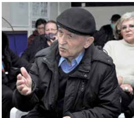
Građani iznosili prijedloge

Kako je istakao općinski načelnik mr Ibrahim Hadžibajrić na jednom od zborova, manji zahtjevi će biti odmah riješeni, ali će veliki broj zahtjeva biti prosljeđen drugim, nadležnim javnim preduzećima i organima. „Obišli smo sve naše mjesne zajednice i posjetio nas je veliki broj građana. Dosta toga ćemo odmah riješiti, kao što je postavljanje kanti za otpad, krčenje šiblja, sječa stabala, zamjena oštećene rasvjete. Ostale zahtjeve ćemo rješavati u narednom periodu, ali u skladu sa budžetskim mogućnostima,“ kazao je načelnik Hadžibajrić.