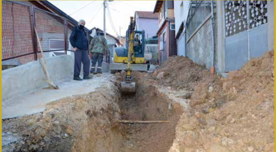
U toku zamjena vodovodnih instalacija

Izvođač radova firma 'Bujice' d.o.o. iz Konjica nastavila je sa radovima koji su predviđeni projektom. Sa firmom KJKP 'Vodovod i kanalizacija' usaglašena je trasa polaganja vodovodnih cijevi, te je dogovoreno da zbog položaja novog cjevovoda nema potrebe za polaganjem