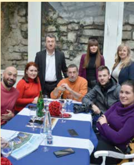
Sa pripadnicima "sedme sile"

Jubilarnoj nagradi za životno djelo u prethodnim godinama prethodila su dva priznanja za Najnačelnika u BiH, priznanje za Evropskog načelnika FBiH, Načelnika decenije u BiH, Večernjakov pečat, te priznanje za Evropskog najnačelnika decenije koje mu je pripalo prije dvije godine.