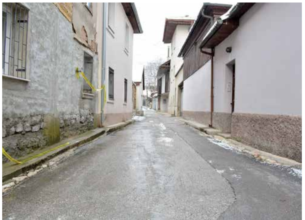
Sanirat će se ulica Arapova, uz rekonstrukciju kanalizacione mreže

Najviše pažnje bit će posvećeno infrastrukturi, pa su u 2021. godini u planu: rekonstrukcija kanalizacione mreže u ulici Arapova; rekonstrukcija kanalizacione mreže u ulici Mačkareva uz sanaciju kaldrme u gornjem dijelu ulice i asfaltiranje donjeg dijela; rekonstrukcija dijela ulice Višegradska kapija; sanacija ulice Nafije Sarajlić i Poddžephana; sanacija kaldrme u ulici Mehmedagina itd. Većina projekata zahtijeva ogromna finansijska sredstva, koje Općina Stari Grad ne može sama osigurati. Dogovoreno je da u nekim od projekata finansijski učestvuju Ministarstvo za saobraćaj Kantona Sarajevo i Direkcija za puteve Kantona Sarajevo.