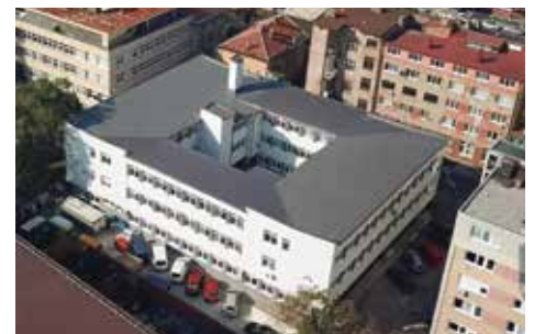
Dom zdravlja Stari Grad

Mirsada Smajić, ovlaštena za vršenje poslova iz nadležnosti općinskog načelnika i Dženan Brkanić, direktor Kantonalne uprave civilne zaštite Kantona Sarajevo, potpisali su početkom augusta ove godine tri značajna ugovora o nabavci opreme koja će služiti za opremanje općinskih službi za medicinsku