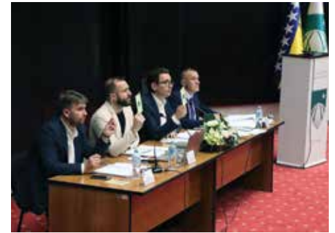
Odluka o uštedama

je istakao da razdvaja ličnost i funkciju općinskog načelnika, te da je činjenica da Općina Stari Grad Sarajevo, građani i postupci trpe zbog ovakve situacije. “Sugerisao sam u više navrata da bi načelnik trebao dati ostavku. Smatram da se svi političari trebaju ponašati odgovorno i ukoliko njihov rad, ili drugi vid djelovanja, ugrožava ili opstruiše normalno funkcionisanje institucija, moraju pokazati političku odgovornost za svoje postupke. Stoga, pozivam načelnika da podnese ostavku,” izjavio je predsjedavajući Škaljić.