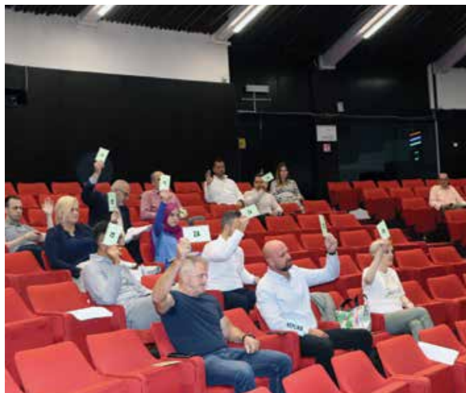
Imenovani članovi OIK-a Stari Grad