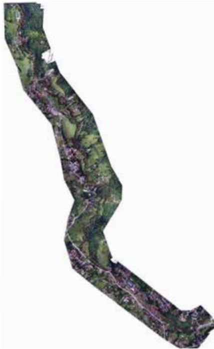
Elaborat zaštite otvorenog toka rijeke Moščanice

Skupština Kantona Sarajevo usvojila je na osmoj radnoj sjednici održanoj 03.07.2023. godine Odluku o izmjenama i dopuni Odluke o zaštiti planinskih izvorišta vode za piće sarajevskog vodovodnog sistema i dijela otvorenog toka rijeke Moščanice. Ovim izmjenama bitno se utiče na određena urbanistička rješenja i potrebe Općine Stari Grad Sarajevo u oblasti prostornog uređenja i urbanizma, te otvara mogućnost za legalizaciju objekata sagrađenih na navedenom lokalitetu.