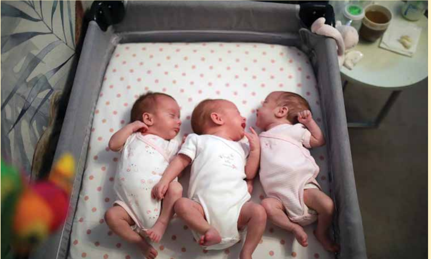
Naknade - čestitke porodiljama dodjeljuju se više od 20 godina

Uvećane naknade za porodilje, od 500 – 1.500 KM • Više od million KM dodijeljeno porodiljama u posljednjih 10 godina • Vijeće jednoglasno usvojilo novi Pravilnik