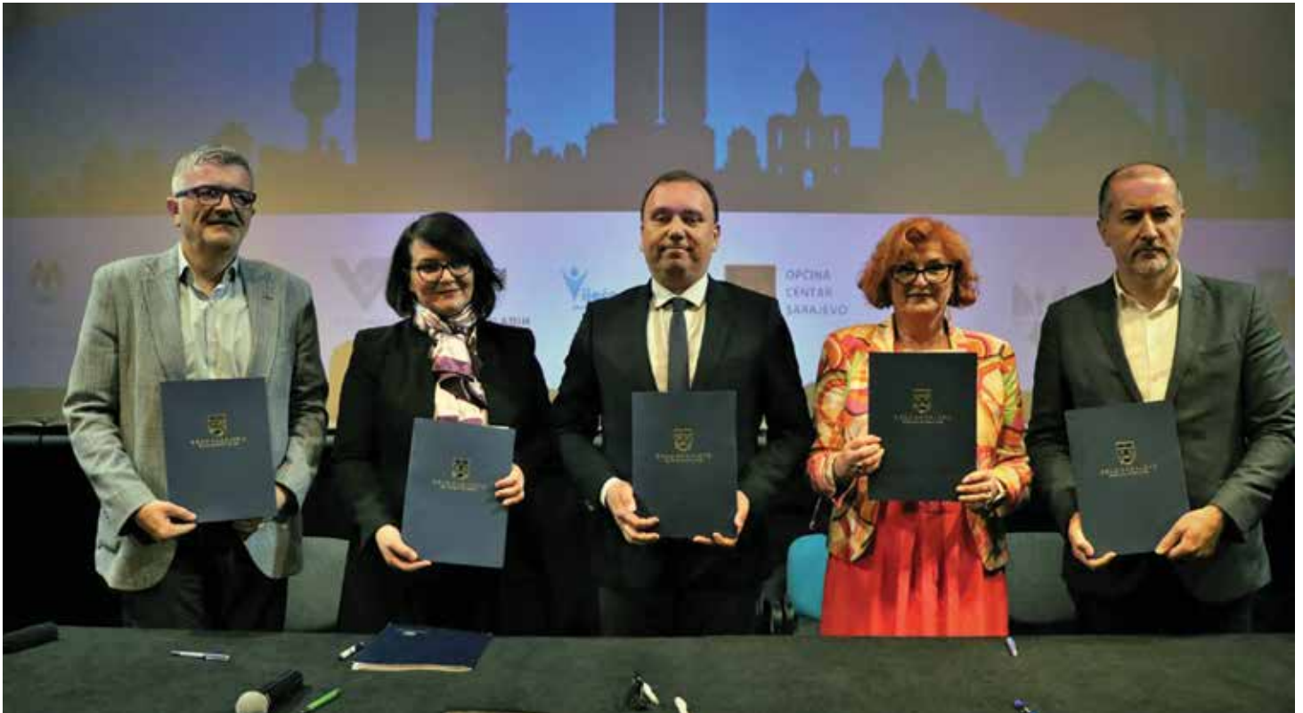
Sa potpisivanja Sporazuma o saradnji između Grada Sarajeva i gradskih općina

Općinsko vijeće Stari Grad Sarajevo u februaru ove godine uputilo je zaključak Skupštini Kantona Sarajevo i Ministarstvu za komunalnu privredu, infrastrukturu, prostorno uređenje, građenje i zaštitu okoliša KS zaključak kojim se traži hitno poduzimanje aktivnosti za izmjenu Odluke o zaštiti planinskih izvora vode za piće sarajevskog vodovodnog sistema i dijela otvorenog toka rijeke Mošćanice donesene 1997. godine ("Službene novine KS", br:22/97). Ovaj zaključak su vijećnici jednoglasno usvojili na 22. redovnoj sjednici Općinskog vijeća Stari Grad održanoj 26.01.2023. godine.