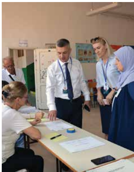
Na jednom od biračkih mjesta

Prema podacima Komisije za provođenje opoziva općinskog načelnika, na referendumu je glasalo 4.864 građana od ukupno 36.193 registrovanih. Važećih glasačkih listića je bilo 4.841, te 53 nevažeća listića.