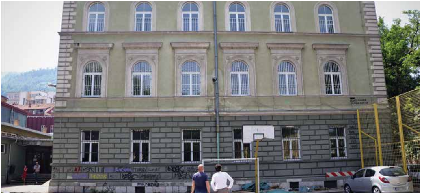
OŠ "Edhem Mulabdić" jedna od najstarijih odgojno-obrazovnih institucija u Kantonu Sarajevo

Bolji uslovi u OŠ "Edhem Mulabdić" • Sanirane i asfaltirane 4 ulice, radi se u još dvije • Stabilizacija tla u mjesnoj zajednici Toka-Džeka