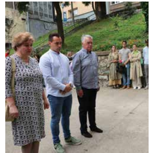
Počast žrtvama u Dženetića čikmi