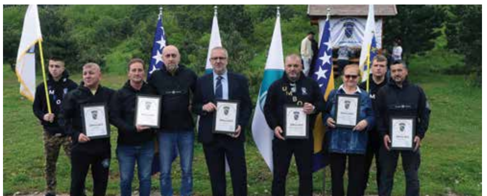
Na Trebeviću obilježen Dan maloljetnog borca