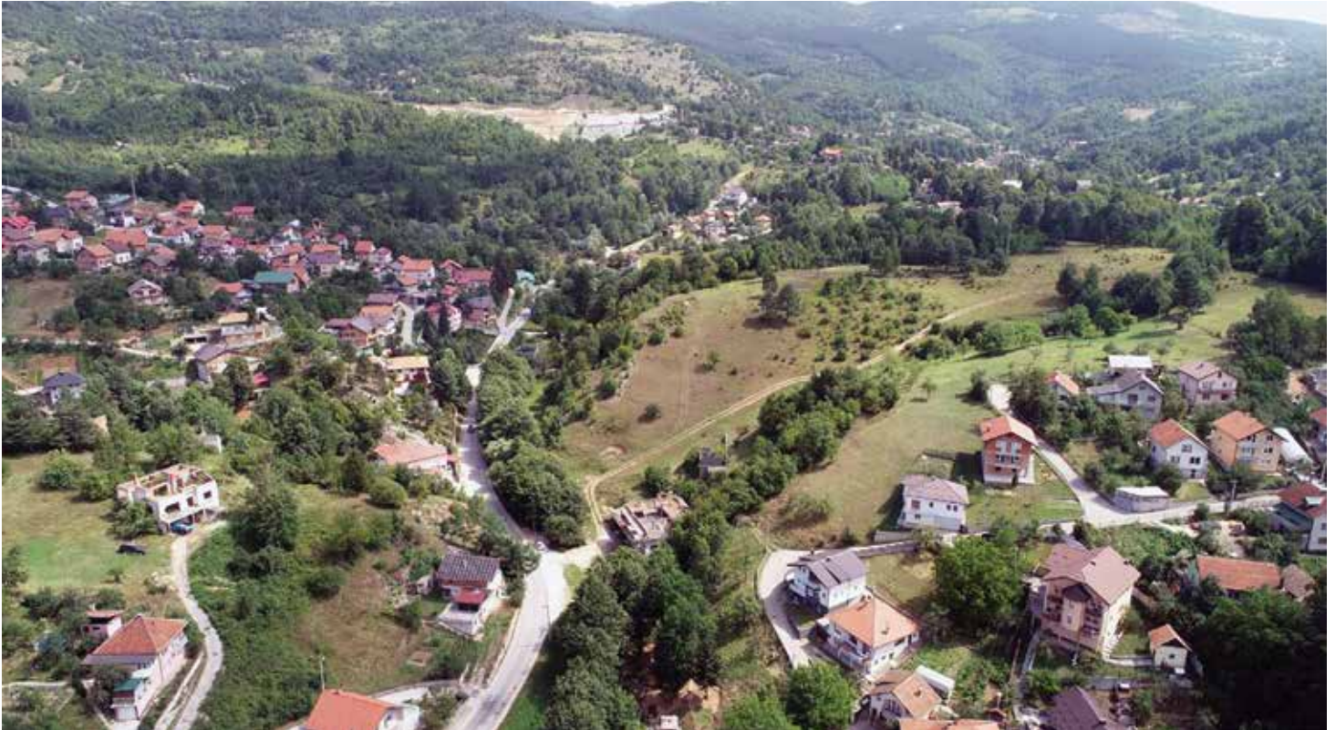
Otvorena mogućnost za legalizaciju objekata u donjem toku rijeke Moščanice

13.000 KM za nabavku opreme koja će omogućiti bolju zaštitu od požara, dok će „Klico trans gradnja“ d.o.o. Sarajevo dobiti finansijska sredstva u iznosu do 4.000 KM za nabavku opreme za zaštitu i spašavanje od rušenja.