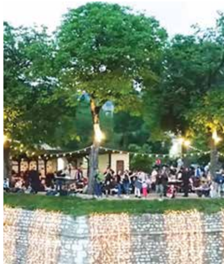
Gosti uživali na Žutoj tabiji

Festival, koji je prepoznat kao novi važan dio turističke ponude grada, organizuju U.G. ZUP Bašćaršija i Turistička zajednica Kantona Sarajevo, a partner projekta je i Općina Stari Grad Sarajevo koja je i ovog ljeta domaćin brojnim domaćim i stranim turistima koji uživaju bogatoj kulturnoj baštini, gastronomiji, ali i kulturnim i zabavnim sadržajima.