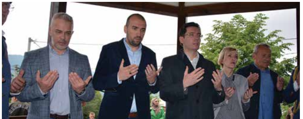
Sa obilježavanja godišnjice formiranja Druge brdske brigade