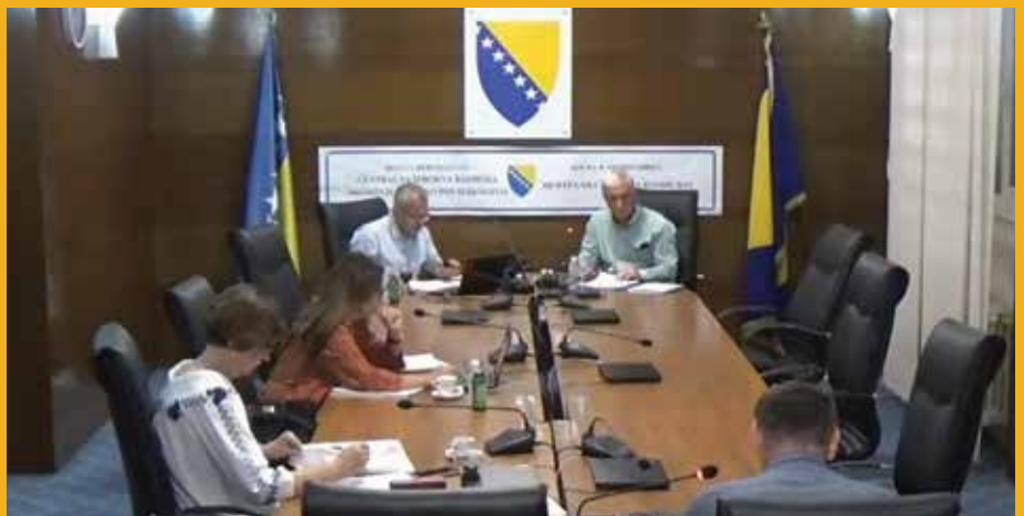
Sa 58. sjednice CIK-a BiH

Nakon pravosnažnosti odluke, u skladu sa članom 14.3 Izbornog zakona BiH, Centralna izborna komisija BiH donosi odluku