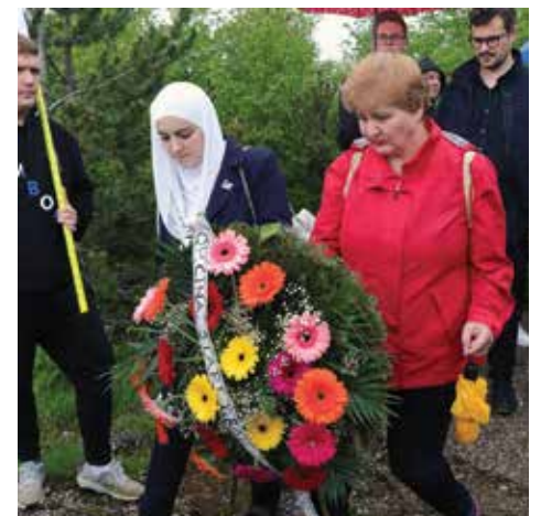
Položen vijenac na Trebeviću