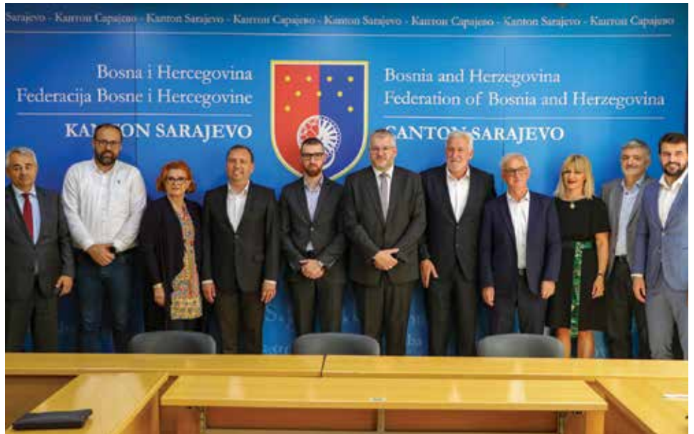
Sa potpisivanja sporazuma u Ministarstvu privrede Kantona Sarajevo

Prema sporazumu, Ministarstvo privrede Kantona Sarajevo sufinansirat će projekat iznosom od 200.000 KM, a Općina Stari Grad se obavezala da će osigurati preostala novčana sredstva potrebna za realizaciju projekta, pribaviti potrebna odobrenja i saglasnosti i provesti postupak izbora najpovoljnijeg ponuđača za izvođenje radova. Stručni nadzor nad realizacijom projekta vršit će Zavod za izgradnju KS.