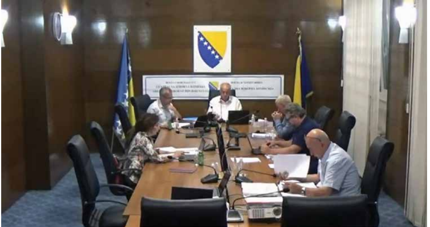
59. sjednica Centralne izborne komisije Bosne i Hercegovine

CIK BiH usvojio Uputstvo o rokovima izbornih aktivnosti za održavanje prijevremenih izbora za načelnika Općine Stari Grad ● Ukupan broj upisanih birača je 36.237 ● Budžet za održavanje prijevremenih izbora 89.500 KM