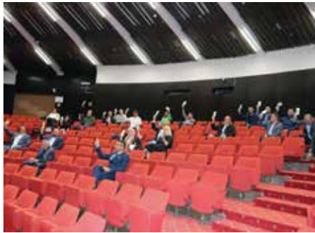
Vijećnici glasali za pokretanje opoziva