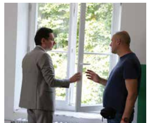
Nova stolarija u OŠ "Edhem Mulabdić"