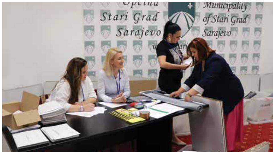
Komisija za provođenje postupka opoziva provela sve aktivnosti

Komisija je naglasila da se cijeli proces odvijao u skladu s odredbama Uputstva za provođenje postupka opoziva općinskog načelnika, te je proveden transparentno i u skladu sa zakonskom regulativom kako bi se osigurala tačnost i vjerodostojnost rezultata referenduma.