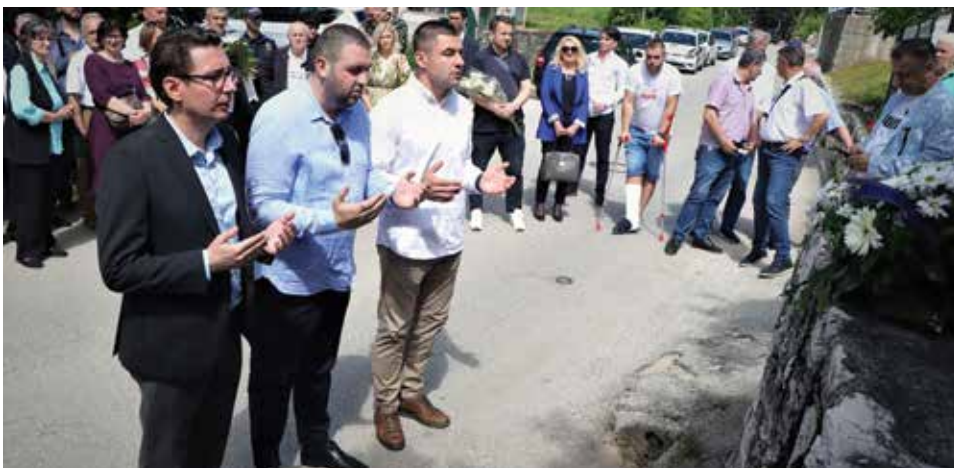
Godišnjica stradanja djece iz porodice Bojadži