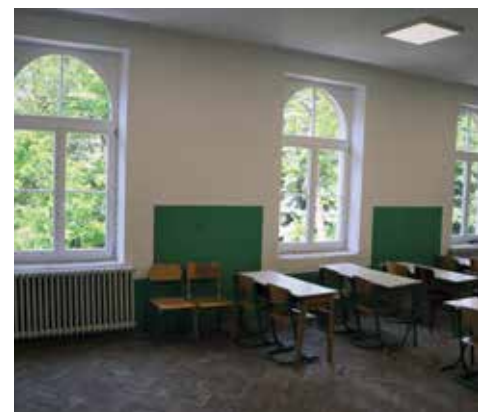
Projekat vrijedan pola miliona KM

Kako bi objekat škole bio u potpunosti završen preostalo je još da se uradi tekuće održavanje fasade, a Općina Stari Grad je putem Službe za lokalni razvoj i poslove mjesnih zajednica osigurala potrebnu tehničku dokumentaciju, te za tu fazu projekta ishodovala kod Zavoda za zaštitu spomenika FBiH, pri Ministarstvu kulture i sporta FBiH, odobrenje za radove.