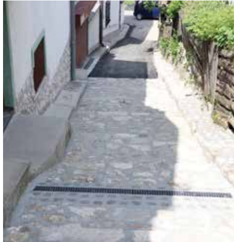
Bistrik gornja čikma

Kompletan projekat uključivao je novu odvodnju za oborinske vode, kao i ugradnju slivnika, linijskih rešetki, te priključaka novoizgrađene oborinske kanalizacije na postojeću. Nakon tih radova urađeno je postavljanje nove kaldrme na dionici dužine oko 35 metara. Projekat je financiran iz budžeta Općine Stari Grad iznosom oko 25.000 KM.