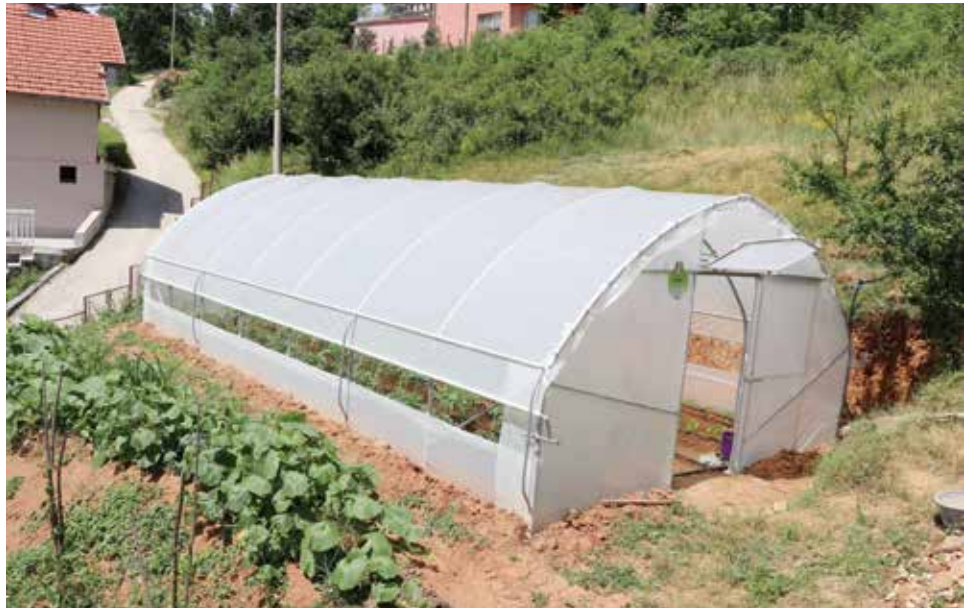
Ove godine dodijeljena 33 plastenika

„Ja se bavim poljoprivredom cijeli život pomalo, a intenzivnije od 2015. godine otkada sam u penziji. Pored zemljoradnje, bavim se pomalo i pčelarstvom. Već nekoliko godina ovdje uzgajam i biljku facelija. To je medonosno bilje kojim se hrane pčele. Ona cvjeta 45 dana i kada nestane trave i cvijeta na livadama, pčele se ovdje hrane,“ pojašnjava ovaj vrijedni domaćin. Njegova snaha Selma, koja je u sedmom mjesecu trudnoće, u ime cijele porodice nedavno je uputila pismo zahvalnosti općinskom načelniku za uručeni plastenik. „To je najmanje što smo mi kao porodica mogli uraditi jer ovaj plastenik nam puno znači. Ovdje uzgajamo prirodno povrće za našu porodicu, organsko. Od velikog je značaja kada mi građani imamo podršku svoje općine,“ istakla je Selma.