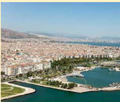
Općina Karşıyaka se nalazi na obalama Egejskog mora