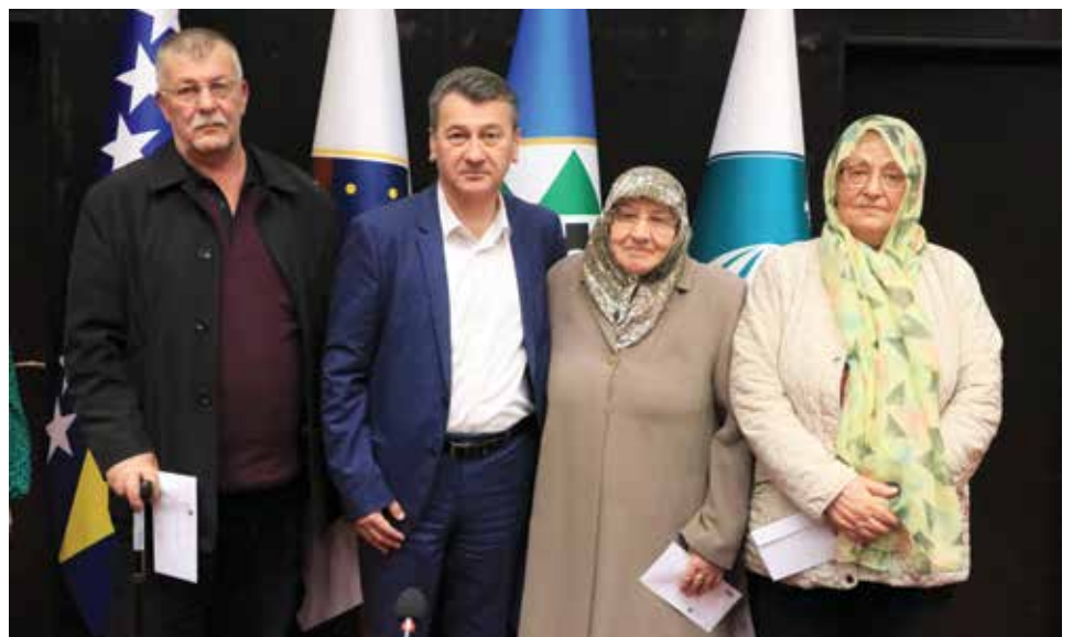
Sa podijele hedija boračkoj populaciji