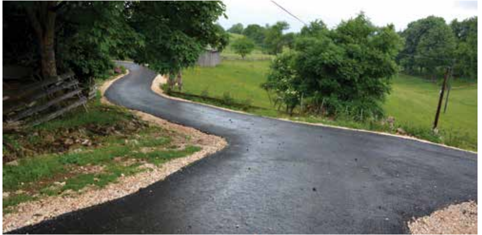
Dva kilometra novog asfalta za stanovnike Gornjeg Bioska

Općina Stari Grad Sarajevo uključila se prošle godine u program „Podijeljene općine“ koji je zasnovan na međuentitetskoj saradnji jedinica lokalne samouprave, a implementira ga Vijeće Evrope u saradnji sa odabranim općinama iz FBiH i RS. Općina Stari Grad je u okviru ovog programa uradila projektni prijedlog pod nazivom „Zajedno za bolje sutra“, kojim je aplicirano prema Vijeću Evrope. Projekat je odobren, a ukupna dužina trase puta Gornje Biosko koja je sanirana ovim projektom iznosi oko 420 metara. Vrijednost investicije je oko 40.000 KM. Prva faza radova završena je prošle godine i tada je rekonstruisano i asfaltirano ukupno 220 metara dionice puta. U junu ove godine su završeni radovi i na preostalim 200 metara puta.