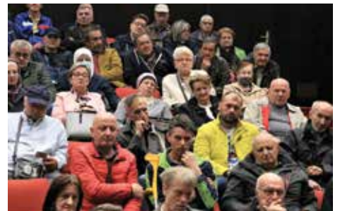
Hedije za 100 porodica