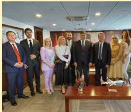
Delegacija Općine Stari Grad sa rukovodstvom Općine Karşıyaka