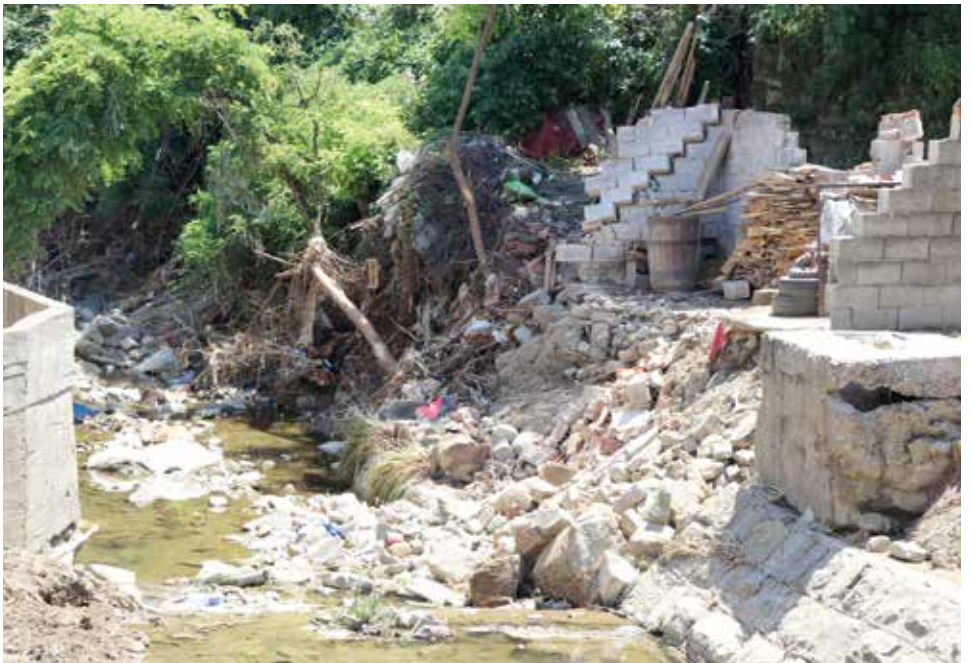
Poplavljeno 400 stambenih objekata

će se oporaviti brže, a ovakve štete će se teško nadoknaditi," dodao je načelnik Hrustanović.