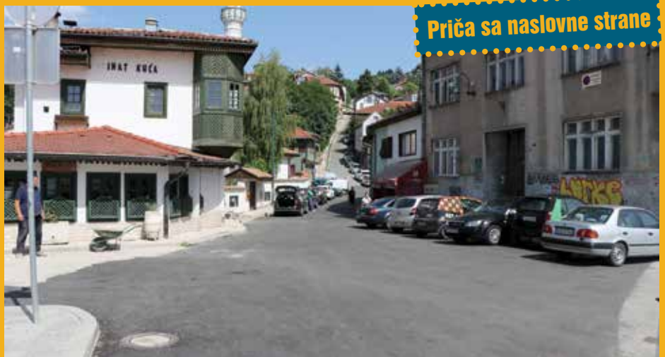
Priča sa naslovne strane

„Godinama smo se patili, fekalije su ulazile u stambene objekte. Našim problemima će konačno doći kraj“, kazala je Emina.