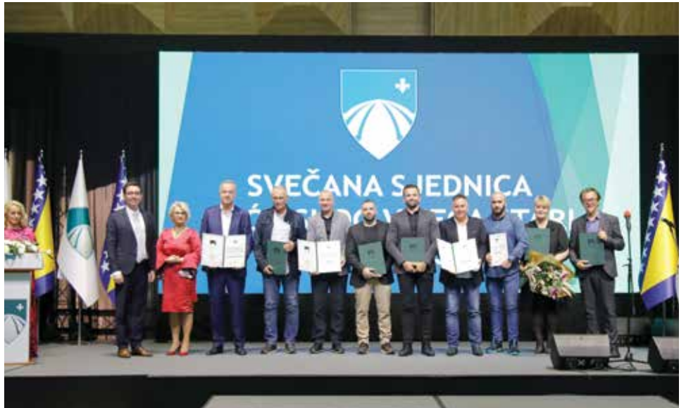
Dobitnici općinskih priznanja i povelja

„Ove godine Dan Općine i ramazanski Bajram poklapaju se istog dana. Postoji velika simbolika u tome jer je 02. maja prije 30 godina odbranjen Stari Grad i Sarajevo, a istog dana bio je i Kurban bajram. Nažalost i nakon toliko godina prisutno je mnogo rušilačkih i remetilačkih faktora, koji bi željeli da BiH nestane. Na njihovu žalost, a na našu radost, Bosna i Hercegovina je konstanta i ona će ostati nepromijenjena i ova država će opstati“, naglasio je načelnik Hadžibajrić.