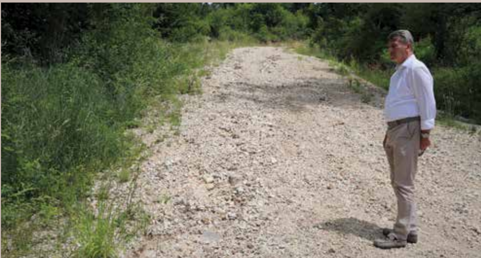
Načelnik Hadžibajrić obišao teren

Projekat je vrijedan oko 130.000 KM i u cjelosti se finansira iz budžeta Općine Stari Grad Sarajevo za 2022. godinu. Na planiranoj dionici dužine od 400 metara uradit će se skidanje djelimičnih i oštećenih asfaltnih slojeva, proširenje, tamponiranje i odvodnja. Nakon tih radova bit će asfaltirana cijela dionica i time znatno olakšana putna komunikacija za građane Faletića.