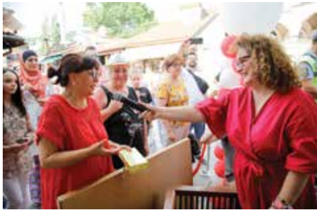
Brojni pokloni za građane