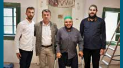
Načelnik Hadžibajrić sa članovima džematskog odbora

U obilasku Buzadži hadži Jahjine džamije: Sanirani krov, munara, ograda i instalacije