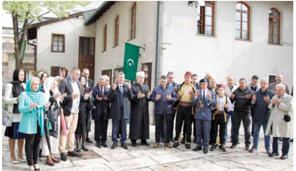
U haremu Begove džamije