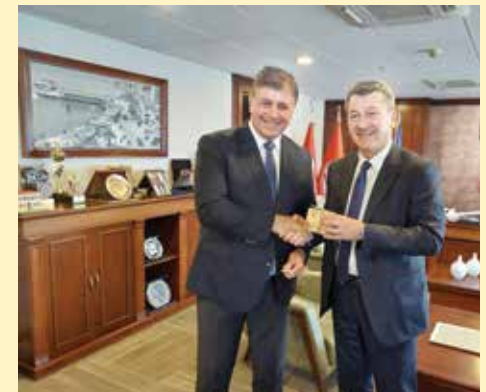
Nezaobilazno uručenje općinskog suvenirira „Sarajevska kocka“