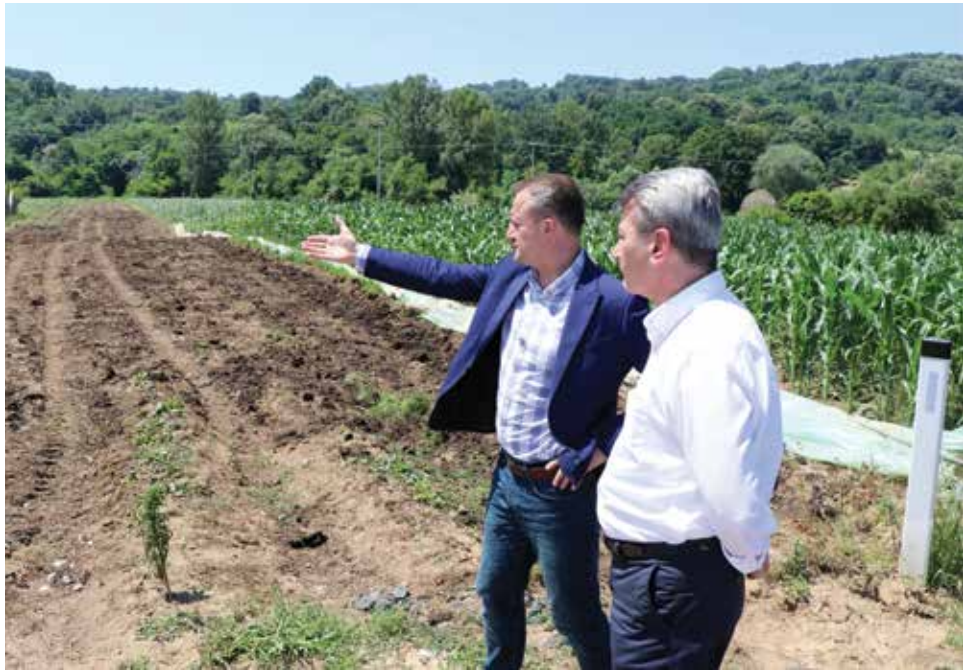
Poplave su izazvale i velike štete poljoprivrednicima

„U Čeliću imamo dvije firme koje zapošljavaju 150-200 ljudi, a jedna od njih radi i za Iku. Njima su se u poplavi oštetile mašine koje vrijede pola miliona maraka. Poljoprivreda i stambeni objekti