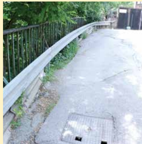
Klizište na Trčivodama

“U ovoj godini smo za sanaciju klizišta na području Kantona Sarajevo izdvojili oko milion konvertibilnih maraka. Svaka općina je imala priliku u januaru i februaru da aplicira sa najprioritetnijim klizištima, a prvi korak i sporazum postignut je ovdje u Općini Stari Grad, gdje smo prošlog mjeseca potpisali sporazume za 6 klizišta, a danas i za sedmo. Nakon toga su se i ostale općine ugledale na to i prihvatile ove iste uslove. U Kantonu Sarajevo ima oko 1000 aktivnih klizišta i najbitnije je da smo učinili ovaj prvi korak i pokrenuli projekte,” izjavila je direktorica Barlov.