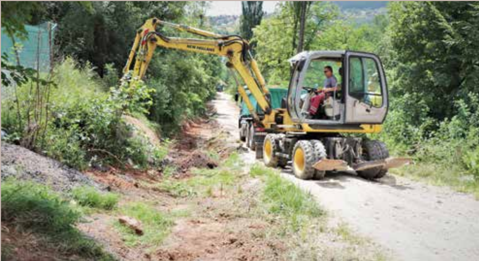
Sanacija 400 metara ulice

U mjesnoj zajednici Mošćanica u toku je sanacija dijela ulice Faletići u dužini od 400 metara. Radove u ovoj ulici od raskrsnice sa ulicom Baruthana do ukrštanja ulica Donje Biosko i Faletići obišao je i općinski načelnik mr. Ibrahim Hadžibajrić.