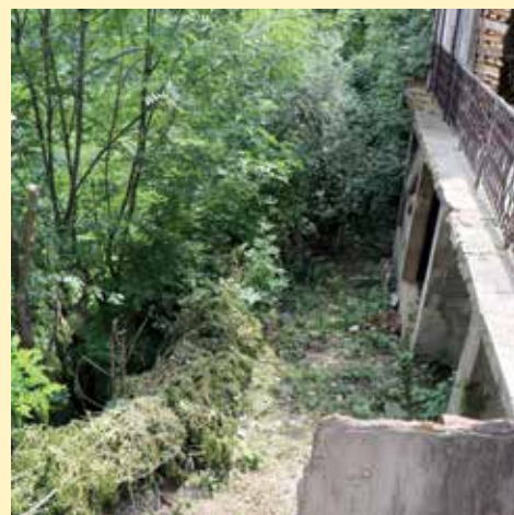
Za sanaciju klizišta na Trčivodama izdvojeno 64.000 KM