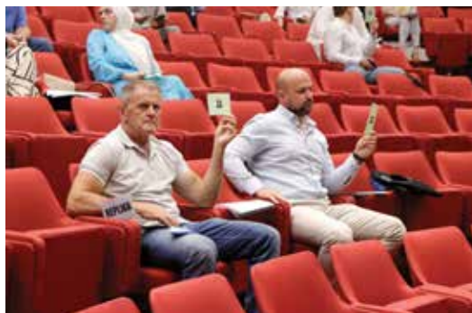
Sa sjednice Općinskog vijeća Stari Grad

Općinsko vijeće Stari Grad nije prihvatilo da se na Dnevni red ove sjednice uvrsti prijedlog Odluke o osnivanju i djelokrugu službi za upravu Općine Stari Grad Sarajevo, čime su se vijećnici direktno oglašili na mjeru koju je donio glavni upravni inspektor Ministarstva pravde i uprave KS. Ova odluka je mjerom koju je propisao glavni upravni inspektor već