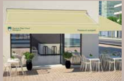
Unificiranje starogradske jezgre

Općina Stari Grad Sarajevo počela je proces unificiranja gradske jezgre uvođenjem jednoobraznih tendi jedinstvenog izgleda, a rokovi za njihovo postavljanje usklađeni su prema zonama u kojim poslovni subjekti djeluju.