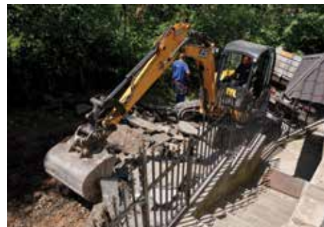
Sanacija 500 metara ulice

„Živim ovdje od 1961. godine i sjećam se da je prije ovdje bio samo uski put. Davno nekada je asfaltirano, prošlo je više od 30 godina sigurno. Ovo je veoma prometna ulica, svi se grijemo na drva, puno kamiona ovuda prolazi i cesta je skroz uništena. Sanacija ove ulice puno nam svima znači“, izjavio je Delalić.