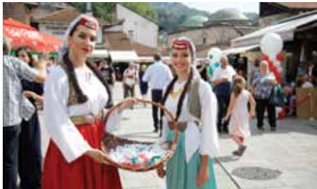
Članice KUD Bašćaršija građanima dijelile Cvijet Srebrenice