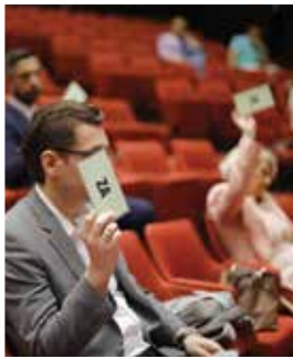
Usvojene izmjene Odluke o komunalnim taksama

Izmjenama Odluke o komunalnim taksama koje su usvojene fizičkim licima se takse umanjuju od 66-77%. Primjera radi, fizička lica koja su važećom odlukom trebala plaćati između 450-600 KM za poslovno sjedište, u zavisnosti od zone u kojoj se nalazi, novim izmjenama plaćat će od 100-200 KM, a za izdvojene poslovne jedinice od 40 do 100 KM, umjesto dosadašnjih 200 do 300 KM.