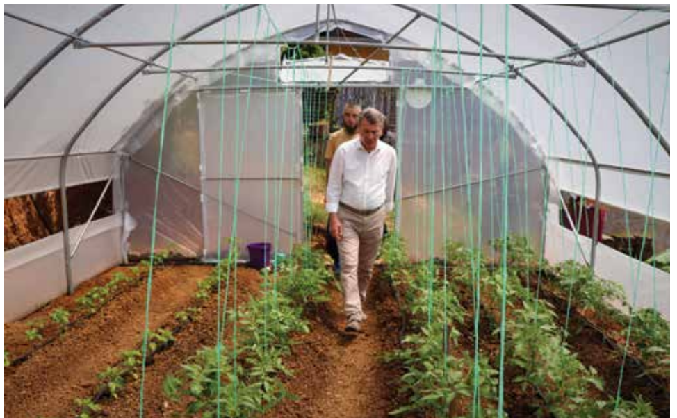
U ovoj godini za plastenike izdvojeno 87.500 KM

i skoro 9.000 sadnica paprike. Ovaj sadni materijal dodijeljen je kako novim, tako i ranijim korisnicima plastenika u Starom Gradu. Osim toga, poljoprivrednicima je ove godine isporučeno oko 3.500 kg sjemenskog krompira i 200 kg sjemenskog luka.