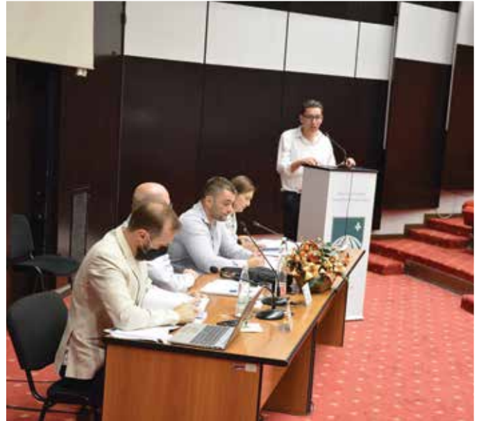
Zaštita novoasfaltiranih saobraćajnica u Starom Gradu

Osim toga, na sjednici je usvojen Izvještaj o realizaciji Budžeta Općine Stari Grad za period 01-01-30.06.2021. godine. Također je izglasan i Prijedlog o izmjenama i dopunama Pravilnika o stipendiranju nadarenih učenika i studenata.