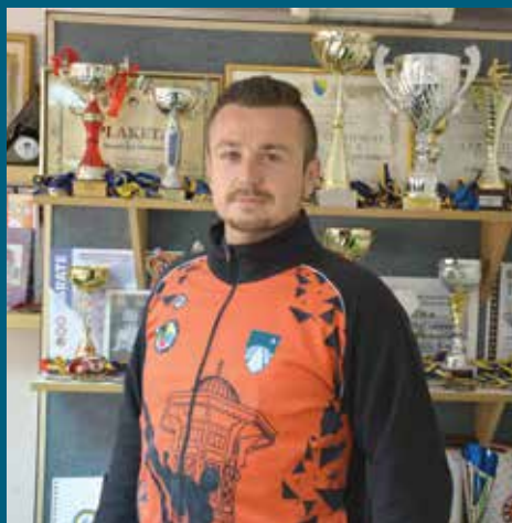
Miralem Mandžuka osvajač evropskih i svjetskih medalja