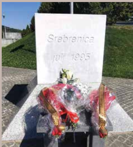
Potočari, mjesto sjećanja i opomene

joj se pridružilo 40-ak lokalnih zajednica iz FBiH. No, samo su Stari Grad i Grad Tuzla izdvojili po 50.000 KM, dok su iznosi ostalih općina i gradova bili manji. Načelnik Hadžibajrić najavio je prilikom posjete da će Općina Stari Grad do kraja ove godine izdvojiti još 50.000 KM za podršku Muzeju genocida u Potočarima. Inače, tu inicijativu iznio je na 7. sjednici