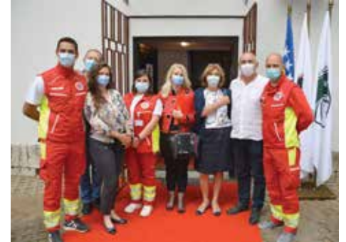
Punkt radi 24 sata

Otvaranju je prisustvovao i ministar zdravstva KS Haris Vranić koji je istakao da je ovo veoma značajan korak u povezivanju lokalne zajednice sa sistemom zdravstva. „Zahvaljujem