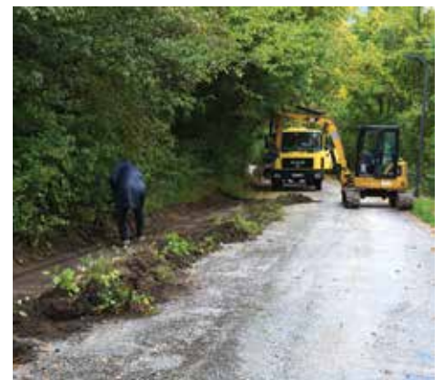
Mašine na terenu

Radovi na ovom projektu počeli su u ponedjeljak, 04. oktobra ove godine i to iz pravca Darive. Uklanja se oštećeni asfalt, nakon čega će uslijediti tamponiranje i priprema za novo asfaltiranje.