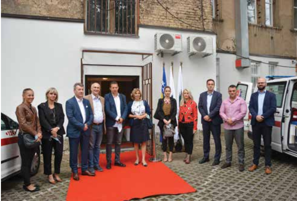
Sa otvaranja punkta Hitne pomoći na ulazu iz ulice Tekija čikma

Općina osigurala prostorije za rad • Građanima na raspolaganju 24 sata • Punkt ima prilaz iz ulice Tekija čikma i ulice Obala Kulina bana 24