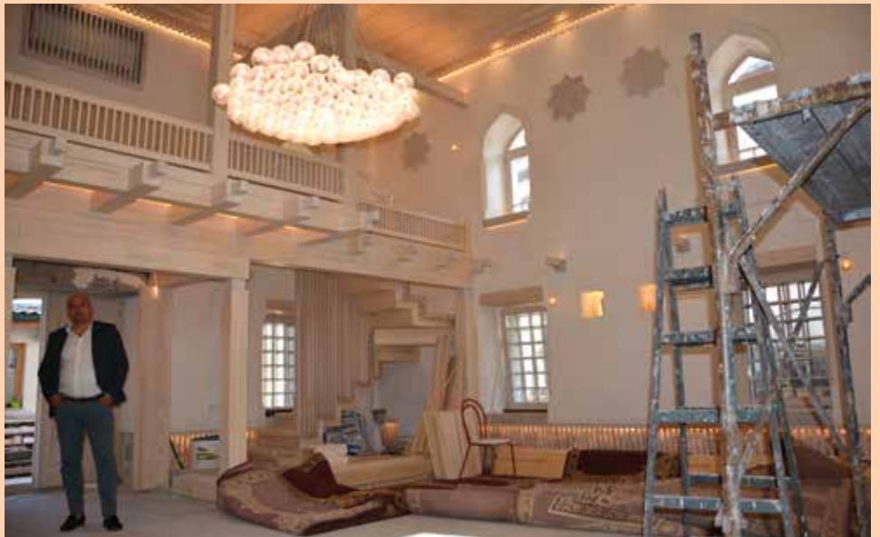
Sanacija unutrašnjosti Lubine džamije