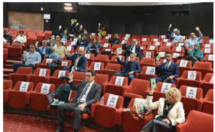
Dobra saradnja vijećnika i općinskih službi