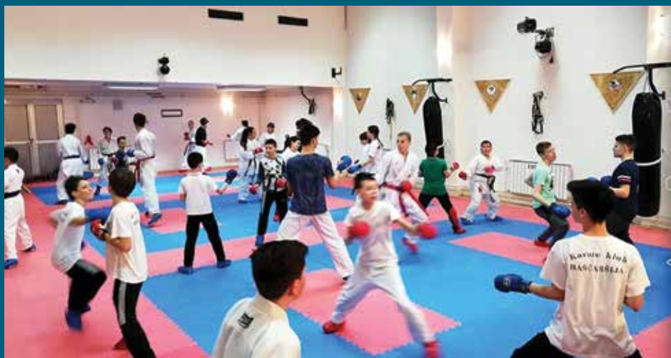
Sa jednog od treninga