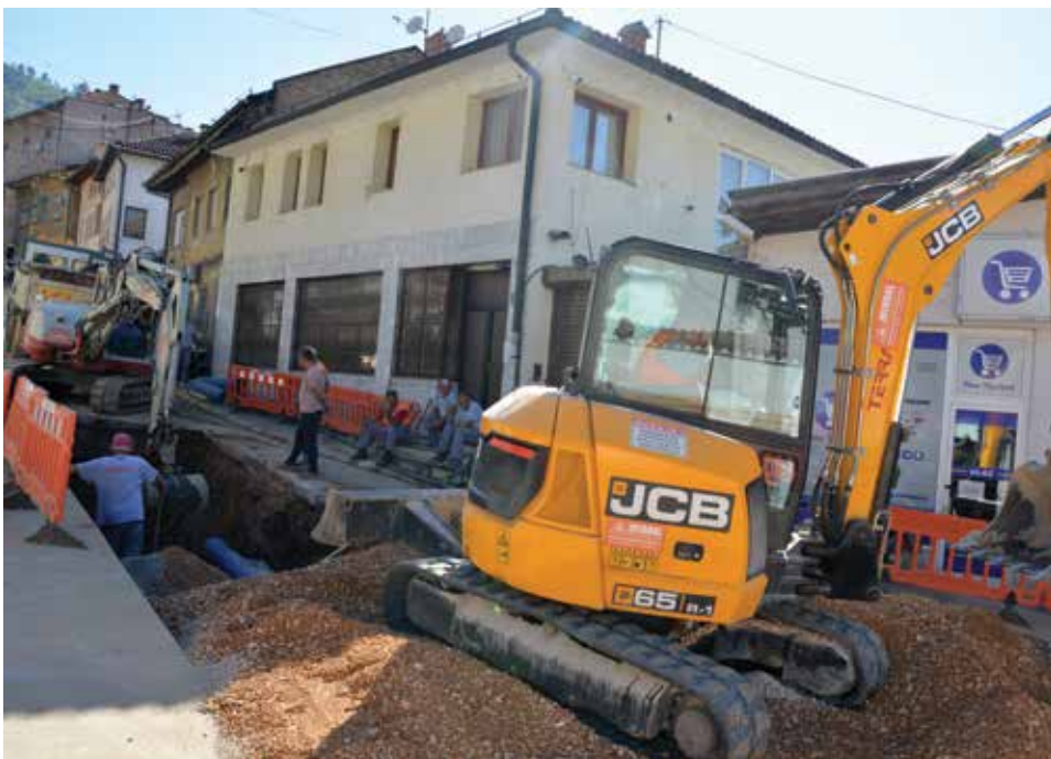
Zamjena vodovodne mreže, oborinske i fekalne kanalizacije

Postojeća kanalizaciona mreža u dijelu ulice Veliki Alifakovac je tehnički neispravno izvedena, dok u ulicama Alifakovac, Maguda i Megara nema položene kanalizacione mreže odgovarajućeg kapaciteta i kvaliteta. Mreža je za vrijeme padavina opterećena većim količinama vode iz potoka, kao i mješovitim otpadnim vodama pa dolazi do kvarova i izljevanja. Što se tiče vodovodne mreže, postojeće instalacije su veoma loše i često dolazi do pucanja. Sve ovo stvara velike probleme stanovnicima pomenutih ulica, a usljed čestih kvarova potpuno je uništen i asfalt na ulicama.