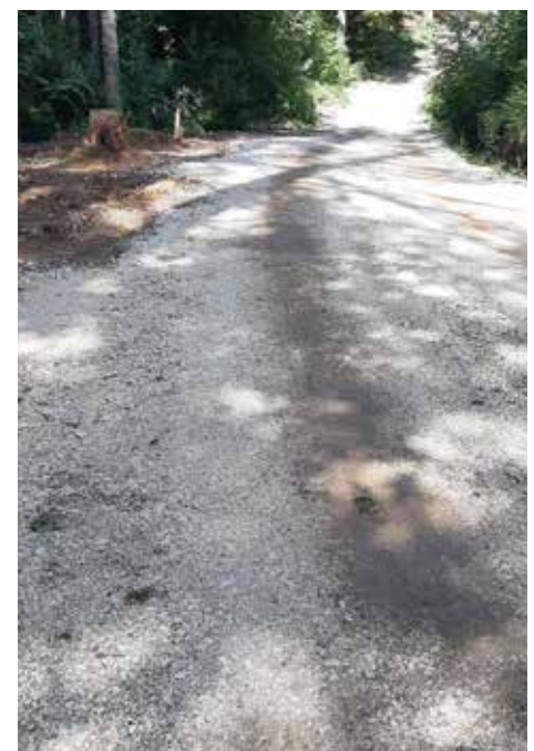
Makadamski put Ravne