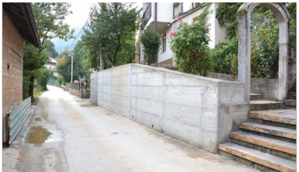
Jarčedoli - zaustavljeno obrušavanje na ulicu