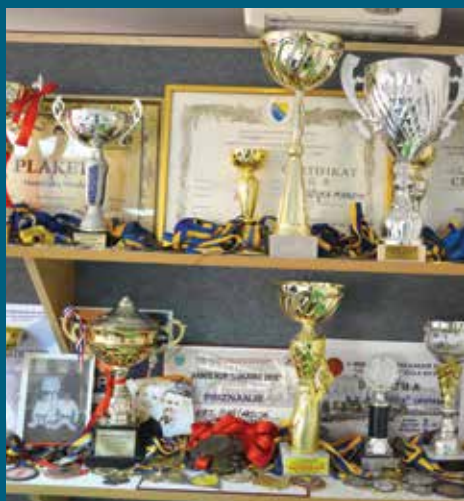
Osvojene brojne medalje

takmičenja i ostvarivanja rezultata“ kazao je. Način treninga danas se u svijetu mnogo promijenio, a posebno je naglašen pristup prema djeci: „Sve je fleksibilnije, djeca se u školu karatea upisuju sa 4-5 godina, zato karate počinjemo sa igrom kao bijeli pojas, a završavamo se majstorskim zvanjem - crni pojas. Također je važno napomenuti da se karate može vježbati i u trećoj dobi, kao način održavanja forme, koncentracije i kondicije,“ dodaje Mandžuka.