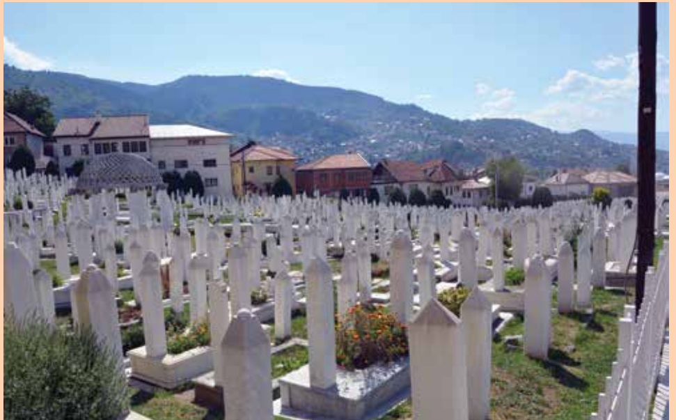
Za projekte Fonda više od pola miliona KM

Lubina džamija, jedna od najstarijih u Sarajevu, pretrpjela je velike štete i devastaciju tokom agresije na našu zemlju, a potpuno je renovirana 1997. godine. Međutim, od tada je prošlo dosta vremena te su na džamiji nastupila nova oštećenja. Polovinom prošle godine počeli su veći radovi na renoviranju i adaptaciji, a projekat obuhvata unutarnje i vanjske radove. „Imali smo dosta problema sa opadanjem dijelova fasade, usljed toga je dolazilo do pucanja zidova u unutrašnjosti džamije, te pojave vlage. Zahvaljujući donaciji Općine Stari Grad i načelnika Hadžibajrića u iznosu od 4.000 KM, te probleme smo riješili“, izjavio je efendija Salih Meštrovac.