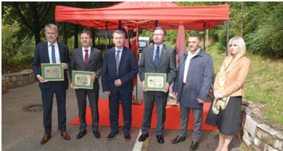
Ambasadori Reinertsen, Păcurețu i Sedar dobili certifikate o sadnji

Početkom oktobra i druga grupa ambasadora imala je priliku zasađiti lipa: Olav Reinertsen - ambasador Kraljevine Norveške, Damijan Sedar – ambasador Republike Slovenije i Anton Păcurețu – ambasador Rumunije. Ta sadnja lipa bila je specifična po tome što je ambasador Republike Slovenije Damijan Sedar za