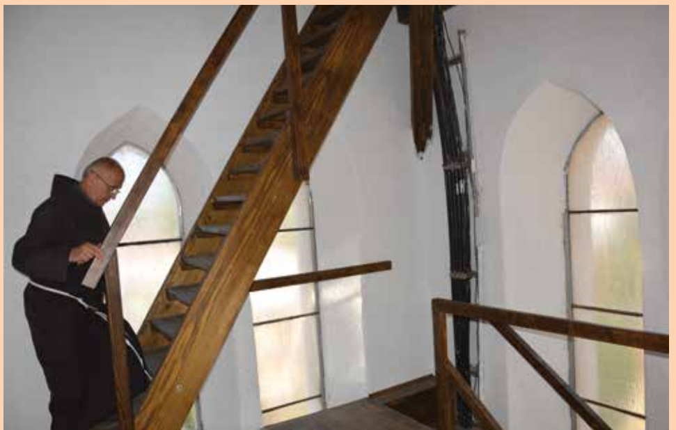
Novo stepenište za zvonik Crkve Svetog Ante