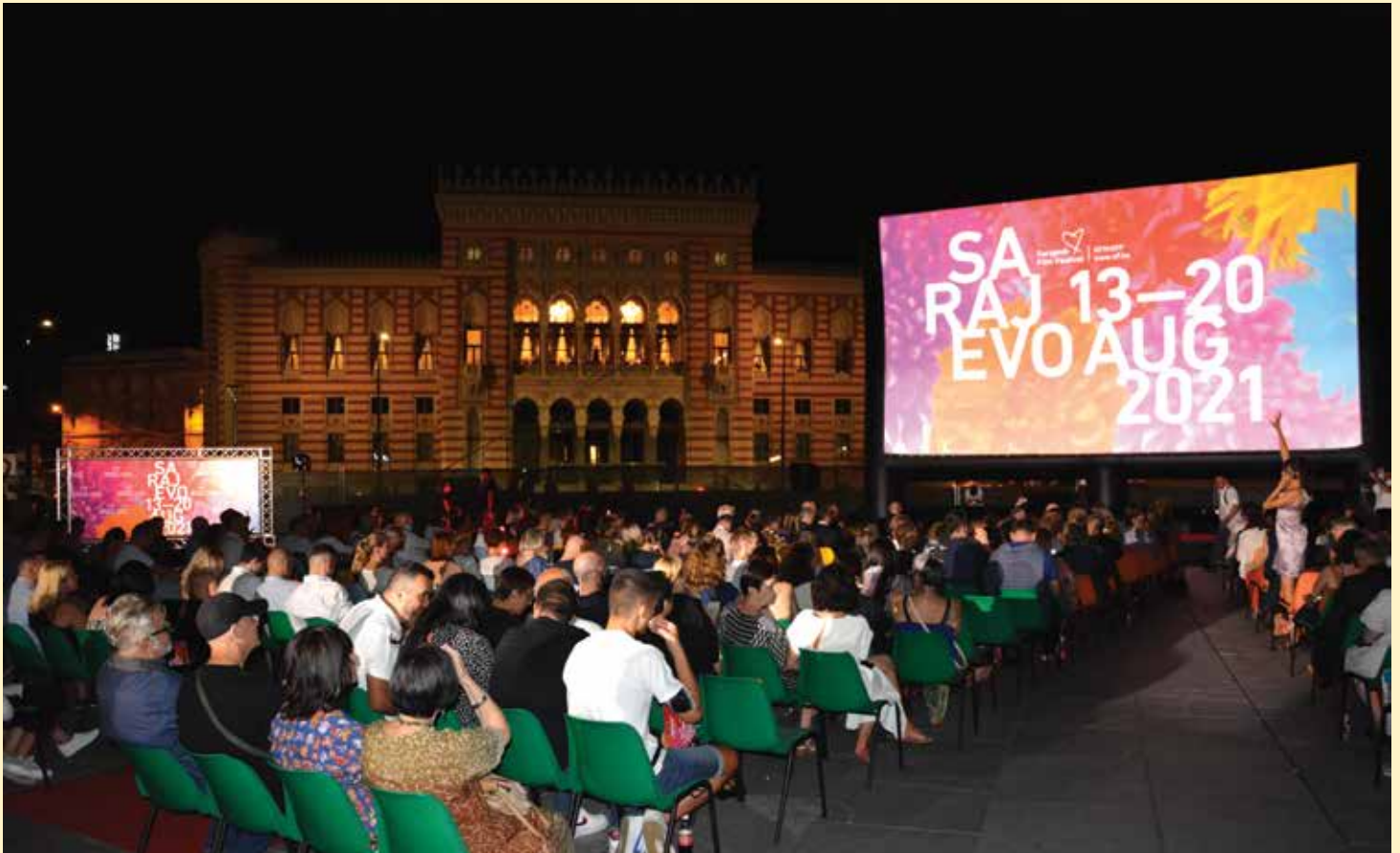
Ljetno kino Stari Grad na višenamjenskom trgu preko puta Vijećnice

Najbolji filmovi u neposrednoj blizini Vijećnice • Višenamjenski trg posjetili oskarovci, glumci, sportisti • Nova dimenzija i doživljaj filmskog festivala