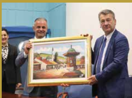
U Općini Čair