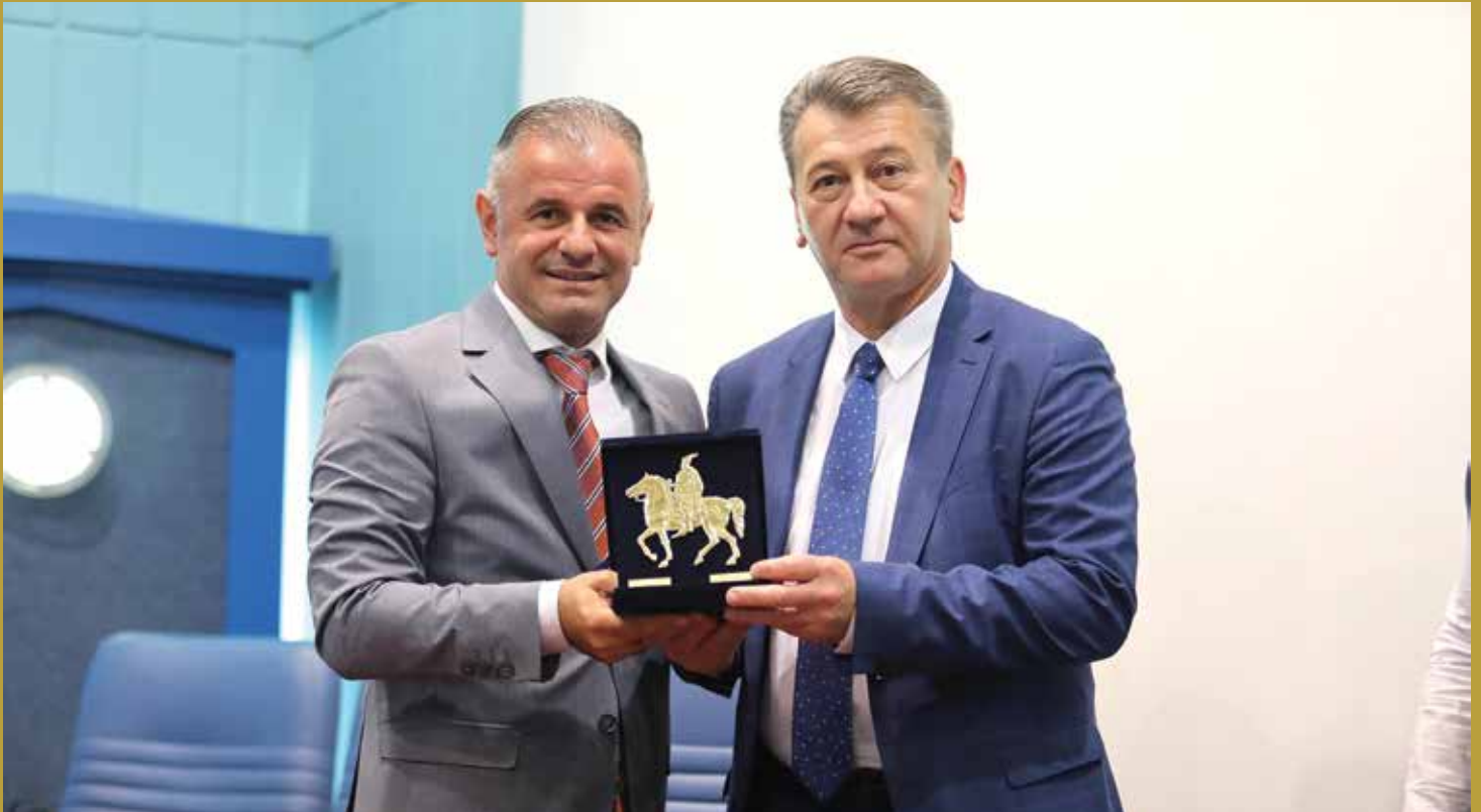
Ganiu i Hadžibajrić nakon potpisivanja sporazuma u Opštini Čair

Općina Stari Grad Sarajevo se bratimila sa dvije makedonske opštine • Stari Grad se povezo sa najstarijom, a zatim i najurbanijom opštinom u Skopju • Buduća saradnja i realizacija zajedničkih projekata