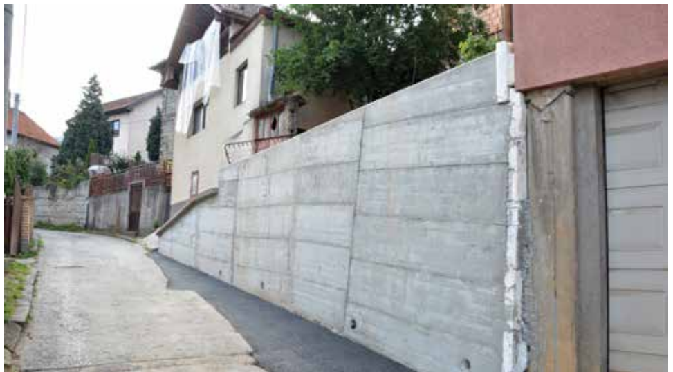
Iza bašče - sagrađen zid dug 12 metara