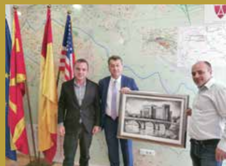
U Općini Aerodrom