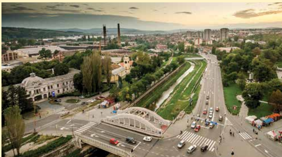
Kragujevac četvrti grad po veličini u Srbiji