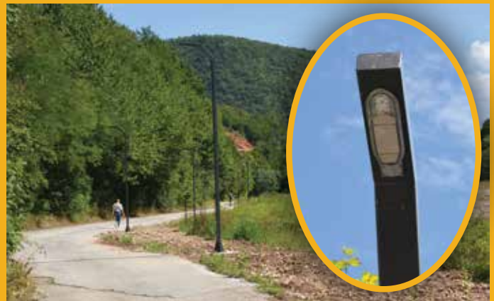
Novih 58 stubova LED rasvjete

Krajni cilj ove lokalne samouprave, predvođene načelnikom Ibrahimom Hadžibajrićem je omogućiti građanima, ali i gostima grada, da u neposrednoj blizini gradske jezgre, imaju uređeno i omiljeno mjesto za odmor i relaksaciju. S tim ciljem je prije dvije godine na Darivi sagrađen i Park prijateljstva na površini od 1.200m 2 , kao poklon Ambasade Švedske u BiH. Park ima ljučjačke, tobogane, njihalice, kule za penjanje, sprave za djecu sa posebnim potrebama, fitness sprave, klupe za odmor. Park prijateljstva je projekat koji je koštao 180.000 KM i vrlo brzo postao je nezaobilazno mjesto okupljanja porodica sa djecom, ali i svih drugih generacija.