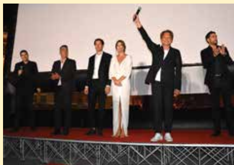
Ekipe filma "Toma"