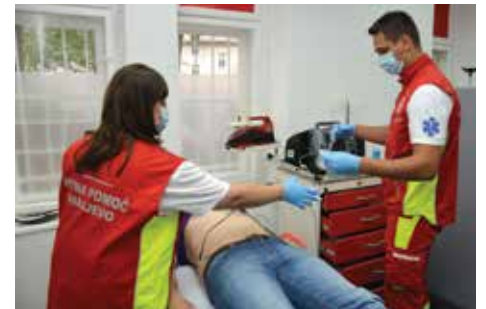
Pomoć na licu mjesta