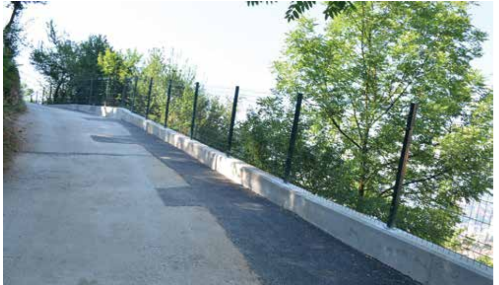
Grličića brdo - izgrađeni zidovi s obje strane ulice

Novi armirano-betonski potporni zid dužine 12 metara izgrađen je u ulici Jarčedoli broj 40 u mjesnoj zajednici Hrid-Jarčedoli. Ovaj projekat je realizovan zbog prijetnje od obrušavanja starog zida na vrlo prometnu saobraćajnicu, koja povezuje ovu starogradsku mjesnu zajednicu sa drugim dijelovima općine. Projekat je finansiran iz budžeta Općine Stari Grad iznosom oko 16.000 KM.