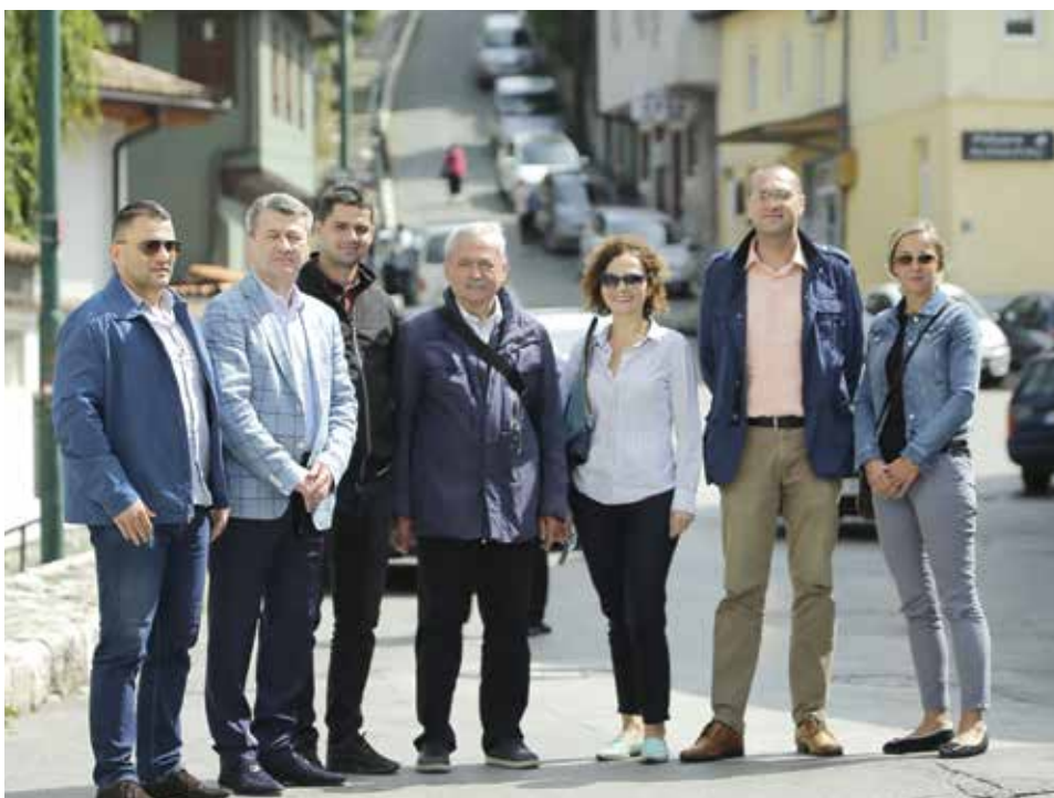
Općinski načelnik sa saradnicima i predstavnici firme Mibral

S redinom septembra počeo je veliki projekat rekonstrukcije kanalizacione i vodovodne mreže sa asfaltiranjem u dijelu ulice Veliki Alifakovac i ulicama Alifakovac, Maguda i Megara. Vrijednost ovog značajnog projekta je 1.444.800 KM.