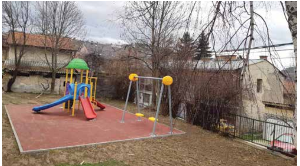
Igralište "Bajka" ina dvije gumene površine