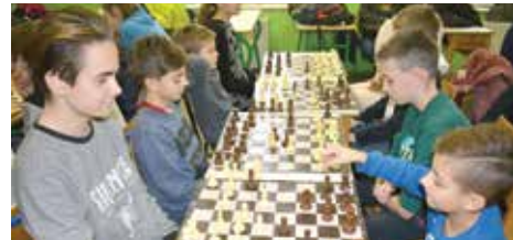
Završen jesenji dio Šahovske lige

Stonoteniska i Šahovska liga Starog Grada