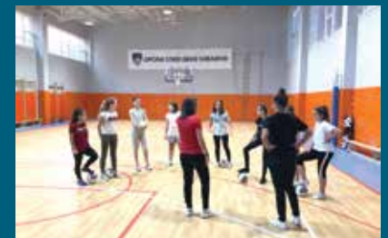
Sala u upotrebi od 01. oktobra

Kao što smo pisali u prošlom broju biltena, u roku je sagrađena i opremljena sportska sala za OŠ "Edhem Mulabdić" čija vrijednost je 1,5 miliona KM. Sala je jedan od četiri kapitalna projekta koji su finansirani kreditom Saudijskog fonda za razvoj, a svečano je otvorena 01. oktobra, 2019. godine.