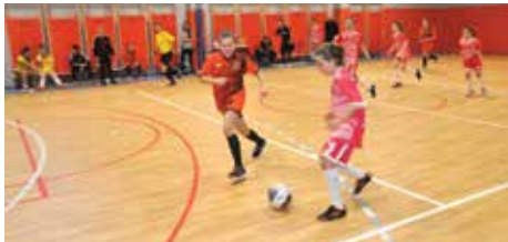
Turnir u novoj sali

Fudbalski turnir za djevojčice Starog Grada