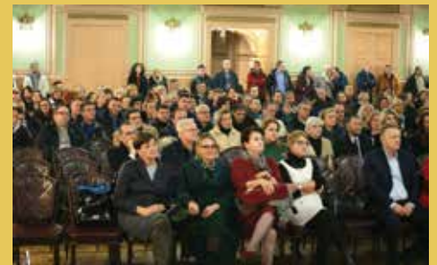
Prijem u Domu Oružanih snaga

U 2019. godini su realizovane investicije vrijedne više od 25 miliona