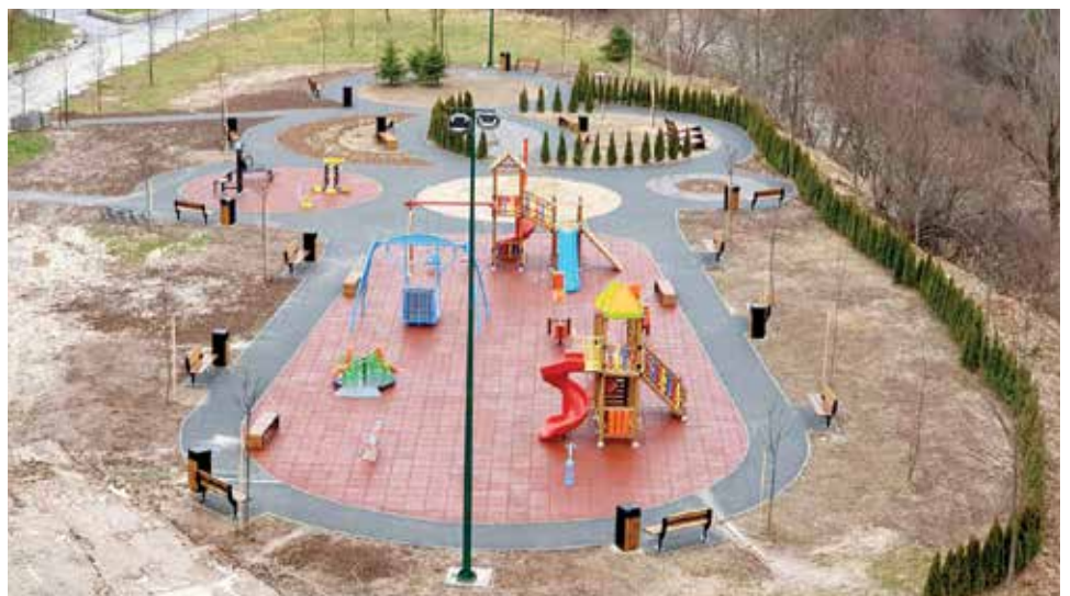
Park mira na Darivi - uskoro otvaranje