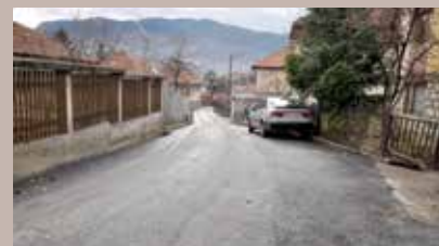
U toku asfaltiranje

„Tokom izvođenja radova u ulici Ispod Budakovića raniji izvođač nije raspolagao dovoljnim brojem uposlenika i potrebne mehanizacije, te je povremeno napuštao gradilište na svoju ruku, bez prethodnog upoznavanja nadzornog organa i investitora. Uputili smo mu opomenu pred raskid ugovora, ali je situacija i dalje ostala ista. Kada su se stekli uslovi za jednostrani raskid ugovora, Općina Stari Grad je to i učinila“, pojasnili su iz nadležne Službe za investicije i komunalne poslove. Pokrenuta je nova procedura i izabran drugi izvođač radova.