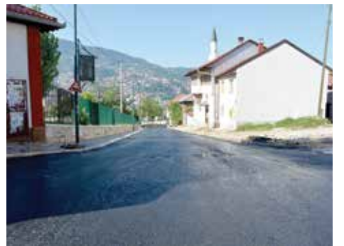
Asfaltiran gornji dio ulice

kako je njegov sin nekoliko puta ošteti automobil zbog kocke koja je ispadala. Sada nije tako i tvrdi da je 98% građana bilo za asfaltiranje dijela ulice.