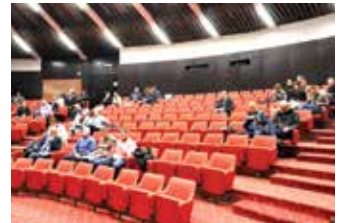
Usvojen nacrt budžeta

Općinsko vijeće Stari Grad održalo je 31. oktobra, 2019. godine 32. redovnu sjednicu na kojoj je, između ostalog, usvojen Nacrt budžeta Općine Stari Grad Sarajevo za 2020. godinu u iznosu od 19.816.500 KM. Prethodno su vijećnici usvojili Izvještaj o realizaciji budžeta Općine Stari Grad za period 01.01-30.09.2019. godine, a usvojen je i Nacrt odluke o izvršavanju Budžeta Općine Stari Grad Sarajevo za 2020. godinu.