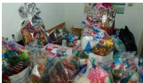
Prikupljeno više od 200 poklona

„Ovo je jedna divna priča u kojoj mi svoju djecu učimo da budu djeca. Mi zaista imamo tu sreću da živimo u općini koja o tome brine odavno, a ovo je prilika da nastavimo priču koji smo davno započeli. Svake godine naša djeca daruju slatkiše, ili igračke i naprave fantastičnu priču zajedno sa učiteljicama. Ovaj put su pisali i poruke tako da je svaki paketić imao poruku. Nama je vrlo važno da naša djeca uz pomoć lokalne zajednice čine sve najbolje i za druge i time postaju bolji ljudi,“ kazala je Parla. „Sve škole su uključene u ovu priču, u našoj općini nema puno djece i škola kao u drugim općinama, ali imamo odličan kadar i niko nije ostao nezapažen u ovoj priči, svako dijete je bilo uključeno,“ dodala je.