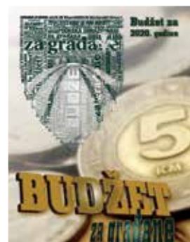
Budžet za 2020. g. 25.3 mil. KM

Općinsko vijeće Stari Grad Sarajevo usvojilo je na prijedlog općinskog načelnika, budžet za 2020. godinu u iznosu od 25.313.000 konvertibilnih maraka. Osim prijedloga budžeta, usvojen je i prijedlog odluke o njegovom izvršavanju za 2020. godinu.