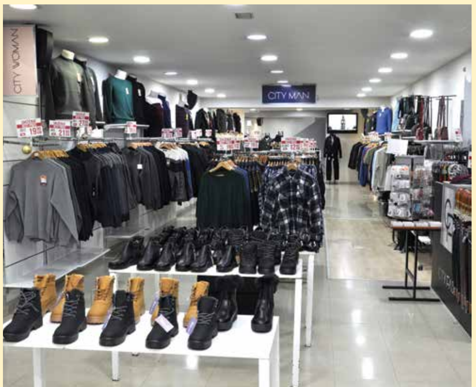
Bogat asortiman u svim radnjama