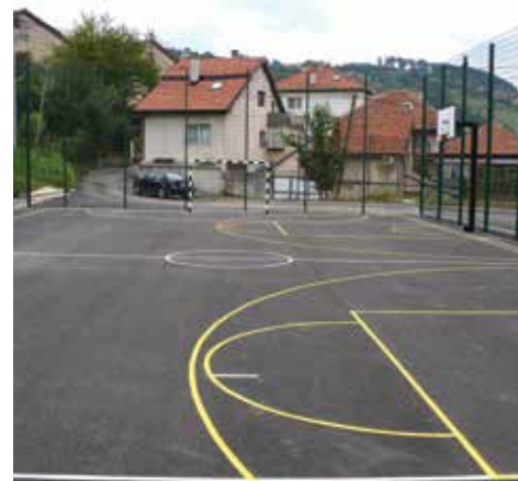
Sportski teren "Bijela bašča"

Općina Fatih je danas duša Istanbula, nekada Konstantinopolja. Svako ko posjeti ovu svjetsku metropolu najviše vremena provede upravo u Fatihi. To je mjesto kojim dnevno prođe više od dva miliona ljudi, a njegove brojne znameniti