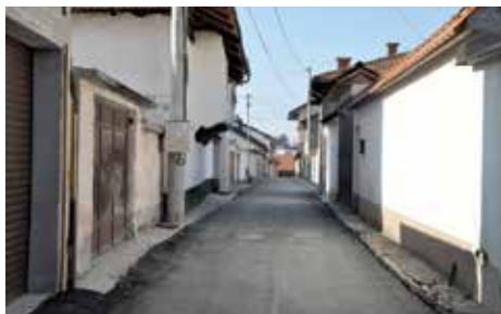
Novi asfalt na 323 metra