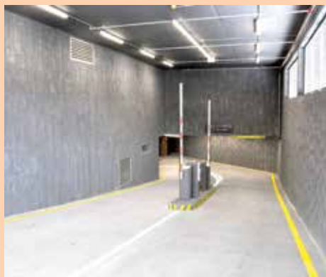
Ulaz u podzemnu garažu

"Multifunkcionalni trg i garaža su završeni i sada se provode redovne proce-