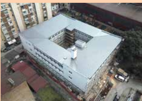
Novi krov na Domu zdravlja

novih prostorija. Cijeli objekat dobio je novu stolariju i fasadu, kao i novi krovni pokrivač. Izvršena je sanacija podrumskih prostorija, urađeni su i toaleti u cijelom objektu. Sagrađeno je protivpožarno stepenište i prvi put u objekat ugrađen lift. Sagrađena je i nova čekaonica, zamijenjene elektroinstalacije, uređen atrij, vanjsko uređenje... Radovi su u završnoj fazi.