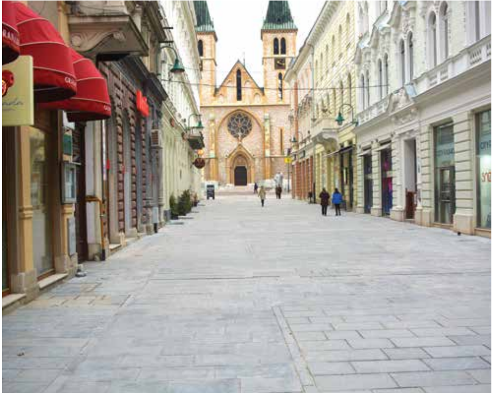
Nove ploče na površini od 1.100 m 2

Ranija asfaltna površina u At mejdanu (parking) više nema tu namjenu, asfalt je uklonjen, prošireno šetalište, nasuta zemlja i napravljena nova zelena površina. U At mejdanu se sada šetalište proteže duž