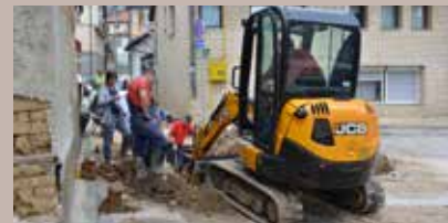
Nova vodovodna mreža

Asfaltirana su dva kraka ulice Ispod Budakovića, a nakon rekonstrukcije vodovodne mreže u dužini od 475 metara. Planirano je asfaltiranje dionice u ukupnoj dužini od 570 metara.