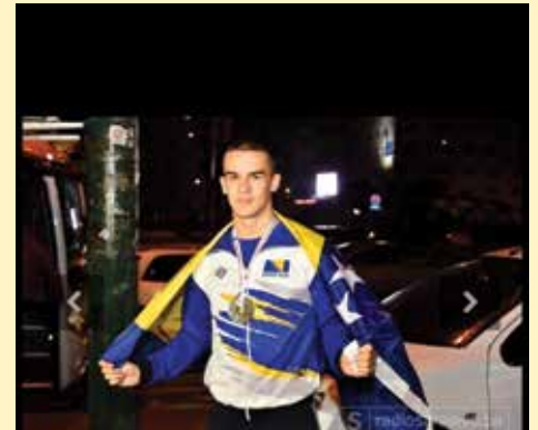
Najveći san Olimpijska medalja

Kao i većini sportista, najveći Hamzin san ostaje osvajanje prve olimpijske medalje za Bosnu i Hercegovinu. Svjetska medalja iz Čilea je dokazala da Hamza može osvajati medalje na velikoj pozornici. Ukoliko se njegov kvalitetan rad nastavi, a isti bude praćen podrškom sa svih strana, ni taj san možda nije nedostižan.