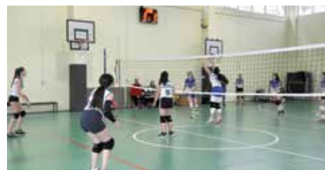
Odbojkaška liga u OŠ M.M.Bašeskija

Peta sezona Odbojkaške lige za djevojčice Starog Grada