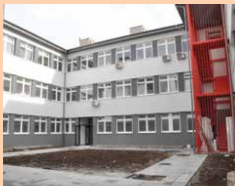
Fasada, stolarija, nove prostorije...