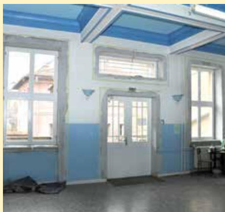
Nova stolarija u školi

Vrijednost projekta utopljanja OŠ „Mula Mustafa Bašeskija“ iznosi oko 450.000 konvertibilnih maraka, finansira ga Vlada Švedske, posredstvom Ambasade Švedske u BiH, a implementira UNDP u BiH. Finansijsku podršku projektu utopljanja OŠ „Mula Mustafa Bašeskija“ dala je Općina Stari Grad Sarajevo, te Ministarstvo prostornog uređenja, građenja i zaštite okoliša Kantona Sarajevo.