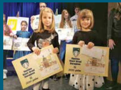
Najbolji radovi nagrađeni

„Moja općina, Općina Stari Grad“ naziv je kalendara za 2020. godinu koji krase zidove učionica, stanova, kancelarija..., a sačinjen je od najboljih likovnih radova osnovaca i polaznika vrtića iz ove općine.