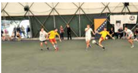
Šesta sezona fudbalske lige

Fudbalska liga osnovaca Starog Grada – OŠ „Vrhbosna“ jesenji šampion