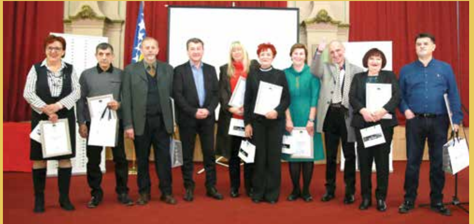
Načelnik uručio penzionerima poklone i zahvalnice

Pred kraj 2010. godine općinski načelnik ugostio je i privrednike koji djeluju u Starom Gradu, kao i poslovne