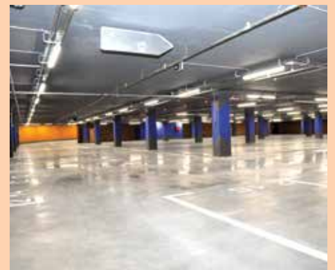
Ukupno 157 parking mjesta

dure oko izdavanja upotrebne dozvole. Kao što je poznato izgradnju smo finansirali kreditnim sredstvima Saudijskog fonda za razvoj čiji su predstavnici početkom mjeseca bili u posjeti i izrazili želju da prisustvuju svečanom otvaranju. Tada smo se dogovorili da četiri projekta koja smo radili kreditnim sredstvima: podzemna garaža i trg, Dom zdravlja Stari Grad,