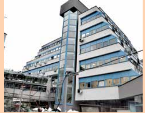
Završava se objekat "A"