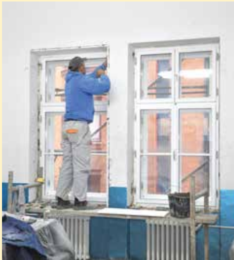
Zamjena prozora na Muzičkoj akademiji