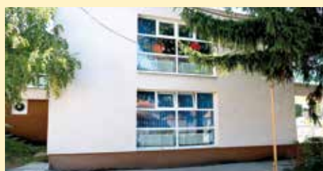
Novi sistem grijanja

Projekat vrijedan oko 113.000 KM finansirala je Vlada Švedske, posredstvom Ambasade Švedske u BiH, a implementirao UNDP u BiH. Finansijsku podršku projektu dala je Općina Stari Grad Sarajeva, te Ministarstvo prostornog uređenja, građenja i zaštite okoliša Kantona Sarajeva. Općina Stari Grad u ovaj je program uključena putem Službe za lokalni razvoj i poslove mjesnih zajednica.