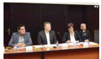
Usvojen Program rada OV-a

Na 34. sjednici Općinskog vijeća Stari Grad Sarajevo usvojen je Program rada Vijeća za 2020. godinu. Obuhvaćene su