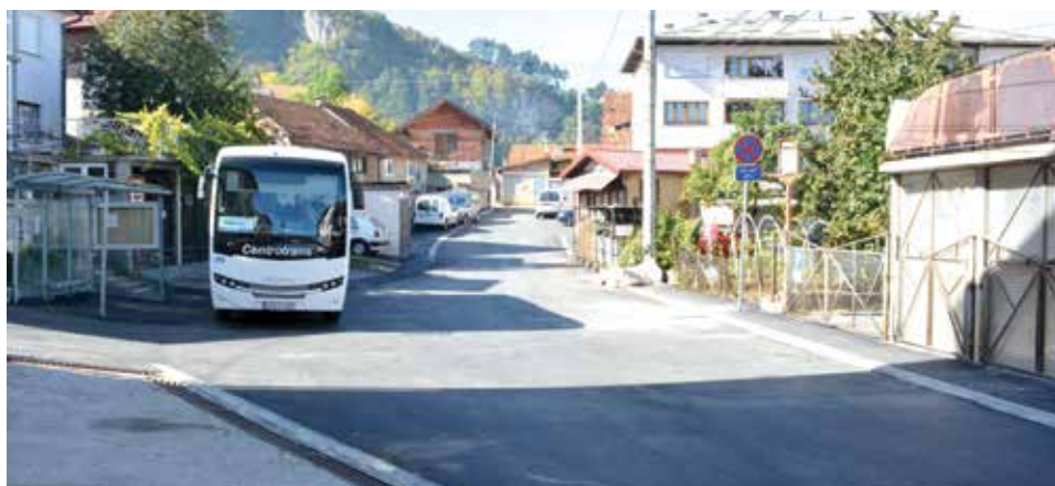
Kombi stajalište u ulici Paje

Tokom sanacije ulice firma „Vodovod i kanalizacija“ uradila je ispitivanje fekalne i oborinske kanalizacione mreže, a kompanija BH Telecom zamijenila svoje instalacije tamo gdje je bilo potrebno.