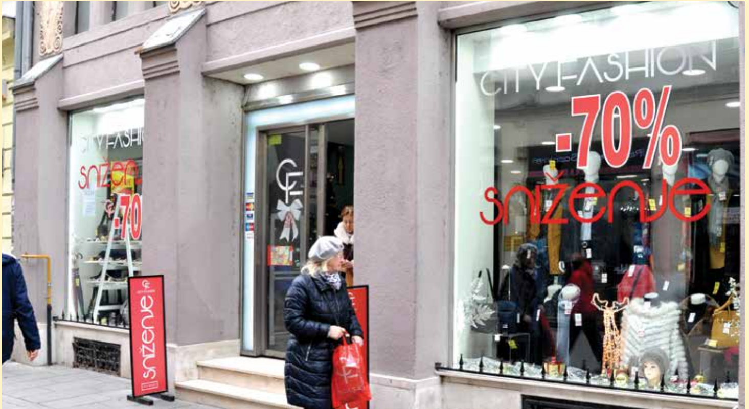
City Fashion u ulici Ferhadija - centralnoj gradskoj šetnici

Ova prestižna firma nudi prodaju artikala srednje i niže cjenovne kategorije kao i luksuznu ponudu proizvoda poznatih italijanskih modnih linija • Nalaze se na dvije najatraktivnije lokacije u Starom Gradu i to u ulici Ferhadija na broju 22 i u ulici Štrosmajerova broj 6.