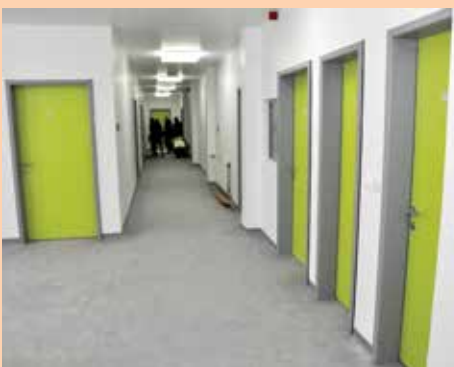
Unutrašnjost Doma zdravlja