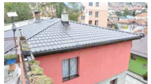
Novi krov i fasada

za pomoć, a pored njih veoma je izražen i problem socijalno ugroženih lica koja nemaju adekvatne uslove stanovanja. „Imamo socijalnu kategoriju s jedne strane i boračku s druge strane. Ova druga je bila dosta zapostavljena i zaboravljena. U posljednjih deset godina nastojimo toj kategoriji pomoći i sanirati domove, tako da je Općina dosad pomogla sanaciju više od 200 objekata,“ kazao je Hadžibajrić.