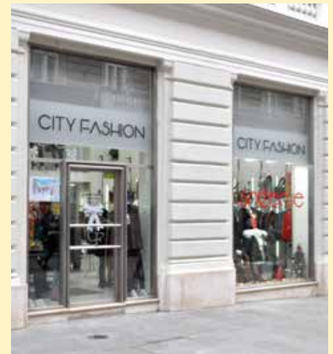
City Fashion u ulici Štrosmajerova

Omogućiti kupcima potpuno zadovoljstvo kupovine, ne nametati nego pomoći u isticanju vlastite osobnosti - ono je na čemu mi temeljimo svoju diferencijaciju od konkurencije i jedan od ključnih faktora na kojem baziramo našu konkurentsku prednost. Za nas je najvažnije zadovoljstvo kupca i da se osjeća ugodno u našim prodajnim objektima, bez pritiska da mora realizovati kupovinu. Ključni cilj je zadovoljni kupac“, zaključuje Samir.