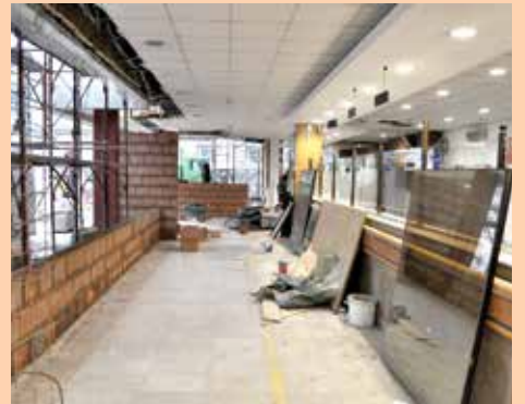
Rekonstrukcija Šalter sale