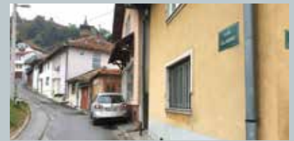
Postavljeno više od 700 tabli

Urađena je i deveta faza postavljanja novih brojeva, tzv. numeracija objekata u ulicama Starog Grada. Nove table sa brojevima i nazivima dobile su ulice: Alije Bejtica - MZ Babića bašča, Čeljigovići - MZ Babića bašča, Nova mahala - MZ Medrese, Safvet-bega Bašagića - MZ Medrese, Vareška - MZ Medrese i Lapišnica - MZ Babića bašča.