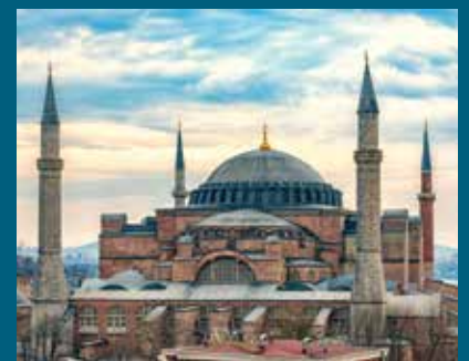
Aja Sofija u općini Fatih

Aja Sofija je bila najveća crkva u Bizantijskom carstvu, prijašnjem Istočnom Rimskom Carstvu i predstavljala je jedno od najvećih graditeljskih dostignuća tog vremena. Nakon osmanskog osvajanja 1453. godine crkva je pretvorena u džamiju, a izvana su izgrađena četiri minareta. Aja Sofija je 1935. godine pretvorena u muzej i dnevno je posjete hiljade ljudi.