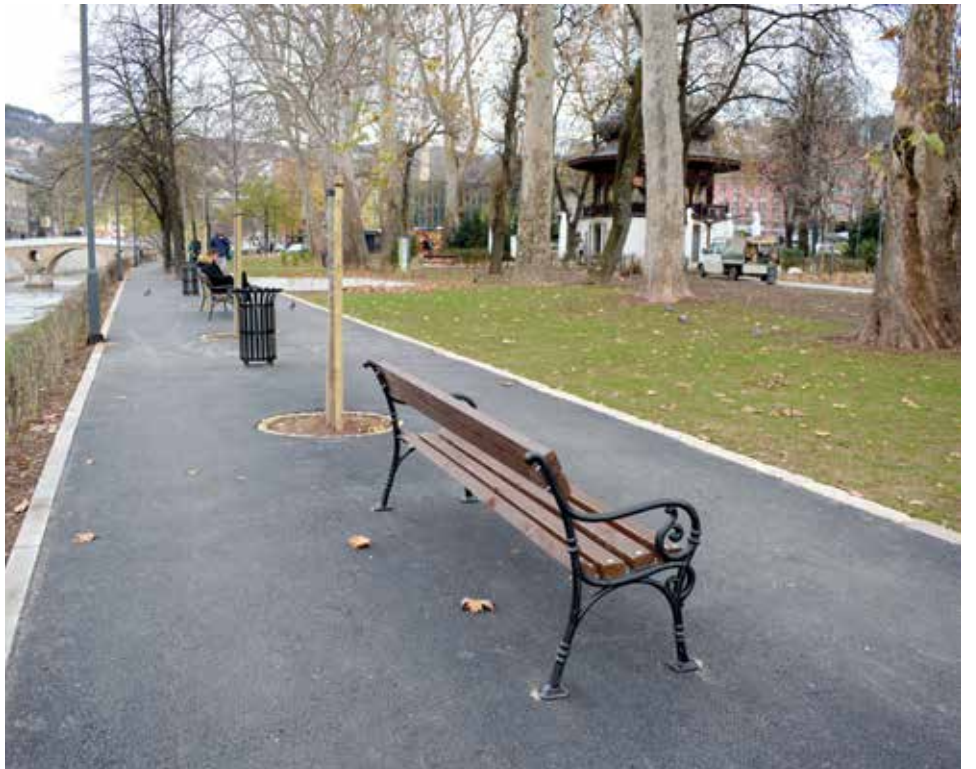
Uređeno šetalište sa novim klupama i sadnicama