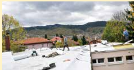
Novi krov na vrtiću "Biseri"