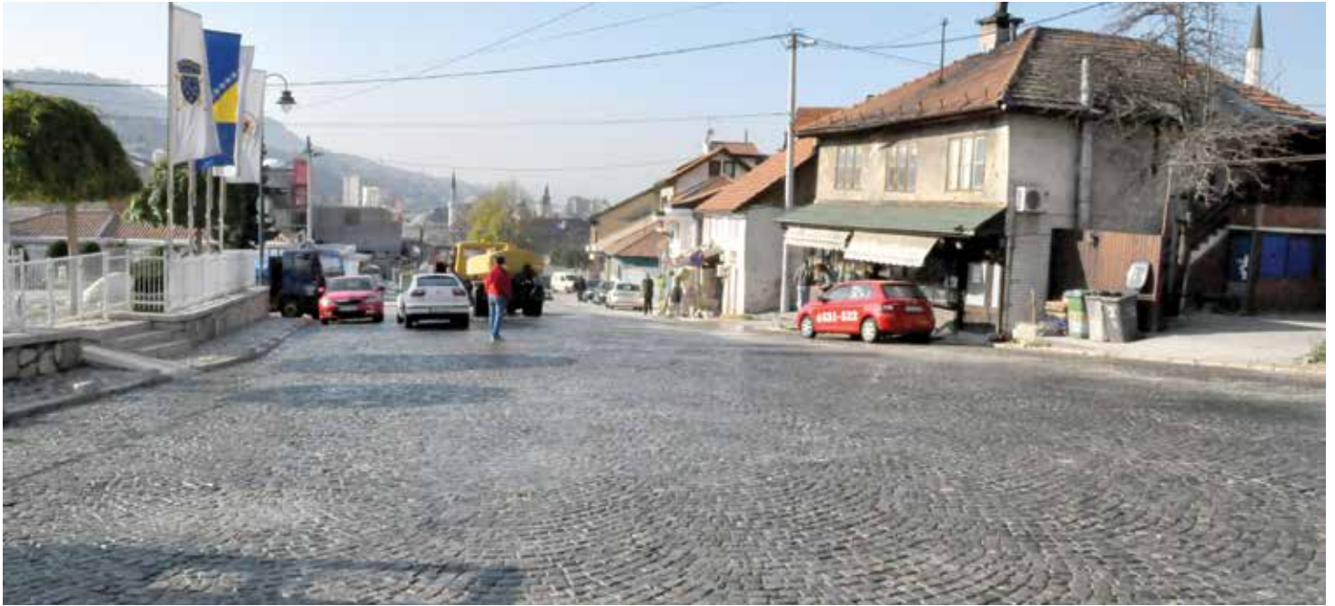
Saniran plato Kovači površine 2000 m 2

obale Miljacke - od Latinske ćuprije, sve do Ćumurija mosta, a postavljene su i nove klupe i korpe za otpatke. Osim toga, šetalište je obogaćeno novim stablima, te je cijelom dužinom zasađeno 13 lipa. Stabla su zaštićena i oko njih su urađene tzv bordure.