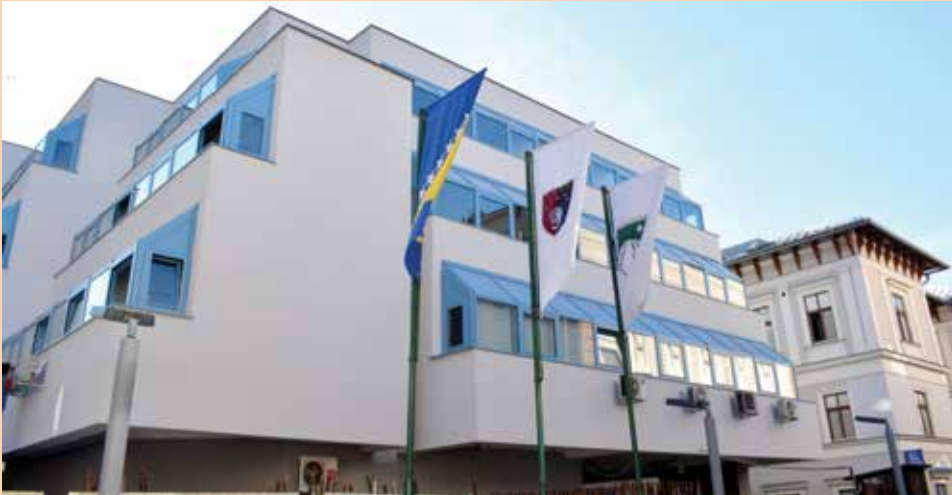
Završen objekat "B"