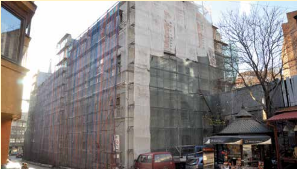
Objekat će biti potpuno restauriran

Ukupna cijena obje faze ovog vrlo značajnog projekta koji će sačuvati ovaj nacionalni spomenik, uštediti potrošnju energije, smanjiti zagađenje, te unaprijediti uslove za rad učenika i nastavnog osoblja, iznosi oko 690.000 KM. Za prvu fazu radova Općina Stari Grad, Gradska uprava Grada Sarajeva i Federalno ministarstvo kulture i sporta izdvojili su oko 140.000 KM. Druga faza radova košta oko 550.000 KM i finansira ih Ambasada Švedske i Ministarstvo prostornog uređenja, građenja i zaštite okoliša Kantona Sarajeva.