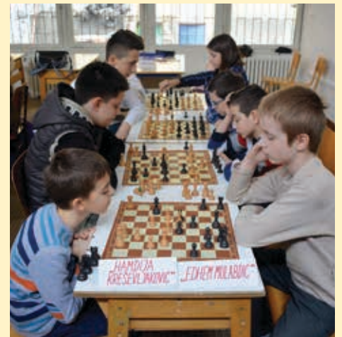
OŠ "Vrhbosna" šampion