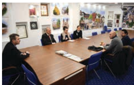
Općina podržala projekat Pomozi.ba

izdvajaju sredstva ili namirnice kako bi se svaki dan pripremilo najmanje 300 obroka za korisnike kojima to bude jedini obrok tokom dana“, kazao je Tatarević. Korisnici projekta „Obrok za sve“ su stari, bolesni i iznemogli, socijalno ugroženi ljudi koji ne mogu samostalno doći ni do javne kuhinje.