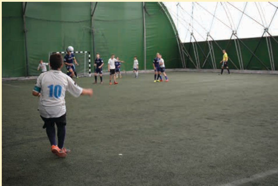
Zanimljiva borba za titulu na proljeće