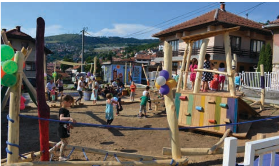
Igralište kod vrtića Pčelica

Na pomenutoj lokaciji na Mihrivodama nalazi se staro, oštećeno igralište koje će biti srušeno i na njegovom mjestu sagrađeno novo. Projekat izgradnje sportskog terena 'Bijela bašča' predviđa formiranje sportske plohe za mali nogomet, košarku i rukomet dimenzija 30 x 16,30 metara, a izgradnju će finansirati pobratimska Općina Fatih iz Istanbula, Općina Stari Grad i Federalno Ministarstvo kulture i sporta. Projekat koji je pripremio Sektor za lokalni razvoj, vrijedan je oko 130.000 KM, a s obzirom da je već završena procedura izbora izvođača radova, gradnja će početi čim se poboljšaju vremenski uslovi.