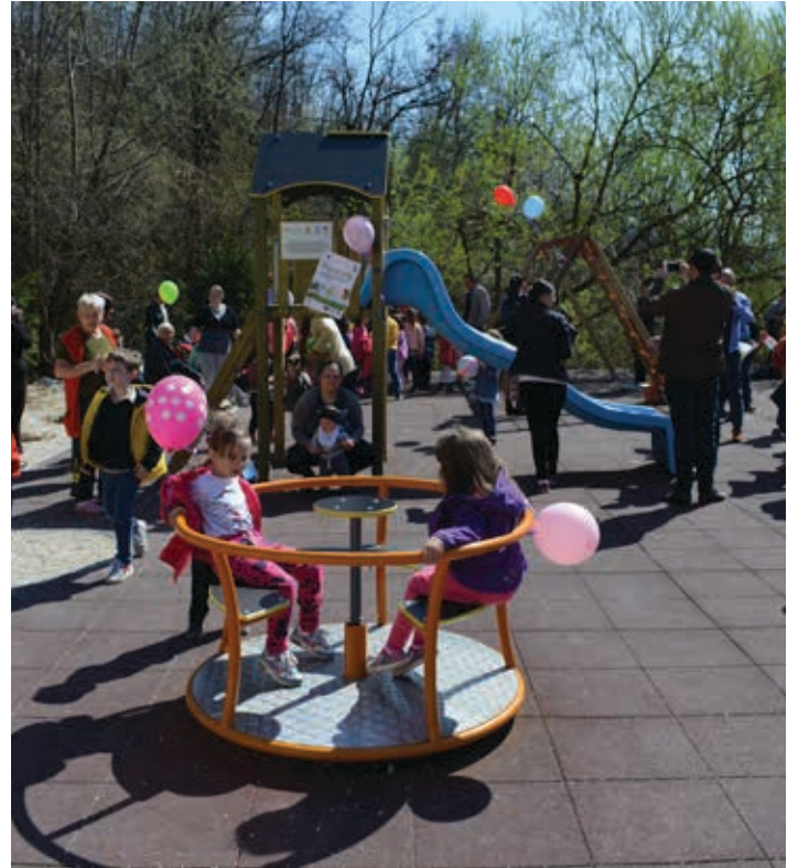
Na Sedreniku izgrađeno igralište u ulici Brdovita

dječijih igrališta, Općina Stari Grad nastavit će sa ovakvim aktivnostima, kako bi mališani iz ove općine imali što više prostora za igru i zabavu. Pritom, pažnja će se posvećivati i višim uzrastima, a u tom smislu već je rađena sanacija školskih igrališta i sala, dok je za OŠ "Mula Mustafa Bašeskija" prošle godine izgrađena nova, moderno opremljena sportska sala čija vrijednost je oko 800.000 KM. Sportska sala gradit će se i za OŠ "Edhem Mulabdić" u ulici Konak, i to sredstvima kredita Saudijskog fonda za razvoj, a vrijednost tog projekta iznosi oko dva miliona KM.