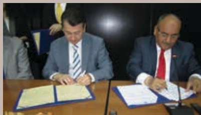
Sporazum o saradnji potpisan 2013. godine

Pobratimska Općina Umranije finansirat će nabavku hemodijaliznog aparata za UKCS