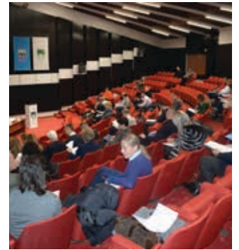
Formiran organizacioni odbor

Formiranjem Organizacionog odbora za obilježavanje Dana Općine Stari Grad, te Komisije za dodjelu priznanja, na 15. sjednici Općinskog vijeća Stari Grad, zvanično su počele pripreme za obilježavanje 02. maja, Dana Općine. Organizacioni odbor će utvrditi program obilježavanja Dana Općine, a Komisija će odlučiti kome će tog dana biti dodijeljena priznanja: općinska povelja sa zlatnim štitom, povelja sa grbom Općine, Zlatni sebilj i policajac godine.