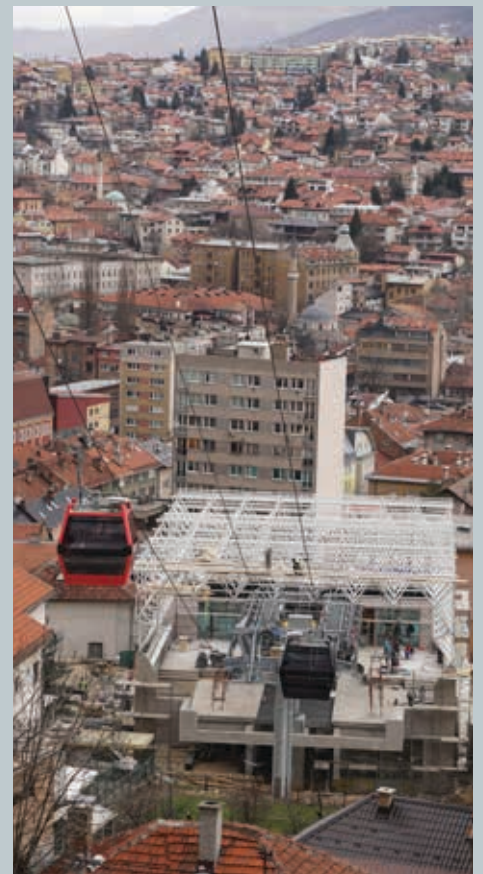
Za izgradnju žičare Općina izdvojila 500.000 KM

Sadašnja instalacija žičare ima 33 kabine kapaciteta 10 osoba, vozit će brzinom od pet metara u sekundi, što znači da će vožnja trajati oko sedam minuta, a od polazne stanice ima 10 velikih stubova. Po riječima inženjera i graditelja, sajla, vučno i noseće uže, kao i zračni kabl (koji služi za komunikaciju između brdske i dolinske stanice) su najbolje kvalitete. Očekivanja su da će žičaru koristiti oko pola miliona korisnika godišnje. U projekat je uloženo blizu 15 miliona KM.