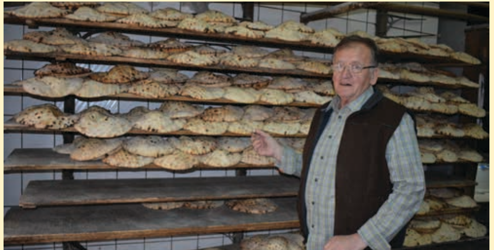
Proizvodnja nekad i do 3000 somuna dnevno

Zbog specifičnih životnih okolnosti, bolesti amidže i strine, koji su vodili posao, Mehmed je još u veoma ranoj dobi preuzeo brigu nad pekarom, napustio studije i potpuno se posvetio pekarskom poslu, za što se nikada nije pokajao. „Prvobitni pekarski proizvodi su bili vrlo prosti, samo hljeb i kukuruza. U