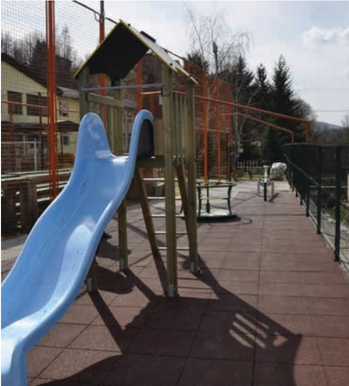
Igralište ispred OŠ "Vrhbosna"