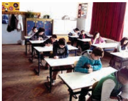
Usvojen zaključak o besplatnim udžbenicima

Vijeće je usvojilo i prijedlog odluke o raspodjeli budžetskih sredstava za rad boračkih udruženja u ovoj go-