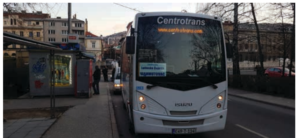
Minibus spreman za vožnju na Mahmutovac