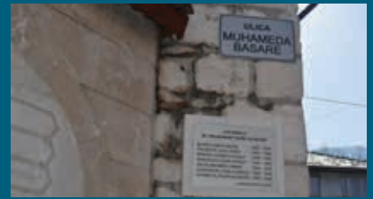
Tabla sa imenima sedam šehida

Ulica u starogradskom naselju Bistrik, u blizini Gazi Mehmed-begove džamije i Bistričke česme, odnedavno nosi naziv po šehidu Muhamedu Basari. Istovremeno, pored table sa nazivom ulice postavljena je i tabla sa imenima sedam šehida iz ovog naselja koji su dali svoje živote za odbranu grada i države i ukopani su pored Gazi Mehmed-begove džamije.