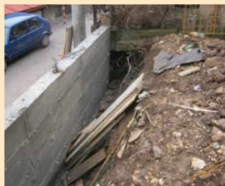
Paje br 34