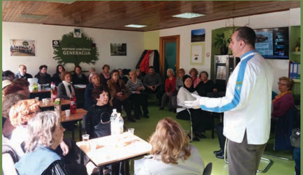
Centar ima više od 300 aktivnih članova

Udruženje „Generacija“, koje upravlja Centrom za promociju i unapređenje zdravlja Stari Grad, potpisalo je memorandum o saradnji sa Udruženjem za zaštitu mentalnog zdravlja „Menssana“, s ciljem pružanja podrške i unapređenja mentalnog zdravlja građana svih dobnih skupina.