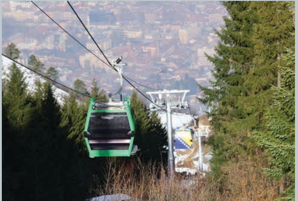
Nakon 26 godina žičara ponovo u funkciji

U prethodnom periodu, sve općinske službe stavljene su u funkciju obezbjeđivanja potrebne dokumentacije za izgradnju Trebevićke žičare, a prema nalogu općinskog načelnika Ibrahima Hadžibajrića ti zahtjevi tretirali su se kao prioritetni, te su se rješavali u roku od sedam dana. Pokrenuta je procedura i izmijenjeni su regulacioni planovi, izdata je potrebna dokumentacija – urbanističke i građevinske dozvole, a u rekordnom roku je završena ekspropijacija nekretnina za polazne i dolazne stanice – oko 30 parcela. Podrška projektu Trebevićke žičare nije bila samo u administrativnom smislu, već i finansijskom. Općina Stari Grad uplatila je u decembru prošle godine pola miliona konvertibilnih maraka za izgradnju Trebevićke žičare, a nakon toga je Gradskoj upravi dodijelila na korištenje prostor Vidikovca na period od 25 godina – bez naknade. Gradskoj up-