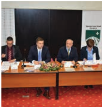
Usvojen program rada OV

Općinsko vijeće Stari Grad održavat će i u 2018. godini redovne sjednice jednom mjesečno, a radi raspravljanja i odlučivanja o pitanjima predviđenim Programom rada, te drugim pitanjima zavisno od aktuelne situacije i potreba i interesa građana. Sve navedeno, uz detaljan pregled planiranih akata, odluka i izvještaja usvojeno je 14. sjednici Općinskog vijeća. Usvojen je i izvještaj o radu prema kojem je u 2017. godini održano 11 redovnih sjednica, te po jedna tematska, vanredna i svečana.