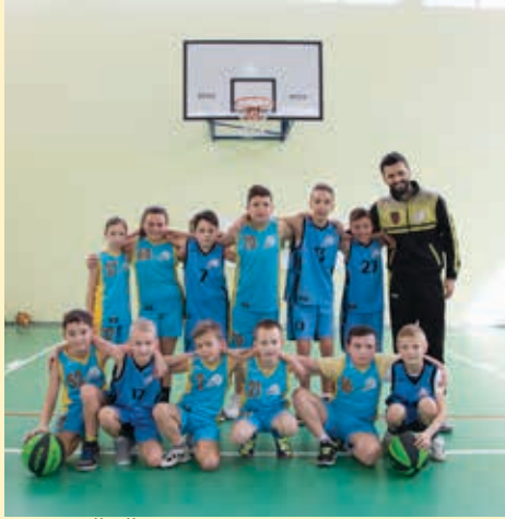
Ekipa OŠ „Šejh Muhamed ef. Hadžijamaković“

Nakon što je Košarkaški klub i Škola košarke BBY (Bosnian Basket Youth)