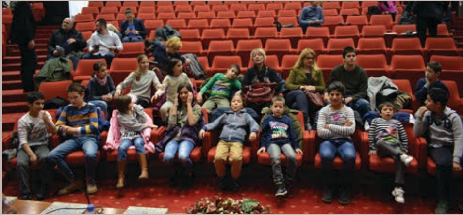
Mališani dobili prigodne poklone