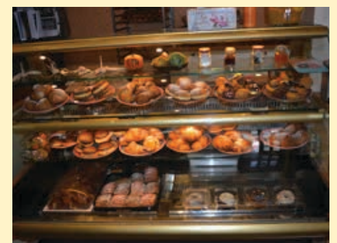
Brojne pekarske delicije