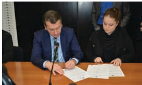
Za stipendije izdvojeno 200.000 KM