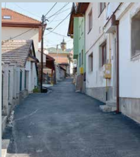
Čeljigovići - sanirano 208 metara

Urađena su proširenja glavne saobraćajnice u mjesnoj zajednici Mošćanica. S obzirom da je saobraćajnica na određenim lokacijama dosta uska i otežano se odvijao saobraćaj, Općina Stari Grad je angažovala KJKP "Rad" da uradi proširenja na šest lokacija. Proširenja su urađena na sljedećim mjestima: kod skretanja za Haznadareviće, preko puta mosta za Obhodžu, Mošćanica 13 – desna krivina, kod objekta u ulici Mošćanica 22 - lijeva krivina, kod Vile Atelier u ulici Mošćanica 19, iznad skretanja za romsko naselje. Radovi su koštali 23.500 KM.