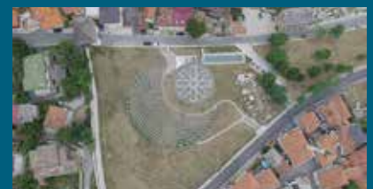
Izdvojeno 45.000 KM za Fond memorijala