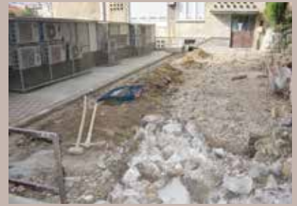
Projekat košta 11.000 KM

U starogradskoj mjesnoj zajednici Ferhadija, ulica Dženetića čikma do broja 10, radi se uređenje i betoniranje platoa ispred stambene zgrade, a uradit će se i sanacija dva potporna zida. „Uz uređenje platoa planirani su i radovi odvodnje oborinskih voda, za šta će biti postavljen odgovarajući vod,“ rekli su u nadležnoj Službi za investicije, plan i analizu Općine Stari Grad. Dodali su i da će nakon ovih radova uslijediti sanacija dva manja potporna zida na lokalitetu.