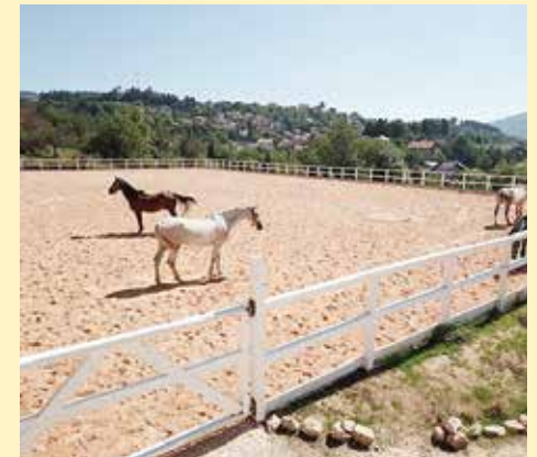
Novi jahački manjež