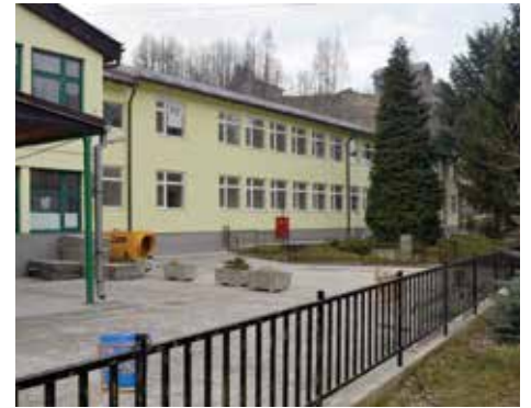
Lamela II OŠ "Vrhbosna"