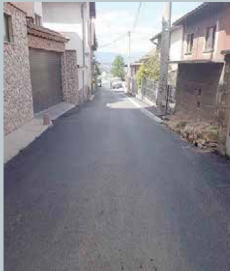
Jekovac - radovi u dvije faze

U mjesnoj zajednici Babića bašča asfaltirana je i rekonstruisana ulica Čeljigovići, dužine 208 metara i prosječne širine četiri metra. Kako je pojašnjeno u Službi za investicije, plan i analizu Općine Stari Grad dio ulice Čeljigovići, od džamije do raskrsnice sa ulicom Hošin brijeg nije urađen zbog planiranih radova na rekonstrukciji kanalizacione mreže. Općina Stari Grad je bila finansijer i ovog projekta sa oko 38.000 KM.