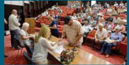
Hedije za 350 osoba

Novčane hedije, povodom ramazanskog i Kurban bajrama, od Općine Stari Grad dobilo je 350 pripadnika boračke populacije. Ovu pomoć bivšim borcima i članovima njihovih porodica uručili su predstavnici Općine Stari Grad tokom tradicionalnih druženja povodom Bajrama, održanih 23. juna i 31. avgusta. 2017. godine. Novčane hedije po 100 KM dobilo je 200 porodica šehida i poginulih boraca, 100 nezaposlenih ratnih vojnih invalida i 50 nezaposlenih demobilisanih boraca.