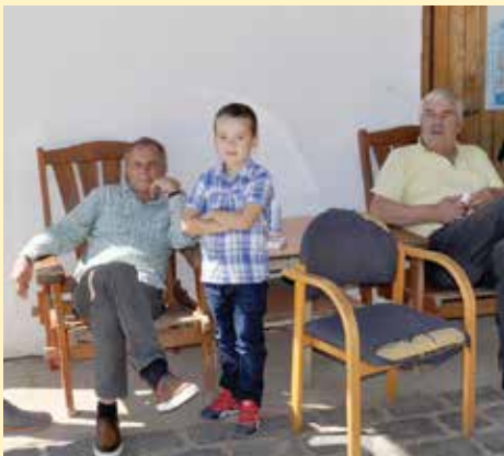
Vražalica i Potogija zaljubljenici u konjički sport

Ako smo Vam makar na trenutak probudili maštu i želju za avanturom, posjetite web stranicu kkhidalgo.com ili pozovite broj telefona 066 166 450 i saznajte sve o jahačkoj ponudi „Hidalga“.