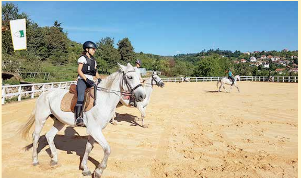
KK "Hidalgo" otvoren za sve ljubitelje sporta