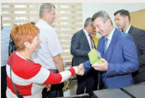
Korisnici dobili glukometre