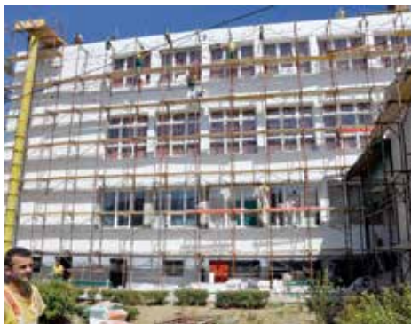
Nova fasada i krov

Utopljanje OŠ „Hamdija Kreševljaković“ jedna je od aktivnosti u sklopu projekta „Zeleni ekonomski razvoj“ kojeg provodi UNDP u BiH, a finansiraju Vlada Švedske, Fond za zaštitu okoliša FBiH i Fond za zaštitu životne sredine i energetske efikasnost RS, u saradnji sa Ministarstvom vanjske trgovine i ekonomskih odnosa BiH, entitetskim ministarstvima prostornog uređenja, kantonalnim ministarstvima, te drugim partnerima.