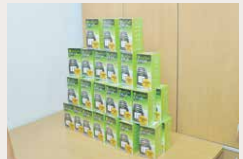
Besplatni aparati za mjerenje šećera u krvi