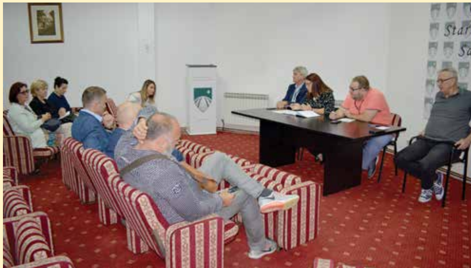
Pet sportskih liga za osnovce

Općina Stari Grad je za održavanje fudbalske, košarkaške, odbojkaške, šahovske i stonoteniske lige planirala oko 40.000 KM koje će biti utrošene za opremu, nagrade najboljima, naknade za trenere i sudije i sl. Osim toga, za već navedeno opremanje sala uloženo je dodatnih 19.000 KM.