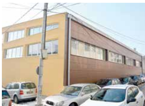
Sportska sala u Logavinoj

Hadžibajrić je govorio i o projektima u koje je Općina Stari Grad uključena, a koji su od javnog interesa za Grad Sarajevo.