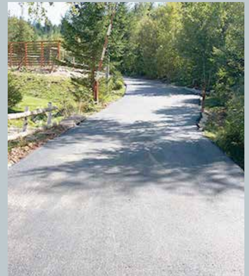
Dio puta na Trebeviću

Trotoari u ulici Mula Mustafe Bašeskije (lijeva strana), od Muzeja Jevreja do Tržnice-ukupne dužine 323 metra, u potpunosti su rekonstruisani, uključujući novi asfalt, ivičnjake, šahtove i drenažne cijevi. Projekat je Općina fi-