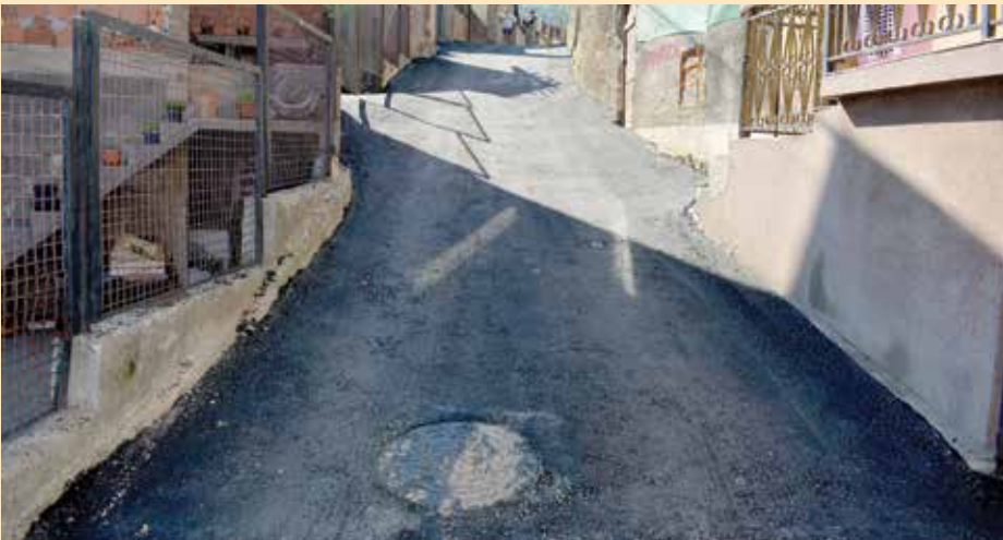
Desete brdske brigade