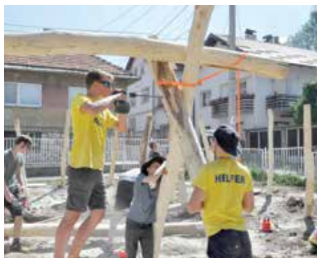
Učenicima izgradili igralište za sedam dana

Građani koji žive u blizini igrališta kazali su da je lijepo vidjeti ovako mlade ljude koji su toliko vrijedni i predani poslu. Roditelji djece koja su polaznici vrtića organizovali su zakusku uz sokove i tortu povodom završetka radova. Ovaj plemeniti čin učenika oduševio je mnoge, tako da ih je jednog radnog dana besplatnim ručkom iznenadila ašćinica ASDŽ, a počašćeni su i tučanom kahvom iz Dibeka.