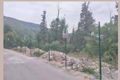
Zaštitna ograda dužine 76 metara

U ulici Pogledine, na području MZ Hrid-Jarčedoli, postavljena je zaštitna ograda u dužini od 76 metara, s ciljem sprječavanja odlaganja otpada koji neodgovorni pojedinci konstantno ostavljaju. Općina je odlučila da ogradi prostor i tako spriječi odlaganje kabastog i drugog otpada na ovo mjesto, kako se ne bi stvorila „divlja“ deponija.