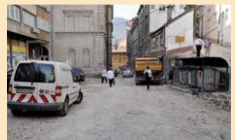
Muse Ćazima Ćatića

Po završetku ovih radova, ulica će se asfaltirati. U rekonstrukciju mreže uloženo je 130.000 KM i ta sredstva je preusmjerio Kanton Sarajevo, a ona pripadaju Općini Stari Grad na ime vodnih naknada. Radove asfaltiranja finansira Općina sa oko 90.000 KM.