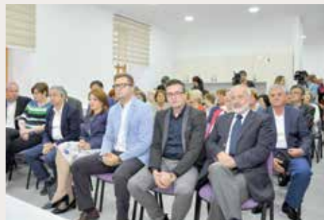
Sa svečanog otvaranja