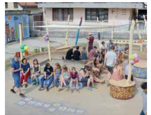
Igralište ima drveni mobilijar