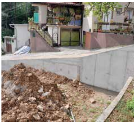
Boguševac do broja 50