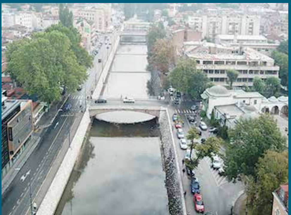
Uređeno korito od Drvenije do brane Bentbaša

Za ove poslove angažovana je firma Klico trans gradnja. Važno je istaći da izvođač garantuje rok izvođenja u trajanju od deset godina, tačnije da u tom periodu neće doći do ponovnog zarastanja zidova korovom i travom.