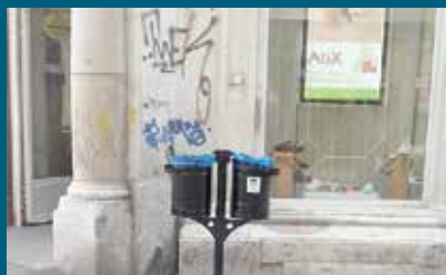
Duple korpe za otpad

Projekt postavljanja kanti za otpad s oko 7.000 KM finansirala je Općina Stari Grad.