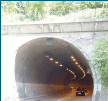
Zaštitna ograda na tunelu

oštećenja potpornog zida u ulici Braće Eskenazi. Urađeno je fugovanje i malterisanje, koje će spriječiti obrušavanje zida na ulicu, što bi ugrozilo kretanje pješaka i saobraćaj.