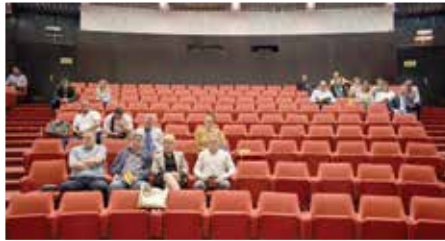
Samo pet tačaka dnevnog reda