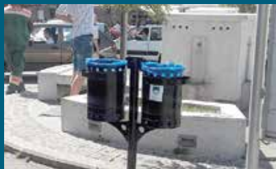
Na 15 lokacija postavljene korpe

U užem starogradskom jezgru, na Baščaršiji i ulici Ferhadija, ovog ljeta postavljene su kante za otpad na 15 lokacija čime je riješen problem odlaganja manjeg otpada u naprometnijem dijelu Starog Grada. Iz Službe za komunalne poslove pojasnili su da je na devet lokacija izvršena zamjena postojećih korpi. „Na devet lokacija korpe su bile stare i oštećene, te su narušavale izgled općine. Zamijenili smo ih novim, tzv duplim korpama“. Pored tih, korpe su stavljene na još šest lokacija za koje se ukazala potreba za sistemskim odlaganjem otpada.