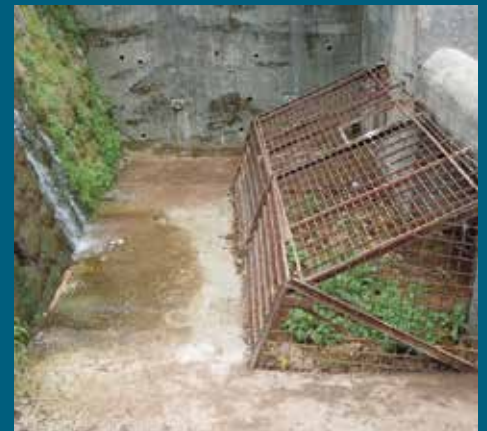
Očišćen Bistrički potok

U okviru akcije uklanjanja ruševnih objekata u vlasništvu Općine Stari Grad, uklonjene su ruševine u ulicama Okrugla broj 18 na Mahmutovcu, Mustafa Dovadžije na brojevima 23 i 26 na Vratniku, Hrvatini broj 6 na Bistriku, a u toku je uklanjanje na Kovačima na