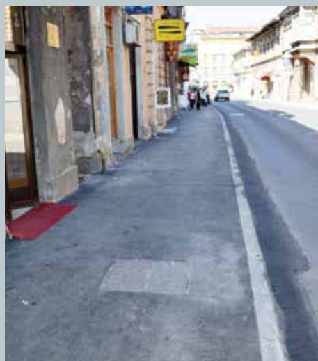
Trotoari u ulici Mula Mustafe Bašeskije