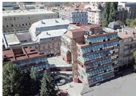
Data saglasnost za kreditna sredstva

Općina će kreditna sredstva utrošiti na zamjenu stolarije, zamjenu rasvjetnih tijela, fasaderske, izolaterske i limarske radove,