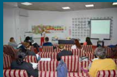
U projekat uključeno pedeset gradova

Općina Stari Grad jedna je od deset bh. općina koje su uspješno ocijenjene i odabrane za učešće u implementaciji ReLOaD projekta.