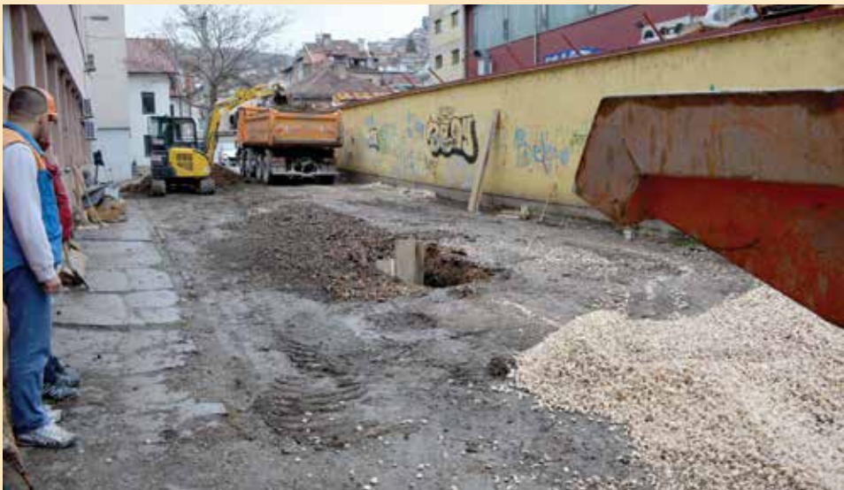
Zaustavljen prodor vode u podrumskoj prostoriji

Prodor površinskih i procjednih voda u podrum Doma zdravlja Stari Grad neće više predstavljati problem u ovoj ustanovi. Općina Stari Grad je odlučila djelovati i finansirati radove koji će zaštititi podrum najznačajnije zdravstvene institucije na svojoj teritoriji.