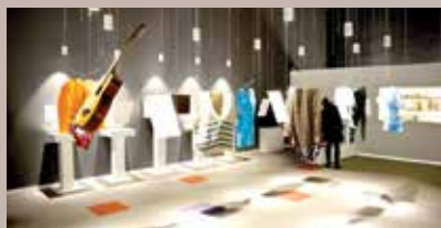
Postavka u muzeju

Muzej ratnog djetinjstva, prvi ovakve vrste u svijetu, koji se nalazi u starogradskoj ulici Logavina 32, u februaru je zvanično otvoren za posjetitelje. Muzej ratnog djetinjstva je jedinstvena institucija, jer se jedini u svijetu bavi isključivo odrastanjem i iskustvima djece u ratu. Ovim je dodatno obogaćena muzejska ponuda na području općine Stari Grad gdje se već nalazi Galerija 11/07/95, Muzej posvećen ratnim i civilnim zarobljenicima 92-95, te mnogi depadansi Muzeja grada Sarajeva.