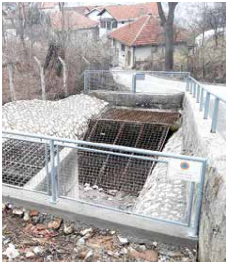
Kolektor na Komatinu

Ukoliko bude usvojen Prijedlog Zakona o izmjenama i dopunama zakona o zaštiti i spašavanju ljudi i materijalnih dobara od prirodnih i drugih nesreća, koji je u ime Vlade FBiH predložila Federalna uprava civilne zaštite, moglo bi doći do potpunog urušavanja sistema civilnih zaštita na nivou općina. Zajednički je ovo stav koji su iznijeli načelnici i pomoćnici načelnika općina Kantona Sarajevo: Stari Grad, Centar, Novo Sarajevo, Novi Grad, Ilidža, Vogošća, Ilijaš i Trnovo, na sastanku održanom u Općini Stari Grad. U predloženim izmjenama zakona sporno je ukidanje namjenskih sredstava u iznosu od 0,5% koje svi građani FBiH izdvajaju za civilnu zaštitu, a koje se sakupljaju na namjenskom računu i troše se isključivo za potrebe civilne zaštite. To znači da bi ukidanje ove naknade dovele do toga da općine ne bi imale sredstva koja se usmjeravaju direktno na zaštitu ljudi i materijalnih dobara od elementarnih nepogoda, požara, poplava, klizišta i sl. Na sastanku je iznesena činjenica da su upravo ove pojave u našoj zemlji intenzivirane posljednjih godina, te da su se sredstva iz civilnih zaštita usmjeravala za saniranje posljedica poplava, klizišta, požara, sniježnih padavina i slično, a prema iskustvima iz prošlosti niko ne može garantovati da se takve nepogode neće ponoviti.