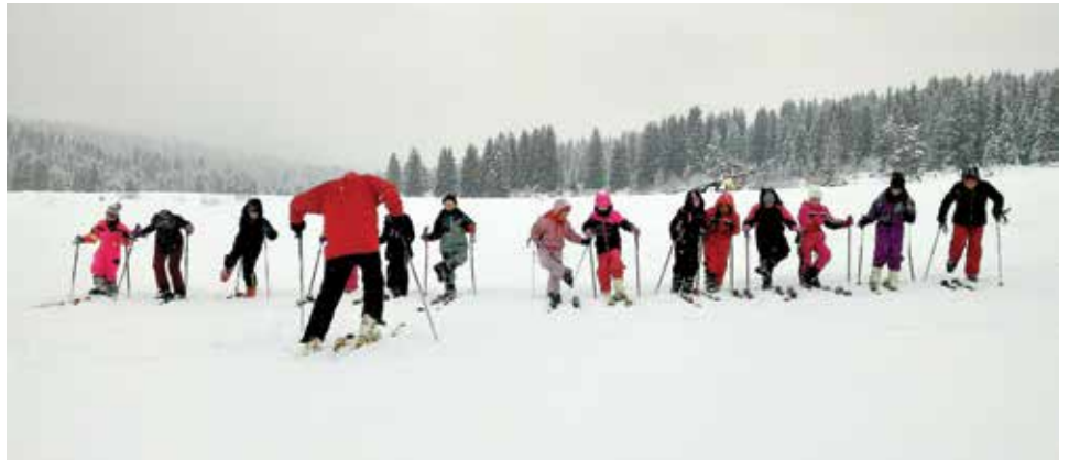
Učenici sa instruktorima na Igmanu

Više od stotinu starogradskih osnovaca ove zime je besplatno zimovalo na Igmanu i pohađalo školu skijanja kroz projekat Igman 2017, koji je realizovala Služba za obrazovanje, kulturu i sport Općine Stari Grad. Projekat je završen u januaru, a svi polaznici su dobili diplome kao potvrdu da su naučili skijati.