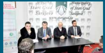
Otvoreni sastanak sa građanima