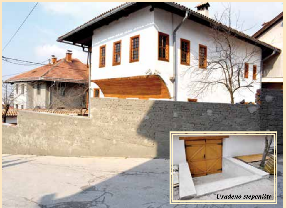
Popločane ulazne stepenice i izgrađen zid oko kuće

Četvrta faza podrazumijeva popločavanje ulaznih stepenica i izgradnju ogradnog uličnog zida oko Saburine kuće. Kako je kazao Pavle Mašić, iz Zavoda za zaštitu kulturno-historijskog i prirodnog naslijeđa Kantona Sarajevo, radovi su počeli prošle sedmice, a do sada je završeno popločavanje ulaznih stepenica. Za ove radove izdvojeno je oko 43.000 maraka, Općina Stari Grad je uložila 20.000 KM, a ostatak Zavod za zaštitu kulturno-historijskog i prirodnog naslijeđa Kantona Sarajevo. Inače, od početka ovog projekta, Općina Stari Grad je za sanaciju, rekonstrukciju i restauraciju Saburine kuće izdvojila preko 240.000 KM. Izvođač radova je firma „Neimari“ iz Sarajeva.