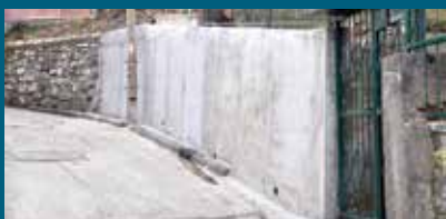
Izgrađeno 10 metara zida

Saniran je kameni potporni zid u ulici Iza bašče do broja 2, na Mahmutovcu.