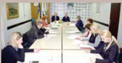
Štab civilne zaštite

Opštinski štab civilne zaštite usvojio je okvirni plan korištenja sredstava posebne naknade za zaštitu od prirodnih i drugih nesreća za 2017. godinu. U planu korištenja je predviđeno ubiranje prihoda na osnovu naknade za zaštitu i spašavanje u iznosu od 550.000 KM u 2017. godini. Međutim, kako je Vlada FBiH predložila izmjene Zakona o zaštiti i spašavanju od prirodnih i drugih nesreća kojim bi se ukinula naknada od 0,5% za ove namjene, Štab je naglasio da je neizvjesno da li će ova sredstva biti uplaćena Općini, te kakav će biti ishod predloženih izmjena Zakona.