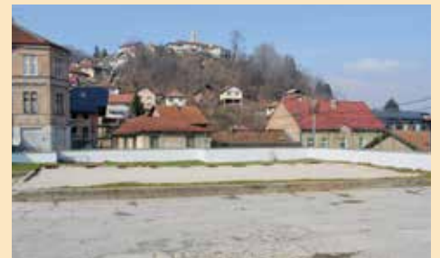
OŠ "Edhem Mulabdić" - tamponirana podloga

Grad da se na ovoj lokaciji razmotri mogućnost izgradnje dječijeg igrališta. Preduzeće „Mavas“ d.o.o. iz Mrkonjić Grada odlučilo se uključiti i donirati vještačku podlogu za vanjski teren veličine 20x10 metara. Vrijednost podloge iznosi oko 12.000 KM, a radovi na njenom postavljanju početi će čim se poboljšaju vremenski uslovi. Igralište će dobiti i potrebni mobilijar, te ogradu, tako da će ukupna vrijednost projekta iznositi