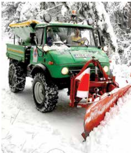
Očišćen snijeg sa puteva