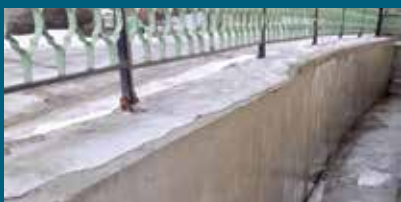
Zid bio dotrajao

Na Mahmutovcu, u ulici Kamenica čikma 61, saniran je dotrajali potporni zid. Uz stambeni objekat u pomenutoj ulici, nalazio se stari armirano-betonski potporni zid, koji je hitno trebao sanaciju. Radovi su počeli razbijanjem betonskog trotoara oko objekta, nakon čega se izvršio iskop od 50 cm za temelj novog zida i prostor gdje se postavila drenažna cijev sa filter materijalom i odgovarajuća armatura za zid. Potom je uslijedilo betoniranje novog potpornog zida dužine deset i visine dva metra, te trotoara i stepeniša oko objekta. Radove je izvodila firma Neimari d.o.o. Sarajevo, a finansirala Općina Stari Grad sa 10.200 KM.