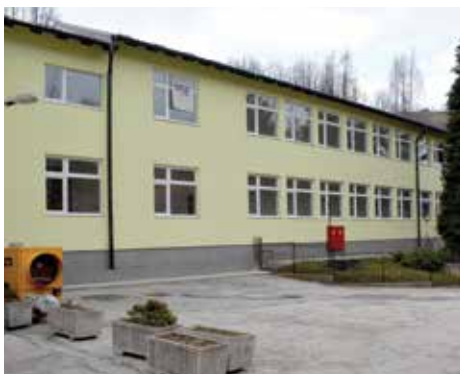
Vanjski izgled objekta

Direktorica škole Erzumana Fukelj kazala je da će novi objekat dosta olakšati rad u školi. „Našu školu pohađaju 292 učenika i svi oni su s nestrpljenjem čekali ovaj dan i ulazak u nove učionice. Dosad su učenici boravili u improviziranim kabinetima, što je zasigurno uticalo na kvalitet nastave. Sada su svi kabineti dobili potpuno novi namještaj i urađeni su po najvišim evropskim standardima,“ kazala je direktorica.