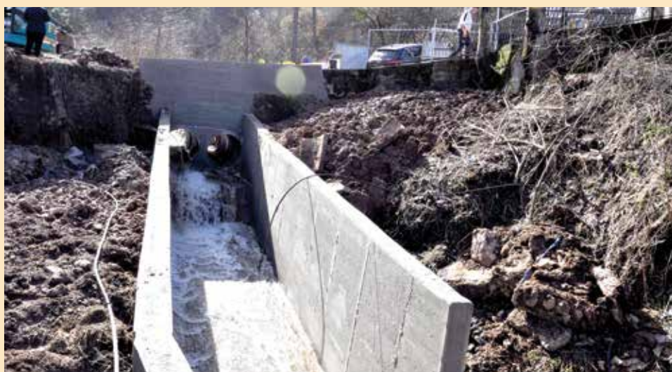
Izgrađena dva potporna zida i urađeno korito

Poboljšanjem vremenskih prilika, na ovom lokalitetu se nastavilo sa radovima sanacije propusta Bistričkog potoka. Kamenom je ozidano čelo propusta, a postavljene su dvije propusne cijevi mnogo većih propusnih dimenzija (Ø1000), za razliku od prethodne jedne, koja je imala