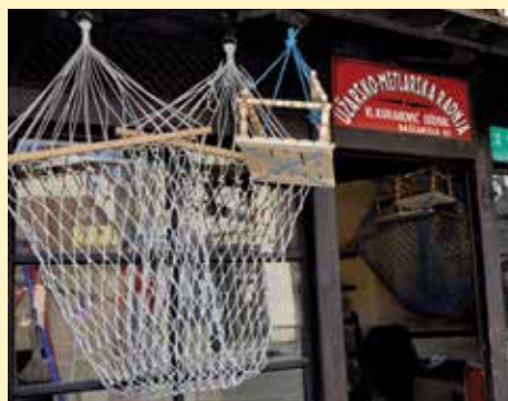
Jedna od ispletenih mreža

Jedna gospođa mi je došla nakon trideset godina i donijela ljuljačku koju sam joj napravio. Jedina šteta koja se desila bila je od strane zeca koji je presjekao uže na ljuljački na nekoliko mjesta. Žena mi je poklonila ljuljačku pa sam je izložio u radnji. Kad je pogledam zapitam se zar je moguće da je taj materijal toliko jak da je ostao nepromijenjen trideset godina.