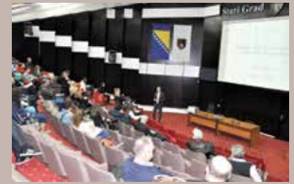
Turistički djelatnici razmijenili iskustva

Počele su pripreme za izradu prve Strategije razvoja turizma Općine Stari Grad, u okviru kojih su održane tematske radionice. Radionice su bile prilika da se turistički radnici iz Starog Grada susretnu i razmijene iskustva, te definišu zajedničke probleme. Kroz radionice je bilo govora o tome kako da se Općina uključi u poboljšanje situacije i pružanje što bolje usluge turistima, znajući njihovu ogromnu važnost za cijelo područje općine i njene stanovnike. Najviše govora je bilo o gorućem problemu nedostatka parkinga u užem starogradskom jezgri, gdje turisti provode najviše vremena. Mnogo riječi je bilo i o tome kako spriječiti učestalo džeparenje, krađu vozila, prosjačenje, što odvraća turiste od posjete našoj općini. Radionice je vodio prof. dr. Almir Peštek, inače profesor na Ekonomskom fakultetu u Sarajevu, kojeg je Općina angažovala za konsultantske usluge pri izradi Strategije. On je istakao da su smjernice za izradu Strategije razvoja turizma već date u Strategiji lokalnog razvoja Općine Stari Grad, te pohvalio nastojanja Općine kazavši da je ovo jedan od pionirskih poduhvata u BiH. Prisutnima je naglasio da će od njihovih ideja, projekata i kreativnosti zavisiti ishod Strategije turizma. Izrada Strategije razvoja turizma bi trebala trajati četiri mjeseca, a nosilac kompletne aktivnosti u ovom projektu je općinski Sektor za lokalni razvoj.