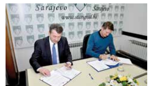
Potpisivanje sporazuma o dodjeli granta

pozorištem čije su predstave posjećivali starogradski osnovci, ali i srednjoškolci. Najavljen je nastavak ovih projekata i u 2017. godini.