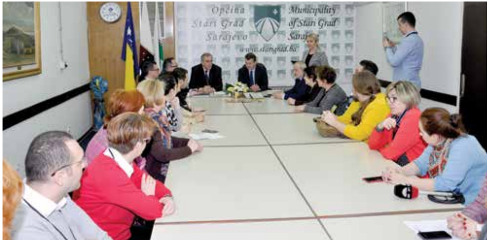
Sa dodjele certifikata

„Mi smo jedni od rijetkih, ako ne i prva općina u FBiH, koja je stekla certifikat ISO 9001:2015, što će zasigurno još više unapri-