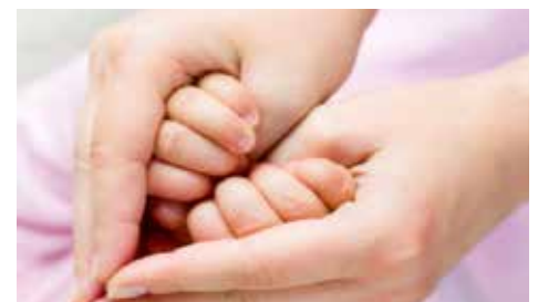
Pravo imaju porodilje iz Starog Grada

od ovog pravila od jedne godine boravka mogu biti porodilje koje su stupile u brak sa muškarcem koji ima prebivalište u Starom Gradu duže od jedne godine. Zahtjev za ostvarivanje prava na jednokratnu novčanu pomoć podnosi se najviše 60 dana od rođenja djeteta.