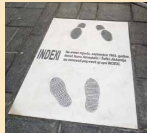
Mjesto na kom su nastali Indexi

Zaključak o postavljanju spomen-ploče „Indexima“ donijelo je Općinsko vijeće Stari Grad, koje je i predložilo lokaciju, te zadužilo načelnika i općinske službe da poduzmu sve potrebne aktivnosti na njegovoj realizaciji.