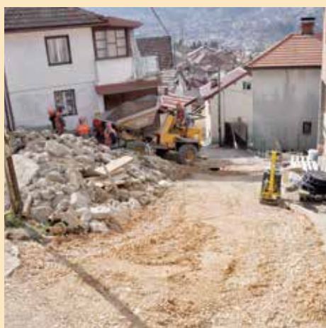
Izmjena cijevi za kanalizaciju

Stanovnici tvrde da je, pored problema sa cijevima, ulica često znala biti obrasla većim količinama trave. Zbog popucane, izrovane kaldrme i makadamskog puta, u ovoj ulici je zbog vode rasla velika količina trave koju su stanovnici ulice morali redovno uklanjati. Rješenje njihovog problema se konačno nazire, pa su građani sretni zbog radova, a naročito zbog brzine kojom napreduju. Iz Službe za investicije, plan i analizu Općine Stari Grad su kazali da će ovaj projekat