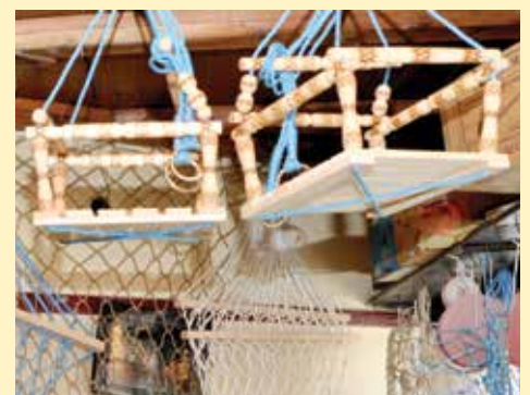
Ljuljačke kakve su se nekad pravile