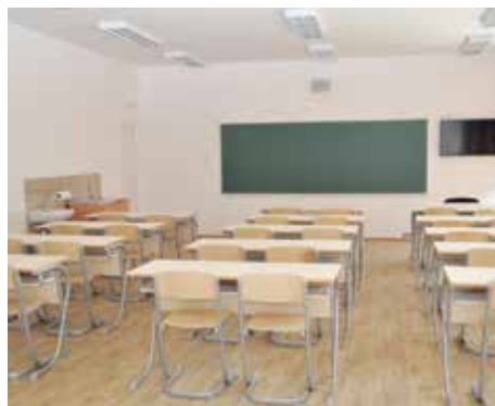
Učionice u novoj školi