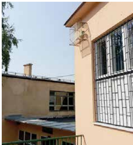
OŠ "Šejh Muhamed ef. Hadžijamaković"

N astavljajući podršku školskim ustanovama na svom području, jer je sigurnost djece i obezbjeđenje povoljnih uslova za njihov boravak u školama jedan je od prioriteta ove lokalne zajednice, Općina je počela realizaciju projekta uvođenja video nadzora u deset škola na svom području. Video nadzor uvodi se u škole: „Edhem Mulabdić” (tri objekta), “Mula Mustafa Bašeskija” (dva objekta), “Šejh Muhamed ef. Hadžijamaković”, “Hamdija Kreševljaković”, “Vrhbosna”, “Saburina” i Zavod Mjedenica, te srednje škole: Srednja škola za tekstil, kožu i dizajn Sarajevo, Srednja škola poljoprivrede, prehrane, veterine i uslužnih djelatnosti Sarajevo i Srednja muzička škola. Sistem video nadzora u svim školama bit će uvezan sa Policijskom stanicom Stari Grad gdje će se vršiti 24-erosatni nadzor. “Ovim projektom mi postajemo prva općina u Kantonu Sarajevo, a možda čak i u cijeloj BiH, koja je sve svoje osnovne i srednje škole 'pokrila' video nadzorom i isti povezala sa policijskom stanicom, koja će vršiti kontrolu događanja u i oko škola zajedno sa školskim rukovodstvom. U ovoj fazi će biti postavljeno između 90