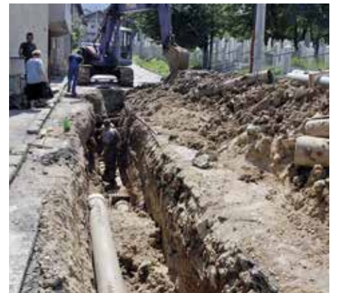
Komatin, rekonstrukcija kanalizacione mreže