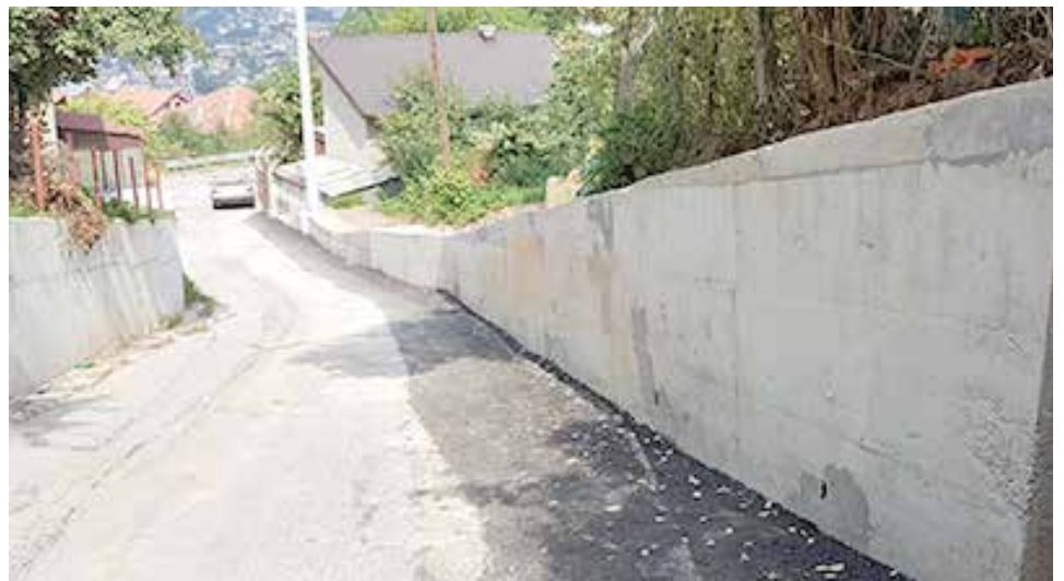
Nadlipe - zid dug 48 metara