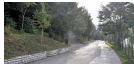
Redovno održavanje Aleje

dionici od platoa na Darivi do Kozije ćuprije, a zbog pojave zmija pogošen je i plato na Darivi.