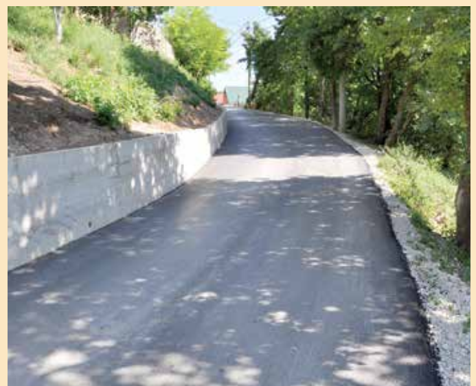
Jarčedoli, ulica u dužini od 810 m