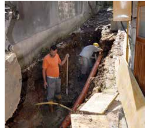
Mahmutovac od broja 33-57

U ulici Mahmutovac od broja 33 do broja 57 u julu ove godine urađena je rekonstrukcija vodovodne i kanalizacione mreže. Na ovom dijelu postavljeno je 30 metara oborinskog i fekalnog cjevovoda, novi šahtovi i betonske rešetke. Stara i oštećena kaldrma u dužini od 130 metara uklonjena je i ulica je asfaltirana. Ove radove Općina je finansirala iznosom od 145.000 KM (rekonstrukcija mreže i asfaltiranje), a izvođač je bila firma „Mibrall“ iz Sarajeva.