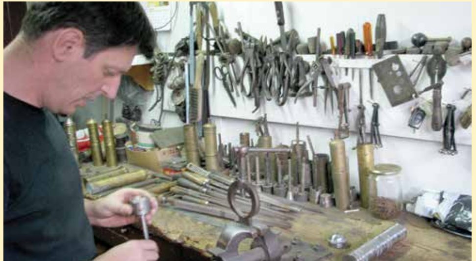
Jagnjo se ovim poslom bavi iz ljubavi i da očuva tradiciju

Nekada je ovo bila jedina radnja ove vrste u Jugoslaviji