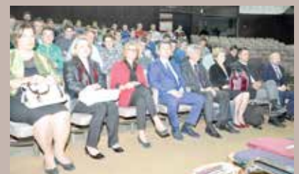
Sa predstavljanja fudbalske lige

Fudbalska liga osnovnih škola Starog Grada igra se već treću godinu, a najbolje selekcije, najbolji igrači, najbolje fair-play selekcije itd dobijaju pehare i novčane nagrade. Prvoplasirana ekipa je prošle sezone bila nagrađena i dvodnevni izletom u Dom Šumarskog fakulteta na Igmanu.