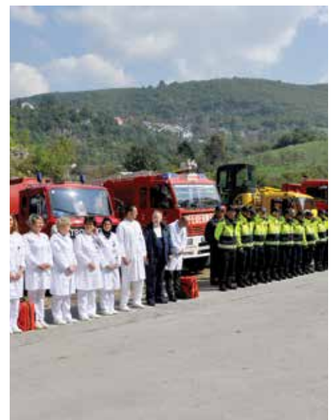
Predstavljeni timovi i oprema