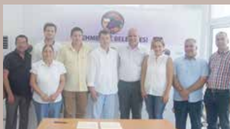
Sa potpisivanja Ugovora o bratimljenju

i predsjednik Sjevernog Kipra Mustafa Akinci, su otvorili 56. Festival grožđa u Mehmetçiku, jedan od najpoznatijih i najstarijih festivala na Sjevernom Kipru. Općina Mehmetçik je jedna od najrazvijenijih općina na otoku, poznata kao destinacija visokog turizma i uzgoja grožđa.