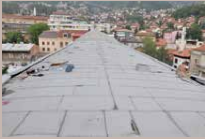
Novi krov Akademije

Zbog oštećenog limenog krova i oluka, ANU BiH je hitno trebala sanaciju, jer je prilikom padavina dolazilo do konstantnog prokišnjavanja u unutarnje prostorije. O tom problemu je upoznata Općina Stari Grad koje je hitno djelovala, te je odlučila financirati radove sanacije u iznosu od 10.780 KM. Postavljeni su novi oluci, očišćen je kompletan krov, a zatim je premazan specijalnom Caparol bojom, koja će dugotrajno zaštititi krov i oluke od korozije. Postavljena je i zaštita za stepenice, čime je pristup krovu dodatno osiguran.