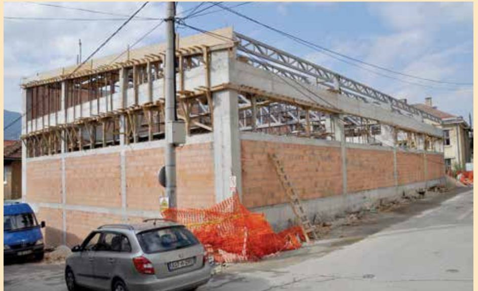
Izgradnja sportske sale u OŠ "Mula Mustafa Bašeskija"

Brojni projekti su u pitanju, a evo da krenemo od nove sportske sale koju gradimo u OŠ "Mula Mustafa Bašeskija", a koja će biti završena krajem oktobra, a njena vrijednost je 711.000 KM. Uz salu uredit ćemo i školsko igralište. Upravo je završena zgrada na Baruthani za interno raseljene u koju smo uselili 11 porodica, a koju smo gotovo potpuno sami izgradili. Njena vrijednost je oko 1,2 miliona maraka, sa zemljištem i svim potrebnim dozvolama, a kantonalno Ministarstvo za socijalnu politiku je od toga doniralo svega 180.000 KM. Rekonstrukcija glavnog vodovodnog cjevovoda u ulici Obala Kulina bana također je finansirana našim sredstvima u iznosu od 450.000 KM. Samo za uvođenje nove kanalizacije i vodovodne mreže na Mahmutovcu, Komatinu i ispod Višegradske kapije dali smo 400.000 KM, a sada radimo i vodovodnu mrežu na Komatinu što je dodatnih 85.000 KM. Počeli smo prošle godine rekonstrukciju ulice Strošići na Vratniku, a sad smo završili i preostala četiri kraka ove ulice. Za te radove je izdvojeno oko 600.000 KM. Završava se sanacija četiri najveća klizišta u Starom Gradu koja ćemo riješiti od sredstava civilne zaštite i izdvojili smo oko 300.000 KM za te namjene.