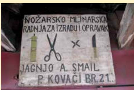
Turisti oduševljeni ovom reklamom

i oni su skuplji i kvalitetniji. Valjda zato su kod nas žuti mlinovi bili češći. Gravura na mlinovima nekada se pravila u Gornjem Vakufu.“ Dodaje da ništa više nije kao prije i da se ovim poslom odavno prestao baviti iz koristi i radi zarade, jer radnja opstaje samo zahvaljujući povlasticama koje ostvaruje od države i općine. Radi iz ljubavi prema ovom poslu i čuva uspomenu na na svog oca i dedu.