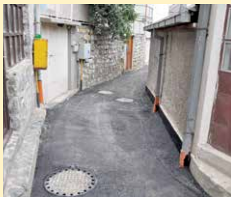
Krak ulice Strošići