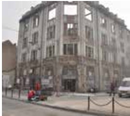
Riješen status bivšeg Feroelektra

Usvajanjem zaključka u vezi sa rješavanjem statusa zgrade bivšeg Feroelektra, u ulici Mula Mustafe Bašeskije broj 16, nakon sedamnaest godina riješen je problem ovog ruševnog objekta u samom centru grada. Ostaci ovog objekta uklonjeni su prije nekoliko mjeseci kada je Zlatko Krainović, inače raniji vlasnik 35 % objekta, prodao svoj dio investitoru "KOL" društvu sa ograničenom odgovornošću za trgovinu koje je investiralo izvedene radove. Općinsko vijeće Stari Grad prihvatilo je na 41. sjednici ponudu za prodaju općinskog udjela od 65% po pravu preče kupovine, društvu "KOL", za iznos od 3 miliona konvertibilnih maraka. Također, usvojen je zaključak da se od dijela sredstava ostvarenih prodajom finansira završetak izgradnje dječijeg igrališta na Obhodži, zatim