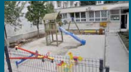
Igralište ispred Doma kulture

Novo igralište se sastoji iz dva dijela, prvi dio ima gumenu podlogu (gumene kocke) na kojoj su instalirani tobogan i dvije ljujačke. Drugi dio je pokriven šljunkom i tu je postavljena metalna klackalica i dvije njhalice. Također na igralištu se nalaze i dvije drvene klupe za odmor i dva koša za smeće, a ove radove je radila firma Bosman d.o.o. Sarajevo. Na ulazu u igralište postavljena je tabla na kojoj piše: "... Poklanjamo vam ovo igralište za igru, zabavu i druženje. Budimo odgovorni i čuvajmo igralište od uništavanja. Za ljepšu sadašnjost i budućnost naše djece!