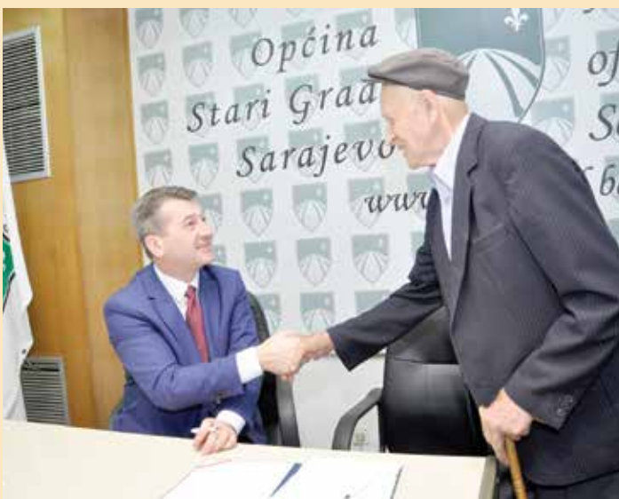
Za pomoć u sanaciji kuća 58.000 KM

Uradili smo mnogo i o tome najbolje govore djela i projekti na terenu. Ali, nikada nemoj ostavljati stvari onakvim kakve jesu već uvijek pokušavaj popraviti nešto i napredovati – to je moto kojim se vodimo. Stari Grad je najljepša sarajevska općina, a moja želja je da bude i najugodnija za život. Zadovoljan sam urađenim u proteklih osam godina, a siguran sam ukoliko se u Starom Gradu nastavi trend rasta i razvoja, on vrlo lako može postati jedna od najjačih lokalnih zajednica u državi sa stabilnim budžetom, poboljšanom infrastrukturom, novim objektima i kvalitetnim uslovima života.