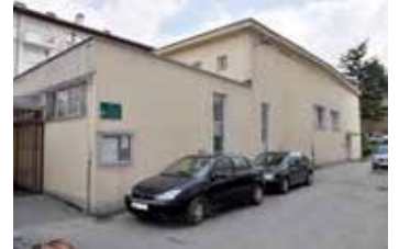
Prostor za muzej ratnog djetinjstva

Općinsko vijeće Stari Grad je na 42. sjednici usvojilo prijedlog odluke o dodjeli u zakup poslovnog prostora u ulici Logavina br.32 Udruženju građana "Urban", a u svrhu realizacije projekta osnivanja Muzeja ratnog djetinjstva.