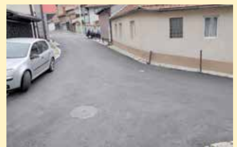
Ploča i Hadžijamakova