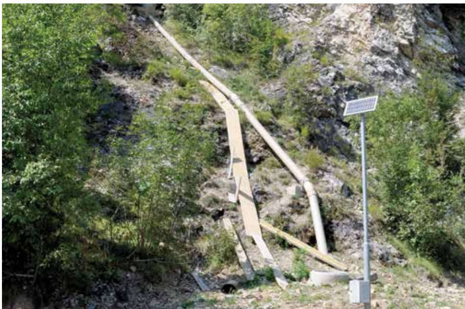
Ispod Višegradske kapije - druga trasa

Na Širokači je, u najprometnijoj ulici ovog naselja, ulic Komatin, izgrađena nova separatna kanalizaciona mreža u dužini od 230 metara. Građani ove ulice su imali dugogodišnji problem sa dotrajanim i popucanim kanalizacionim cijevima, a radovi su se odvijali na dijelu od prostora Mjesne zajednice Širokača do ulice Sutorinska. Izmijenjena je kompletna fekalna i kišna kanalizacija, te postavljeni ulični slivnici za odvodnju. Postavljene su nove cijevi i šahtovi, a osigurani su i novi priključci za 50-ak domaćinstava. Ovaj projekt je Općina finansirala iznosom od 100.000 KM, a odmah nakon ovih radova pristupilo se i rekonstrukciji vodovodne mreže (80.000 KM) u ulici Komatin, nakon čega će kompletna dionica biti asfaltirana (100.000 KM).