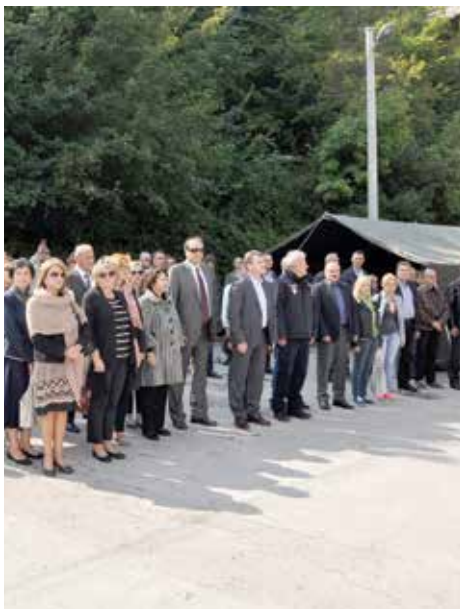
Smotra održana pred velikim brojem gostiju

U cilju provođenja mjera zaštite i spašavanja ljudi i imovine na području ove općine, kako bi što spremnije dočekali eventualne prirodne i druge nesreće, ili djelovali preventivno, Općina Stari Grad je početkom godine formirala službe zaštite i spašavanja. Služba za obezbjeđenje i zaštitu je Policijska stanica Stari Grad i broji 50 članova, službu medicinske pomoći čine dva tima Doma zdravlja Stari Grad, službu za zaštitu i spašavanje od požara čini 20 pripadnika Dobrovoljnog vatrogasnog društva “Vratnik”, a služba za zaštitu i spašavanje od rušenja je firma Klico Trans gradnja d.o.o. koja raspolaže neophodnom mehanizacijom za ove svrhe.