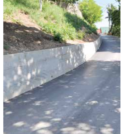
Jedan od pet zidova na Jarčedolima - 55 metara

Na Širokači je izgrađen 48 metara dug novi potporni zid, u ulici Nadlipe. Izgrađeno je osam kampada zida po šest metara i prosječne visine od 0,60 m do 1,80 m, a sve u cilju sprječavanja daljnjeg obrušavanja terena. Izgradnju zida finansirala je Općina Stari Grad sa oko 20.500 KM, a izvođač je bila firma „Sela“ iz Sarajeva.