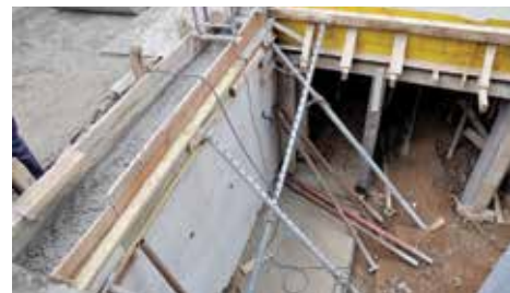
Ispod grada - 10 metara

Na Vratniku je izgrađen novi potporni zid, u ulici Ispod grada br.25. Zid, koji je sagrađen u cilju sprječavanja obrušavanja, te zaštite stanovnika i njihove imovine u ovoj ulici, dug je 10 metara i prosječne visine 2,70 metara. Radove je izvodila firma „Debos“, a koštali su oko 11.300 KM.