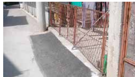
Sulejmana Zolja - 4 metra

U ulici Sulejmana Zolja do broja 11 izgrađen je zid s donje strane ulice, u dužini od četiri metra. Ovaj zid je izgrađen da bi se saobraćaj u ulici bezbjedno odvijao. Radovi su koštali oko 3.500 maraka, a izveo ih je „Bosman“ iz Sarajeva.