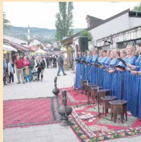
Festival održan na Bašćaršijskom trgu

Svečanim koncertom eminentnih umjetnika 10. maja je na Bašćaršijskom trgu zatvoren festival „Doajeni sevdalinke“, čime su završeni Dani Općine Stari Grad.