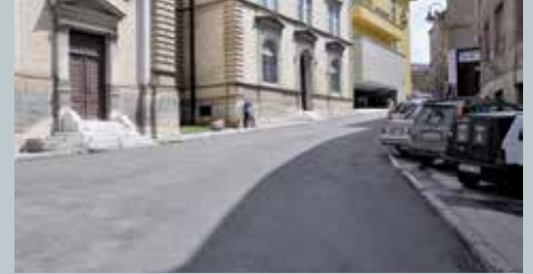
Dio ulice kod Vrhbosanske bogoslovije

Novi asfalt u ulici Josipa Štadlera kod Vrhbosanske katoličke bogoslovije i teologije postavljen je u dužini od 87 metara, prosječne širine od sedam do osam metara. Radovi su koštali 72.900 KM.