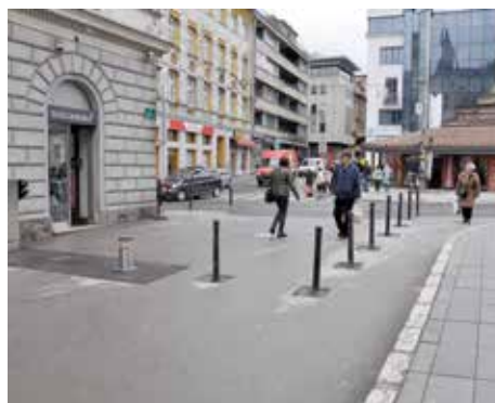
Ulaz kod Katedrale