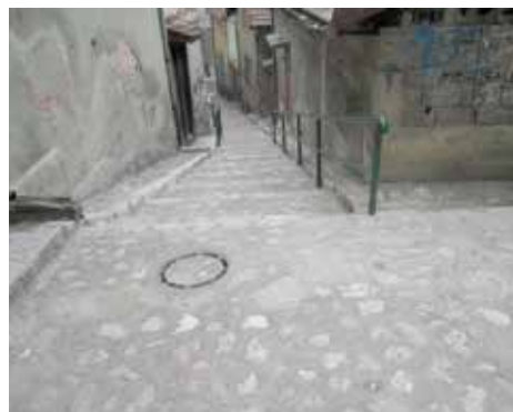
Sanirana kaldrma Na varoši

U ulici Na varoši urađena je sanacija kamenog stepeništa. Tokom radova, usljed obrušavanja, ukazala se potreba i za gradnjom potpornog zida, dimenzija 10 metara dužine i prosječne visine od 1,5 metra. Nakon toga, sanirano je više od 103 metra kvadratna kaldrme. Radovi su koštali oko 15.000 KM, a finansirala ih Općina.