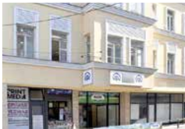
Naplata od zakupnina skoro 6,5 miliona KM

Vijećnici su jednoglasno usvojili i Prijedlog odluke o utvrđivanju visine naknade za građevinsko, poljoprivredno i gradsko građevinsko zemljište za 2016. godinu, Prijedlog odluke o visini naknade za pogodnosti gradskog građevinskog zemljišta – rente na području