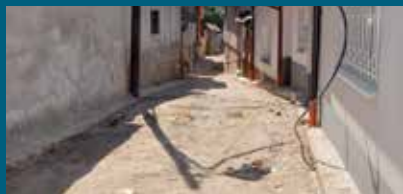
Radovi u toku u Strošićima

Postavljena je kanalizaciona i vodovodna mreža u sva četiri kraka ulice Strošići, potvrđeno je iz Službe za investicije, plan i analizu Općine.