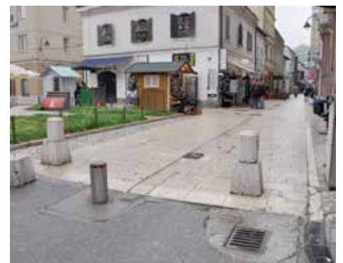
Ulaz u ulicu Kundurdžiluk