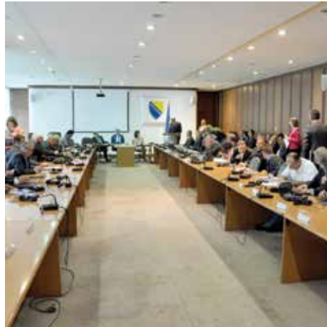
Sa prošlogodišnjeg potpisivanja Memoranduma

Općina Stari Grad, kao potpisnik Memoranduma o razumijevanju s ciljem podrške radu ustanova kulture od općeg značaja i interesa za BiH, uplatila je planirana sredstva za ove namjene na račun Muzeja književnosti i pozorišne umjetnosti BiH. Memorandum je prošle godine potpisalo 35 predstavnika različitih insti-