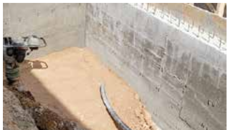
Kamenica - 13 metara

Na Mahmutovcu je izgrađen je armirano-betonski potporni zid, u ulici Kamenica do broja 30. Radove je finansirala Općina u iznosu od 14.000 KM. Zid dužine 13 metara i prosječne visine 2,5 metra, izgradila je firma „Bosman“.