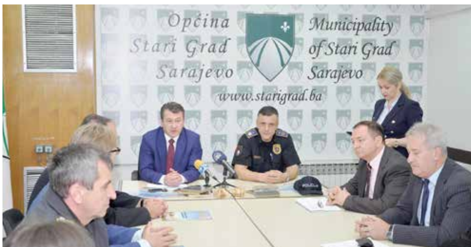
Spremni za novu turističku sezonu

"Kanton Sarajevo je prošle godine posjetilo oko 350.000 turista, a najposjećenije mjesto u Kantonu Sarajevo je općina Stari Grad. Od ukupnog broja gostiju, njih 77 % posjeti Bašćaršiju. Turisti nas vide kao zemlju bogatu kulturno-historijskim naslijeđem i zbog toga najviše posjećuju stari dio grada. Naša je procjena da će ovo biti jedna dobra turistička sezona za Kanton Sarajevo," kazao je Džeko.