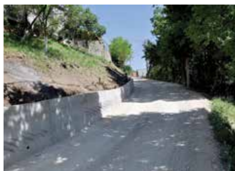
Jarčedoli - 55 metara