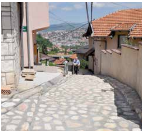
U Pastrmi nova kaldrma i zid

Sanirana je kaldrma i u ulici Pastrma od broja 9 do broja 56, u mjesnoj zajednici Toka-Džeka. Popravljena je kaldrma površine oko 120 metara kvadratnih. Radove je izvela građevinska firma „Sela“ iz Sarajeva, a vrijednost investicije iznosila je oko 16.500 konvertibilnih maraka.