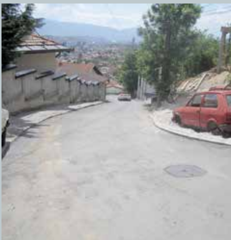
Završeno preostalih 200 metara

Dolaskom povoljnijih vremenskih uslova urađeni su radovi u ulici Alije Nametka na Sedreniku. U novembru, 2015. godine rekonstruisano je i asfaltirano 240 metara ove ulice, a u maju, 2016. godine urađena je sanacija i asfaltiranje preostalih 200 metara. Projekat je finansirala Općina sa oko 161.400 maraka.