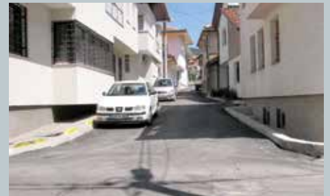
Nadmlini na Kovačima dobili novi asfalt

Sanirana je i lokalna ulica Nadmlini na Kovačima. Urađeno je tamponiranje, ravnanje, sanacija slivnih rešetki i šahtova i na kraju završno asfaltiranje. Projekat asfaltiranja ulice s oko 27.200 KM finansirala je Općina.