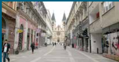
Popravljene ploče u Štrosmajerovoj

U sklopu tekućeg održavanja u aprilu ove godine uređeno je nekoliko pješačkih zona. Za ove projekte iz općinskog budžeta osigurano je oko 18.000 KM.