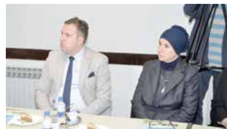
Skaka i Deljković na potpisivanju ugovora