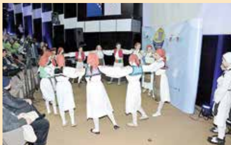
Učenici pripremili bogat program

Najmlađi građani Starog Grada i ove godine su dali značajan doprinos u obilježavanju Dana njihove općine. “Djeca na dar Općini” je manifestacija kojom su učenici starogradskih osnovnih škola predstavili bogat kulturno-muzički program, a održana je 05. maja u Velikoj sali. Predstavili su se brojnim predstavama, horskim nastupima, recitalima, plesom itd.