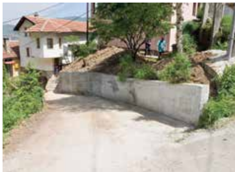
Boguševac čikma - 21 metar

Armirano-betonski potporni zid izgrađen je i u ulici Boguševac čikma. Projekat je finansirala Općina u iznosu od 9.600 KM, a radove je izveo „Set invest“ iz Sarajeva. Uklonjen je stari, dotrajali kameni zid i izgrađen novi dužine 21 metar, prosječne visine 2,60 metara.