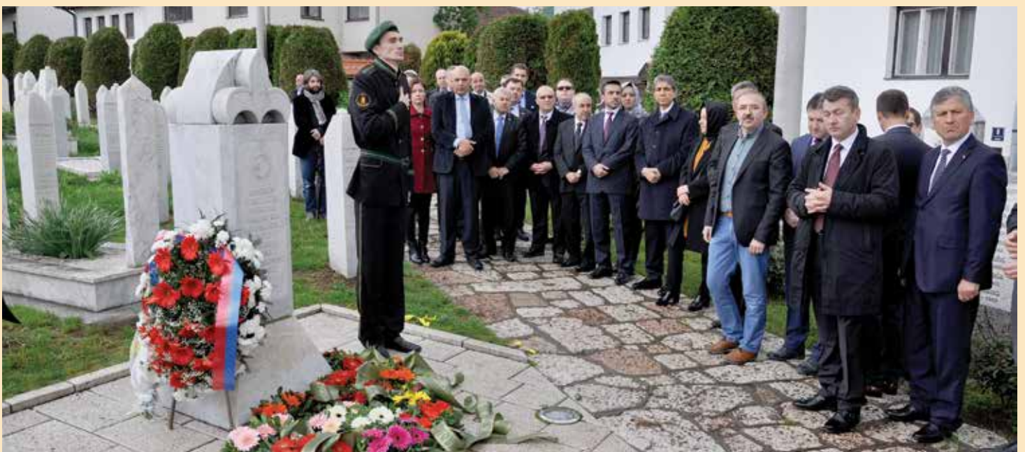
Delegacije prijateljskih općina i gradova odale počast na Šehidskom mezarju Kovači

Počast šehidima i poginulim borcima na mezarju Kovači odale su i delegacije pobratimskih općina i gradova koje su boravile u posjeti Starom Gradu. Delegacije koje su svojim dolaskom i boravkom uveličale obilježavanje Dana Općine Stari Grad i položile cvijeće na Kovačima su iz gradova: Bursa, Makarska i Buzet i općina: Fatih, Kepez, Umranije, Peć, Mehmetdžik, Osmangazi, Silivri i Bosanska Krupa.