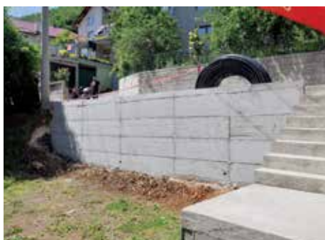
Jarčedoli - 10 metara