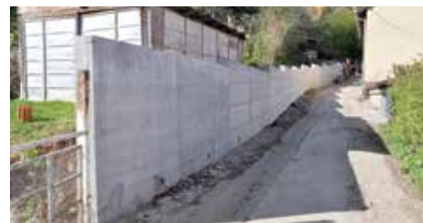
Močila - 50 metara

Izgrađen je potporni zid u ulici Močila, na području mjesne zajednice Hrid-Jarčedoli. Novi zid je dug oko 50 metara i prosječne visine oko 2 metra. Izgradnju potpornog zida finansirala je Općina iznosom od 20.300 KM. Radove je izvodila firma KJKP „Rad“.