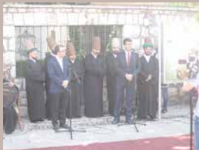
Prisutnima se obratio Mustafa Dündar

Delegacija Općine Osmangazi iz turskog grada Bursa na čelu sa načelnikom Mustafom Dündarom posjetila je 27. maja Baščaršijski trg. Delegacija je boravila u našoj zemlji radi odlaska na Ajvatovicu, najveće muslimansko svetište u Evropi, a posjetu su iskoristili kako bi obišli Baščaršijski trg čiju su rekonstrukciju sufinansirali. Podsjećamo, projekat obnove Baščaršijskog trga, koji je svečano otvoren u decembru prošle godine, finansirali su u jednakim omjerima Općina Stari Grad Sarajevo i pobratimska Općina Osmangazi iz Republike Turske. Implementator projekta bila je Turska uprava za međunarodni razvoj i saradnju (TIKA), a projekat je koštao oko 1,2 miliona konvertibilnih maraka. Načelnik Dündar je napomenuo da obnova Baščaršijskog trga nije jedini projekat koji su realizovali sa Općinom Stari Grad, te da definitivno neće biti posljednji; „Baščaršija je doživjela mnoge uspone i padove, ona sada raste, a tako će nadam se i nastaviti. U meni, kao i u ostatku naše delegacije, među kojima je i sin našeg predsjednika Recepta Tayyipa Erdoğan, imate iskrene prijatelje“, kazao je načelnik Dündar.