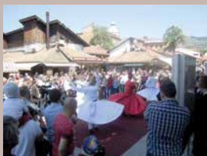
Na Trgu organizovan prigodan program

Delegacija Općine Osmangazi iz turskog grada Bursa na čelu sa načelnikom Mustafom Dündarom posjetila je 27. maja Baščaršijski trg. Delegacija je boravila u našoj zemlji radi odlaska na Ajvatovicu, najveće muslimansko svetište u Evropi, a posjetu su iskoristili kako bi obišli Baščaršijski trg čiju su rekonstrukciju sufinansirali. Podsjećamo, projekat obnove Baščaršijskog trga, koji je svečano otvoren u decembru prošle godine, finansirali su u jednakim omjerima Općina Stari Grad Sarajevo i pobratimska Općina Osmangazi iz Republike Turske. Implementator projekta bila je Turska uprava za međunarodni razvoj i saradnju (TIKA), a projekat je koštao oko 1,2 miliona konvertibilnih maraka. Načelnik Dündar je napomenuo da obnova Baščaršijskog trga nije jedini projekat koji su realizovali sa Općinom Stari Grad, te da definitivno neće biti posljednji; „Baščaršija je doživjela mnoge uspone i padove, ona sada raste, a tako će nadam se i nastaviti. U meni, kao i u ostatku naše delegacije, među kojima je i sin našeg predsjednika Recepta Tayyipa Erdoğan, imate iskrene prijatelje“, kazao je načelnik Dündar.