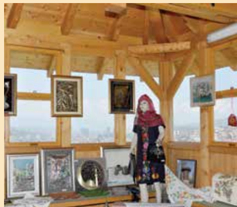
Radovi izloženi u Balkanskom mevlevijsko-istraživačkom centru

U Balkanskom mevlevijsko-istraživačkom centru održana je i ove godine izložba pod nazivom “Bosansko-tursko prijateljstvo”. Izložbu su 7. maja svečano otvorili načelnik Općine Stari