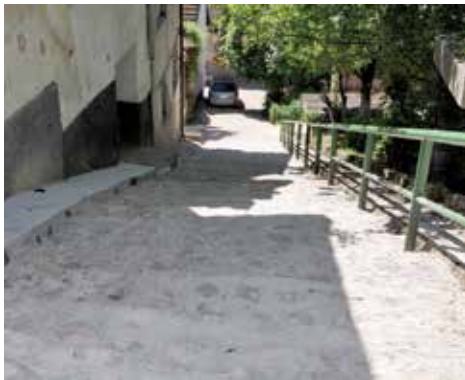
Na Širokači sanirano 110 m 2 kaldrme

Urađena je sanacija kaldrme u ulici Tale Ličanina na Širokači. S obzirom da je stepenište u ovoj ulici vrlo frekventno i građani ga često koriste, Općina se odlučila na popravku gazišta površine oko 110 metara kvadratnih. Radovi su koštali oko 14.000 KM, a izvođač je bila firma „Vindi tip“ iz Sarajeva.