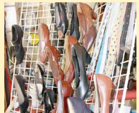
Najčešće mušterije su žene