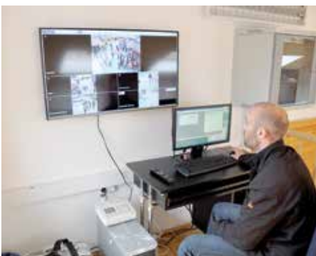
Centar za kontrolu

Na 40. sjednici Općinskog vijeća Stari Grad usvojen je Pravilnik koji propisuje postupak, način i uslove u vezi izdavanja odobrenja, odnosno kartica za ulazak vozila u pješačku zonu, kao i uslove za prijevoz tereta dostavnim vozilima. Cijena kartice na godišnjem nivou iznosi 150 KM + PDV.