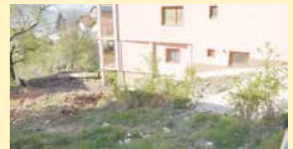
Ucijevljen lokalni potok

Radovi na regulaciji lokalnog potoka uz glavnu saobraćajnicu na Sedreniku su urađeni početkom aprila. Lokalni potok je ucijevljen i usmjeren u Ramića potok, te je izvršena njegova regulacija u ukupnoj dužini od 80 metara. Na ovom dijelu je u vrijeme obilnijih padavina, te u zimskom periodu, često dolazilo do plavljenja, te oštećenja okolnih objekata, pa je ucijevljenje bio jedini način rješavanja problema. Općina je za ove namjene izdvojila oko 7.000 KM, a radove je izvela firma „Set invest“ iz Sarajeva.