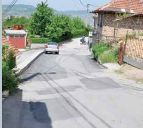
Sanacija od Ablakovine do okretaljke

Urađena je sanacija kolovoznih oštećenja u ulici Bostarići na dionici od Ablakovine do okretaljke. Sanacija ove ulice podrazumijevala je krpjenje udarnih rupa i djelimičnih oštećenja na kolovozu dužine 117 metara. Općina je za ove radove izdvojila oko 5.400 KM.