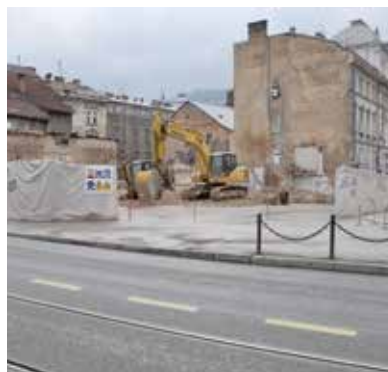
Uklonjen objekat bivšeg "Feroelektro"

Jednoglasno je usvojen i Pravilnik o uslovima i načinu izdavanja odobrenja za ulazak u pješačku zonu na užem području Općine Stari Grad Sarajevo. Ulazak u pješačku zonu dozvoljen je