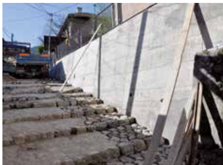
Hendina - 24 metra

Potporni zid uz stambeni objekat u ulici Hendina do broja 4 na Bistriku izgrađen je u dužini od 24 metra. Gradnja ovog zida koštala je oko 11.000 KM, a izvođač radova bila je firma „Sela“ iz Sarajeva.