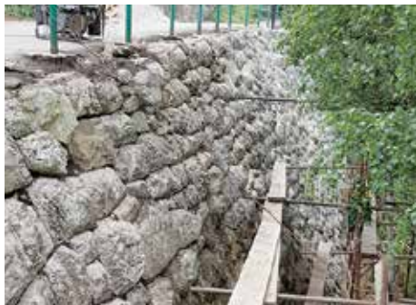
Garaplina - 38 metra

U ulici Garaplina broj 19 urađena je sanacija kamenog podzida koji podupire pješačku saobraćajnicu, dužine 38 metara. Za sanaciju ovog zida na Bistriku izdvojeno je oko 7.200 KM, a izvođač radova je građevinska firma „Sela“ iz Sarajeva.