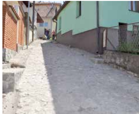
Popravka kaldrme u Mujezinovoj

Popravljeno je i kameno stepenište u ulici Mujezinova koja se nalazi u mjesnoj zajednici Hrid-Jarčedoli. Radovi su podrazumijevali sanaciju gazišta koje je poprilično dotrajalo i obrušavalo se. Radove je izvodila firma „Set Invest“ iz Sarajeva. Troškovi ovog projekta iznosili su oko 32.000 KM i u potpunosti ih je snosila Općina.