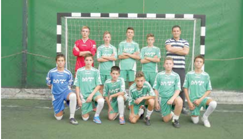
Apsolutni pobjednici OŠ "Šejh Muhamed ef. Hadžijamaković"