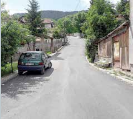
Asfaltirano 320 metara ulice

Urađena je sanacija i asfaltiranje ulice Komatin na Širokači, projekat u koji je Općina uložila 145.000 KM. Pošto je asfaltni kolovoz na toj saobraćajnici dužoj 320 metara bio veoma oštećen, sa udarnim rupama i začepljenim slivnicima za oborinske vode, bilo je potrebno uraditi kompletnu sanaciju ulice. Uklonjen je stari asfalt i podloga, te postavljen novi tamponski sloj.