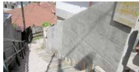
Krka - 10,5 metara

Novi armirano-betonski zid izgrađen je u ulici Krka od broja 1 do 5 u dužini od 10,5 metara. Izgradnju zida Općina je finansirala sa oko 11.500 KM, a radove je izvela firma „Klico trans gradnja“ iz Sarajeva.