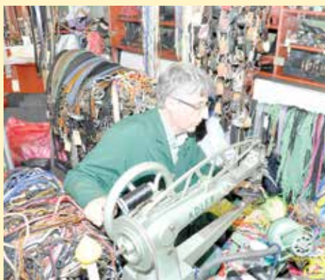
I danas radi na "Adler" mašini

Razlog što su Adnanove mušterije često stranci leži u činjenici da obućara njegovog tipa na Zapadu skoro da i nema, ukoliko i postoje, jako su skupi i potrebno im je mnogo vremena da poprave obuću. „Jedan gospodin, moja stalna mušterija, radio je za Ambasadu Češke Republike ovdje u Sarajevu i naravno nakon određenog vremena otišao je na misiju u neku drugu zemlju. Prije dvije godine sam ga ugledao pred svojom radnjom sa ogromnom kesom punom cipela, kaže u Pragu ih jednostavno nema kome odnijet na popravak“.