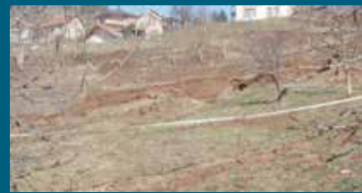
Klizište u Hladivodama

Općina Stari Grad će tokom ove godine riješiti problem četiri klizišta na svojoj teritoriji koja je proglasio Zavod za izgradnju Kantona Sarajevo, čime će biti riješen jedan od ključnih problema stanovnika ove općine. Završeni su radovi na sanaciji klizišta u ulici Save Skarića br.22, izabran je izvođač radova za sanaciju klizišta u ulici Podcarina br.29, a nakon toga početak će radovi i na lokacijama Hladivode od br.3-5 i Pogledine preko puta br.29. Za ove radove Općina Stari Grad izdvojila je 277.000 KM.