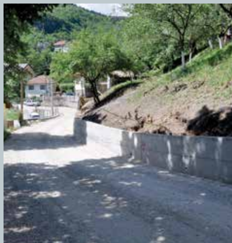
Nakon izgradnje zidova ulica će biti asfaltirana

Nakon izgradnje šest potpornih zidova na Jarčedolima (na dionici od trafostanice prema Popovom gaju), ulica će biti asfaltirana u dužini od 810 metara. Da bi se na dijelovima ulice uradilo proširenje, u cilju njene sanacije, bilo je potrebno izgraditi šest zidova.