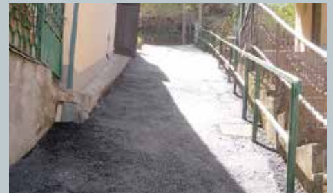
Umjesto kaldrme novi asfalt

Ulica Sulejmana Zolja do broja 12 asfaltirana je u dužini od oko 40 metara. U sklopu ovog projekta uklonjena je oštećena kaldrma i postavljen novi asfalt. Sanaciju kraka ove ulice s oko 5.000 KM finansirala je Općina.