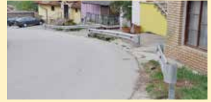
Nova ograda na Sedreniku

Postavljene su dvije putne zaštitne ograde u ulicama Sedrenik i Kriva. U ulici Sedrenik kod broja 131 postavljena je putna zaštitna ograda dužine 28 metara, a u ulici Kriva kod broja 5 dužine 32 metra, potvrdili su iz Službe za komunalne poslove. Ranije je ugrađena rukohvatna ograda i kod Višegradske kapije, ukupne dužine 56 metara. Kompletan projekat finansirala je Općina sa oko 7.000 KM, a radove je izvodila firma „Fadž company“ iz Sarajeva.