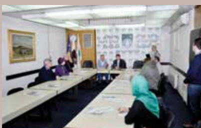
Sljepoća je invaliditet s rješenjem

Projekat “Problem bijelog štapa-inkluzija kroz sport” Općina Stari Grad podržala je iznosom od 5.000 KM.