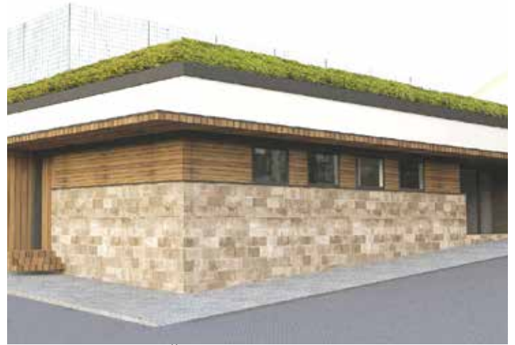
Sportska dvorana uz OŠ "Edhem Mulabdić"

vo, bit će postavljeni i vodoskoci. U toku je procedura izbora izvođača nakon čega će biti preciziran početak i završetak radova. Planirano je da gradnja bude završena ove godine.