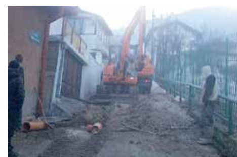
Za sanaciju izdvojeno 7.000 KM

Sanirana je kanalizaciona mreža u ulici Bistrik brijeg, na Mahmutovcu. Iz Službe za komunalne poslove kazali su da je uspješno okončan projekat i da je zamijenjen kanalizacioni vod dužine 40 metara, te time dugoročno riješen problem ove ulice. Popravku kanalizacione mreže u ulici Bistrik brijeg, Općina je finansirala s oko 7.000 maraka, a izvođač radova je bila firma “Set invest” iz Sarajeva.