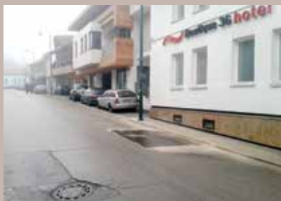
Otklonjen kvar na kanalizacionoj mreži

Kvar na kanalizacionoj mreži u ulici Safvet-bega Bašagića (iznad pošte) je otklonjen, potvrđeno je iz Službe za komunalne poslove Općine. Kvar je nastao zbog urušavanja potpornog zida u Ramića potoku. „Urušavanje potpornog zida izazvalo je kvar na kanalizacionim priključcima u ulici Safvet-bega Bašagića. Zbog toga je bila neophodna hitna intervencija. U najkraćem vremenu angažovali smo firmu KJKP 'Vodovod i kanalizacija' i kvar je otklonjen“, pojasnili su u Službi. Popravku kanalizacione mreže u ulici Safvet-bega Bašagića, Općina je finansirala s oko 2.300 maraka.