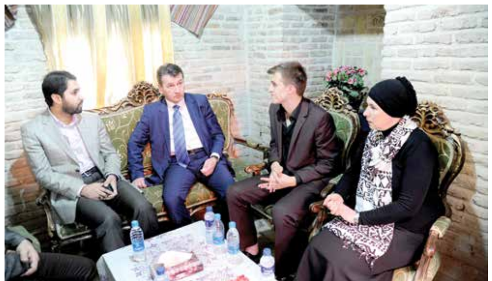
Sa načelnikom 12. općine Teheran

U Teheranu je naše predstavnike primio prvi savjetnik gradonačelnika koji im je zaželio dobrodošlicu i izrazio zadovoljstvo zbog posjete jedne delegacije iz BiH ovom gradu. Razgovaralo se o mogućnostima saradnje između općina, a prvi korak u tim nastojanjima bio bi potpisivanje Sporazuma o bratimljenju. Teheran je višemilionski grad, jedan od najvećih na svijetu, u kojem živi oko 12 miliona stanovnika. Grad čine 24 općine, od kojih je najrazvijenija 22. Općina gdje se ujed-