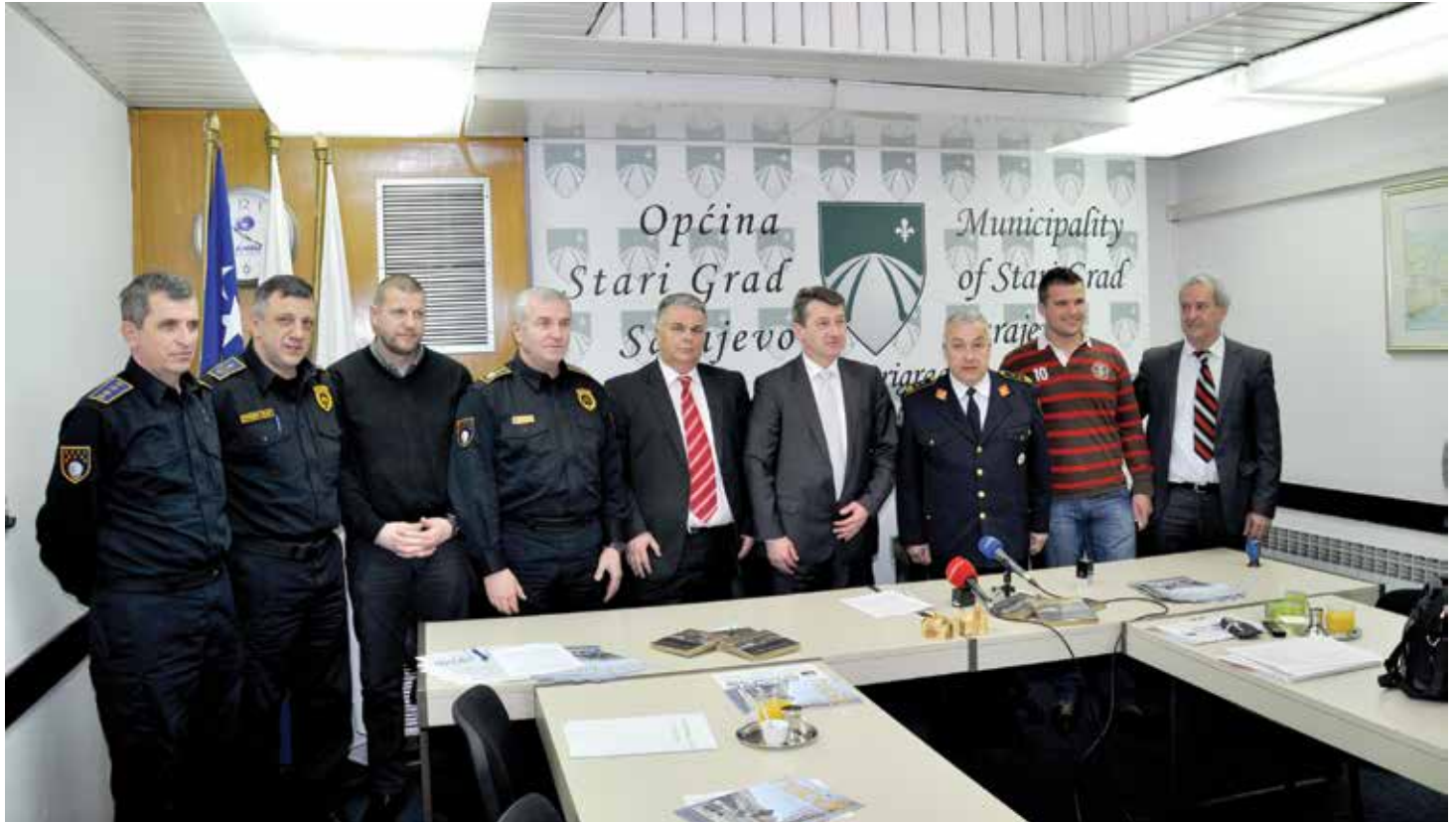
Zajednička fotografija potpisnika sporazuma i ugovora

Pružat će medicinsku pomoć, spašavati od požara, rušenja i štiti građane • Ugovori potpisani na pet godina