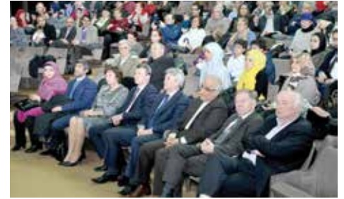
Koncert održan pred punom salom

Ambasador Islamske Republike Iran u Bosni i Hercegovini Seyed Hossein Rajabi, kazao je je da ovakvi događaji doprinose unapređenju i razvoju boljih odnosa među kulturama.