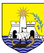
Opština Ulcinj Crna Gora - Ulcinj