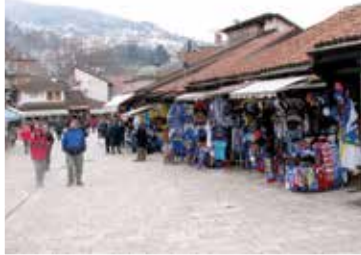
Roba izložena u promjeru 70 cm

Općinsko vijeće Stari Grad Sarajevo na 35. sjednici jednoglasno je usvojilo Prijedlog budžeta Općine Stari Grad Sarajevo za 2016. godinu, u iznosu od 16.153.000 KM. Također, Općina je preuzela obavezu da pripremi i novi dokument, tzv. "Budžet za građane" u kome će u drugačijoj formi prezentovati građanima usvojeni budžet. Prethodno su vijećnici, većinom glasova, usvojili rebalans budžeta za 2015. godinu.