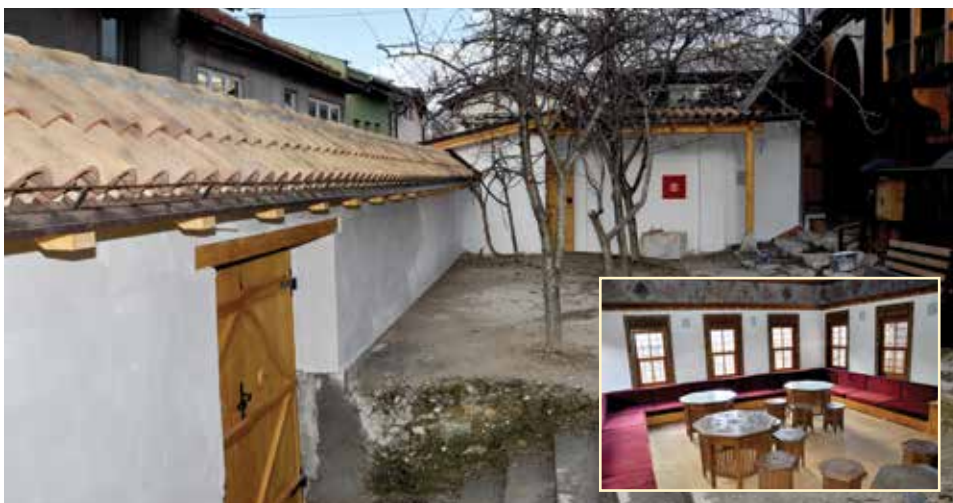
Nastavljena restauracija Saburine kuće