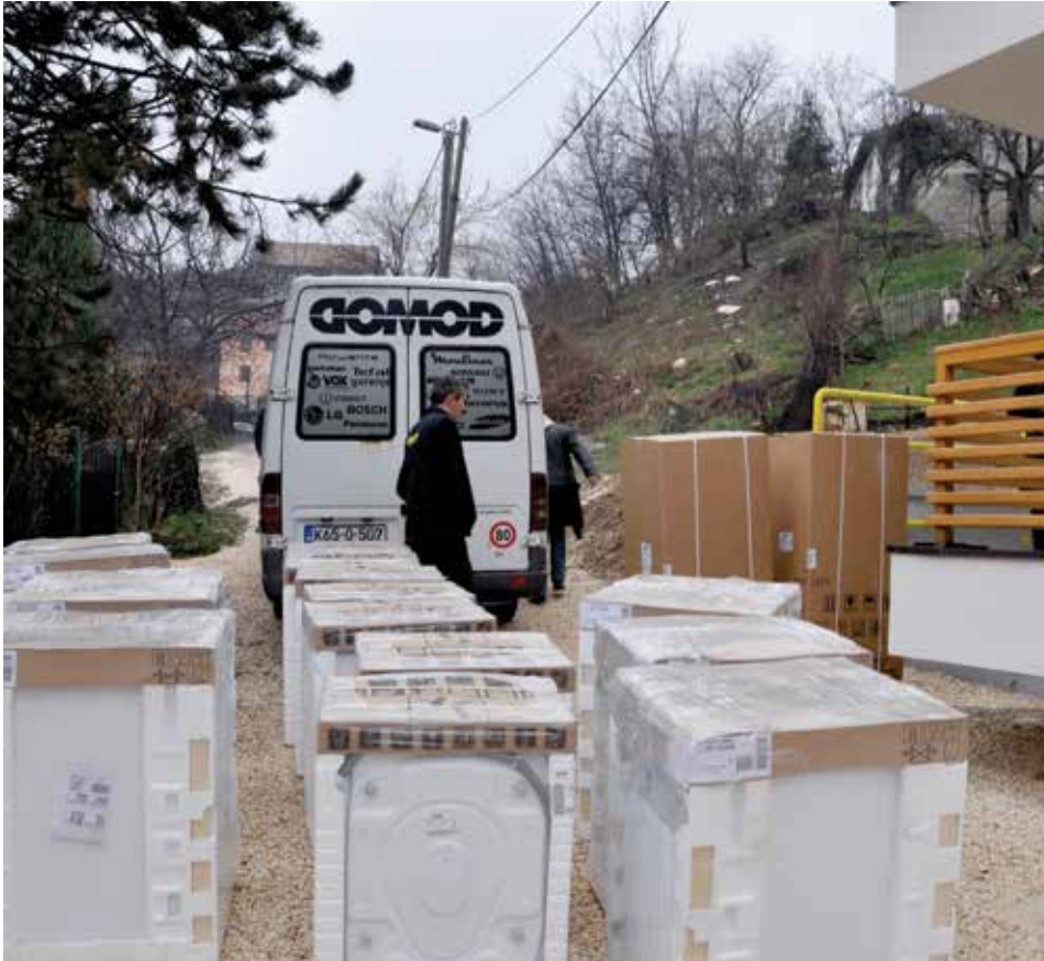
Donirane veš mašine, frižideri i električni šporeti

S edam korisnika stanova u zgradi za socijalno stanovanje u Čadordžinoj ulici, koji su u decembru prošle godine dobili ključeve i potpisali ugovore o korištenju stanova, dobili su i donacije u vidu opreme za stan. Humanitarna organizacija „Hilswerk Austria International“ donirala je stanarima mašine za veš, frižidere i električne šporete.