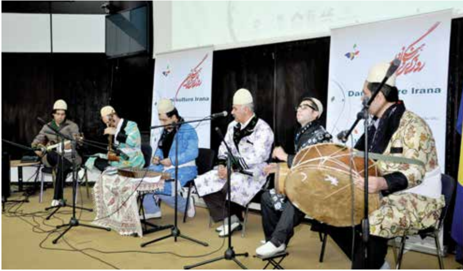
Tradicionalna folklorna iranska grupa "FALAK al-AFLAK"