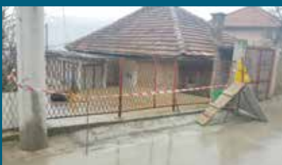
Izgrađen zid s donje strane ulice

U ulici Sulejmana Zolja do broja 11 izgrađen je zid s donje strane ulice, u dužini od četiri metra. Ovaj zid je izgrađen da bi se saobraćaj u ulici bezbijeđno odvijao. Radovi su koštali oko 3.500 maraka, a izvodila ih je firma KJKP „Bosman“ iz Sarajeva.