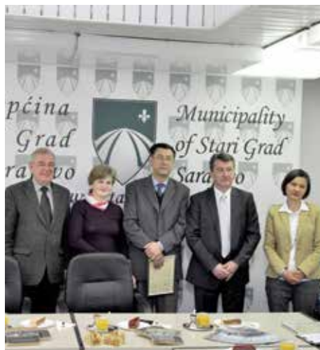
Uspješno realizovan projekat