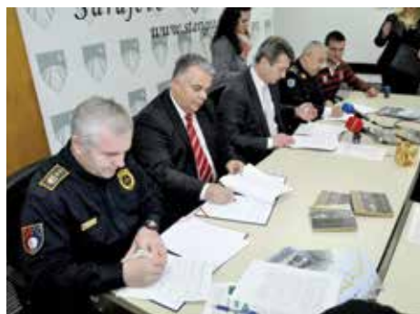
Prilikom potpisivanja sporazuma

Potpisivanjem ugovora definisano je formiranje službe medicinske pomoći - Dom zdravlja Stari Grad, službe za zaštitu i spašavanje od požara - DVD Vratnik, službe za zaštitu i spašavanje od rušenja - Klico Trans Gradnja d.o.o. i službe obezbjeđenja i zaštite - Policijska stanica Stari Grad. Ugovori su potpisani na period od pet godina.