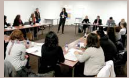
Najuspješnijim uručeni certifikati

Dodjelom certifikata i zahvalnica uspješno je okončan projekat „Program neformalnog obrazovanja - Znanje za sve“, koji je implementiralo Udruženje „Motivator“, a finansirala Općina Stari Grad. Učesnicima obuke certifikate je uručio Ibrahim Hadžibajrić, načelnik Općine Stari Grad Sarajevo. „Ove godine smo izdvojili 83.000 maraka za finansiranje projekata prispjelih po Javnom pozivu i usklađenih sa LOD metodologijom. Udruženje ‘Motivator’ je uspješno opravdalo novac koji su dobili“, istakao je Hadžibajrić. Cilj projekta je bio da za 15 mladih nezaposlenih osoba s područja Starog Grada pruži besplatnu edukaciju u oblastima koje nisu zastupljene u redovnom obrazovanju, a potrebne su na tržištu rada.