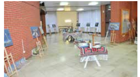
Izložba fotografija Teherana