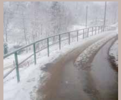
Ograda dužine 68 metara

U ulici Nova Baruthana, nakon što je izgrađena nova kanalizaciona mreža, sanirana i asfaltirana ulica, postavljeni su i klasični rukohvati od željeznih cijevi, u dužini od 68 metara. Radovi su koštali oko 7.000 KM, a izvodila ih firma „Fadž Company“ iz Sarajeva.