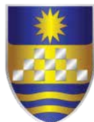
Opština Karpoš Republika Makedonija - Skoplje