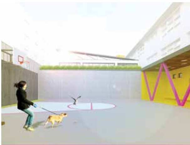
Unutrašnjost dvorane OŠ "Mula Mustafa Bašeskija"

Na mjestu nekadašnje kasarne u Faletićima, Općina Stari Grad Sarajevo u toku 2016. godine izgradit će sportsko igralište dužine 100 metara i širine 64 metra. Projektom je planirano da na ovom mjestu bude sagrađen moderan fudbalski stadion s pratećim sadržajima, tribinama i parkingom. Međutim, u skladu sa raspoloživim sredstvima, ove godine radit će se samo prva faza projekta koja podrazumijeva izgradnju sportskog terena i pristupnog puta.