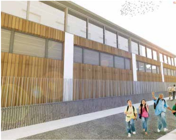
Sportska dvorana OŠ "Mula Mustafa Bašeskija"