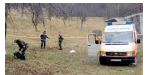
U toku deminiranje u MZ Moščanica

Deminiranje naselja Vrbica se radi prema projektu BH MAC-a, a finansira ga Humanitarni fond "ITF", preko američke ambasade.