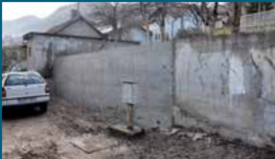
Novi zid dužine 10 metara

Novi armirano-betonski zid izgrađen je u ulici Balibegovica do broja 35 u dužini od oko 10 metara. Izgradnju zida Općina je finansirala sa oko 4.800 KM, a izvođači radova je bila firma „Klico trans gradnja“ iz Sarajeva.