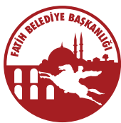
Općina Fatih Republika Turska - Istanbul