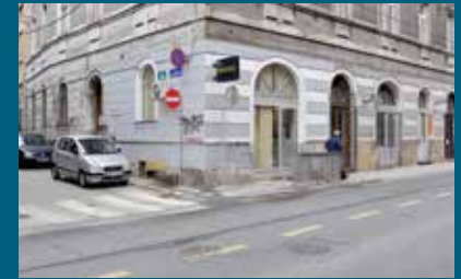
Saobraćajni znak u ulici Edhema Mulabdića

Na području općine Stari Grad Sarajevo realizovan je projekat zamjene oštećene saobraćajne signalizacije (znakova i ogledala). Novi saobraćajni znakovi postavljeni su na 11 lokacija i to: ugao ulica Muse Ćazima Ćatića i Šadlerove, Hamdije Kreševljakovića, Sedrenik broj 106, Obala Isa-bega Ishakovića, spoj ulica Hadžiristića i Zelenih beretki, spoj ulica Edhema Mulabdića i Mula Mustafe Bašeskije, Hamdije Kreševljakovića kod broja 98a, raskrsnica ulica Kasima ef. Dobrače i Safvet-bega Bašagića, raskrsnica ulica Safvet-bega Bašagića i Alije Nametka i u ulici Pod Hridom. Zamijenjena su i četiri oštećena saobraćajna ogledala i to u ulicama: ugao ulica Muse Ćazima Ćatića i Šadlerove, ugao ulica Magoda i Džemala Čelića, ugao ulica Komatin i Abadžin put i kod okretnice na Hošinom brijegu. Radove je izvodila firma KJKP „Rad“, a za ovaj projekat Općina je iz budžeta izdvojila oko 4.500 KM.