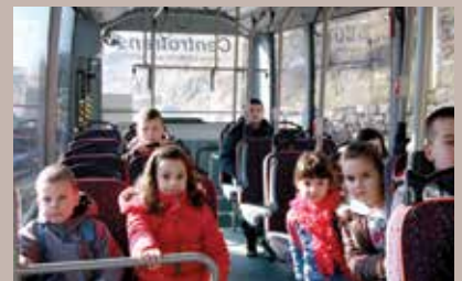
Prevoz za 64 učenika

Općina Stari Grad i Ministarstvo za obrazovanje, nauku i mlade Kantona Sarajevo i ove godine osigurali su besplatan prevoz za 64 učenika iz naselja Obhodža koji pohađaju nastavu u Osnovnoj školi „Vrhbosna“. Riječ je o učenicima čije su kuće od osnovne škole udaljene 3,5 kilometra i više. Prevoz za ove osnovce organizovan je u oba smjera. Polazna stanica je ulici Čorbadži dede Mustafage broj 14 (kod istoimene stanice), a posljednja kod OŠ „Vrhbosna“ u ulici Baruthana broj 60.