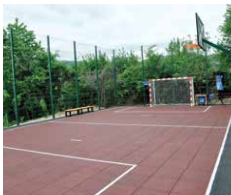
Dodatno osvjetljenje igrališta

Begović“. Općina Stari Grad je obezbijedila zemljište, te izdala potrebne dozvole i provela postupak izbora izvođača radova. Vrijednost investicije bila je oko 42.000 KM.