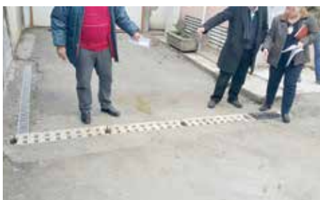
Linijska rešetka za odvodnju

Ugrađena je linijska rešetke za odvodnju površinskih voda u ulici Bakarevića do broja 33, na Bistriku. „Problem je nastajao zbog šahta koji se nalazio u