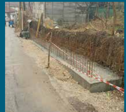
Novi zid dužine 50 m

Izgradnja armirano-betonskog potpornog zida dužine oko 50 metara u ulici Močila bb je u toku. Finansijer projekta je Općina Stari Grad koja je u budžetu za 2016. godinu za ovu namjenu osigurala nešto više od 20.300 KM. Radovi će se izvoditi u 11 kampada/dijelova jer se radi o jako nepristupačnom i strmom terenu. Izvođač radova je firma KJKP „Rad“.