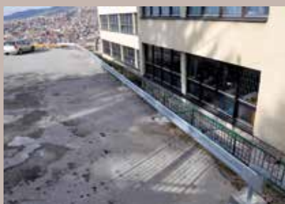
Ograda dužine 35 metara

Na Hridu, kod Osnovne škole „Šejh Muhamed ef. Hadžijamaković“, postavljena je putna, zaštitna ograda dužine 35 metara. Iz Službe za komunalne poslove Općine pojasnili su da je zaštitna ograda postavljena zbog sigurnosti učenika, i to na dijelu gdje se nalazi parking između Osnovne škole „Šejh Muhamed ef. Hadžijamaković“ i restorana „Park prinčeva“. Vrijednost radova bila je oko 3.400 KM, a finansirala ih je Općina. Izvođač radova je bila firma „Fadž Company“ iz Sarajeva.