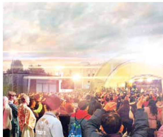
Na trgu će se održavati i festival "Bašcarsijske noći"

Pored kapitalnih projekata, planirana je gradnja i sanacija 14 potpornih zidova ove godine. Potporni zidovi bit će izgrađeni na sljedećim lokacijama: Hendina 4, Močila bb, Krka 105, Ispod grada 25, Kamenica, Garapina 15, Nadlipe preko puta br.6, Toplik, Balibegovića, Sulejmana Zolja.