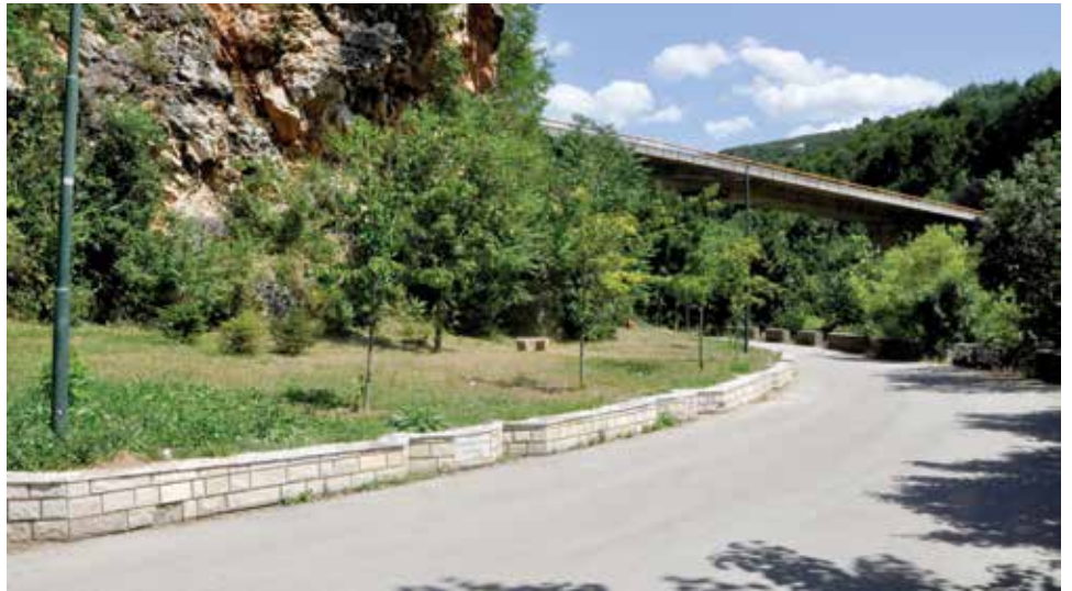
Uređena starogradska šetnica