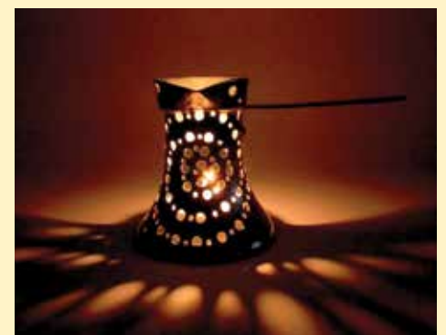
Ručno izrađena džezva-svijećnjak

dizajnera Jozefa Hoffmana, ali sa tradicionalnim alatima i materijalima koji se koriste u kazandžijskom zanatu. Replike tabli koje sam pravila prodaju se najviše u galerijama u Njujorku, ali i online. Od ovog zanata se može živjeti, ali se ne može obogatiti,“ završava svoju priču Nermina.