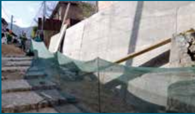
Projekat koštao 11.000 KM

Potporni zid uz stambeni objekat u ulici Hendina do broja 4 na Bistriku izgrađen je u dužini od 24 metara. Gradnja ovog koštala je oko 11.000 KM, a izvođač radova bila je firma „Sela“ iz Sarajeva.