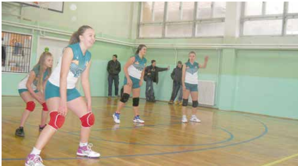
Pobjednik Lige ekipa OŠ „Šejh Muhamed ef. Hadžijamaković“

Po uzoru na fudbalsku ligu učenika iz starogradskih osnovnih škola, Općina Stari Grad je putem Službe za obrazovanje, kulturu i sport uspješno realizirala i odbojkašku ligu za starogradske učenice. Pored Općine Stari Grad, u organizaciji lige učestvovala je i Odbojkaška akademija SMEČ, na čelu sa direktorom Ekremom Lagumdžijom. Pokrovitelj takmičenja je bio BH Telecom, pa je i zvaničan naziv lige bio „BH Telecom odbojkaška liga osnovnih škola Starog Grada. Prvenstvo je startalo prošle godine i bilo je podijeljeno na jesenji (26.11- 24.12.2015.) i proljetni dio (03.02 -10.03.2016.). Učešće je uzelo šest osnovnih škola sa područja općine Stari Grad i to; OŠ „Šejh Muhamed ef. Hadžijamaković“, OŠ „Vrhbosna“, OŠ „Mula Mustafa Bašeskija“, OŠ „Hamdija Kreševljaković“, OŠ „Edhem Mulabdić“ i OŠ „Saburina“, koja je bila i domaćin svih susreta. Sve takmičarke su dobile i odgovarajuće odbojkaške dresove. Nakon 10 prvenstvenih kola u kojima je