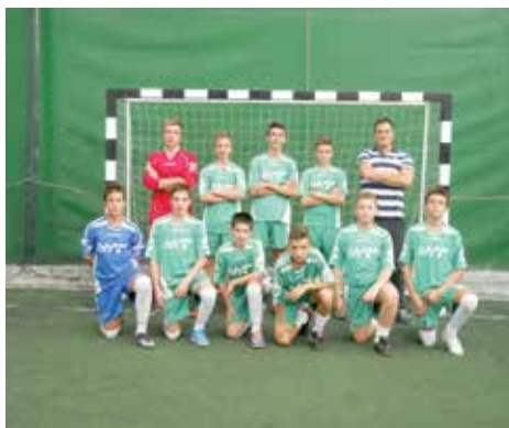
Trenutno najbolja ekipa s Hrida