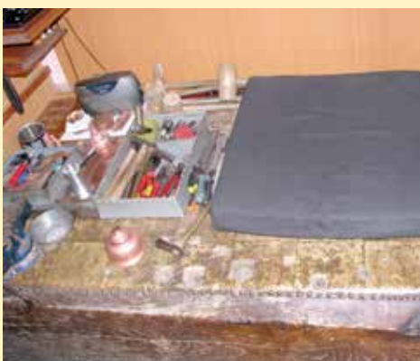
Panj sa alatom na kome se izrađuju predmeti

Ono što Nerminin dućan izdvaja od ostalih kazandžijskih dućana je ardija. Ardija je prostor u kojem se radi s vatrom, i on se nalazi iza radnje. Ard je arapska riječ i znači vatra. Ranije su svi dućani u kazandžiluku imali svoje ardije, ali nažalost više nije tako i ardije se uglavnom nalaze uz kuće. Također svaka kazandžijska radnja ima panj, na kome se radi izrada predmeta i na njemu se vide urezani kalupi za stavljanje različitih alata.