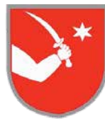
Grad Makarska Republika Hrvatska - Makarska