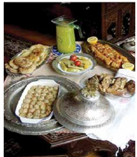
Projekat će finansirati Općina Mamak

projekta je oko 12.000 KM, od čega je 85% sredstava obezbijedila pobratimska Općina Mamak, dok će ostatak finansirati Općina Stari Grad.