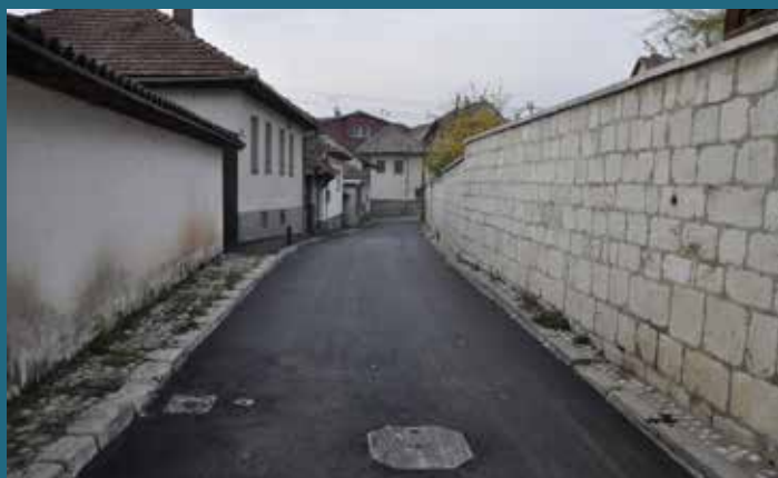
Ulica Alije Đerzeleza