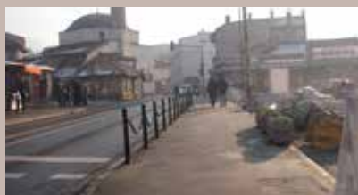
Asfaltiran trotoar dužine 80 metara

Trotoar preko puta tramvajskog stajališta Baščaršija, koji je zbog radova na rekonstrukciji Baščaršijskog trga u Starom Gradu bio oštećen, saniran je. Prilikom radova i spajanja komunalne infrastrukture u predviđene cjevovode i šahtove, urađen je prokop pješačke staze u dužini od oko 80 metara. Sanacijom su zatvoreni prokopi, postavljen tampon, a trotoar je asfaltiran, potvrđeno je u Službi za komunalne poslove Općine. Radovi su koštali oko 9.900 maraka, a izvođač radova je bila firma KJKP „Rad“.