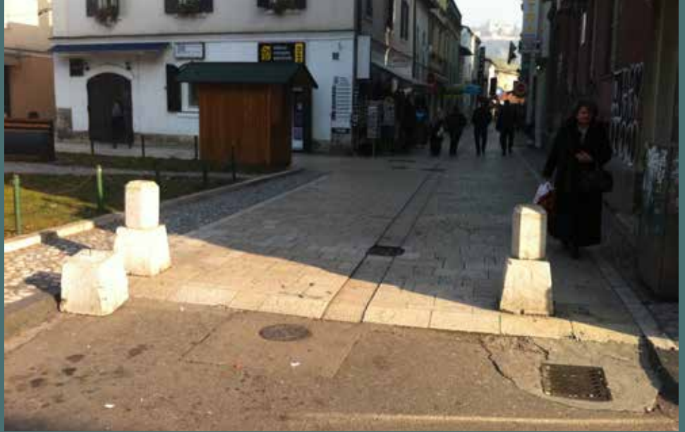
Raskršće ulica Zelenih beretki i Kundurdžiluk

Realizacijom projekta kontrole pristupa na području općine Stari Grad, starogradsko jezgro će od naredne godine biti zatvoreno za svaku vrstu saobraćaja, čime će se spriječiti uništavanje ulica i Bašćaršijskog trga. Načelnik Općine Ibrahim Hadžibajrić angažovao je nadležne službe da izvrše uvid u stanje na terenu i kontrolu popotnih stubića koji su ranijih godina postavljeni na nekoliko lokacija. Realizaciju ovog projekta Općina je pokrenula sa firmom MIBO Komunikacije d.o.o. koja je na području Bašćaršije postavila stubiće, kao i 28 nadzornih kamera.