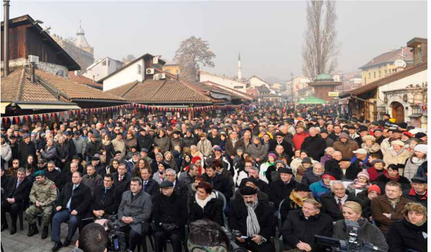
Svečanom otvaranju prisustvovali brojni građani