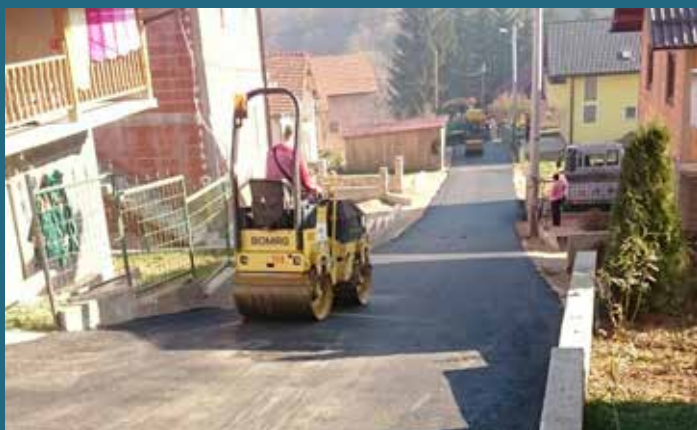
Ulica Nova Baruthana