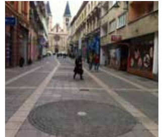
Izmjena i dopuna Zakona o zakupu poslovnih prostora

Općinsko vijeće Stari Grad na 33. sjednici usvojilo je zaključak kojim je zadužilo Službu za privredu i finansije da pripreme izmjenjene Odluke o zakupu poslovnih prostora kojima će se definisati na koji način će se zakupci koji ne plaćaju dug za zakupninu deložirati iz poslovnih prostora, a u skladu sa izmjenama i dopunama Zakona o zakupu poslovnih zgrada i prostorija, koje su usvojene na sjednici Skupštine KS, održanoj 07. oktobra, 2015. godine. Izmjene ovog zakona omogućavaju