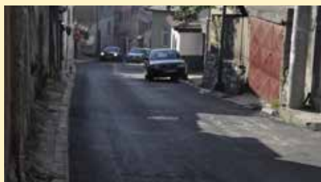
Asfaltirano je preko 4 kilometra ulica

Svi kapitalni i investicioni projekti, kao i oni iz oblasti infrastrukture, sanacije i rekonstrukcije, realizovani su putem ove dvije službe. Pored kapitalnih projekata o kojima smo pisali, ove godine na teritoriji Starog Grada asfaltirano je preko 4 kilometra ulica, te u njihovu sanaciju uloženo više od 1.2 miliona konvertibilnih maraka! Rekonstruisano je 36 ulica. U 2015. godini izgrađeno je i sanirano devet potpornih zidova u vrijednosti od 130.350 KM. Pregled projekata dostupan je na www.starigrad.ba .