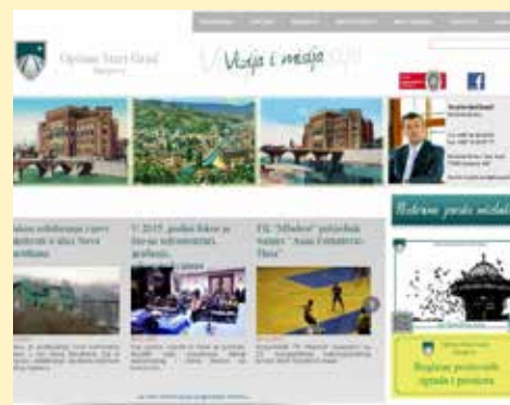
Na web stranici zabilježeno 140.000 posjeta

Sektor za odnose s javnošću Općine Stari Grad Sarajevo pripremio je i objavio četiri broja biltena "Starogradski Haberi". Na web stranici Općine Stari Grad, ove godine objavljene su 822. vijesti, a u printanim medijima objavljeno je ukupno 719 tekstova. Sektor za odnose s javnošću je u toku 2015. godine organizovao ukupno 25 press konferencija.