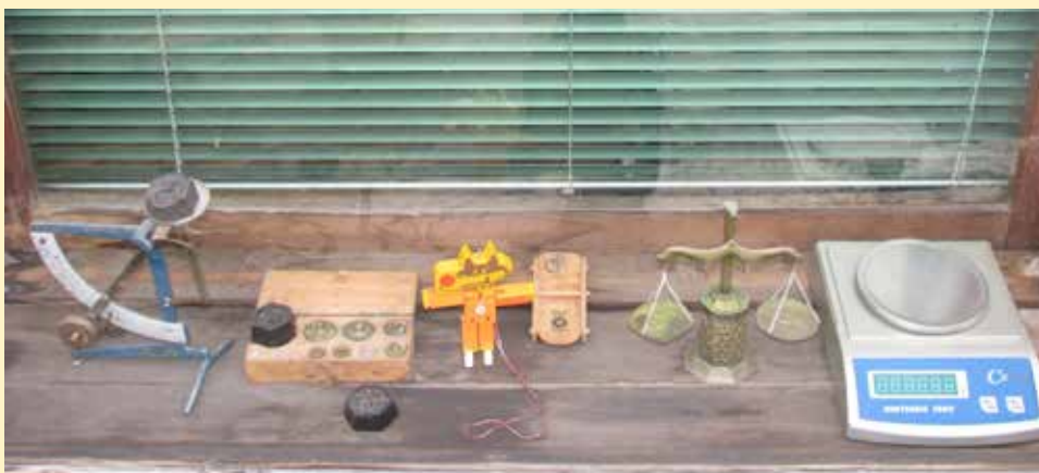
Jedina zanatska radnja za popravku vaga u BiH

„Uprkos teškim vremenima, uz ovu zanatsku djelatnost može se živjeti,“ završava svoju priču Čukurija.