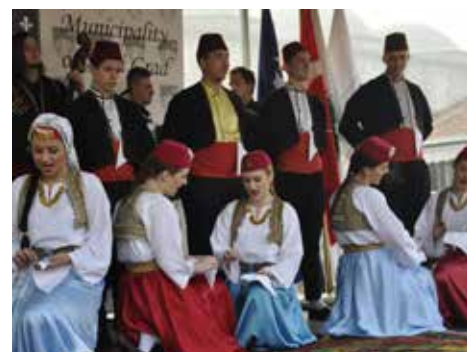
KUD "Bašćaršija" izveli "Muslimanske igre starog Sarajeva"