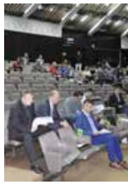
Sa 32. sjednice

Općinsko vijeće Stari Grad Sarajevo na 32. redovnoj sjednici, donijelo je zaključak kojim se zadužuje Načelnik Općine da putem nadležnih službi pristupi izradi Odluke o uspostavi jedinstvenog registra nekretnina ove Općine. Iz Službe za imovinsko-pravne, geodetske poslove-katastar i stambene poslove, naglasili su da je Načelnik Općine još u martu ove godine formirao radnu grupu sa ciljem provođenja aktivnosti na evidentiranju imovine Općine, a na 32. sjednici vijećnicima je predočena i informacija o nekretninama na kojima je upisana Općina. Prethodno je interni revizor proveo reviziju koja je imala za cilj stvaranje Jedinstvenog registra imovine u vlasništvu Općine, uz preporuke pomenutoj službi, te Službi za privredu i Sektoru za informacione sisteme. U informaciji se navodi da je većina preporuka internog revizora već implementirana. Vijećnicima je predočena informacija o stanju komunalne čistoće na području općine u kojoj je, između ostalog, navedeno da je količina prikupljenog kućnog otpada u Starom Gradu, u prvih šest mjeseci ove godine, cca 8.000 tona.