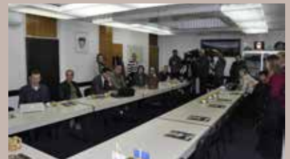
Projekat namijenjen osnovcima

Online platforma BOOKVAR.COM je pilot projekat kompanije Akademija 387 i prvi put se primjenjuje u BiH, upravo u Općini Stari Grad Sarajevo. Projekat je vrijedan 4.000 KM, a finansiraju ga u jednakim omjerima Općina Stari Grad Sarajevo i Akademija 387.