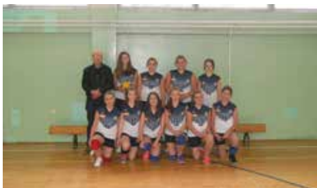
Prva na tabeli ekipa "Mula M. Bašeskija"

posljednje, peto kolo. Odbojkašice ekipe „Mula Mustafa Bašeskija“, nakon odigranog 4. kola zauzele su prvo mjesto na tabeli pobijedivši selekciju „Šejh Muhamed ef. Hadžijamaković“ rezultatom 1:2 u setovima. Selekcija „Mula Mustafa Bašeskija“ ima osam bodova, a iza njih je ekipa Šejh Muhamed ef. Hadžijamaković“ (6), „Vrhbosna“ (4) i „Saburina“ (4), „Hamdija Kreševljaković“ (2), dok je „Edhem Mulabdić“ i dalje bez bodova. Proljetni dio Lige igrat će se od 03. februara do 02. marta, 2016. godine, a pokrovitelj projekta je BH Telecom.