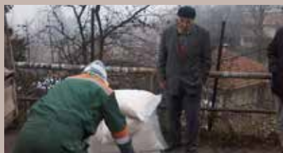
So za posipanje ulica

Za potrebe stanovništva najstarije gradske Općine tokom decembra isporučena je industrijska so mjesnim zajednicama. Podijeljeno je 96.400 kg soli za posipanje ulica.