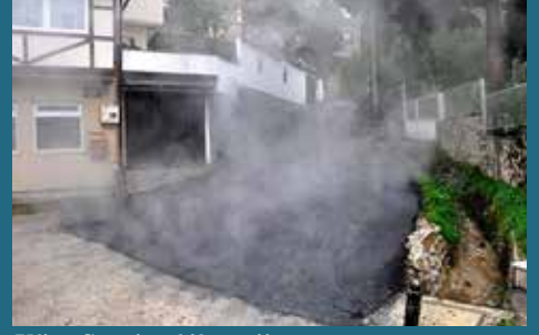
Ulica Sarajevskih gazija