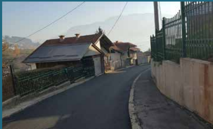
Ulica Alije Nametka