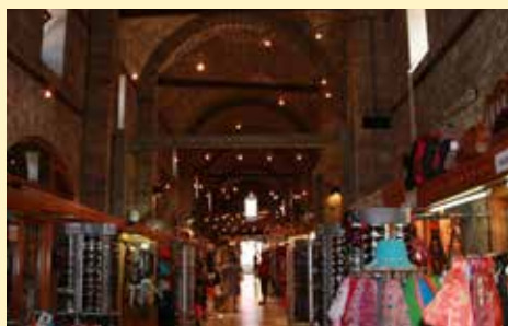
Naplaćeno od zakupnina 5.961.538,80 KM

U toku 11 mjeseci ove godine Služba je od zakupa poslovnih prostora naplatila 5.961.538,80 KM, pa je procenat naplate 96 %. U oblasti poljoprivrednih resursa dodijeljeno je 17 plastenika, 19.040 komada sadnog materijala, 47 poljoprivrednih proizvođača dobilo je poticaj u iznosu od 24.855 KM, podijeljeno je 167 košnica za 48 pčelara, itd.