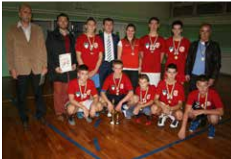
Prvo mjesto OŠ "Saburina"