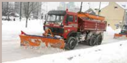
Održavanje se radi po prioritetima

Općina Stari Grad Sarajevo, putem Službe za komunalne poslove, pripremila je i ove godine program zimskog održavanja cesta u Starom Gradu, po prioritetima.