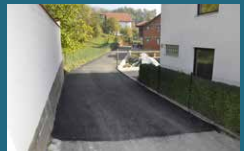
Ulica Mali Sedrenik