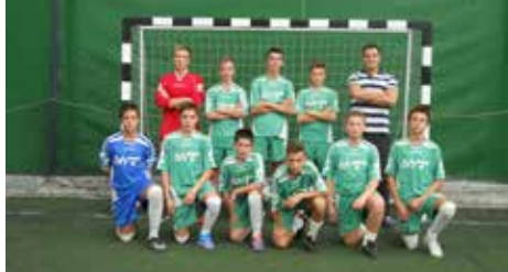
Jesenji prvak ekipa s Hrida

Na tabeli je ubjedljivo prva selekcija osnovne škole "Šejh Muhamed ef. Hadžijamaković" sa osvojenih 27 bodova, a iza nje po 20 bodova imale su selekcije škola "Edhem Mulabdić" i "Vrhbosna". Slijede škole: "Mula Mustafa Bašeskija" (11), "Hamdija Kreševljaković" (8) i "Saburina" bez bo-