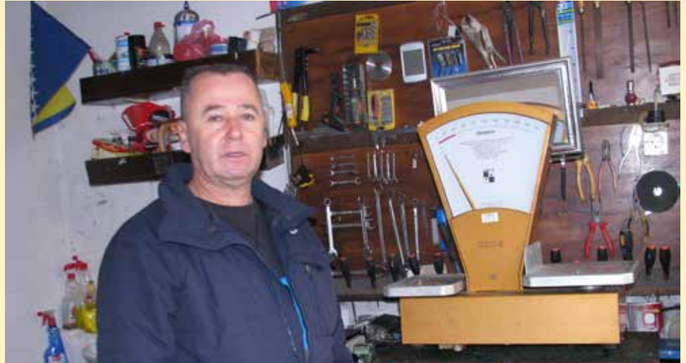
Ovim Zanatom se počeo baviti davne 1982. godine

Često ide u antikvarnice i traga za starim vagama koje za njega imaju veliku vrijednost, a u svojoj mnogobrojnoj kole-