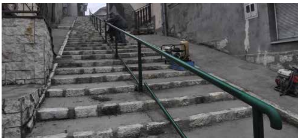
Radovi koštali oko 18.000 KM

Urađena je rekonstrukcija kamenog stepeništa u ulici Adžemovića, u mjesnoj zajednici Logavina. Radovi su se izvodili u dvije faze. Prva je uključivala radove na kišnoj kanalizaciji i poprečnoj drenaži. „Položene su kanalizacione drenažne cijevi, te spojeni oluci na novu kišnu kanalizacionu cijev“, pojasnili su u Službi za investicije, plan i analizu Općine.