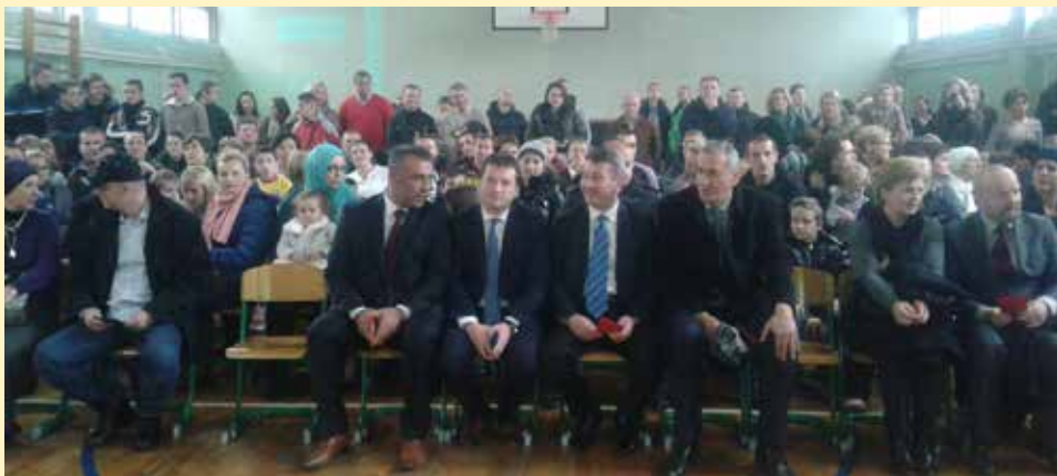
Sa svečane priredbe u OŠ "Saburina"