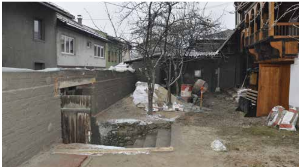
Završena sanacija ogradnog zida i ulazne kapije

Sanacija i restauracija stambene cjeline Saburina kuća, koja je 2006. godine proglašena nacionalnim spomenikom BiH, nastavljena je kroz treću i četvrtu fazu. U sklopu treće faze planirani su građevinsko-zanatski radovi tj. sanacija ogradnog uličnog zida, ulazna kapija, a postavit će