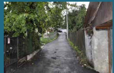
Ulica Budakovići čikma