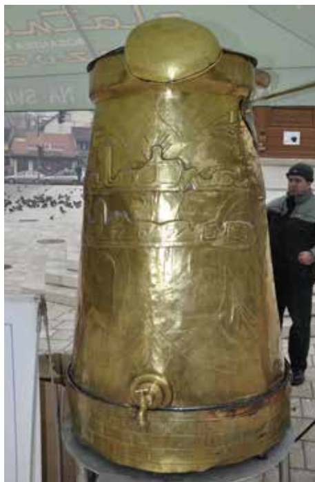
Kafa iz Vispakove najveće džezve na svijetu

Pokrovitelji svečanog otvaranja Bašćaršijskog trga bili su: Art kuća sevdaha, Bosanska kuća, Kazandžijska radnja vl. Jabučar H. Nasir, Čevabdžinica "Željo", Čevabdžinica "Ferhatović", Kafe-slastičarna "Sport", Narodna kuhinja "Stari Grad", Butik Badem, Cream shop d.o.o, UR "Čeif", Kafe-slastičarna "Saraj", VISPAK d.d.Visoko, Dibek d.o.o, Foto studio "MH Hadžić" i ZUP "Bašćaršija".