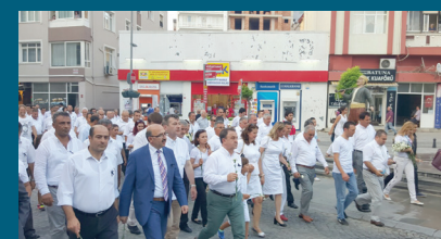
Sa "Šetnje za mir"