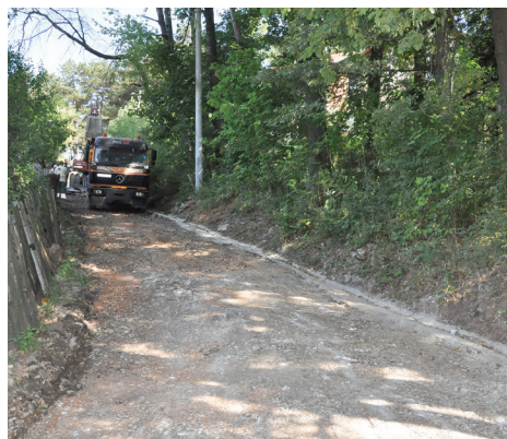
Popov gaj: Radovi u toku

Izvođač radova je firma KJKP „Rad“, a projekat sa oko 100.900 maraka finansira Općina Stari Grad.