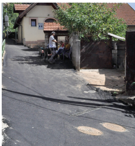
Novi kišni i fekalni odvod

„Ovdje je najveći problem bila kanalizacija koja se izljevala po ulici. Po reakcijama ljudi s kojima se susrećem u Strošićima vidim da su prezadovoljni. Sada će biti mirni godinama. Olakšao im se život u svakom smislu“, priča Belma.