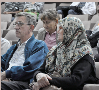
Sa podjele hedija za kurban Bajram