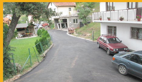
Sedrenik od broja 139 do 145

Saniran je i asfaltiran makadamski dio ulice Ablakovina od broja 4 do 10. Asfalt je postavljen u dužini od 85 metara. Radovi su koštali 12.600 KM.