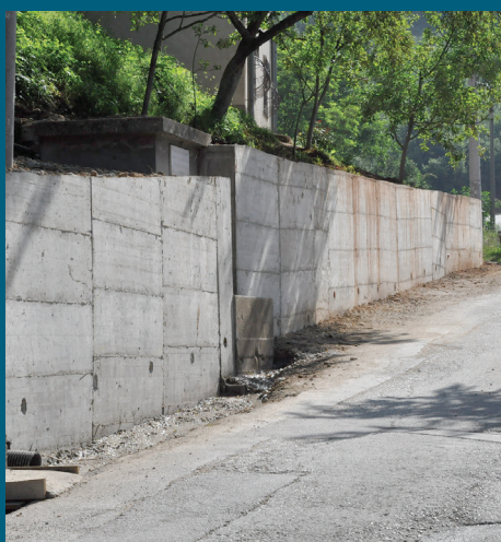
Mošćanica drugi dio