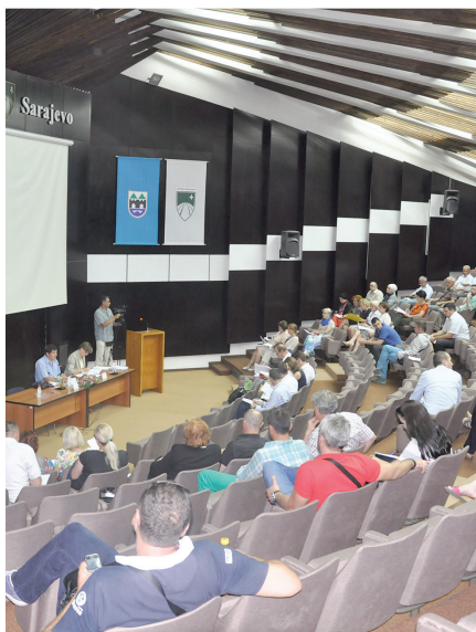
Sa sjednice Općinskog vijeća

Općinsko vijeće Stari Grad utvrdilo je na 30. redovnoj sjednici, održanoj 27. jula, Nacrt odluke o prodaji poslovnih prostora i uputilo ga u javnu raspravu u trajanju od 45 dana. Pravni osnov za donošenje ove odluke je Zakon o stvarnim pravima Federacije BiH. Donošenjem istog, stvorila se potreba da se podzakonskim aktom reguliraju odredbe koje se tiču raspolaganja nekretninama u vlasništvu Općine Stari Grad, a odnose se na članove zakona koji reguliraju pravo preče kupnje i započete postupke po starim propisima. Subjekti koji mogu učestvovati u javnoj raspravi su Općinsko vijeće, radna tijela, političke stranke/klubovi, udruženja obrtnika/privrednika i drugi, a svi prijedlozi i sugestije moraju se dostaviti u pismenoj formi Službi za imovinsko-pravne, geodetske poslove, katastar i stambene poslove. Općinsko vijeće je stavilo van snage Odluku o kupovini vozila Kliničkom centru Univerziteta u Sarajevu za