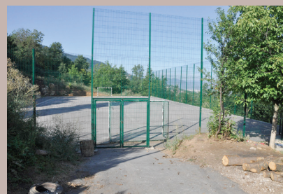
Igralište Iza gaja ponovo u funkciji

Zaštitne mreže postavljene oko novoizgrađenog igrališta Iza gaja, koje su nepoznati počinioci devastirali početkom ljeta, zamijenjene su novim. Zamijenjeno je ukupno 13 velikih i jedan mali panel. Šteta je sanirana, a igralište je ponovo u funkciji za sve građane. Podsjećamo, na sportskom igralištu Iza gaja, u Mjesnoj zajednici Hrid-Jarčedoli, sredinom juna su nepoznati počinioci nanijeli štetu. Pokidane su mreže iznad ulaznih vrata, te sa obje strane ulaza. Sportsko igralište Iza gaja izgrađeno je 2014. godine, po evropskim standardima, dimenzija 20x40 metara. Općina Stari Grad je izdvojila oko 150.000 KM za gradnju igrališta, asfaltiranje, postavljanje zaštitne ograde i mreža, te izgradnju potpornog zida i pristupnog puta.