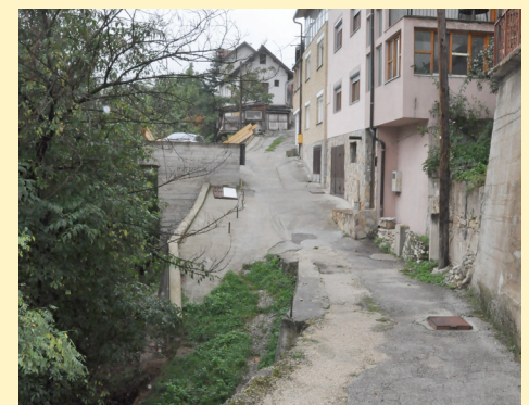
Nova kanalizacija za 30 domaćinstava

Kako su kazali iz mjesne zajednice Vratnik, građani su s nestrpljenjem čekali početak ovog projekta koji će riješiti njihov problem star desetinama godina. "Gotovo svakodnevno građani su dolazili da pitaju kada će početi gradnja kanalizacije. Neki od njih su otkazali godišnje odmore kako bi bili ovdje u vrijeme početka radova," kazali su iz mjesne zajednice.