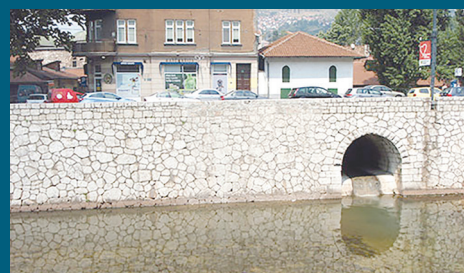
Zid na obali Miljacke

od istog kamena. Sanirano je oko šest metara zida, visine jednog metra“, pojasnili su iz Službe za civilnu zaštitu Općine. Za sanaciju zida izdvojeno je oko 1.000 KM, a radove je izvodila firma „Balkan-kamen“ iz Sarajeva. Projekat sanacije potpornog zida finansirala je Općina Stari Grad, a vrijednost investicije je bila oko 1.000 KM.