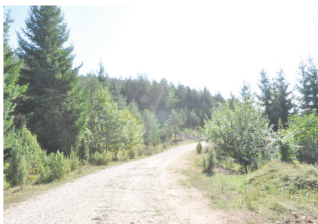
Uređen put dužine 3,5 kilometra

Stari putni pravac, koji povezuje Barice i Donje Biosko, a jednim dijelom se nalazi na Sedreniku, a drugim na Moščanici, uređen je i vraćen u funkciju. Prema in-