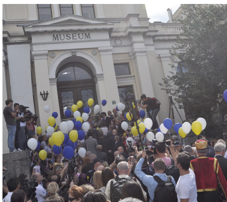
Podrška radu ustanovama kulture

Na 31. sjednici Općinskog vijeća Stari Grad usvojen je Zaključak o izdavanju sredstava za pomoć izbjeglicama iz Sirije, te je zadužen načelnik Općine da obezbijedi sredstva u iznosu od 30.000 KM u svrhu pomoći sirijskim izbjeglicama u Srbiji i Makedoniji i dostavi ih putem humanitarne organizacije Merhamet. Kako se izbjeglice nalaze u izuzetno teškoj situaciji, zaključeno je i da se ova akcija treba provesti bez odlaganja. Općinsko vijeće je dalo saglasnost za potpisivanje Memoranduma o razumijevanju s ciljem podrške radu ustanovama kulture od općeg značaja i interesa za BiH, za period 2016/2018. godina, koji je upućen od strane Ministarstva civilnih poslova BiH. Potpisivanjem Memoranduma, Općina Stari Grad na godišnjem nivou izdvajati će 50.000 KM za podršku ustanovama kao što su Zemaljski muzej, Biblioteka za slijepa