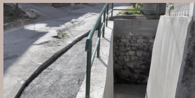
Sanirana česma na Tereziji

Sanirana je javna česma na Tereziji, u starogradskoj mjesnoj zajednici Toka-Džeka. Ova česma Sarajlijama je bila od izuzetno velikog značaja tokom agresije na našu zemlju, i kako mnogi tvrde bila je „žila kucavica“ koja je vodom snabdijevala cijeli Bistrik, pa i šire. Važno je naglasiti da česma na Terezijama nije na javnoj gradskoj vodovodnoj mreži već se radi o prirodnom izvoru koji nikada nije presušio.