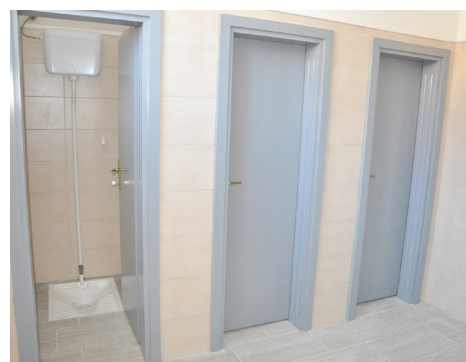
Sanirano 14 kabina toaleta

U sklopu projektnih radova urađeni su demontaža i rušenje, izolaterski, vodovodni, kanalizacioni, keramički,