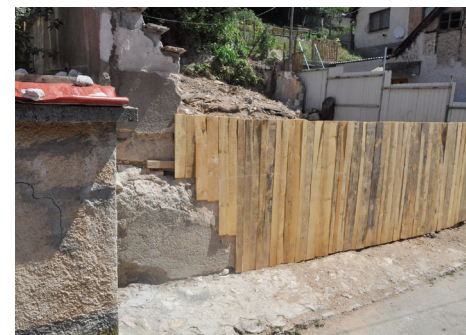
Uklonjena opasnost na Vratniku

Uklanjanje objekata koštalo je oko 3.600 KM, a finansijer radova je bila Općina Stari Grad Sarajevo.