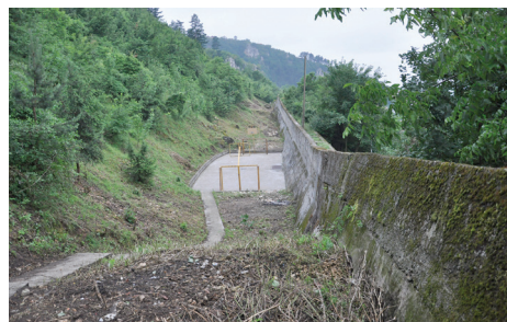
Uređena brana na Mahmutovcu

Brana na Mahmutovcu, u istoimenoj mjesnoj zajednici, početkom ljeta preventivno je očišćena, kako bi spremno dočekala jesen i prve padavine. Brana, koja sprječava oticanje oborinskih voda iz pravca Trebevića na obližnje kuće, očišćena je od korova i šiblja koje je se nakupilo. Uposlenici firme "Klico trans gradnja", koja je izvodila radove, pokosili su travu, posjekli šiblje, nisko rastinje i korov, te očistili površinu iznad brane. Na dijelu ispod brane, a iznad obližnjih kuća, postavljena je ograda. Očišćeno je i sportsko igralište koje se nalazi iznad brane, te slivna rešetka predividena za oticanje oborinskih voda.