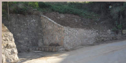
Saniran izvor na Brusuljama

Na Brusuljama, u starogradskoj mjesnoj zajednici Moščanica, saniran je lokalni izvor sa česmama, sagrađen još u austro-ugarskom periodu, kada je tadašnja vlast gradila saobraćajnicu. Izvor je za stanovnike ovog naselja uvijek imao veliki značaj, naročito u vrijeme agresije na našu zemlju, ali je usljed korištenja i neodržavanja bio skoro potpuno uništen. Općina je pristupila kompletnoj sanaciji rezervoara, postavljanju novih cijevi, kaptazi i oblaganju zida.