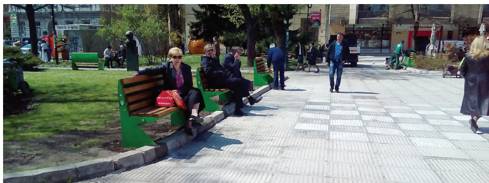
Trg oslobođenja - Alija Izetbegović

i inspekcijske poslove konsultovala se sa Sektorom za poslove mjesnih zajednica, tako da će se nove klupe naći na mjestima gdje su to građani tražili. Sve klupe će biti obojene u zelenu boju, inače boju općinskog grba. Njima će se oplemeniti prostor za odmor i rekreaciju i omogućiti građanima da više vremena provode na zelenim površinama, te mjestima za šetnju i odmor. Na svim klupama s bočne strane bit će istaknut logo Općine Stari Grad Sarajevo.