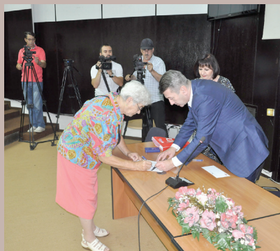
Sa podjele hedija za ramazanski Bajram

Općina je i ove godine organizovala tradicionalna bajramska druženja sa članovima porodica šehida i poginulih boraca, nezaposlenim ratnim vojnim invalidima i demobilisanim borcima, tokom kojih su im uručene novčane hedije.