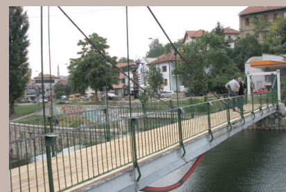
Novе daske na mostu

Most koji se nalazi u neposrednoj blizini brane Bentbaša, saniran je i osposobljen za korištenje.