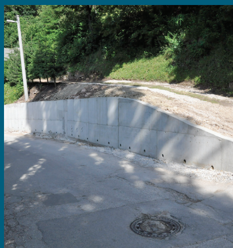
Mošćanica prvi dio