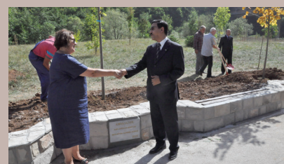
Diana Salihbegović sa ambasadorom Kuvajta (slika 1), ambasadorom Libije (slika 2) i ambasadorom Saudijske Arabije (slika 3)

U Aleji ambasadora početkom septembra zasađene su još tri lipu, a zasadili su ih n.j.e. Nasser Riden Thamer Almotairi, ambasador Države Kuvajt u BiH, n.j.e. Hani Abdullah M. Mominah, ambasador Kraljevine Saudijske Arabije u BiH, i n.j.e. Arebi S.A.Halloudi, ambasador Države Libije u BiH. Time je broj sadnica u ovoj šetnici porastao na 153.