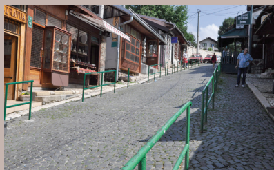
Ograda duga 28 metara

Postavljena je rukohvatna ograda na lijevoj strani ulice Kovači, od broja 5 do broja 29. Općina je odlučila postaviti ogradu na inicijativu vlasnika i zakupaca obližnjih poslovnih prostora, s obzirom da su ispred njihovih radnji često bila parkirala vozila, čime je bio onemogućen prilaz radnjama. „Da bi spriječili nepropisno parkiranje automobila, Općina je odlučila postaviti ogradu dužine 28 metara. Postavljeni su klasični rukohvati od crnih cijevi zaštićenih bojom“, pojasnili su u Odsjeku za komunalne poslove Općine.