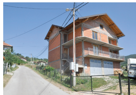
Ponovo uspostavljena rasvjeta

imali veliki problem, pogotovo zbog djece jer je noću u ulici bio potpuni mrak. Ali, najvažnije je da je to iza nas i da ponovo imamo rasvjetu“, kazala je ona. Za pomenute radove izdvojeno je oko 2.600 maraka.