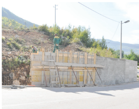
Bit će izgrađen zid dužine 30 metara

Sanaciju zida sa oko 17.000 KM finansira Općina Stari Grad, a izvođač radova je firma "Sela" iz Sarajeva.