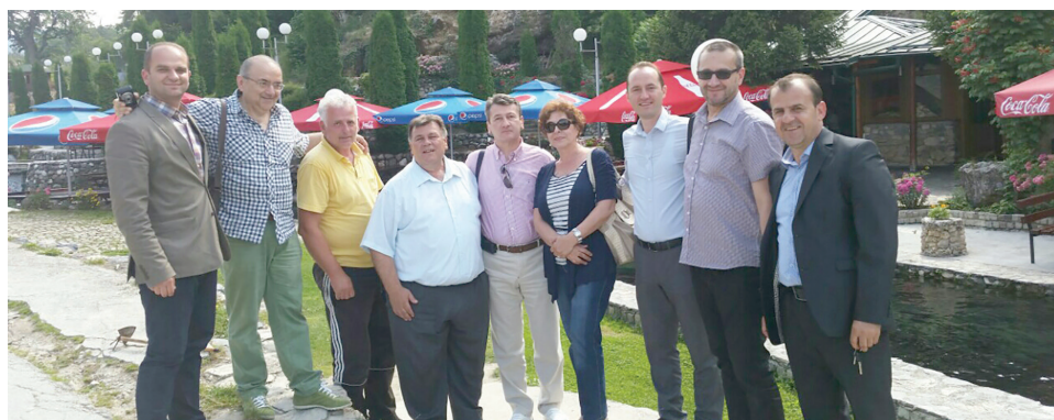
U posjeti pobratimskom Gostivaru