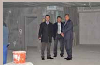
Obišli dvoranu na Grbavici

Vezano za problematiku pasa lualica, načelnici podržavaju mjere koje je poduzela Vlada Kantona Sarajevo po pitanju uklanjanja agresivnih pasa lualica, a i same općine su se uključile u te aktivnosti, kako u saradnji sa JP „LOKOM“, tako i sa ostalim higijenskim servisima. Nakon sastanka, načelnici su obišli i sportsku dvoranu na Grbavici koja je u izgradnji.