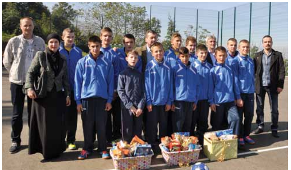
Timovi Zavoda "Mjedenica" revijalnom utakmicom otvorili igralište