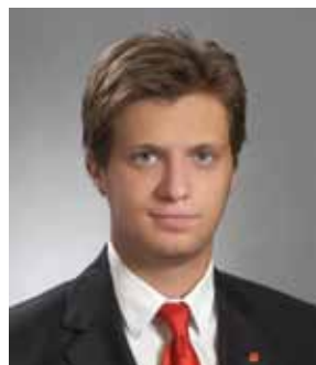
Prihvaćeni amandmani kluba SDP-a

Program rada načelnika Općine za 2015. godinu vijećnici su jednoglasno prihvatili, nakon što je predlagrač dao pojašnjenja