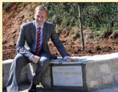
Specijalni predstavnik EU Peter Sorensen

Načelnik Hadžibajrić je, sumirajući rezultate na kraju godine, izrazio zahvalnost svim službama koje su radile na realizaciji brojnih zadataka i projekata u ovoj godini, posebno istakavši angažman uposle-