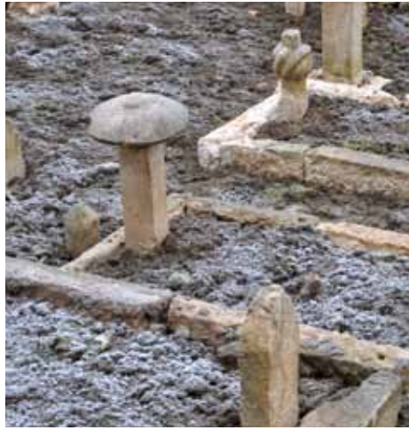
Bit će istraženo značenje nišana s kapom