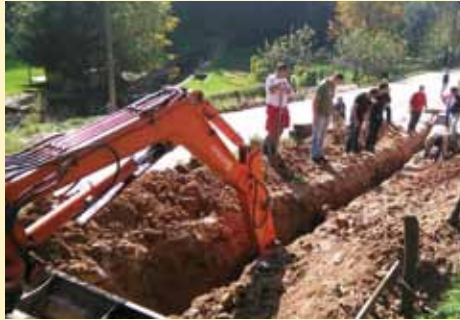
Kanalizacija na Novoj Baruthani