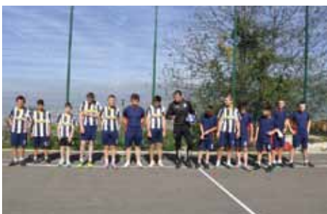
Zajednička fotografija selekcija

Sportsko igralište u ulici Iza gaja je građeno u dvije faze, 2013/14. godine. Izdvojeno je oko 150.000 KM za gradnju potpornog zida, igrališta, asfaltiranje, postavljanje zaštitne ograde i pristupnog puta.