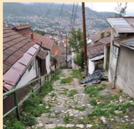
Sadašnji izgled ulice Strošići

kvalitetne zdravstvene zaštite za građane Općine. Objekat je građen tokom '60-ih godina prošlog stoljeća, a svojim kapacitetom ne zadovoljava potrebe pružanja primarne i konsultativno-specijalističke zdravstvene zaštite stanovnicima Općine. Osim toga, obezbjeđenjem adekvatnog prostora za rad uposlenika Doma zdravlja unaprijedit će se njihov rad i kvalitet usluga u skladu sa potrebama stanovništva.