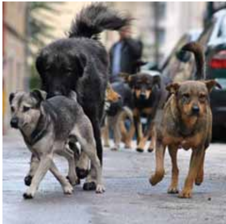
Veliki broj napuštenih životinja na ulicama

Općinsko vijeće Stari Grad zaključilo je i da se uputi zahtjev prema resornom ministarstvu u Vladi Kantona Sarajevo, odnosno Kantonalnoj veterinarskoj stanici, da se izjasne da li je moguće ponovo pokrenuti ispostavu Veterinarske stanice u Starom Gradu.