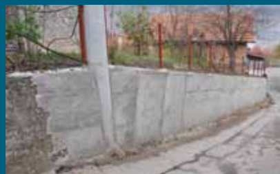
Novi zid dužine 48 metara

Izgrađen je novi potporni zid u ulici Nadlipe broj 6. Projekat je podrazumijevao uklanjanje starog dotrajalog zida, iskopavanje temelja, ugradnju željeza za temelje i betoniranje. Zid je izgrađen u dužini od 48 metara i visini od 1,7 do 2,2 metra. Izgradnju ovog zida sa oko 34.400 KM finansirala je Općina, a izvođač radova je bila firma "Bosman" iz Sarajeva.