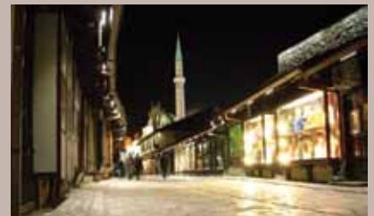
Popravljen rasvjeta u Saračima

Na Bašćaršiji, u ulici Sarači, izvršena je zamjena neispravne LED rasvjete. Prema riječima Edina Uzeirbegovića, direktora firme „ARCADE“ iz Tuzle, koja je izvodila radove, saniran je kvar i zamijenjeno 235 trafoa. Rdove na sanaciji LED rasvjete na Bašćaršiji finansirali su u jednakim omjerima Općina Stari Grad i Ministarstvo za prostorno uređenje i zaštitu okoliša Kantona Sarajevo. Vrijednost investicije je bila oko 17.900 KM.