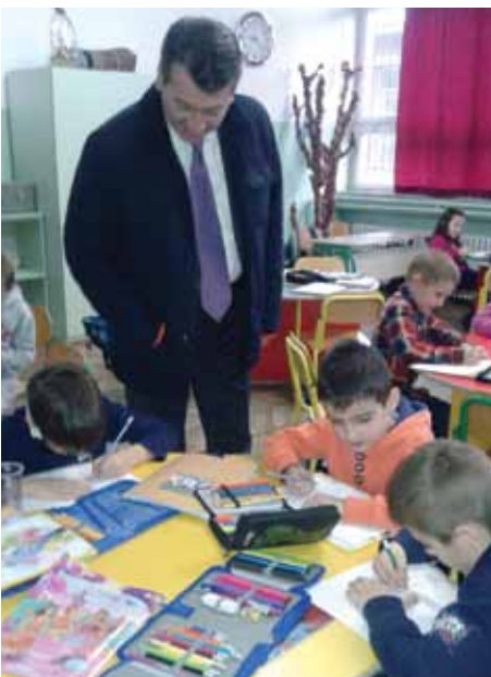
Svake godine sve manji broj prvčića