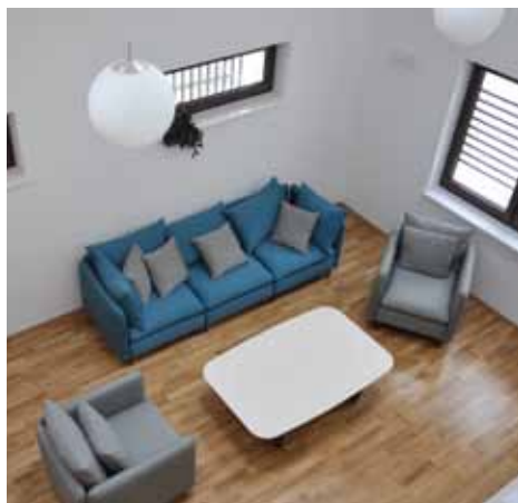
Dnevni boravak moderno opremljen