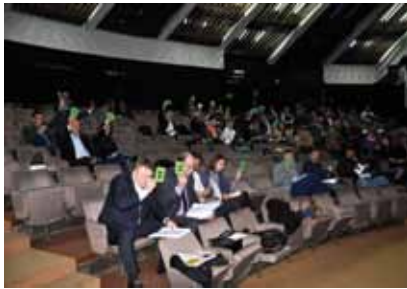
Sa 22. sjednice Općinskog vijeća

Nacrt budžeta Općine Stari Grad Sarajevo za 2015. godinu, u iznosu od 15.980.000,00 KM, usvojen je na 22. sjednici Općinskog vijeća Stari Grad, uz zaključak da se uputi u javnu raspravu koja će trajati 30 dana. Također, u javnu raspravu, koja će trajati 15 dana, upućen je i Nacrt Odluke o jedinstvenim kriterijima za raspodjelu sredstava obezbijedenih u Budžetu Općine Stari Grad za finansiranje rada boračkih udruženja.