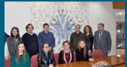
Sa predstavljenja slike u sali Općinskog vijeća

Rad simbolizira bogatstvo, snagu i zbližavanje i kontinuiranu vezu Bosne i Hercegovine sa osmalijском vlašću. "Zlatna i plava boja na slici predstavljaju moć, snagu, veselost i zbližavanje", pojasnio je prof. Hadžimelić.