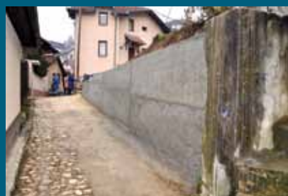
Zid koštao 11.500 KM

Potporni zid u ulici Pastrma preko puta broja 9 izgrađen je u dužini od 14 metara. Gradnja ovog zida Općinu Stari Grad koštala je oko 11.500 KM, a izvođač radova bila je firma "Bosman" iz Sarajeva.