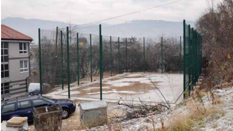
Betonirana površina i postavljena ograda

Zavod za specijalno obrazovanje i odgoj djece "Mjedenica", nakon više od 60 godina postojanja, konačno će dobiti sportsko igralište koje će koristiti oko 180 djece i korisnika. Zemljište za izgradnju igrališta, potrebne dozvole i izbor izvođača radova obezbijedila je Općina Stari Grad, a izgradnju finansira bh fudbalski reprezentativac Asmir Begović, putem svoje Fondacije.