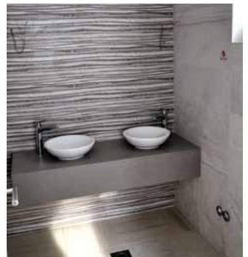
Najsavremenija kupaoička oprema

Naziv pasivna kuća (njemački Passivhaus) znači rigorozan, dobrovoljan. Passivhaus je standard energetske efikasnosti u stambenim i sličnim objektima, koji smanjuje njihov (negativni) uticaj na okolinu. Taj standard rezultira potrebom za malom količinom energije prilikom grijanja ili hlađenja.