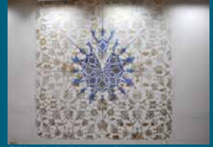
Slika simbolizira moć i snagu

Tradicionalna umjetnost zidnog slikarstva, karakteristična za osmanski period i XV stoljeće, od decembra krasi i zidove sale Općinskog vijeća Stari Grad.