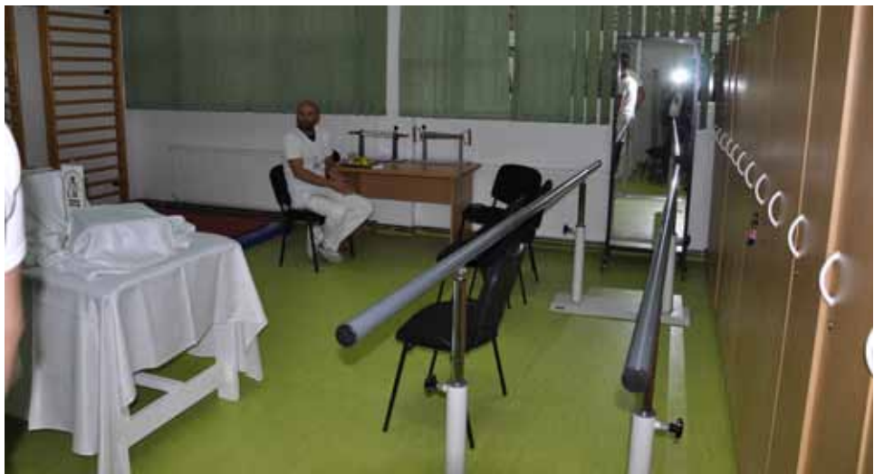
Novi centar za fizikalnu terapiju i rehabilitaciju Stari Grad

U sklopu Doma zdravlja Stari Grad već je postojao jedan ovakav Centar i nalazio se u blizini Ambasade Kuvajta,