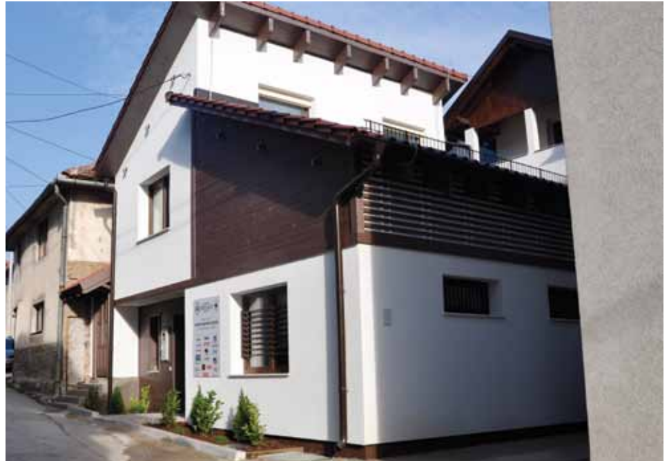
Kuća je sagrađena na Kovačima, u ulici Nadmlini 28

Kuća budućnosti štedi energiju i godišnje troši svega 15Kw/m 2 ● Ugrađen certificirani sistem grijanja za pasivne kuće ● Služit će kao ogledni primjer za sve koji žele ovako graditi