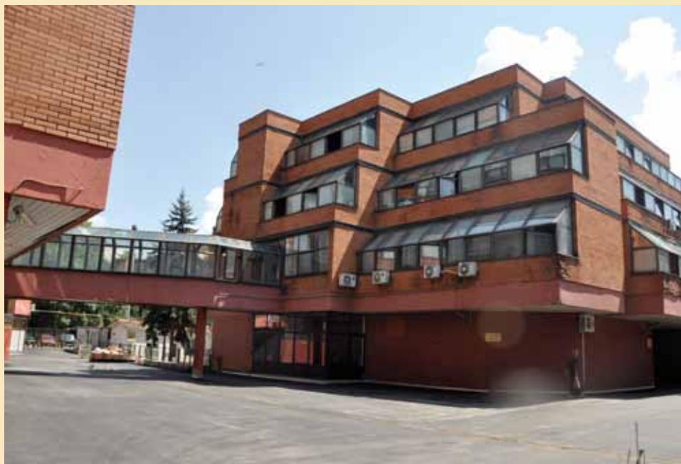
Zgrada Općine bit će utopljena

U cilju uštede potrošnje energije potrebne za grijanje, hlađenje i ventilaciju objekta, te smanjenje emisije CO 2 u okolinu, naredne godine pristupit će se i projektu poboljšanja energetske efikasnosti objekta Općine Stari Grad, tzv. "utopljanje". Realizacijom ovog projekta povećat će se toplinska udobnost, a na godišnjem nivou ostvarila bi se ušteda toplotne energije od 72%.