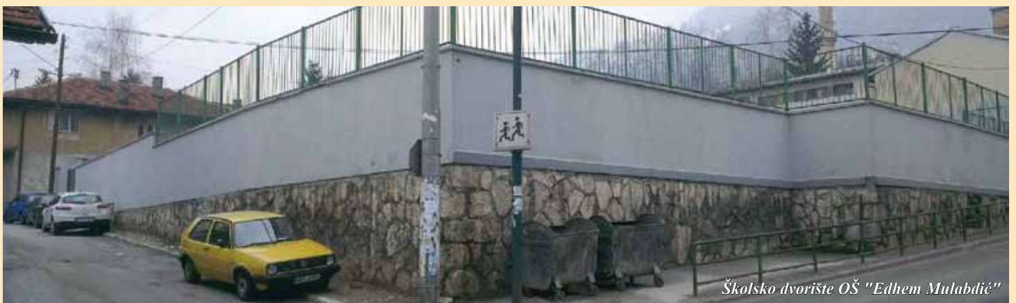
Školsko dvorište OŠ "Edhem Mulabdić"