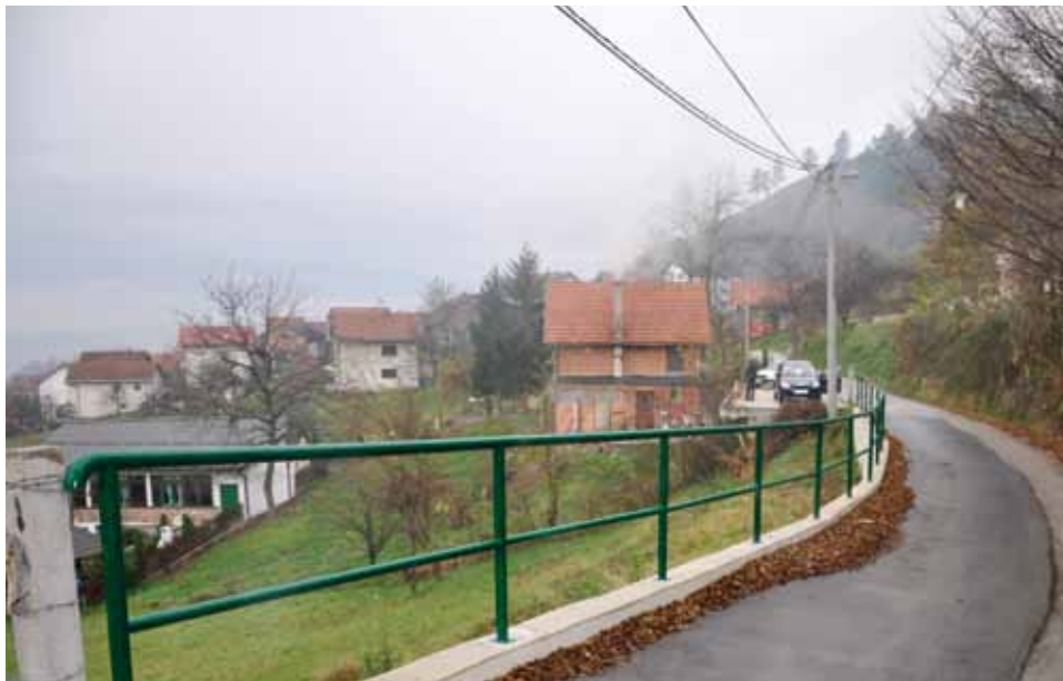
Rukohvati na Sedreniku u ulici Prvi bataljon

Projekat postavljanja novih rukohvatnih ograda na području Starog Grada za 2014. godinu je okončan, potvrđeno je u Odsjeku za komunalne poslove Općine.