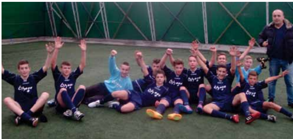
OŠ "Edhem Mulabdić" jesenji prvak

BH Telecom fudbalska liga osnovnih škola Starog Grada jedinstven je projekat u Općini • Najvažnije bilo poštovati fair play • Mnogi poznati sportisti bodrili starogradske osnovce