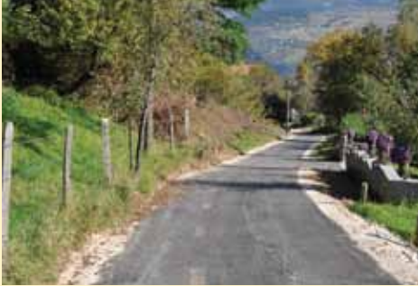
Sanirana ulica Dolovi

Potporni zidovi su dugogodišnji neriješeni problem Općine Stari Grad koji se sistemski rješava u skladu sa budžetskim sredstvima. S obzirom da je Stari Grad smješten uglavnom u padinskim dijelovima, brojne su lokacije na kojima je potrebno izgraditi potporne zidove u cilju osiguranja boljih i sigurnijih uslova života građana. Ove godine izgrađeno ih je šest: Baruthana kod broja 69, Save Skarića 9, u koritu Miljacke (kod Inat kuće), Ramića banja 40, Žagrići i Pstrma.