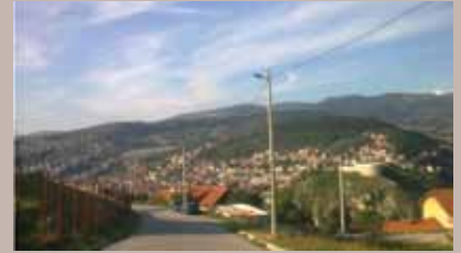
Projekat koštao 31.800 KM

U okviru projekta izgradnje, sanacije i održavanja javne rasvjete na području općine Stari Grad za 2014. godinu, postavljena je rasvjeta na 18 lokacija. Projekat je s 31.800 KM finansirala Općina Stari Grad, a izvođač radova je bila firma "Testingelektro".