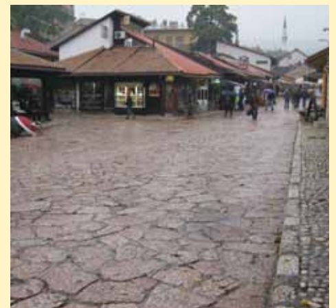
Bašćaršijski trg: Moguća rekonstrukcija u 2015.