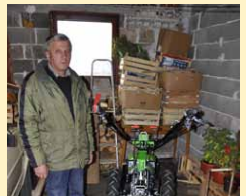
Motokultivator će im dobro doći za obradu zemlje

Ovaj projekat značajan je za ekonomsko osnaživanje žrtava mina i njihovu inkluziju u društvu, a korisnik donacije pokazao je da uprkos invalidnosti, svojim vlastitim radom osigurava egzistenciju svoje porodice.