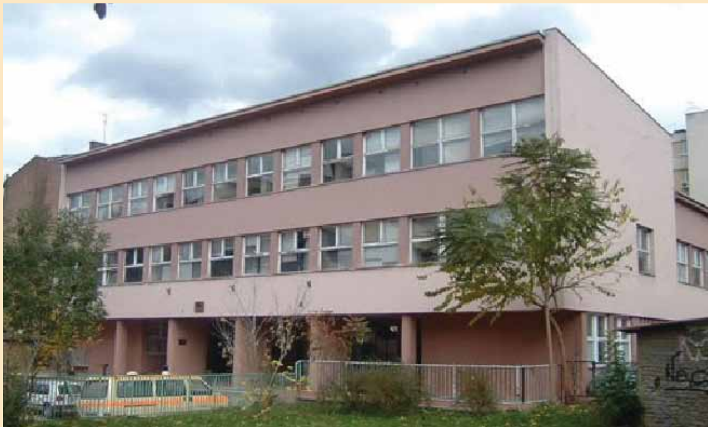
Objekat Doma zdravlja izgrađen 60-tih godina