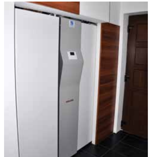
Specijalni sistem grijanja

Kako je procijenjeno, vrijednost kuće je oko 150.000 KM, odnosno 1.500 KM po m 2 , ne računajući cijenu zemljišta na kojem je sagrađena.