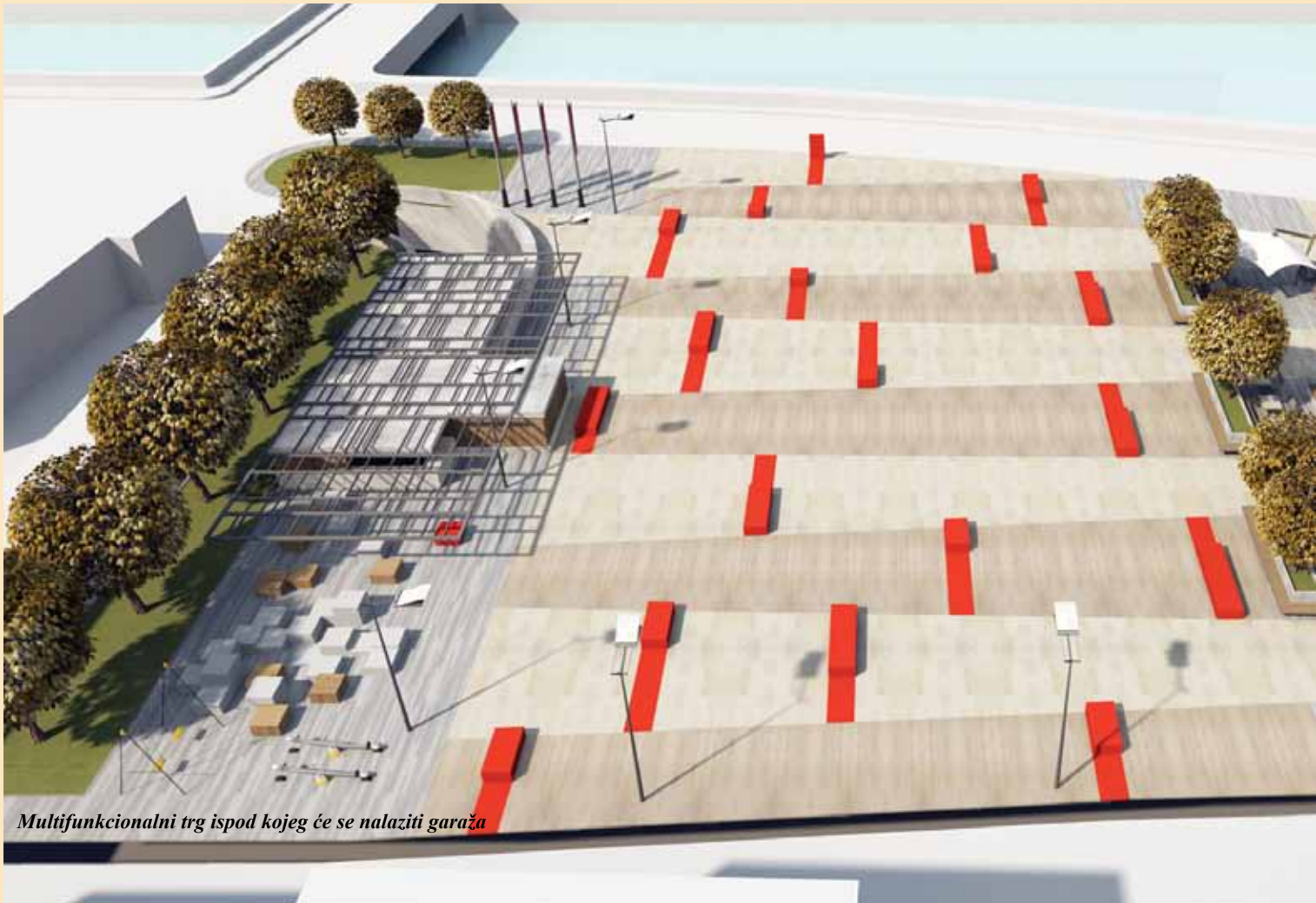
Multifunkcionalni trg ispod kojeg će se nalaziti garaža