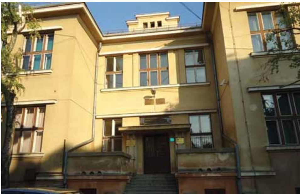
OŠ "Mula Mustafa Bašeskija"

Nakon što je u osnovnoj školi "Mula Mustafa Bašeskija" usljed pada temperature, te dotrajalosti, u potpunosti prestao sa radom kotao putem kojeg se zagrijava objekat škole, nastava u ovoj školi odvijala se u gotovo nemogućim uslovima. Općina Stari Grad je u cilju omogućavanja redovne nastave i normalnih uslova rada za više od 460 učenika i uposlenika ove škole, sa oko 20.000 KM sufinansirala nabavku i montažu kotla za zagrijavanje. Ostatak sredstava u iznosu od 30.000 KM obezbijedilo je Ministarstvo za obrazovanje, nauku i mlade KS.