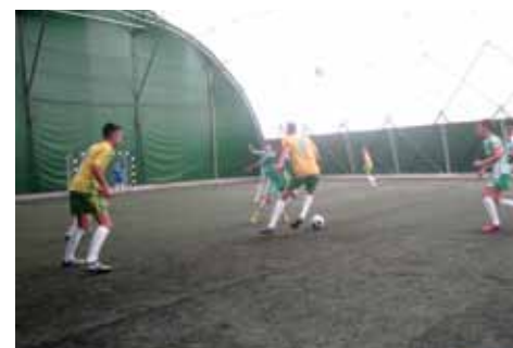
U februaru proljetna polusezona