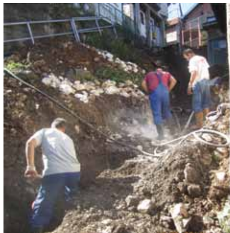
Tokom postavljanja cijevi

teren i prekopane postojeće asfaltne i tamponske površine i putevi. Uklonjene su stare i dotrajale cijevi i postavljene nove, u dužini od 80 metara, a potom su urađeni priključci.