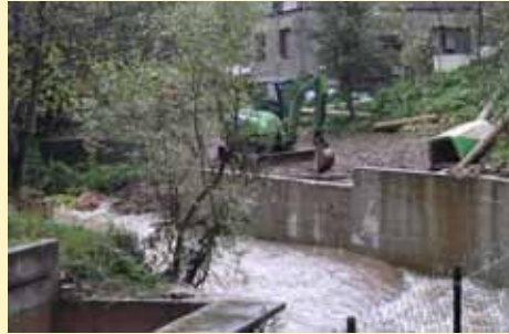
Kanalizacija na Mošćanici