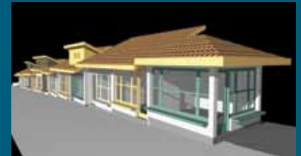
Perspektiva iz ulice Sagrdžije

U narednoj godini bi trebala biti realizovana još tri kapitalna projekta, a najzvučnija je rekonstrukcija ulice Strošići koja će početi na proljeće. U ovoj ulici živi više od 300 stanovnika, u nešto više od 100 domaćinstava. Projekat rekonstrukcije ulice vrlo je zahtjevan zbog velikog broja kuća, a radit će se kompletna izmjena infrastrukture. Projekat je vrijedan oko 600.000 KM. U narednoj godini je najavljena mogućnost i rekonstrukcije Baščaršijskog trga, te realizacija projekta Halvadžiluk, odnosno izgradnja novih dućana na Baščaršiji.