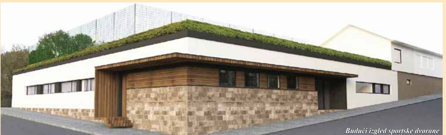
Budući izgled sportske dvorane