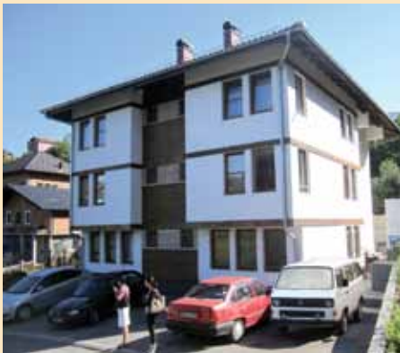
Zgrada za interno raseljene na Brusuljama

Prvu zgradu za interno raseljene izgradili smo na Brusuljama 2010. godine i tu smo smjestili 10 porodica, a na Baruthani ćemo smjestiti 11. dakle, to je stan za 21. porodicu, a preostale smo uspjeli riješiti dodjelom manjih