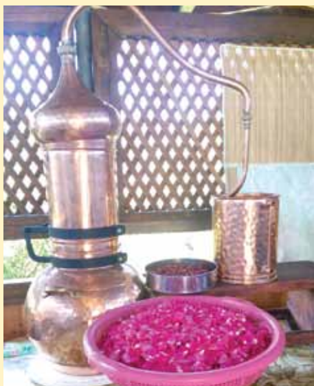
Destilator za proizvodnju eteričnih ulja

“Mi praktikujemo tradicionalnu metodu pravljenja sokova, pa stoga radimo ekstrakciju ružinih latica u vodi. Sirovinu dobivenu na ovaj način deponujemo i shodno potrebama koristimo sve do naredne sezone. Postupak dobivanja sirovine od ostalog bilja je skoro isti, a mi pored ruže koristimo i zovu, planinsku nanu, kunicu... Na imanju imamo i manje zasade autohtone sorte maline, kupine i šumske jagode, pa koristimo i te sirovine. Pravimo tradicionalne sirupe, sokove, a od ruže koja nam je najdraža radimo i đul-sirće kao i đulbešećer-slatku u limitiranim serijama”, pojašnjava Njemčević.