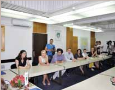
Sa potpisivanja Memoranduma o saradnji

Ljetna škola studenata, u organizaciji Europskog udruženja studenata prava BIH (ELSA BiH) održana je od 07. do 14. augusta na području općine Stari Grad, a tehničku i finansijsku podršku realizaciji ovog projekta dala je i Općina Stari Grad. Općina je snosila troškove smještaja polaznika škole u iznosu od 2.000 KM, te osigurala korištenje sala.