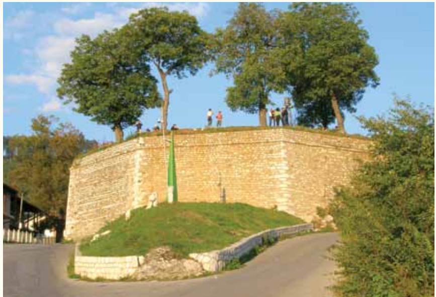
Zbog žućkastog kamena dobila ime Žuta tabija

Ova tabija je izgrađena u nepravilnom osmougaoniku od kamena, koji je sa ovih prostora. Dizala se kao mastaba,