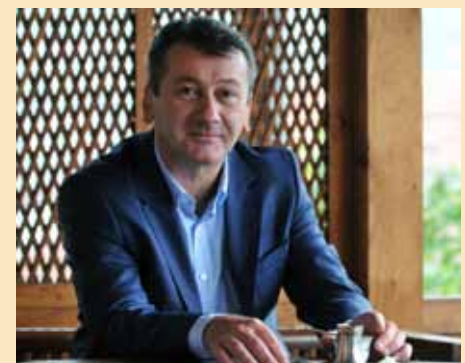
Realizovano preko 300 projekata

Pa, praktično to ne bi bilo moguće jer sam nastanjen u ovoj općini, tu sam i rođen. A, inače...Stari Grad teče