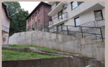
Novi zid, stepenište i ograda

Završena je izgradnja pristupnih stepenica i ograde za novi armirano-betonski potporni zid koji je izgrađen ove godine, u ulici Save Skarića broj 9.