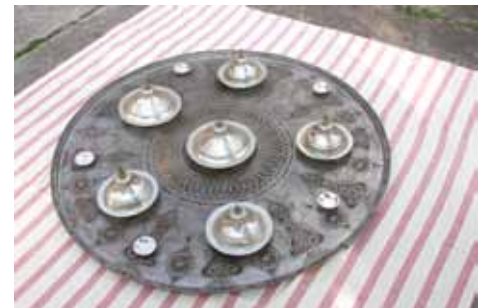
Pribor za đulbešećer

“Kroz 'Selamluk' ćemo pokazati naš način života i naše gostoprimstvo. Svakome ko dođe ovdje bit će zanimljivo da vidi iz-