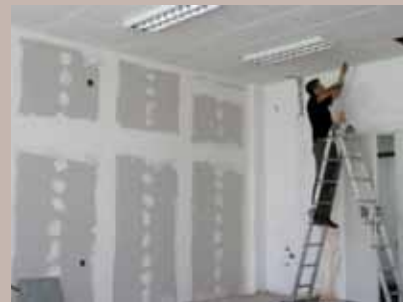
Uskoro centar za fizikalnu terapiju

U Domu kulture Logavina u toku je preuređivanje dijela prostorija u Centar za fizikalnu terapiju i rehabilitaciju Stari Grad.