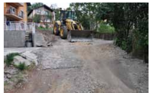
Sanacija ulice na Sedreniku

Sanaciju ulice Sedrenik čikma sa oko 11.800 KM finansira Općina Stari Grad, a izvođač radova je firma “Sarajevo-putevi”.