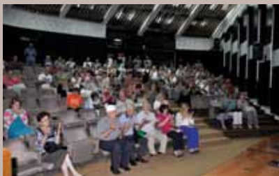
Sa podjele hedija

Općina Stari Grad je i ove godine, povodom Ramazanskog Bajrama, upriličila druženje i podjelu hedija šehidskim i porodicama poginulih boraca. Novčane hedije, u iznosu od 100 KM, dobilo je 100 porodica šehida i poginulih boraca, 50 nezaposlenih ratnih vojnih invalida i 25 nezaposlenih demobilisanih boraca.