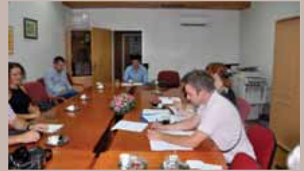
Javna rasprava u Općinskom vijeću

Javna rasprava povodom Nacrta Odluke o rasporedu poslovnih djelatnosti Općine Stari Grad Sarajevo održana je 26. augusta, 2014. godine, u prostorijama Općinskog vijeća.