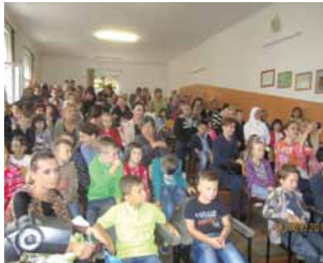
Paketici za 276 prvačica

Nova školska godina 2014/2015. počela je svečanim prijemima prvačica u svim starogradskim osnovnim školama. Za prvačice su učenici starijih razreda priredili prigodan program.