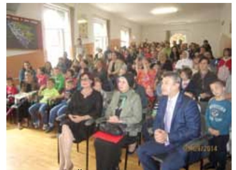
Svečanost u OŠ “Edhem Mulabdić”

Najveći broj djece ima OŠ “Mula Mustafa Bašeskija” - 68, zatim OŠ “Edhem Mulabdić” - 60, OŠ “Vrhbosna” - 40, OŠ “Hamdija Kreševljaković” - 39, OŠ “Šejh M. ef. Hadžijamaković” - 33, OŠ “Saburina” - 18 i Zavod „Mjedenica“ - 18 djece.