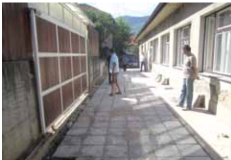
Saniran put dužine 30 metara

Sanacija puta dužine oko 30 metara koštala je oko 3.400 KM, a izvođač radova bila je firma “Set invest” iz Sarajeva.