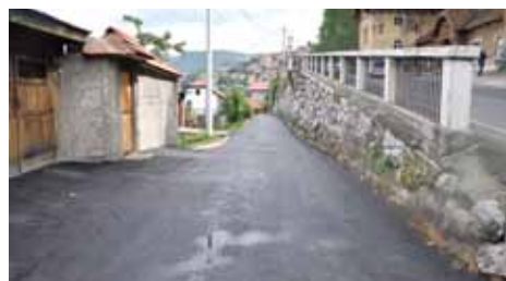
Asfaltirana ulica dužine 78 m

Sanaciju i asfaltiranje ulice Garaplina sa oko 14.000 KM finansirala je Općina Stari Grad Sarajevo, a izvođač radova bila je firma “Sarajevo-putevi”.