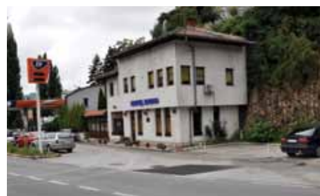
Sanirana rupa na prilazu benzinskoj pumpi

Vrijednost izvedenih radova iznosi la je oko 1.200 KM, a finansirala ih je Općina Stari Grad.