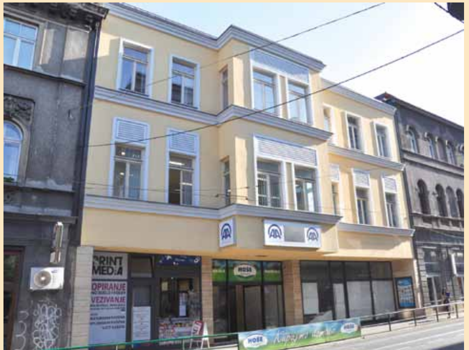
Kvadrant XII - novi poslovni objekat

Veliki broj stranaka je prošao kroz moj kabinet. Za nepunih šest godina kroz ovu kancelariju je prošlo preko 6.000 ljudi. Njihove sugestije dosta