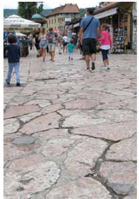
U oktobru počinju radovi

Da bi se obezbijedio slobodan tok kretanja pješaka, te neometan rad izvođača i transport materijala, Baščaršijski trg bit će podijeljen u zone za izvođenje, a prvi će se raditi oni dijelovi trga ispod kojih se nalaze instalacije vodovoda i kanalizacije. Radovi će trajati tri mjeseca.