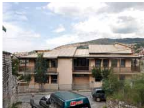
Projekat vrijedan 126.600 KM

Izvođač radova na rekonstrukciji oštećenog krova je firma "SELA" iz Sarajeva, a za zamjenu i ugradnju vanjske fasadne stolarije u prizemlju, sanaciju i uređenje dječijih sanitarnih čvorova, te adaptaciju čajne kuhinje, trpezarije i ulaznog hodnika izvođač radova je firma "Gradnja" iz Konjica.