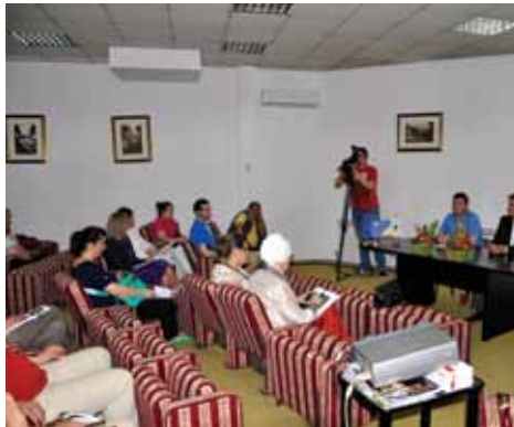
Realizovani projekti u visini od 400.000 KM