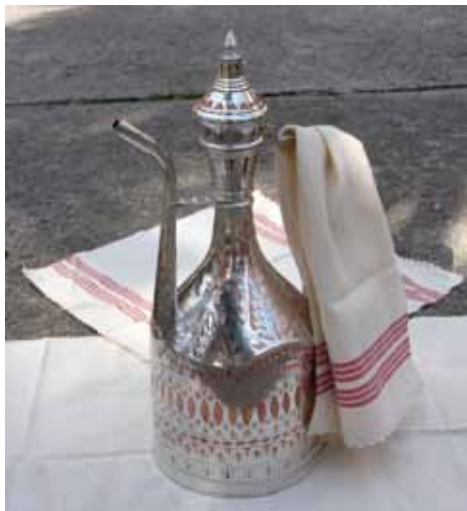
Ibrik sa mahramom

U cilju realizacije ovog projekta, Saburina kuća je opremljena tradicionalnim inventarom ručne izrade: demirlijama sa santračima, ibricima, legenima, mangalima, zarfovima, te ručno tkanim pirlitanim sofraboščama, mahramama, ponjavama... U Kući su izložene i replike tradicionalne nošnje bega i begovice iz Brusa bezistana za čiju izradu se materijal nabavljao u BiH,