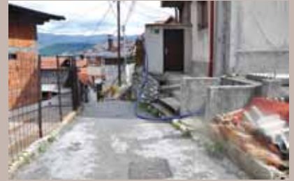
U toku radovi u ulici Paje

Počelo je postavljanje nove vodovodne i kanalizacione mreže u ulici Paje, u starogradskoj Mjesnoj zajednici Mahmutovac.