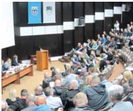
Od juna, 2014. primjenjuje se novi Poslovnik