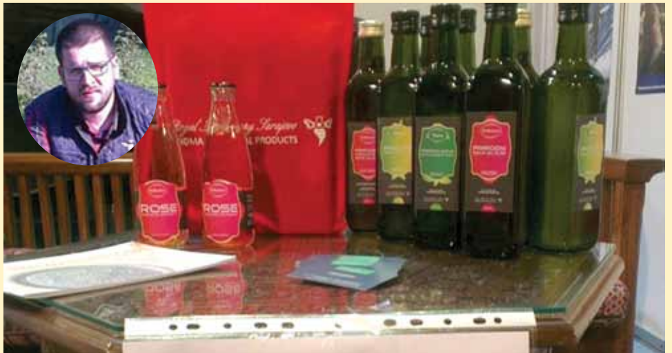
Vedad Njemčević: "Proizvodi se mogu kupiti u dućanima Starog Grada"

Priča kako je ruža ove sorte specifična, jer uz određenu njegu, rađa neprestano od maja do oktobra. Berbe su svakodnevne i odvijaju se isključivo u ranim jutarn-