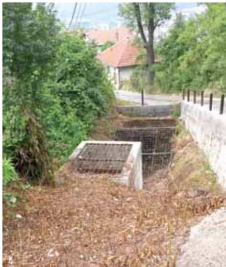
Uređena brana na Komatinu

“Pokosili smo travu i šibljke oko brane. Uklonili smo otpad i očistili branu od mulja”, pojasnili su u Službi. Za ove radove Općina je angažovala firmu “Hise A&A” iz Sarajeva, a radovi su koštali oko 1.000 KM.