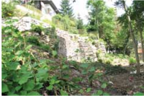
Očišćen prostor uz Staru pravoslavnu crkvu

iz Sarajeva, a vrijednost radova koje je finansirala Općina Stari Grad iznosila je oko 3.500 KM.