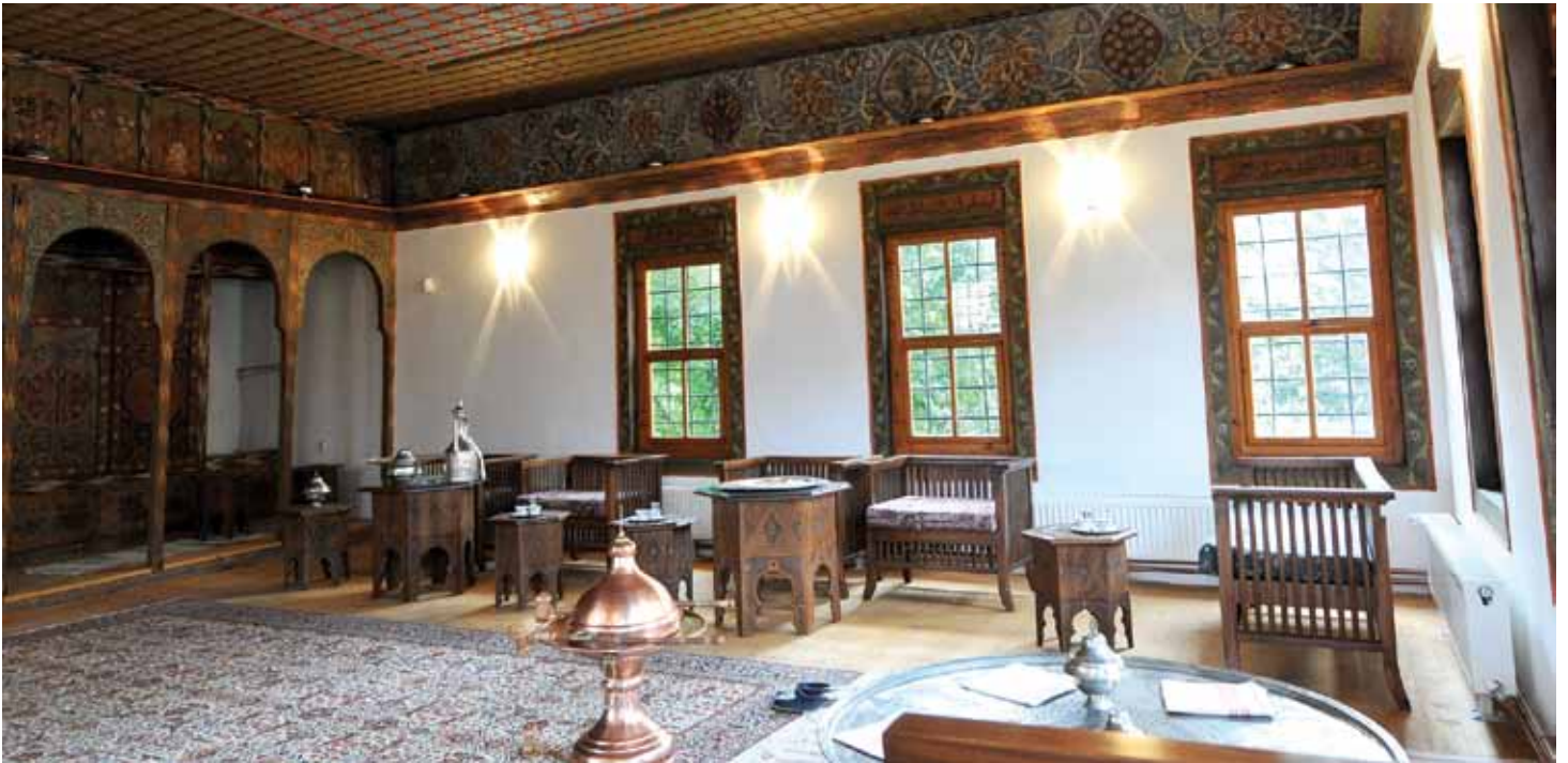
Čardak - čošak (selamluk)

fona i zidova na spratu primijenjene su specijalne metode čišćenja boje,” kazao je Hadžibajrić.