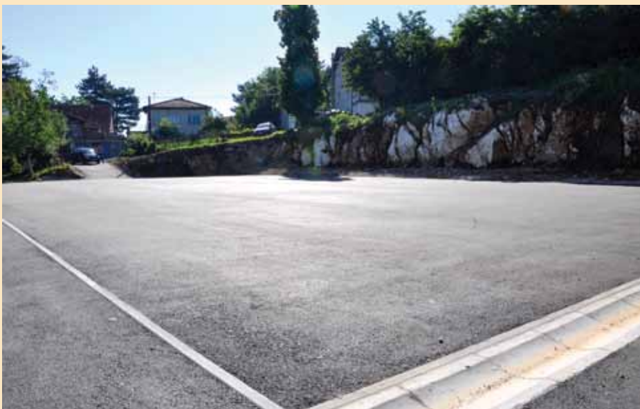
Novo igralište Iza gaja u završnoj fazi

Naše opredjeljenje je i dalje da djecu sklanjamo sa ulice i gradimo sportska igrališta za njih. Igralište Iza gaja je građeno na vrlo kamenitom i nepristupačnom terenu. Zbog toga smo ga gradili u dvije faze, dvije godine. Ovo igralište, koje je po evropskim standardima i dimenzijama poboljšat će kvalitet usluge i ponudu kada su u pitanju igrališta za mali nogomet i bit će otvoreno za sve one koji ga budu htjeli koristiti. Zahvaljujući ovom, ali i igralištima na Faletićima, u Saburinoj i u OŠ "Hamdija Kreševljaković", vrlo brzo ćemo pokrenuti malu ligu u fudbalu za djecu, u sklopu koje ćemo imati jesenji i proljetni dio prvenstva. Očekujemo da na taj način animiramo,