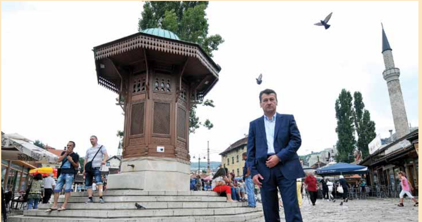
Bašćaršijski trg da kraja ove godine dobit će novo ruho

Radovi počinju u oktobru i insistirat ću da budu završeni za 120 dana... Koliko čovjek osjeća svoju općinu toliko će se unijeti u rješavanje problema... Stari Grad teče kroz moje vene i ja jednostavno ne znam drugačije