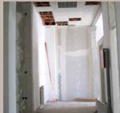
U toku preuređenje prostorija

U sklopu Doma zdravlja Stari Grad već postoji jedan takav Centar koji se nalazi u blizini Ambasade Kuvajta, preko puta Vijećnice. S obzirom na velike gužve u ovom objektu, ukazala se potreba za još jednim Centrom za fizikalnu terapiju i rehabilitaciju.