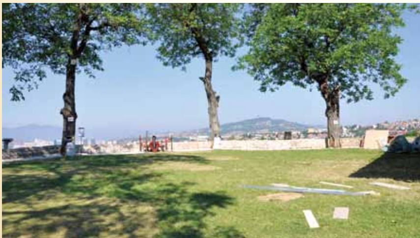
I danas se sa Žute tabije oglašava vrijeme iftara

Iako je austrougarska vojska i dalje koristila Žutu tabiju, mislimanima je bilo dozvoljeno da u vrijeme mjeseca ramazana, topom oglase vrijeme iftara. Taj običaj je bio zabranjen u vrijeme obje Jugoslavije, ali je obnovljen 1992. godine i traje do danas. Žuta tabija ili „Top“ spada u red najljepših i najpristupačnijih vidikovaca u Sarajevu.