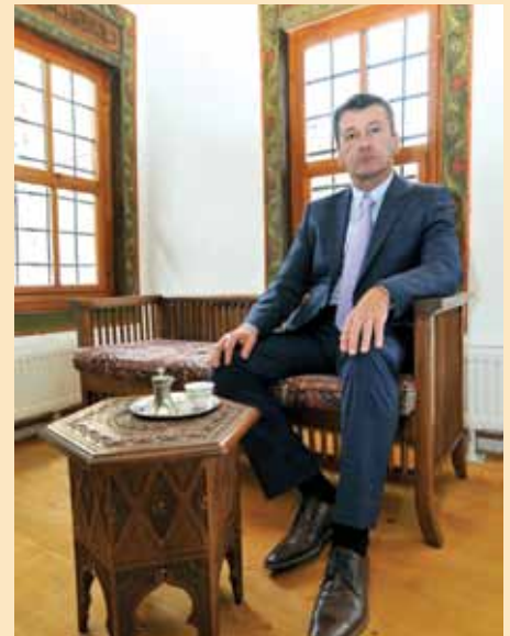
Preko šest hiljada ljudi za šest godina

Poznato je da mi nemamo nikakav povrat niti zaradu od turizma. Općinske turističke zajednice su ukinute 2001. godine kada su osnovane kantonalne i federalna. Presuda Ustavnog suda FBiH koja je donesena 2010. godine, u korist općina Stari Grad, Centar, Novi Grad i Novo Sarajevo jasno definiše vraćanje određenih nadležnosti na općine. U toj presudi je, na osnovu Zakona o lokalnoj samoupravi, jasno definisano koje su nadležnosti općina, kantona itd. Dakle, potrebno je samo implementirati presudu i problem će biti riješen, tako da bi općine dobivale i određena sredstva od privrednih, a i od turističkih djelatnosti.