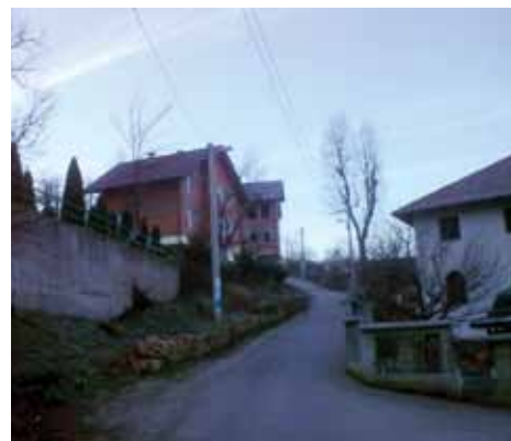
Nova rasvjeta na 15 lokacija

Projekat je s 51.833 KM finansirala Općina Stari Grad, a izvođač radova je bila firma „STEP“ iz Sarajeva.