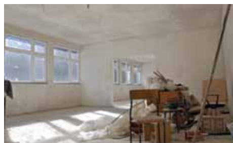
Unutrašnje uređenje dograđenog objekta

a izvođač radova je bila firma Fasader „TOP-FAS“ iz Ilijaša.