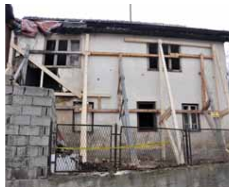
Zaštitne grede na objektu u ul. Kamenica

“S obzirom da je to napušteni privatni objekt, inspektori su izašli su na teren i zajedno sa uposlenicima DVD “Vratnik” uklonili dijelove koji su se obrušavali. Osim toga, objekat smo poduprli drvenim nosivim gredama”, pojasnili su u Službi civilne zaštite Općine Stari Grad.