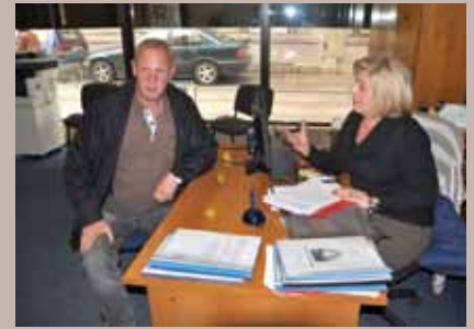
Službenik za pravnu pomoć

Uposlenici Službe za opću upravu Općine Stari Grad Sarajevo primili su 1.995 građana s ciljem pružanja besplatne pravne pomoći.