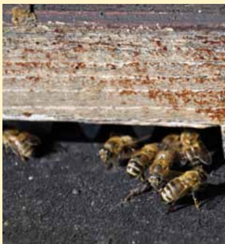
Prosječno 12 kg meda po košnici

S obzirom da ja košnice ne selim i da su ovdje tokom cijele godine, prosječno bude oko 12 kg meda po jednoj košnici. Zavisno od sezone nekada bude i oko 15 kg. Uglavnom sam zadovoljan jer to bude najbolji med vrhunskog kvaliteta.