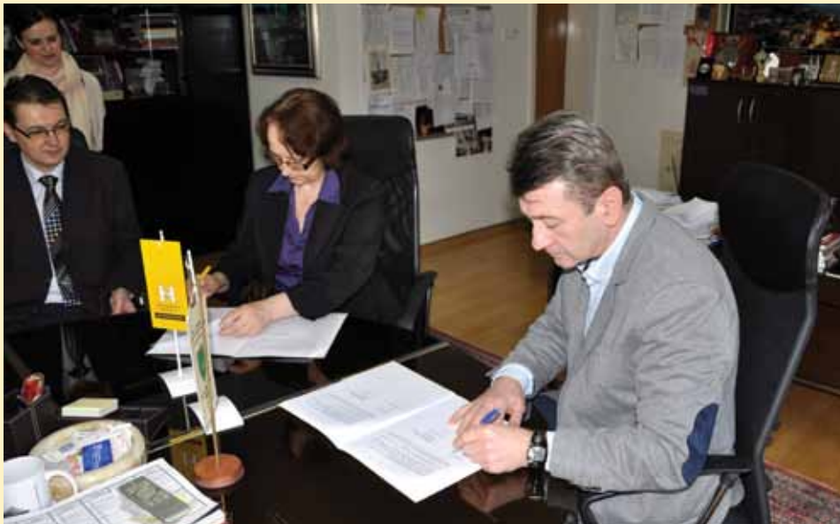
Sa potpisivanja Aneksa 3 Generalnog sporazuma

Ova faza radova podrazumjevat će građevinsko zanatske radove koji obuhvataju fasadnu stolariju, termo-fasadu, gromobranksku instalaciju, vertikalne oluke, te dio vanjskog uređenja.