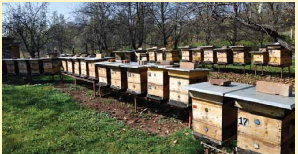
Na malom porodičnom imanju ima 60-ak košnica

“Sve sadim svojom rukom i znam da su moji proizvodi domaći i vrhunskog kvaliteta”, kazao je Čengić.