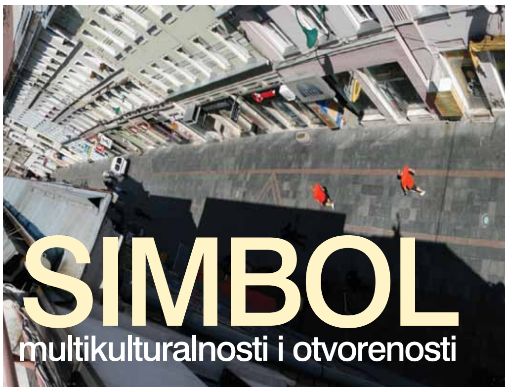
Znak koji signalizira susret kultura

Nevladina organizacija "Sarajevo susret kultura" počela je realizaciju istoimenog projekta vrijednog 50.000 KM, a kojim nastoji promovirati novu turističku atrakciju gdje će se na jednom mjestu objediniti historijski i kulturni opis glavnog grada Bosne i Hercegovine.