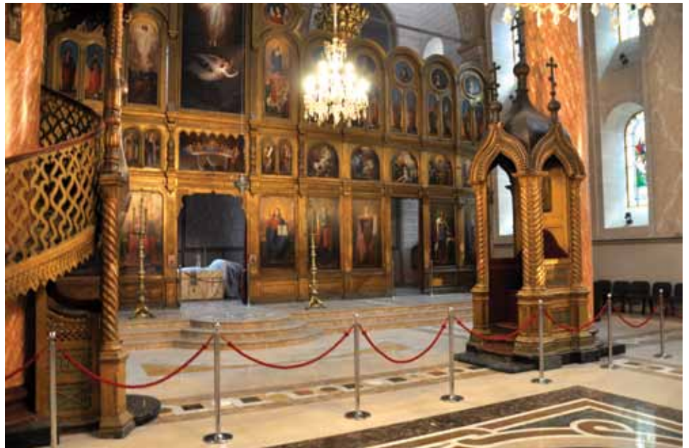
Gradnja Saborne crkve počela još davne 1862. godine