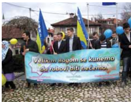
Održan historijski čas o Danu nezavisnosti