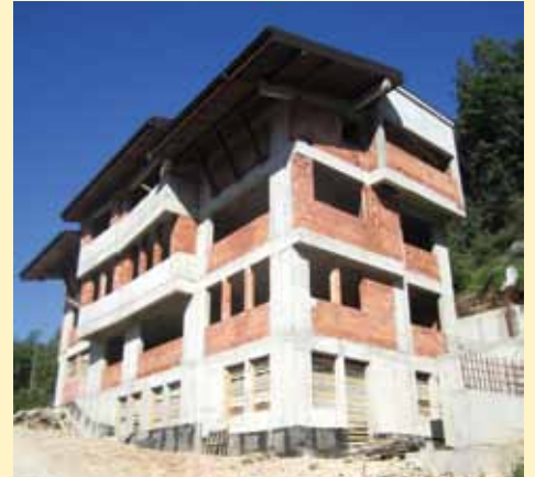
Objekat namijenjen za smještaj 11 porodica

Kako je kazao Hadžibajrić, zgrada je trebala da bude završena prošle godine, međutim resorno ministarstvo koje se na to obavezalo Ugovorom iz 2012. godine nikada nije isplatilo dogovorenih 150.000