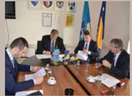
Sa sastanka načelnika gradskih općina

Korištenje javnih površina, izdavanje odobrenja za privremene priključke na struju bespravno izgrađenih objekata, te tumačenje određenih odredbi Zakona o prostornom uređenju koje je izradilo Ministarstvo prostornog uređenja i zaštite okoliša KS, bile su teme sastanka načelnika četiri gradske općine.