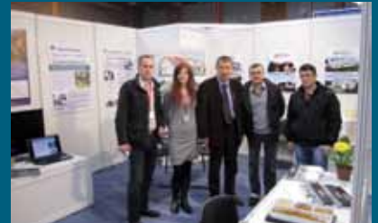
Ekipe Općine i firme "Promo" na Sajmu

Općina Stari Grad Sarajevo učestvovala je na Sajmu energetske efikasnosti u zgradarstvu u okviru 36. Međunarodnog sajma građevinarstva "SaGra". Općina je putem Službe za obrazovanje, kulturu, sport i lokalni razvoj zajedno sa firmom "Promo" d.o.o predstavila projekat "Naša pasivna kuća".