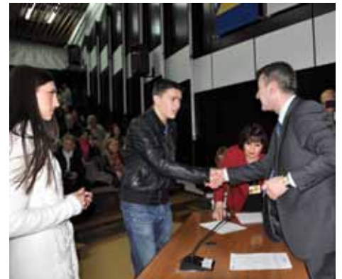
Za učenike i studente boračke populacije 185 stipendija

“Od 2004. do 2008. godine Općina je u svrhu stipendiranja izdvajala od 6.000 do 80.000 KM. Od 2009. do danas taj iznos povećali smo na čak 260.000 KM. Već su uplaćena sredstva za prvih šest mjeseci”, kazao je Hadžibajrić, te dodao da je u teškoj političkoj i ekonomskoj situaciji za mlade ljude jedini izlaz u obrazovanju i nauči te da će Općina nastaviti putem stipendija i na druge načine pružati podršku mladima.