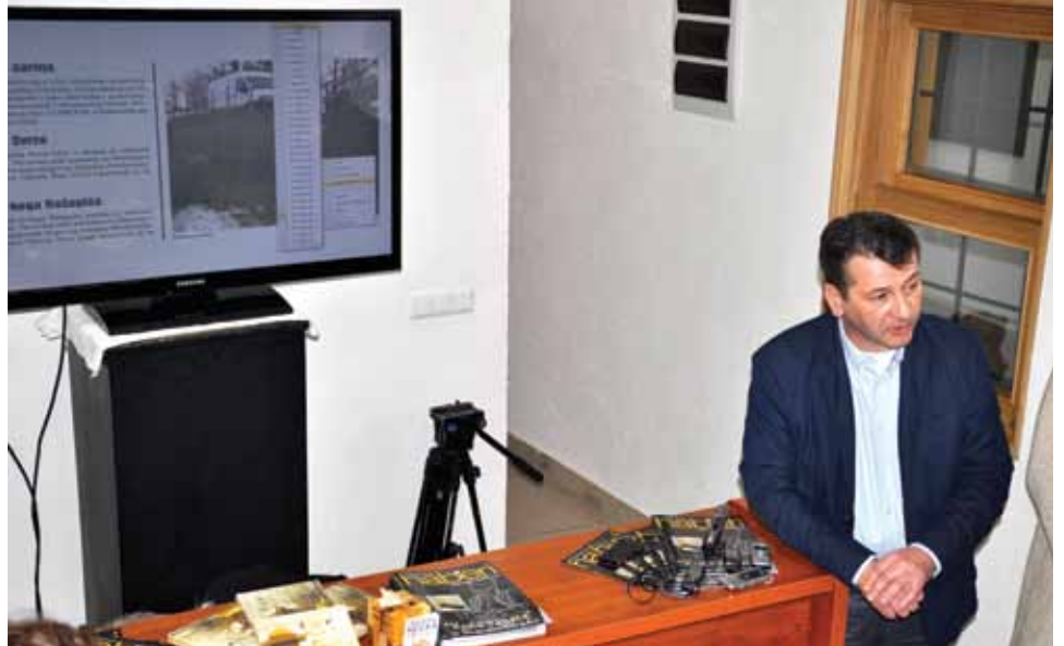
Urađeno mnogo u prošloj godini

Urađeno je također i mnogo u obnovi i sanaciji škola. Urađene su instalacije u OŠ "Vrhbosna", te novi ulaz područnoj