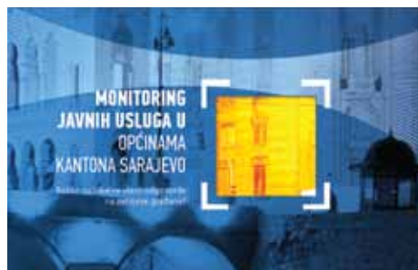
Građani zadovoljni vodosnabdijevanjem, rasvjetom...

“Građani su nezadovoljni dostatnom socijalnom zaštitom, javnim prijevozom, a najlošija je ocjena data zelenim površinama kojih imamo sve manje. Malo je dječijih igrališta i sportskih terena, a tu je i problem klizišta, zagađenosti zraka”, kazala je