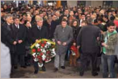
Godišnjica masakra na Markalama

Zajedničkom komemorativnom sjednicom Skupštine Kantona Sarajevo, Gradskog vijeća Grada Sarajeva i općinskih vijeća KS, obilježen je Dan sjećanja na stradale građane Sarajeva u periodu opsade grada od 1992. do 1995. godine i 20. godišnjica masakra na Markalama. Na ovaj dan, prije 20 godina, od minobacačke granate ispaljene sa položaja Sarajevsko-romanijskog korpusa vojske Republike Srpske, na sarajevskoj pijaci Markale poginulo je 67 ljudi, a ranjeno još 142 osobe.