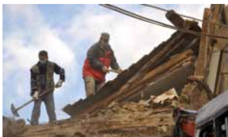
Uklonjem sprat zgrade u ul. M.M. Bašeskije

S obzirom da je riječ o hitnoj intervenciji, ovaj zahvat Općina je finansirala sa oko 7.000 KM.