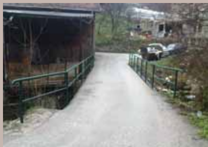
Zaštitna ograda na Obhodži

Postavljene su zaštitne ograde na mostovima Suhodol na Faletićima dužine 20 metara i u ulici Moščanica čikma na Obhodži dužine 22 metra.