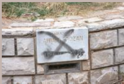
Ponovni napad na Aleju ambasadora

Aleja ambasadora je ponovo bila na meti vandala. Posljednji put vandali su oštetili tri ploče sa imenima ambasadora.