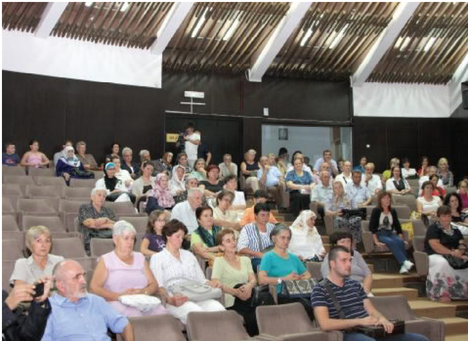
S podjele bajramskih hedija

Općina Stari Grad je i ove godine, povodom Ramazanskog bajrama, organizovala druženje i podjelu hedija šehidskim i porodicama poginulih boraca. Druženje uz kafu i sokove upriličeno je u Velikoj sali Općine, drugog dana Bajrama koji se tradicionalno obilježava kao Dan šehida. Za stotinu šehidskih i porodica poginulih boraca obezbijedena