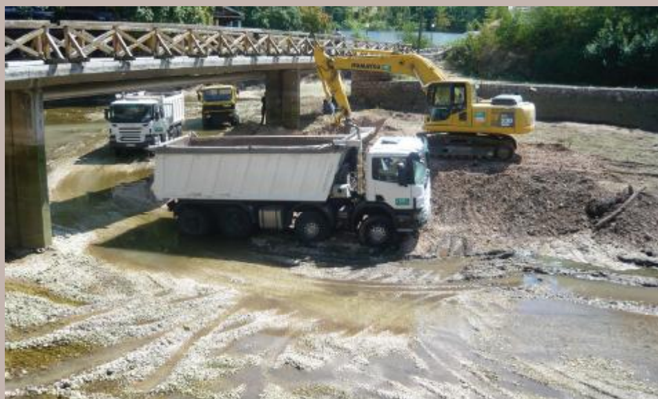
Iz jezera izvučeno oko 15.000 kubika šljunka

je. U sklopu ovog projekta u mašinskoj sali ugrađeni su novi elektromotori, kočnice, zaštitne i elektro sklopke, kao i