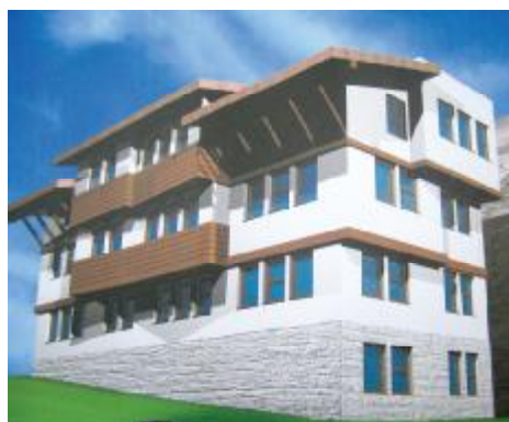
Maketa nove zgrade za interno raseljene

Obezbijeden je novac za prvu fazu projekta i u ovoj godini bit će položen kamen temeljac za gradnju zgrade.