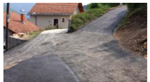
Hošin brijeg čikma

Hošin brijeg čikma do broja 54 asfaltirana je u dužini od 70 i širini 3,4 metara. U sklopu ovog projekta pored asfaltiranja izgrađen je novi prilazni put kućama i okretnica za vozila. Ovaj projekat koštao je oko 9.500 KM.