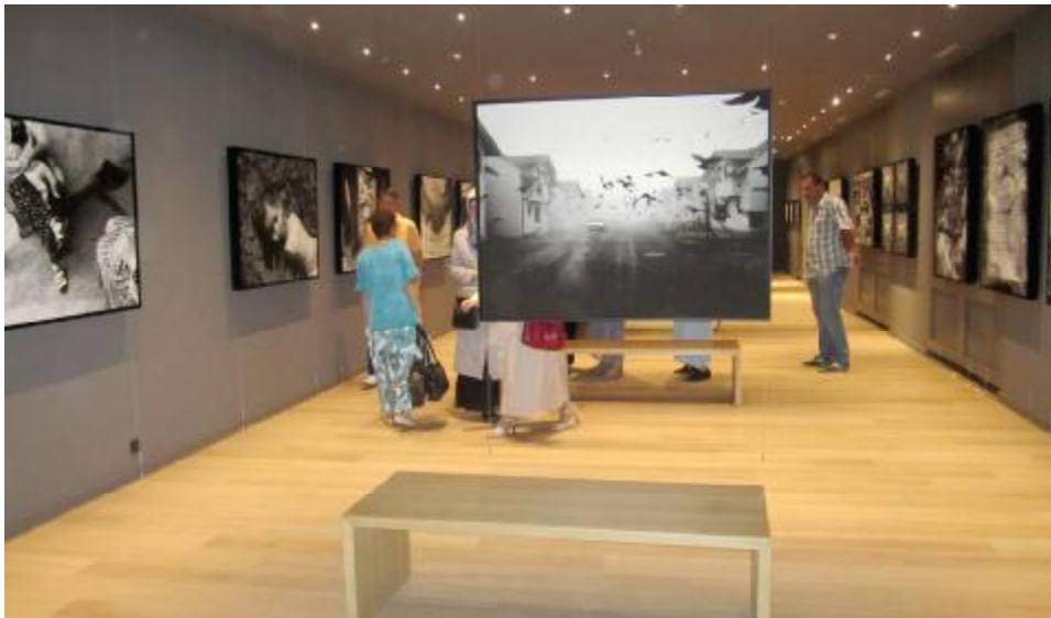
Memorijalna galerija - sjećanje na stradale Srebreničane

Memorijalnu galeriju, čiji su organizatori Turska agencija za međunarodnu saradnju i koordinaciju (TIKA) i Općina Stari Grad, vodit će Udruženje “Kultura sjećanja”.