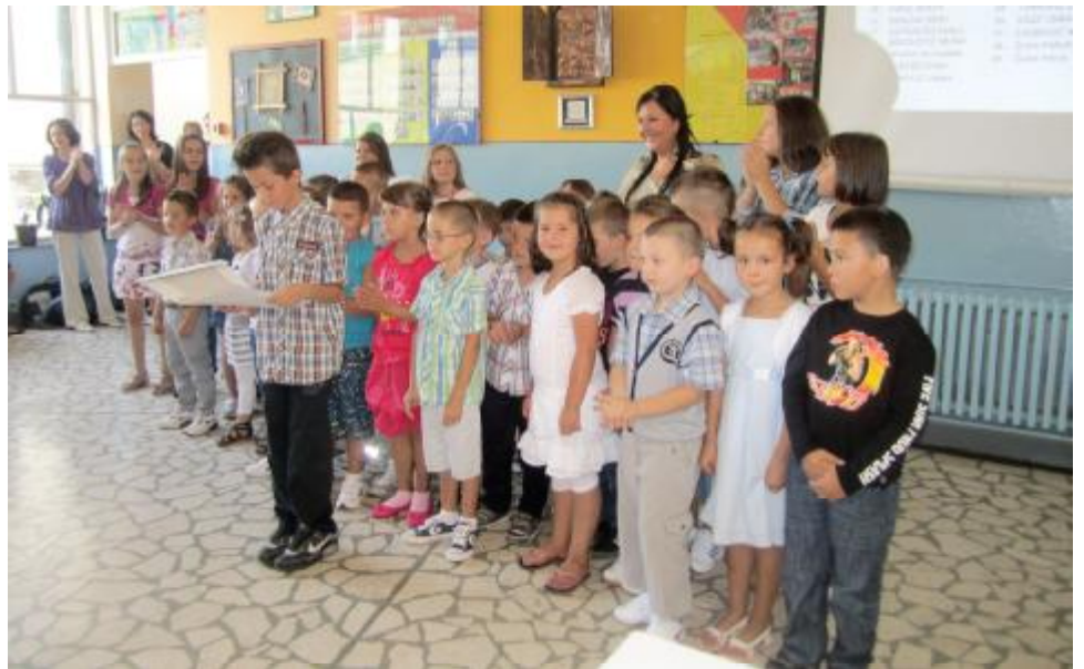
Dobrodošlica za prvačiće OŠ "Šejh Muhamed ef. Hadžijamaković"