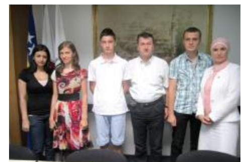
Studenti i srednjoškolci dobitnici stipendija

Glavni kriterij za odabir stipendista bila je prolazna ocjena u prethodnoj školskoj godini: za srednjoškolce najmanje 4,8, a za studente 8,5.