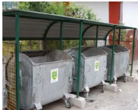
Ploča kod muzeja "Alije Izetbegović"