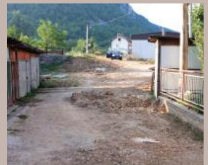
Novi fekalni sistem

Rekonstrukcija kanalizacione mreže u Ulici Baruthana u starogradskoj Mjesnoj zajednici Mošćanica urađena je početkom jula, ove godine. Zamijenjen je postojeći fekalni sistem i postavljene nove kanalizacione cijevi. Postojeći sistem bio je nedovoljan da primi kompletnu odvodnju pa su se fekalije izljevale na ulicu.