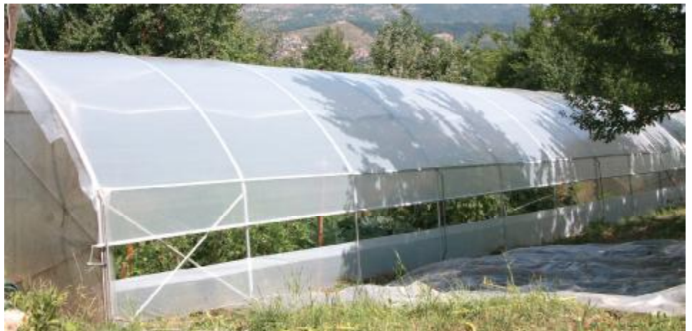
Jedan od popravljenih plastenika

Projekat popravka plastenika u Starom Gradu oštećenih tokom obilnih snježnih padavina u februaru, koji je počeo u avgustu, je u toku. Sve plastenike koje je snijeg uništio, njih 53, sanirat će uposlenici firme "ITC".