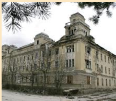
Kasarna Jajce jedan od prioriteta

- Iako je u prethodne četiri godine mnogo urađeno u oblasti komunalne infrastrukture u Starom Gradu, posao još nije završen. Procjenjujem da je urađeno 60 odsto posla. Preostalo je još 40 odsto. Svega 30 odsto teritorije Starog Grada je urbana sredina, dok je ostatak padinski dio u čiju se infrastrukturu godinama nije ništa ulagalo. Trend sanacije i izgradnje ulica i komunalne infrastrukture u ovom dijelu, koji smo negovali prethodne četiri godine, nastaviti ćemo i ubuduće. Poseban akcenat ćemo staviti na zamjenu i izgradnju vodovodne i kanalizacione mreže jer je nedopustivo da u 21. vijeku ljudi nemaju ni vode ni kanalizacije. Jedan od ključnih problema Starog Grada u njegovom užem gradskom jezgru je nedostatak parking prostora i istrajati ćemo u ideji izgradnje podzemnih garaža. Ponovo ćemo pokrenuti procedure za izgradnju ovih garaža na već poznatim lokacijama. Uzimajući u obzir ozbiljnost i težinu ekonomske situacije