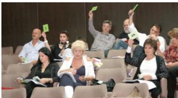
Vijećnici usvojili rebalans budžeta

"Ako se Općinsko vijeće slaže, službe će već za avgustovsku sjednicu pripremiti materijal za Prijedlog Rješenja o sticanju prava na gradsko građevinsko zemljište po Javnom konkursu radi izgradnje podzemne garaže "Šahinagića ulica", istakao je Hadžibajrić. Na 41. sjednici Općinskog vijeća usvojen je i Prijedlog Odluke o dodjeli pomoći za sanaciju štete od elementarne nepogode. Općinsko vijeće je jednoglasno potvrdilo