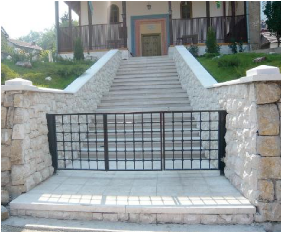
Novo stepenište bistričke džamije

Ferhad-begovu džamiju (Ferhadija džamiju) u Sarajevu izgradio je bosanski sandžak-beg Ferhad-beg Vuković-Desisalić 1561. i 1562. godine i s haremom proglašena je nacionalnim spomenikom Bosne i Hercegovine. Ferhad-beg je u sklopu džamije podigao mekteb, česmu i imaret (javnu kuhinju), koji su stradali u požaru 1697. godine. Mekteb je obnovio Mehmed-beg Dženetić, ali je i ta zgrada izgorjela 1879. godine. U ovom mektebu je jedno vrijeme bio muallim i poznati sarajevski ljetopisac Bašeskija. Od svih Ferhad-begovih objekata do danas su jedino sačuvani džamija i oko nje malo groblje.