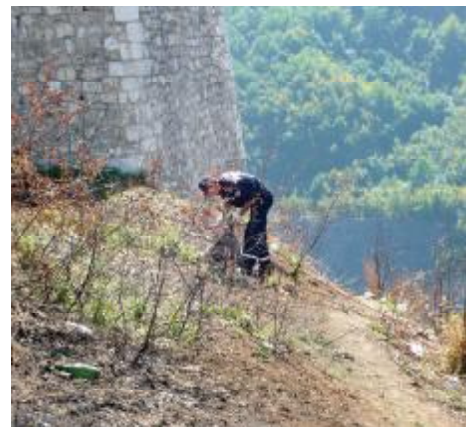
Vatrogasci u akciji čišćenja na Bijeloj tabiji

U KJKP "Rad" su kazali kako je sa sve četiri lokacije odvezeno oko pet tona smeća. I u akciji koja je bila organizovana 8. septembra, uposlenici ovog preduzeća s četiri lokacije odvezli su oko četiri tone smeća.