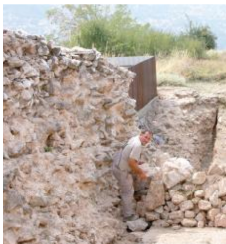
Sanacija bedema u dužini od 28 metara

Pripremni radovi za sanaciju Vratničkog bedema su počeli i u toku je raščišćavanje zida od rastinja i slabog vezivnog kamena.