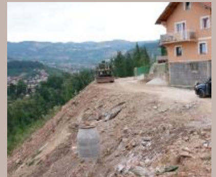
Priključci za pet domaćinstava

Rekonstruisana je kanalizaciona mreža u Ulici Pogledine u Mjesnoj zajednici Hrid – Jarčedoli. "U ovoj ulici kod broja 1 mještani nisu imali kanalizacionu mrežu, tako da je postavljena nova mreža u dužini od 56 metara", istakli su u Službi za komunalne poslove i investicije, te dodali da su u sklopu projekta urađeni i priključci za pet domaćinstava. Izgradnja mreže u Ulici Pogledine koštala je oko 25.000 KM. Finansijer je bila Općina Stari Grad, a izvođač radova firma "SET Invest".