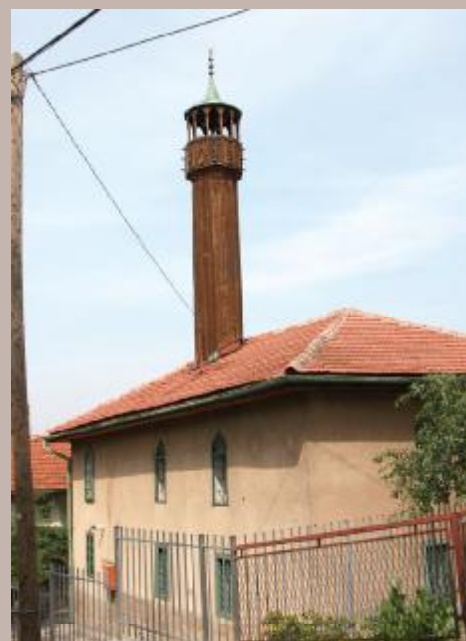
Sagr-hadži Alijina džamija

dužine oko 3.200 metara voda sa Brusa na Trebeviću dovodi u centralu koja se koristi za pokretanje turbina i proizvodnju električne energije. Centrala je izgrađena u periodu od 1913. do 1917., a puštena je u rad 1918. godine. Bila je u pogonu sve do 1999. godine.