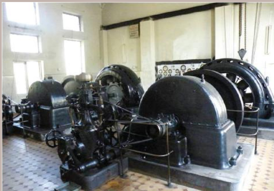
Turbina na hidrocentrali hrid