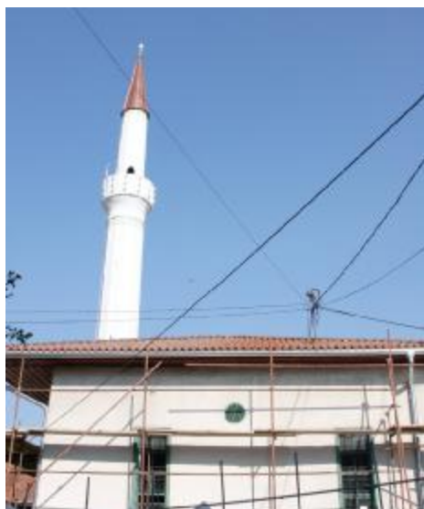
Sanirana munara Šejh Feruhove džamije

Graditeljska cjelina - Abdesthana (Šejh Feruhova) s grobljem i česmom u Sarajevu proglašena je 11. marta, 2011. godine nacionalnim spomenikom Bosne i Hercegovine. Džamija Šejha Feruha, poznata u narodu pod nazivom Abdesthana, smještena je iznad Kovača u mahali po kojoj je i dobila ime. Osnivač džamije je izvjesni Šejh Feruh, a izgrađena je prije 1516. godine.