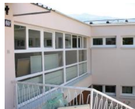
Kvalitetno grijanje u vrtiću “Biseri”

Grad s 30.000 KM. Utopljanje objekta počelo je u junu, a završeno u avgustu 2012. godine. Izvođač radova bila je firma “Fain inžinjeri”.