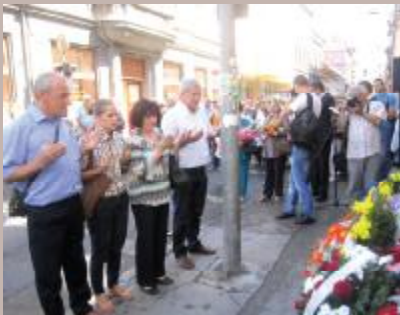
S polaganja cvijeća

Polaganjem cvijeća i učenjem Fatihe u Ulici Mula Mustafe Bašeskije do broja 64 (ulaz u Gradsku tržnicu) i Ulici Halači delegacija Općine Stari Grad odala je počast ubijenim sugrađanima.