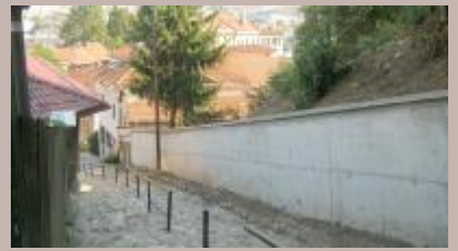
Novi potporni zid dug 40 metara

Izgrađen je novi armirano-betonski potporni zid u Ulici Save Skarića u starogradskoj Mjesnoj zajednici Mjedenica.