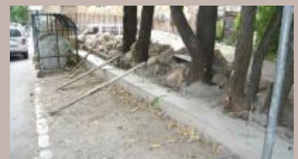
Uklonjen zid kod osnovne škole

Uklonjen je stari i ruševni potporni zid u Ulici Konak br. 5 u starogradskoj Mjesnoj zajednici Bistrik. Riječ je o zidu koji se nalazio u neposrednoj blizini Osnovne škole "Edhem Mulabdić".