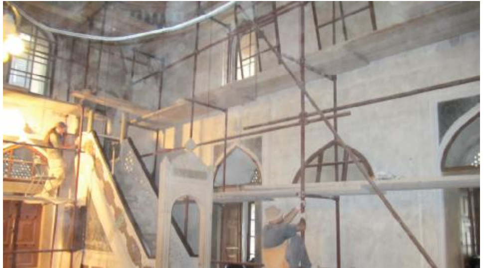
U toku restauracija unutrašnjosti Ferhadija džamije