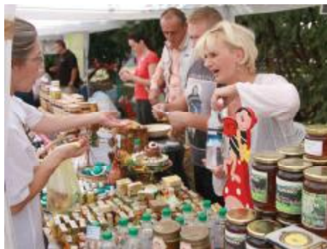
Bogata ponuda proizvođača meda

Podršku u organizaciji sajma i ove godine su pružili Ministarstvo poljoprivrede, vodoprivrede i šumarstva BiH, Vlada Kantona Sarajevo, Općina Stari Grad, USAID/Sida Farma projekat.