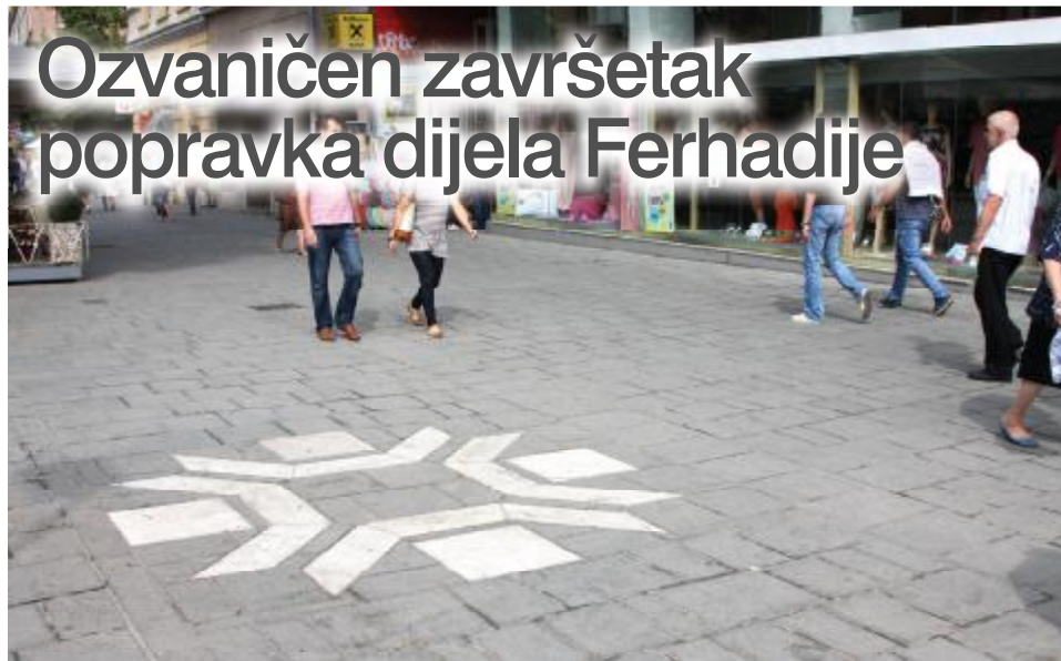
Nova "pahuljica" u Ulici Ferhadija

Rekonstruisana je dionica centralne starogradske Ulice Ferhadija, što je i ozvaničeno 10. jula, ove godine.