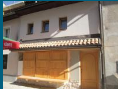
Projekat koštao 47.600 KM

Izgrađen je novi zamjenski poslovni prostor u Ulici Ćurčiluk mali br. 23. U ovoj ulici ranije se nalazio stari i dotrajali poslovni prostor. Općina Stari Grad pristupila je uklanjanju tog i izgradnji novog poslovnog prostora s prizemljem i galerijom. Izgradnju novog poslovnog prostora s 47.600 KM finansirala je Općina Stari Grad, a izvođač je bila firma "Neimari".