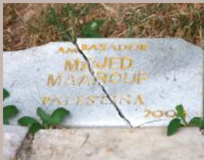
Vandali polomili ploče

Ovo je još jedan čin nesavjesnog ponašanja i vandalizma neodgovornih građana u Aleji ambasadora. Do sada je Općina u nekoliko navrata izdvajala novac i mijenjala oštećene sadnice lipa, polomljene klupe i ploče, a kako bi se ovom vandalizmu stalo u kraj Općina