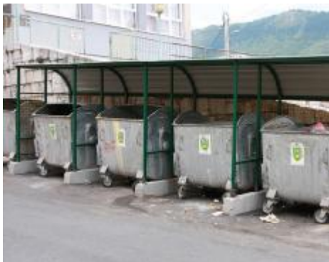
Nove niše u Ulici Carina

koji će zaštititi kontejnere od padavina i spriječiti širenje neugodnih mirisa", pojasnili su u Službi za komunalne poslove i investicije Općine Stari Grad. Projekat s 30.000 KM finansira Općina Stari Grad, a izvođač radova je KJKP „Rad“.