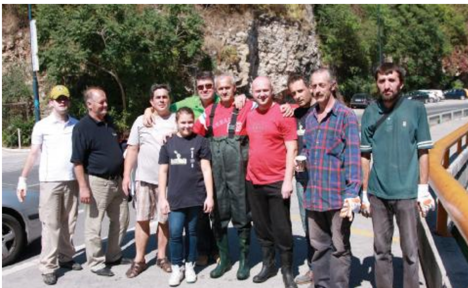
Volonteri na Bentbaši