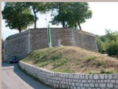
Općina reagovala na zahtjev građana

Služba za komunalne poslove i investicije Općine Stari Grad reagovala je na web pitanje upućeno od građana o otpadu koji je bio odložen pored Žute tabije. Ustanovljeno je da su posjetioci poslije iftara, tokom Ramazana, ostavljali velike količine smeća. Služba je stupila u kontakt sa KJKP "Rad" i zatražila svakodnevno prikupljanje i odvoz smeća sa Žute tabije, što je u većoj mjeri ispoštovano. Po završetku Ramazana pristupilo se temeljitom čišćenju Žute tabije i odvozu smeća, tako da ovaj nacionalni spomenik sada ponovo sija starim sjajem.