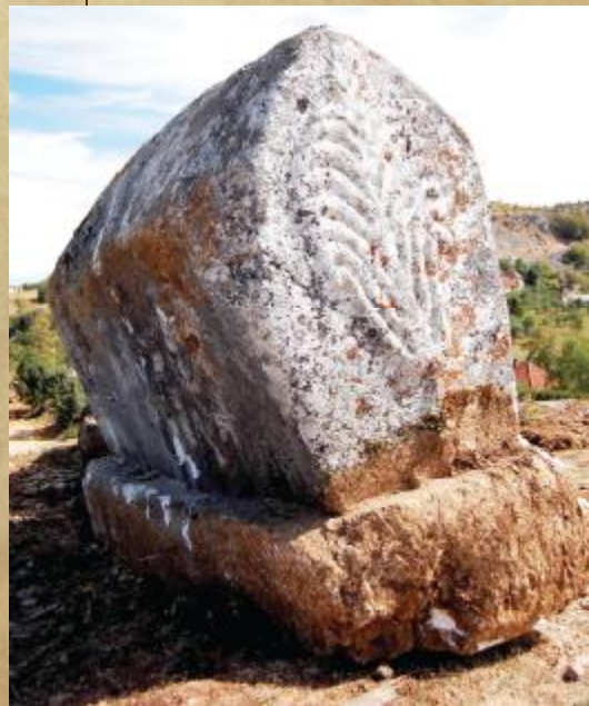
„Neka oprosti gospoda Evropa, samo Bosna ima spomenike, STEĆKE. Šta je stećak? Oličenje gorštaka, Bosanca! Šta radi Bosanac na stećku? Stoji uspravno! Digao glavu, digao ruku! Ali nigdje nikad, niko nije pronašao stećak na kome Bosanac kleči ili moli, na kome je prikazan kao sužanj.“ (Miroslav Krleža, 1893-1981.)

zvali: zlamen, bilig, kam, mramor, kuća i vječni dom. Čovjek modernog doba još od XIX st. zove ih stećkom. Valjda zato što ne zna za Vječni dom, a kako bi i znao kad je, kako kazuju perenijalisti XX stoljeća, homo modernus – čovjek trenutka, čovjek koji ne zna odakle je ni kamo će.