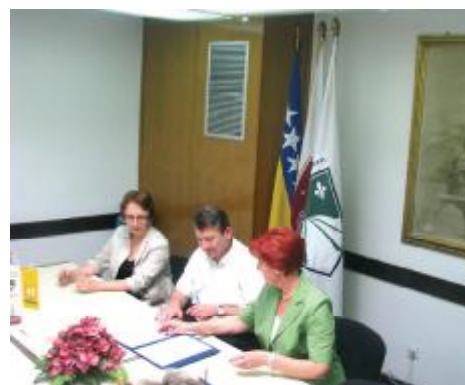
S potpisivanja sporazuma