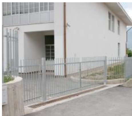
Nova ograda na ulazu u školu

Nova ograda s kapijama za pješake i vozila postavljena je oko područne osnovne škole "Sedrenik". Ograda je postavljena oko objekta, a kapija na ulazu u školu. Montirana je i kapija na ulazu na parking. Osim čelične ograde oko školskog objekta, postavljeni su rukohvati za vanjsko stepenište i rampa za invalide. Postavljanje ograde realizovano je u sklopu vanjskog uređenja ove osnovne škole. Izradu i ugradnju ograde sa oko 28.500 KM finansirala je Općina Stari Grad.