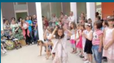
Pomoć za 225 osnovaca

Općina Stari Grad je u budžetu za ovu godinu obezbijedila oko 40.000 KM za kupovinu udžbenika, finansiranje užina i ekskurzija za osnovce čije su porodice slabijeg imovinskog stanja.