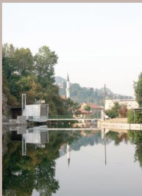
Akumulacija jezera povećana za 30.000 kubika

Spuštanjem brane također je spriječeno širenje smrada iz korita Miljacke u ljetnom periodu, što je ranijih godina bio problem u Sarajevu. Unatoč velikim sušama tokom ljetnog perioda nivo vode u jezeru održan je u punom kapacitetu i mogu ga koristiti i helikopteri za punjenje spremnika za gašenje požara.