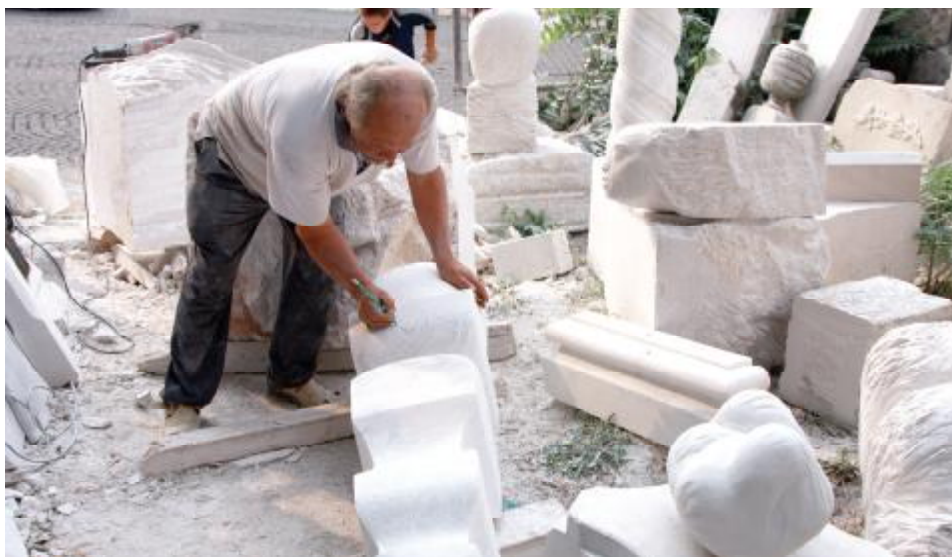
Nova fontana za bistričku džamiju do Kurban bajrama