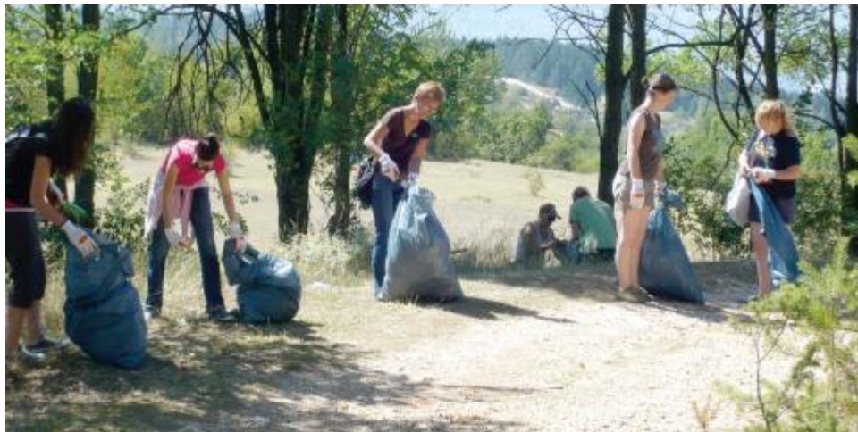
Čišćeno izletišta Barice

"Na lijevoj obali Miljacke, koja je očišćena od smeća i šiblja, postaviti ćemo klupe i kompletan prostor ćemo osvi-