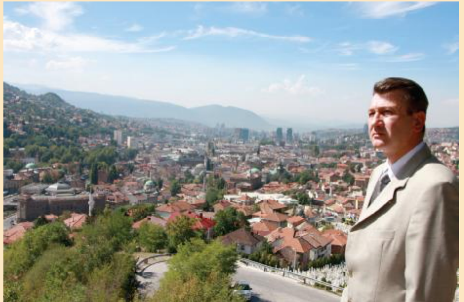
Na projekte iz budžeta utrošeno 18 miliona KM

- Za realizaciju različitih projekata na području Općine Stari Grad u protekle četiri godine izdvojeno je više od 26, 8 miliona KM, od čega je oko 18 miliona obezbijeđeno u općinskom budžetu.