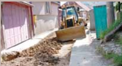
Kišna kanalizacija na Toki

Nova kanalizaciona mreža postavljena je u ulicama Alije Nametka u naselju Sedrenik, Hendek – Carina i Mejdan – Carina u naselju Vratnik i Toka u Mjesnoj zajednici Toka-Džeka.