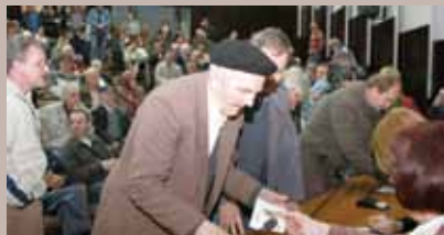
S dodjela hedija

Predstavnici Općine Stari Grad organizovali su posjetu i druženje s pripadnicima boračkih populacija.