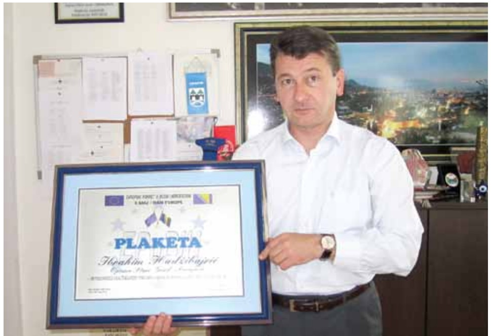
Plaketa za evropskog načelnika