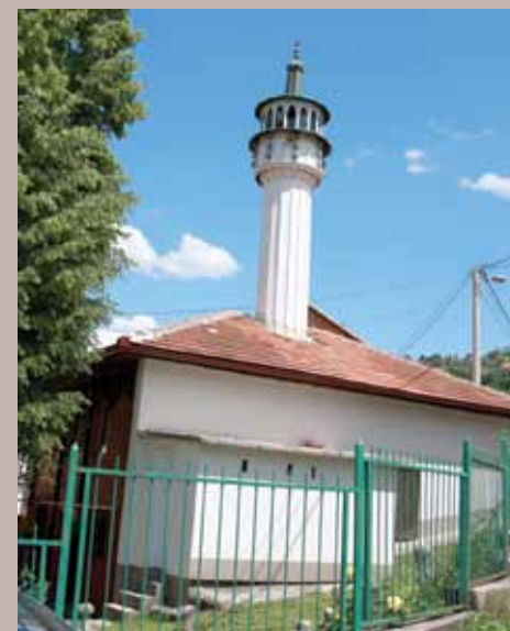
Hadži Sejidina džamija