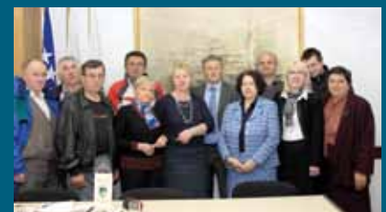
Povratničke porodice i predstavnici Općine

Vlasnici kuća zahvalili su se svim učesnicima u projektu. Istakli su kako su sretni što su nakon 20 godina života u podstanarstvu konačno dobili krov nad glavom. Vjeruju kako će predstavnici vlasti imati sluha da im obezbijede uslove i za održivi povratak.