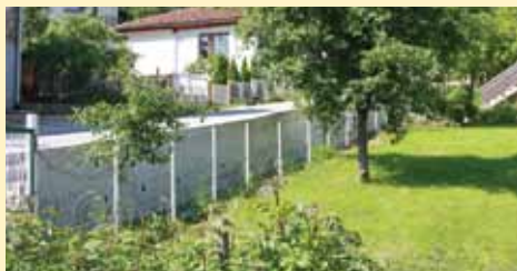
Hambina carina 14b

Novi armirano-betonski zid izgrađen je u Ulici Hambina carina broj 14b u dužini od 51 metra. Izgradnju zida Općina Stari Grad je finansirala sa oko 36.700 KM, a izvođač radova je bila firma "Vindi tip".