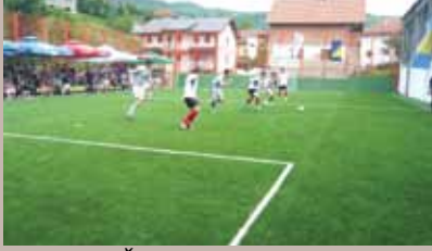
Igralište OŠ "Vrhbosna"

Vještačka trava postavljena je na sportskim terenima osnovnih škola "Vrhbosna" i "Saburina".