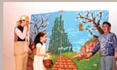
Zabavni program osnovaca

Učenici svih osnovnih škola u Starom Gradu bogatim kulturno-zabavnim programom obilježili su Dan Općine Stari Grad. Tradicionalna manifestacija „Dani škola Danima Općine”, povodom obilježavanja Dana Općine Stari Grad, održana je u Domu kulture „Vratnik”. S pjesmom, recitacijama, igrokazima učenici šest starogradskih osnovnih škola, Osnovne muzičke škole „Mladen Pozajić” i Zavoda za specijalno obrazovanje i odgoj djece Mjedenica 24. aprila, su obilježili Dan Općine.