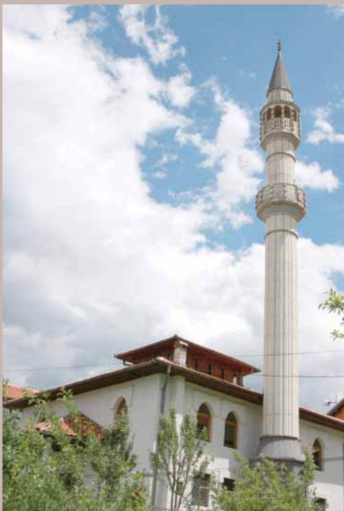
Hitri Sulejmanova džamija