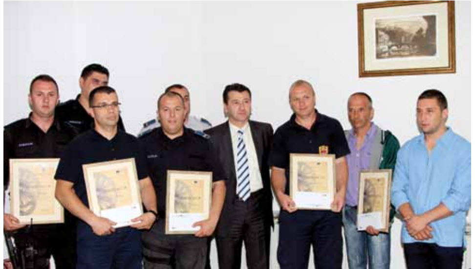
Načelnik sa sudionicima spasavanja dvojice mladića

“Taj dan na djelu je bila i sarajevska solidarnost. Uposlenici dvije institucije i građani koji su se zadesili kod Inat kuće,