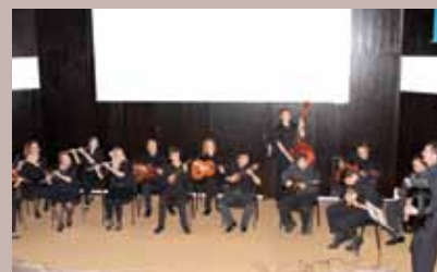
Večer sevdaha uz RKUD "Proleter"