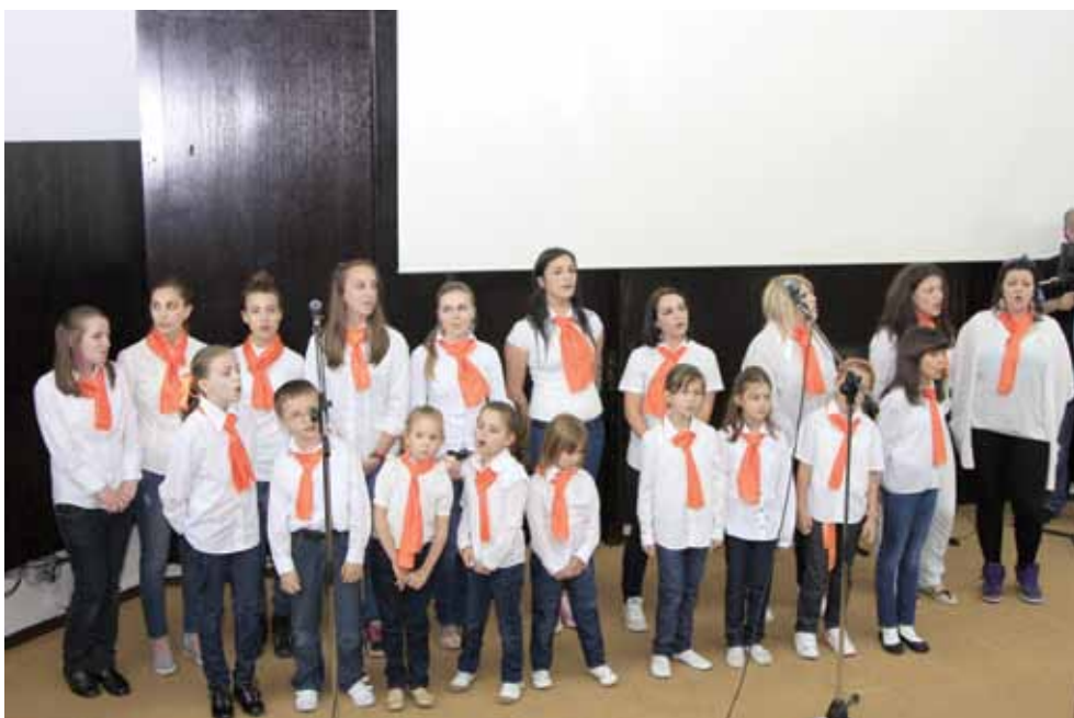
Hor "Princess krofne"

U kulturno-zabavnom programu nastupili su horovi "Gazel" i "Princess krofne". Svečanoj sjednici Općinskog vijeća Stari Grad prisustvovali su vijećnici, predstavnici boračke populacije, svih nivoa vlasti u BiH, diplomatskog kora, te predstavnici pobratimskih općina iz Makedonije, Crne Gore i Turske.