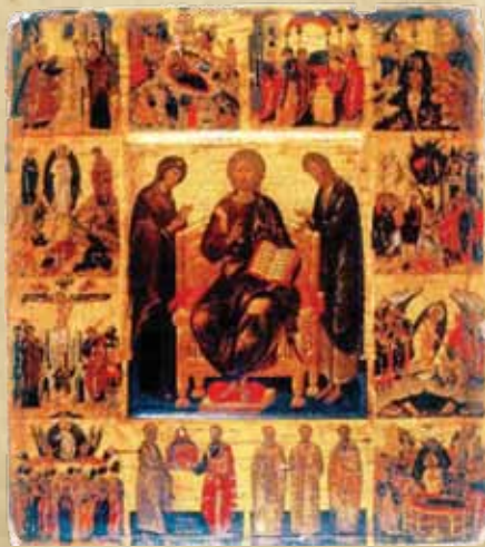
NIKOLA RICOS, Deizis sa praznicima i svetiteljima, oko 1490., tempera na dasci