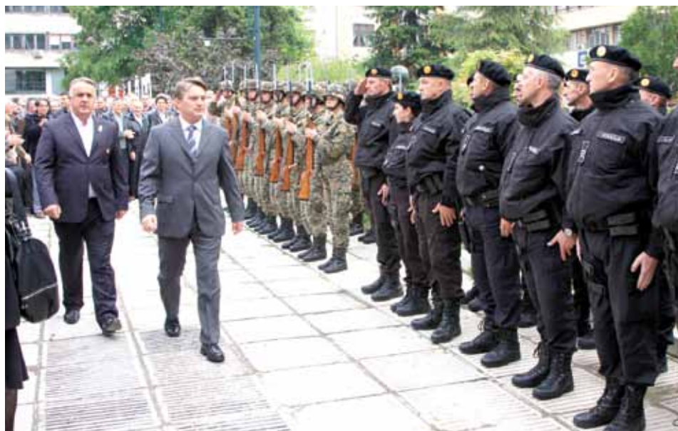
S ceremonije obilježavanja 20. godišnjice postrojavanja SJB Stari Grad

živote su dali u odbrani Sarajeva i BiH. Na obilježavanju je istaknuto kako je sjećanje na ove hrabre ljude trajna obaveza i inspiracija za generacije koje dolaze da čuvaju tekovine borbe za BiH i ne dozvole falsificiranje historijskih činjenica, koje su u vezi sa odbranom Sarajeva i BiH. Obilježavanju 20. godišnjice formi-