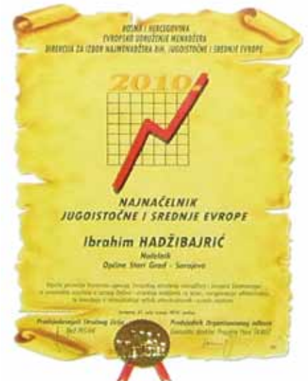
Plaketa za najnačelnika 2010. godine

Ovo visoko i međunarodno verifikovano priznanje načelniku Hadžibajriću dodijelila je Agencija za izbor najmenadžera BiH, Jugoistočne i Srednje Evrope, po odluci žirija sastavljenog od najuglednijih menadžera i naučnih radnika iz regiona. Načelnik Hadžibajrić ovo priznanje je dobio zbog konkretnih rezultata koje je postigao u praksi, kao i realizacije projekata koji su doprinijeli razvoju Općine Stari Grad.