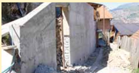
Džeka kod broja 75

Potporni zid u Ulici Džeka kod broja 75 izgrađen je u dužini od 27 i visini od 3,5 do šest metara. Gradnja ovog zida Općinu Stari Grad koštala je oko 60.000 KM, a izvođač radova bila je firma "Neimari".