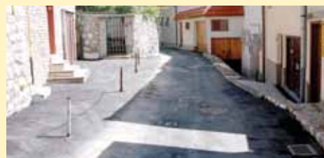
Fadil paše Šerifovića

Rekonstruisana je i asfaltirana Ulica Fadil paše Šerifovića u dužini od 177 metara. Nakon što je uklonjen stari asfalt, u ulici je riješen problem odvodnje, tako što su slivnici i šahovi izdignuti na potrebnu visinu. Asfaltiranje ove ulice koštalo je oko 38.000KM.