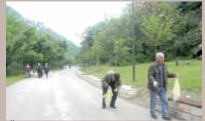
Čišćenje u Aleji ambasadora

Akcije čišćenja obala Miljacke i Mošćanice od Aleje ambasadora do Kozje ćuprije, igrališta Komatin i prostora oko Mjesne zajednice Logavina organizovane su krajem maja, i početkom juna. Akcije su organizovane s ciljem podizanja svijesti građana o zaštiti okoliša.