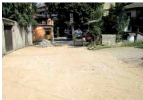
Mustaj pašin mejdan

Izvođač radova je KJKP „Rad“, a projekat sa oko 10.000 KM finansira Općina Stari Grad.