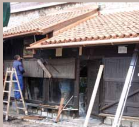
Novi krovovi na trgovkama

oko podne, izbio na Bašćaršiji uništio je 11 trgovki, od kojih je njih sedam u vlasništvu Općine.