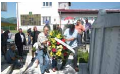
Spomen obilježje Turbe