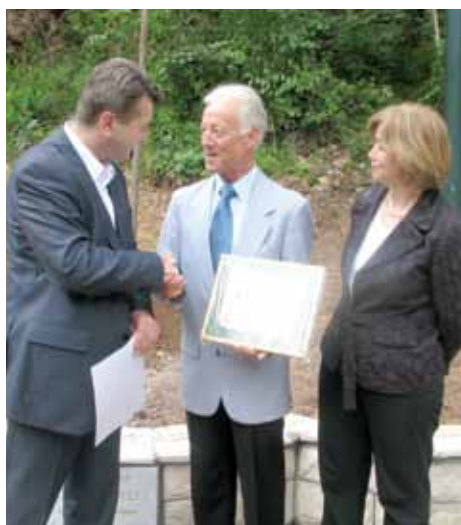
Načelnik i ambasador Francuske