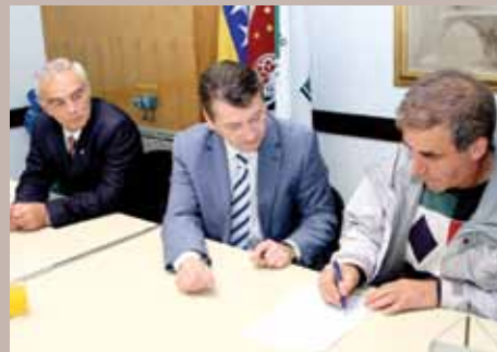
Za plastenike 54.000 KM

Kamber je naglasio kako je u ovogodišnjem budžetu za nabavku 15 plastenika obezbijedeno 54.000 KM. "Općina je svojim sugrađanima do sada dodijelila oko 75 plastenika, a prednost pri odabiru korisnika i ove kao i prethodnih godina imali su nezaposleni demobilisani borci i penzioneri. Građani koji su potpisali ugovore o dodjeli plastenika moraju naredne tri godine Narodnoj kuhinji Stari Grad godišnje obezbijediti po 100 kg proizvoda koje su uzgajali", rekao je Kamber.