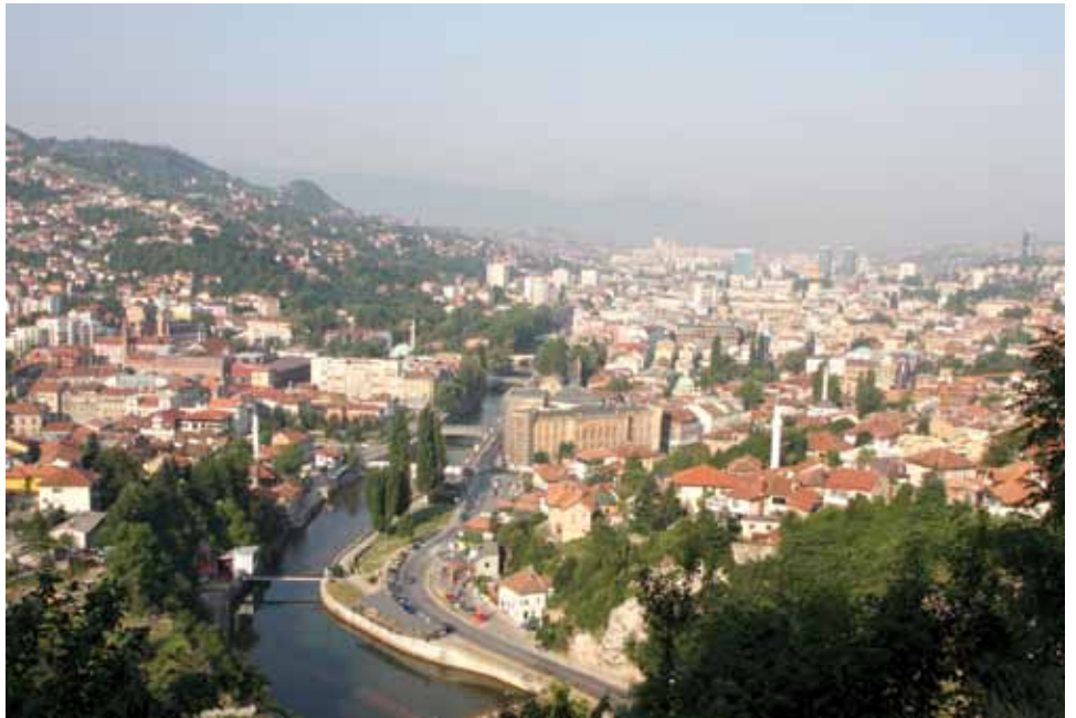
Općina Stari Grad - Evropski otvoreni grad

Čelnici ILH ocijenili su da je Hadžibajrić u fokus svog rada i djelovanja stavio interes građana, da je lider koji svoj ugled i autoritet ne gradi na apriornoj poziciji na kojoj se nalazi, već na stručnom i profesionalnom znanju, sposobnostima i postignutim rezultatima. Hadžibajrića su prepoznali kao lidera kojem građani vjeruju i koga slijede zbog njegove odlučnosti, principijelnosti, nepokolebljivosti i istrajnosti u realizaciji svojih ciljeva.