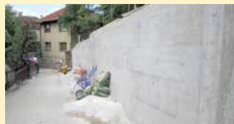
Alije Nametka 45

Novi potporni zid izgrađen je u Ulici Alije Nametka broj 42. Na ovoj lokaciji srušen je stari zid, iskopani temelji, ugrađena željezna arma-