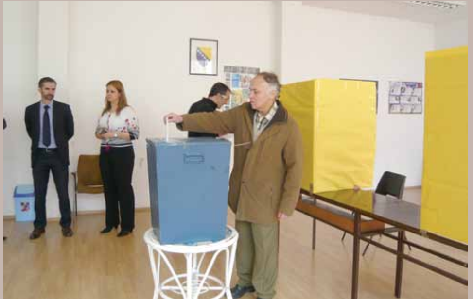
Birački odbor Logavina