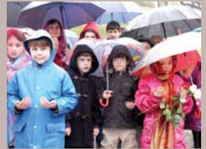
Učenici OŠ "Saburina i"Hamdija Kreševljaković"

U Amfiteatru Memorijalnog centra Kovači, u organizaciji Fonda Memorijala Kantona Sarajeva 20. aprila, proučena je hatma-dova šehidima BiH. Delegacija Općine i OV uprava Fonda Memorijala, te brojni članovi šehidskih porodica su položili cvijeće i proučili Fatihu na Šehidskom mezarju Kovači.