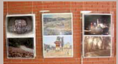
Slike Sarajeva turskog fotografa

Prva samostalna izložba fotografija turskog fotografa Ercana Erdeniza bila je postavljena 21. maja, 2012. godine u holu Velike sale Općine Stari Grad. U ovoj izložbi pod nazivom “Pogled na Sarajevo” predstavljeno je 50 fotografija Sarajeva koje je autor napravio tokom svog šestomjesečnog boravka u glavnom gradu BiH. Izložbu u ime Ibrahima Hadžibajrića, načelnika Općine Stari Grad, koja je ujedno bila i pokrovitelj izložbe, otvorio je Zlatan Mesić, savjetnik načelnika, istakavši kako je ovaj događaj jedan od dokaza trajne saradnje između Sarajeva, odnosno BiH i Turske.