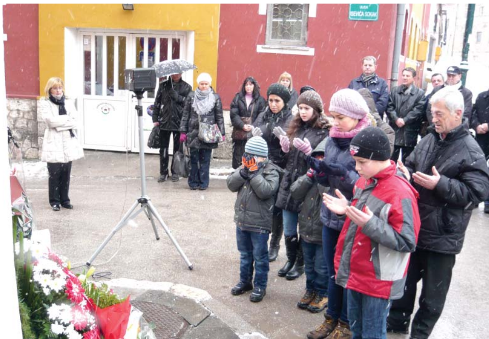
Sjećanje na osam ubijenih sugrađana

Delegacija Općine Stari Grad 15. januara, 2012. godine položila je cvijeće i odala počast ubijenim građanima u Isevića sokaku kod broja 23.