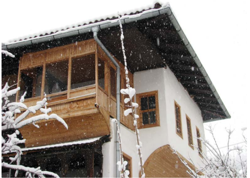
Za Saburinu kuću 75.000 KM

Saburina kuća je prvobitno bila izgrađena kao stambeni kompleks koji se sastojao od više objekata: haremluka (ženska kuća) i selamluka (muška kuća), uz koji se nalazila velika štala. Svaki od ovih objekata imali su po dvije avlije. Danas je od čitavog kompleksa Saburine kuće ostao samo jedan objekat, tzv. muški dio s dvorištem, koji je sagrađen oko 1750.-e godine. Ženski dio kuće je potpuno propao nakon 1918. godine. Neki dijelovi enterijera iz ovog objekta preneseni su u etnografski dio Zemaljskog muzeja u Sarajevu.