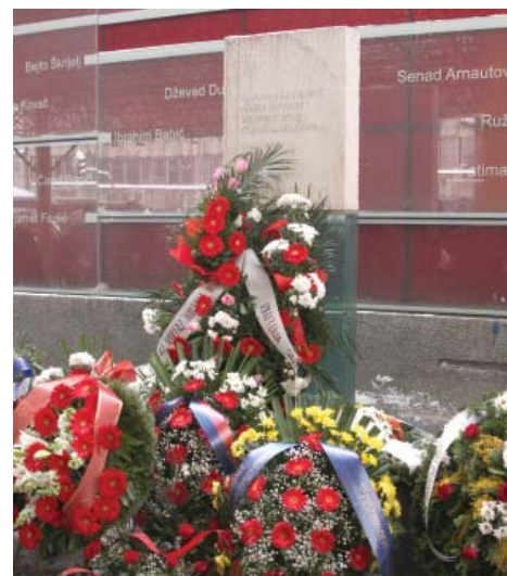
Godišnjica masakra na Markalama

Brojne delegacije, rodbina, prijatelji i komšije okupili su se 5. februara na mjestu masakra kako bi odali počast ubijenim. Učenjem Fatihe i polaganjem cvijeća na spomen-obilježje sjetili su se svih nedužnih građana koji su poginuli tog kobnog dana.