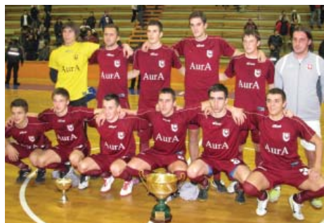
Pobjednička ekipa FK "Sarajevo"

Ovogodišnji Međunarodni turnir u malom nogometu „Asim Ferhatović Hase“ počeo je 24. decembra, 2011. godine utakmicom između selekcije Prijepolja i Fudbalskog kluba „Sarajevo“. Na turniru je učestvovalo osam ekipa iz