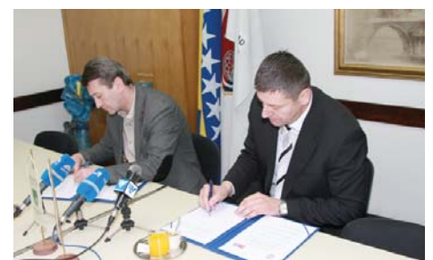
S potpisivanja Sporazuma

„Prošle godine Općina Stari Grad i Istočni Stari Grad zajedno su finansirali uređenje dijela puta Zlatište - Širokača. Zajedničkim snagama okončan je i projekat elektrifikacije u selu Mešinovići, kao i asfaltiranje nekoliko puteva“, kazao je Hadžibajrić.