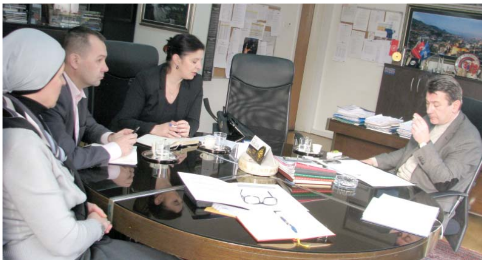
Edukacija građana o radu lokalne zajednice

Općina Stari Grad uključila se u projekat „Akademija za građane“ kojeg već drugu godinu u saradnji s lokalnim zajednicama realizira Misija OSCE-a u BiH.