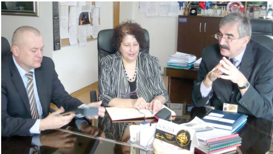
Delegacija Maribora i Ambasade Slovenije u posjeti Općini

Grad Maribor pružit će podršku Općini Stari Grad u pripremi projekata za apliciranje na fondove Evropske unije.