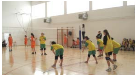
Pobjednici idu na kantonalno takmičenje

Pobjednici općinskog takmičenja učestvovat će na kantonalnom odbojkaškom takmičenju.