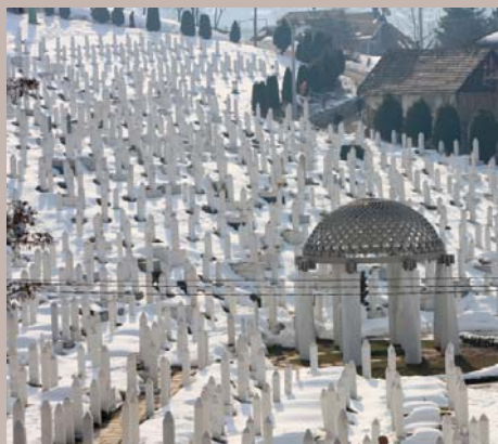
Šehidsko mezarje Kovači

Specifičnost MZ Kovači ogleda se i u starim mezarjima. Prema saznanjima i