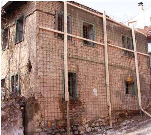
Zaštitna mreža na objektu u Ul. Nadmejdjan 7

„Zahvaljujući brzom intervenciji načelnika Općine Stari Grad, koji je u-