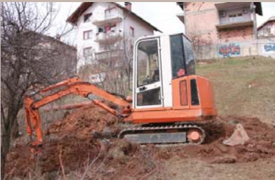
Nova mreža u dužini od 110 metara

Počelo je postavljanje nove kanalizacione mreže u Ulici Alije Nametka.