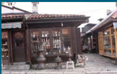
Od zakupnina oko sedam miliona

Služba za privredu Općine Stari Grad tokom 2011. godine od izdavanja poslovnih prostora naplatila je 7.100.394,87 KM.