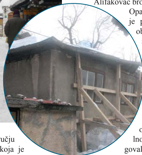
Objekat u Ul. Prijeka česma 22

lnice na ovom području u Ulici Halilbašića, koja je proglašena spomenikom kulture. Na objekat je posta-