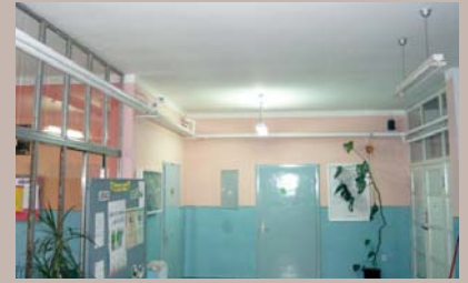
Novo grijanje u školi

Rekonstruisan je sistem grijanja u Osnovnoj školi „Šejh Muhamed ef. Hadžijamaković“ u Mjesnoj zajednici Hrid – Jarčedoli.