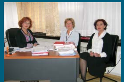
Služba za urbanizam

Služba za urbanizam Općine Stari Grad u protekloj godini zaprimila je 1.492, a riješila 1.955 predmeta.