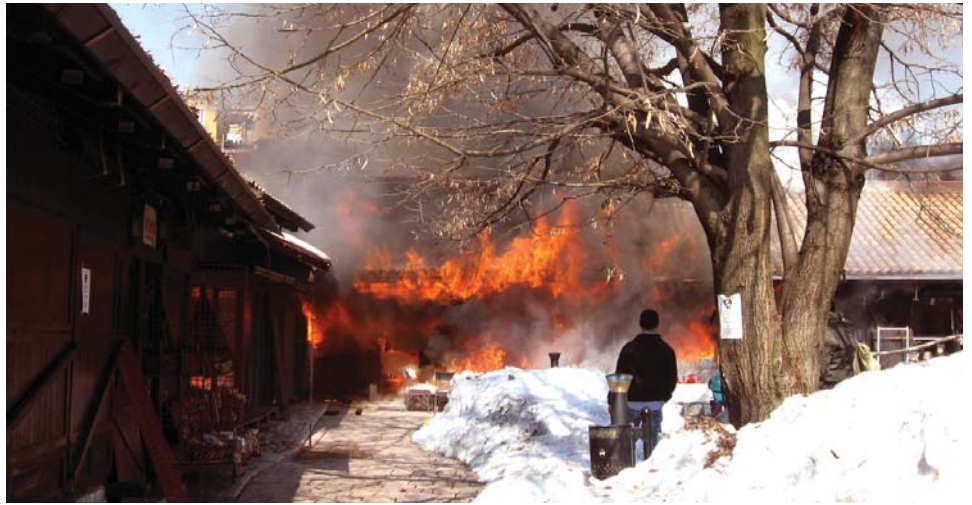
Trgovke u plamenu

Dodao je kako će Općina sanirati unutrašnjost svojih trgovki, dok će troškove sanacije privatnih radnji morati snositi sami vlasnici.