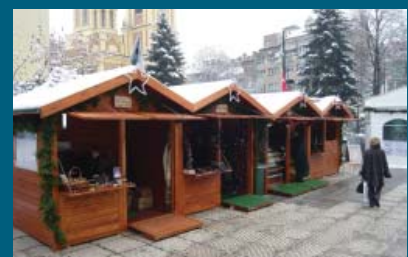
Pola miliona od javnih površina

Služba za komunalne poslove i investicije Općine Stari Grad je tokom 2011. godine naplatila 509.824,70 KM za korištenje javnih površina.