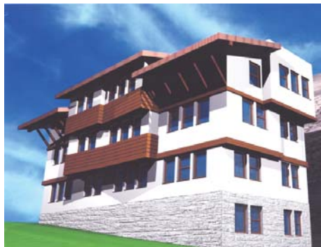
Nova zgrada u naselju Brusulje

Devet interno raseljenih porodica s područja Starog Grada sredinom oktobra prošle godine su dobili ključeve od svojih stanova u novoizgrađenoj zgradi u Brusuljama. Izgradnja ovog objekta koštala je oko 600.000 KM.