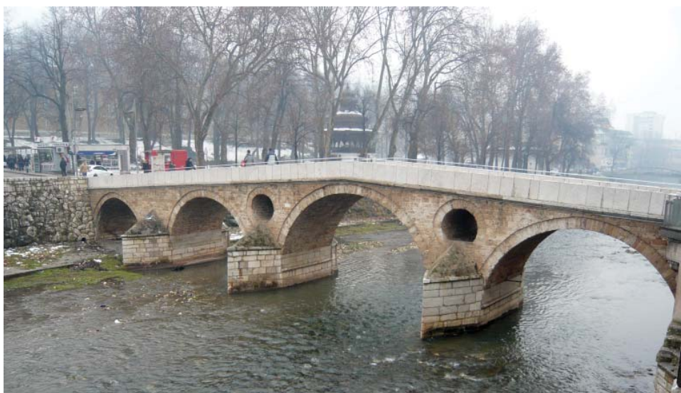
Zamjena kamenih ploča na Latinskoj ćupriji

Za sanaciju Saburine kuće, Vratničkog bedema i Latinske ćuprije u budžetu Općine Stari Grad Sarajevo obezbijedeno 130.000 KM