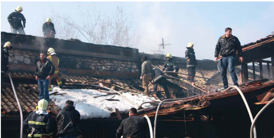
U akciji 64 vatrogasca i 13 vozila

Požar u centru Bačšaršije su gasila 64 vatrogasca i 13 vatrogasnih vozila. Osim vatrogasaca na lice mjesta izašao je načelnik Hadžibajrić, te predstavnici "Elektrodistribucije", "Sarajevogasa" i "Vodovoda i kanalizacije".