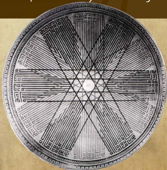
Kaligrafska kompozicija u formi rozete (kružnice), koja se u kaligrafiji naziva Sulejmanov pečat nalazi se u Hadži Sinanovoj (Silahdar Mustafe - paše) tekiji, koja upotpunjava nacionalni spomenik.