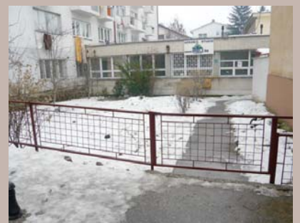
Postavljena nova ograda

Uređena je ograda ispred Doma kulture Logavina u istoimenoj starogradskoj mjesnoj zajednici.