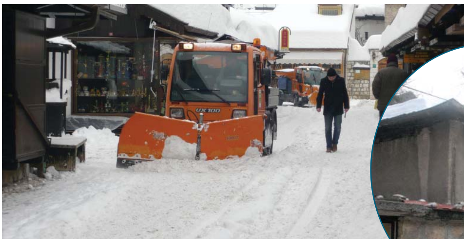
Mašinsko čišćenje Bašćaršije

Opasnost za prolaznike je predstavljao i stari objekat u Ulici Pastrma. Zbog dotrajalosti na ulicu se počeo obrušavati cokleni zid. Ovaj objekat nalazi se u privatnom vlasništvu. Iako je po zakonu vlasnik dužan da otkloni sve nepravilnosti Općina je reagovala i u ovom slučaju, kako bi zaštitila prolaznike.