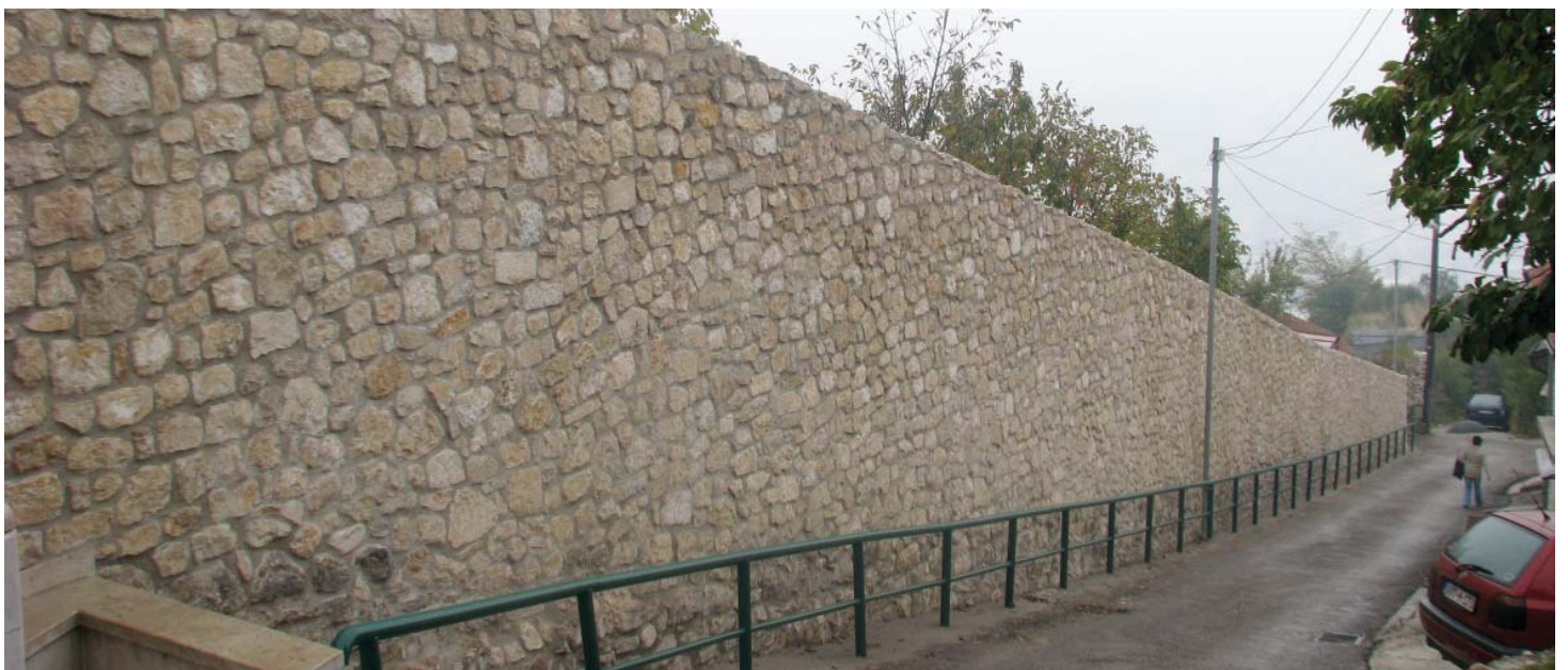
Nastavak rekonstrukcije Vratničkog bedema

Vratnički grad sa svojim bedemima, kapijama i kapi-kulama daje karakterističnu siluetu i svojevrsan pečat historijskoj jezgri Sarajeva.