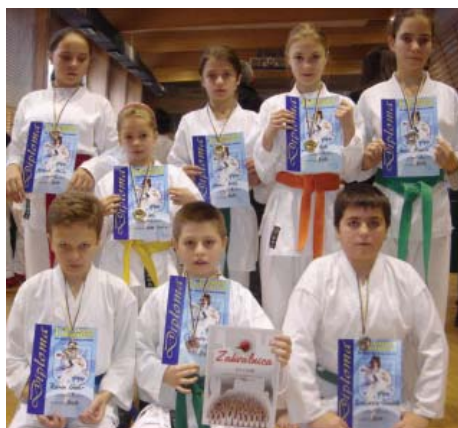
Izuzetan uspjeh članova KK "Satori"