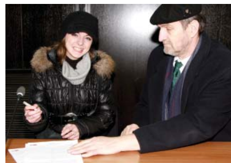
S potpisivanja ugovora

Konkurs za stipendiranje učenika i studenata za školsku 2011./2012. godinu raspisan je u oktobru prošle godine. Pravo učešća na konkursu imala su djeca demobilisanih boraca, ratnih vojnih invalida i šehidskih odnosno porodica palih boraca, koji su na redovnom školovanju u srednjim školama i fakultetima u Kantona Sarajevo.