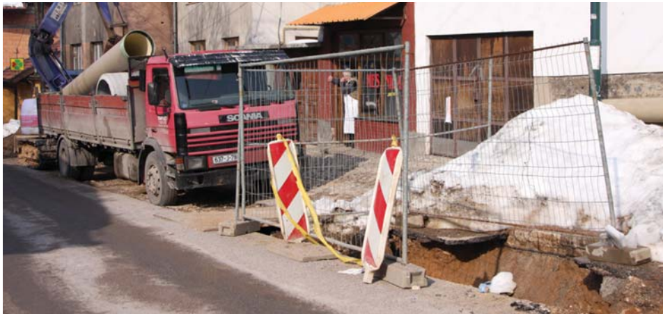
Kvalitetnija kanalizacija za Vratničane

Rekonstrukcija kanalizacione mreže u Ulici Mejdan-Carina u starogradskoj Mjesnoj zajednici Vratnik je u toku.