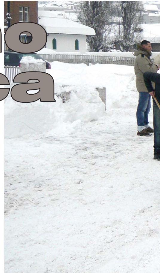
Ulice i stepeništa čistilo 250 dobrovoljaca