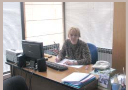
Službenik za informisanje

Službeniku za informisanje u protekloj godini obratio se 491 građanin sa zahtjevom za pristup informacijama u Općini Stari Grad. U okviru rješenja o odobrenju pristupa informacijama urađene su 2.263 kopije, za šta je naplaćeno 226,50 KM. Pored toga, Služba za Opću upravu izdala je 515 uvjerenja o podnesenoj legalizaciji.