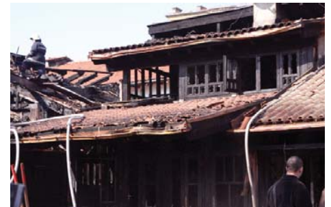
Slijedi sanacija krovova