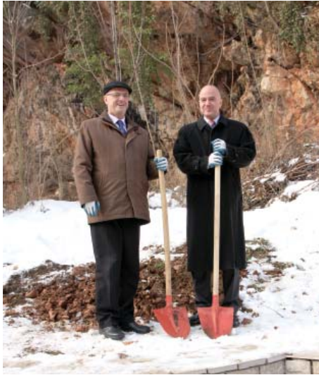
Predsjedavajući i ambasador zasadili lipu