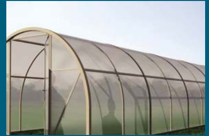
Za plastenike 50.000 KM

Općina Stari Grad je u budžetu za 2012. godinu obezbijedila 100.000 KM za finansiranje projekata iz oblasti poljoprivredne proizvodnje.