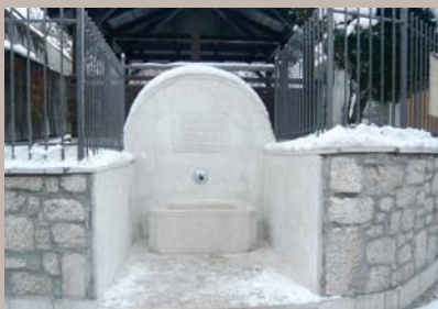
Hair-česma na Hridu

Dvije hair - česme izgrađene su u Općini Stari Grad. Jedna je podignuta u Mjesnoj zajednici Mošćanica, a druga u Mjesnoj zajednici Hrid - Jarčedoli.