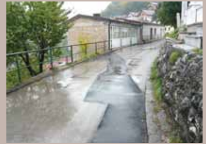
Ulica Podcarina nakon sanacije

Okončan je projekat odvodnje površinskih voda u Ulici Podcarina kod broja 40 u MZ Babića bašta.