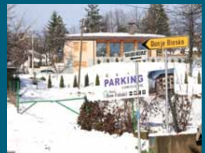
Novi putokazi na Moščanici

Postavljena su tri saobraćajna znaka ili putokaza na području mjesne zajednice Moščanica. Jedan je postavljen kod Doma Faletići, a dva na raskršću prema Gornjem i Donjem Biosku, odnosno iznad groblja Faletići. Postavljanje znakova koštalo je oko 470 KM.