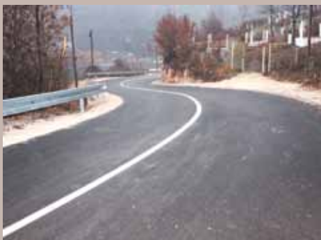
Otvoren put za građane Obhodže

Uoči Dana državnosti BiH, osim saobraćajnice, otkrivena je i nova tabla s nazivom mosta u naselju Obhodža. Most će nositi naziv Most Bosansko-turskog prijateljstva, što je prihvaćeno i na sjednici Skupštine Kantona Sarajevo, održanoj u oktobru.