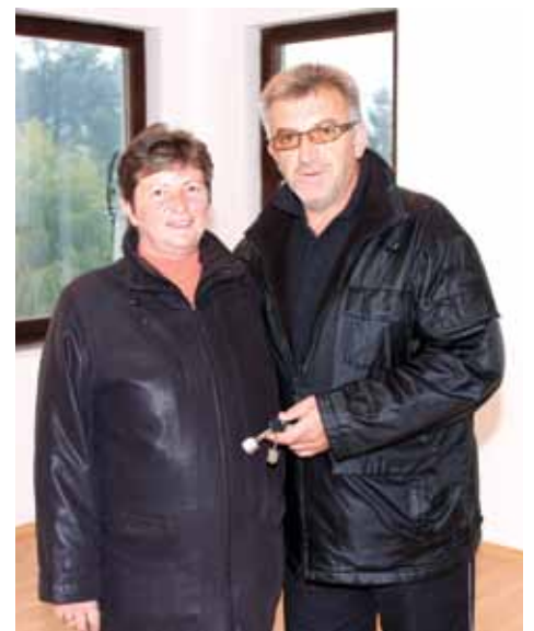
Porodice u svojim stanovima