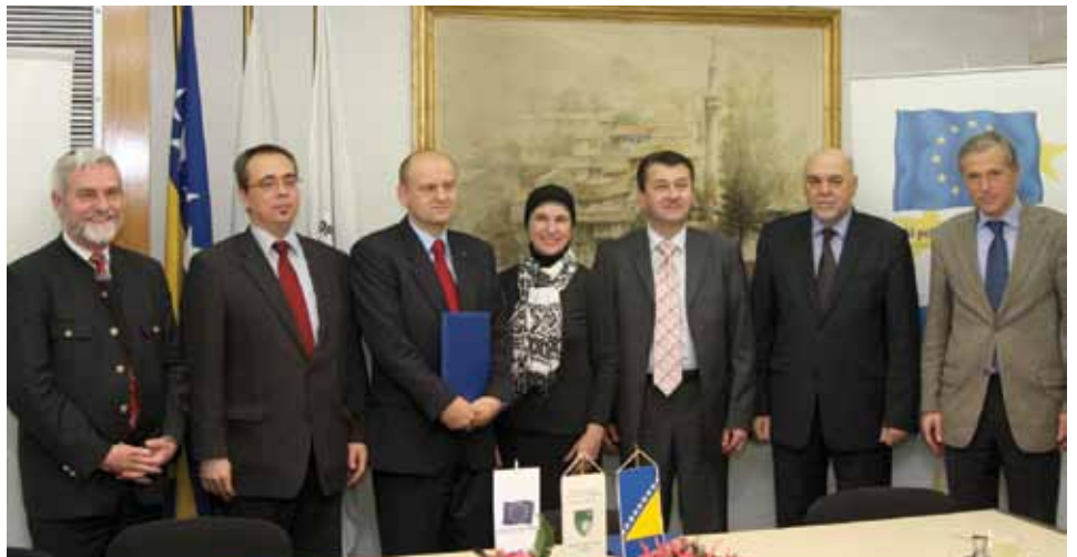
Ambasadori u Općini Stari Grad

Potpisnici će podržavati prava na slobode i jačanje demokracije, izgradnju kapaciteta i jačanje uloge lokalnih zajednica, izgradnju građanskog identiteta i jačanje civilnog društva, dogradnju i jačanje parlamentarne kulture, jačanje ekonomskih kapaciteta i tržišta, uspostavu naprednog i modernog društva, kao i poštovanje ljudskih prava shodno evropskim standardima i normativima uz punu reintegraciju BiH u politički i ekonomski sistem EU. Općina Stari Grad je prva općina s područja Grada Sarajeva s kojom je EP sklopio partnerski sporazum.