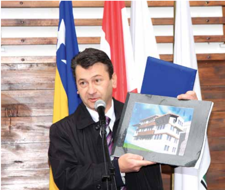
Dogodine još jedna zgrada za interno raseljene