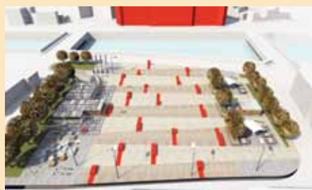
Maketa trga u Šahinagića ulici

da ćemo uzeti kombije. Bio sam spreman da snosim sve posljedice. Pričati o koncesijama je najveća glupost. U materijalu za vijećnike jasno smo