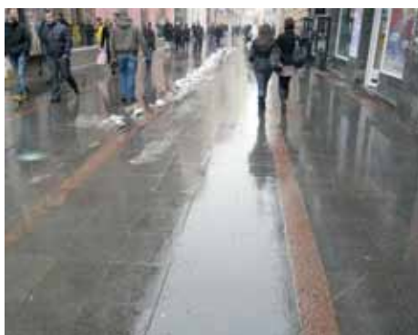
Nove ploče u Ferhadiji

Izvođač radova bila je firma "Balkan kamen", a investitor Općina Stari Grad. Vrijednost ove investicije je oko 2.150 KM.