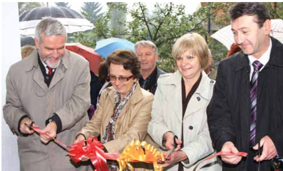
Presijecanjem vrpce otvorena zgrada na Brusuljama