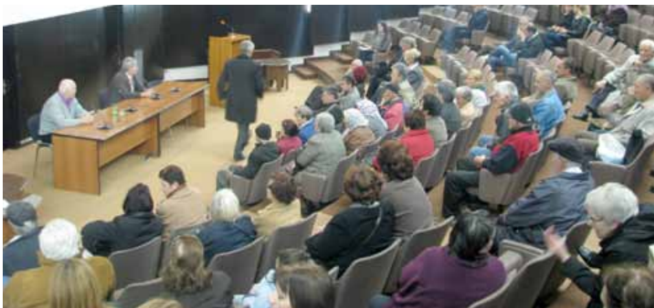
S podjele hedija

Predstavnici Općine Stari Grad 04. novembra 2011. godine su, u sklopu tradicionalnog druženja s pripadnicima boračkih populacija, porodicama šehida i poginulih boraca, ratnim vojnim invalidima i demobilisanim borcima uručili novčane hedije.