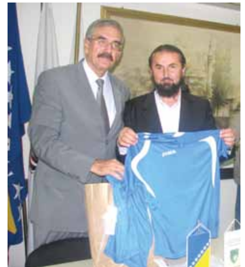
Sa uručjenja donacije