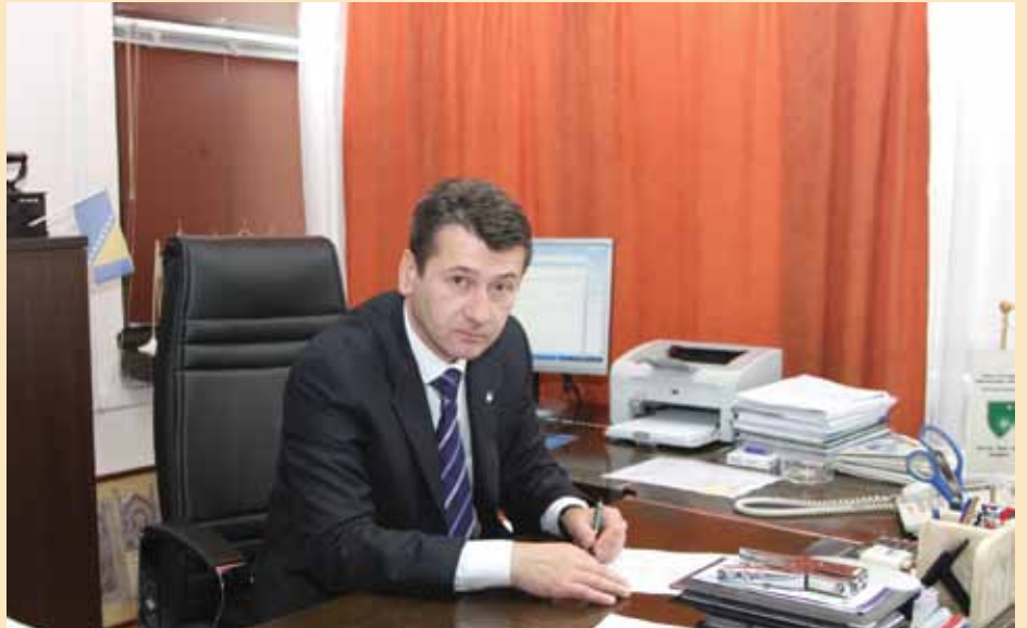
O garažama u narednom periodu

Da je prošla ova odluka u budžet Općine Stari Grad direktno bi bilo uplaćeno 2.117.123 KM, a sama gradnja garaže minimum bi koštala oko četiri miliona KM. Riječ je o investiciji od oko 6,5 miliona KM. Ovdje više nisu u pitanju samo kombiji. U pitanju su tri stvari koje je Općina izgubila: podzemne garaže, za koje se svi zaklin-