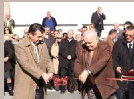
Sa otvaranja Kvadranta XII