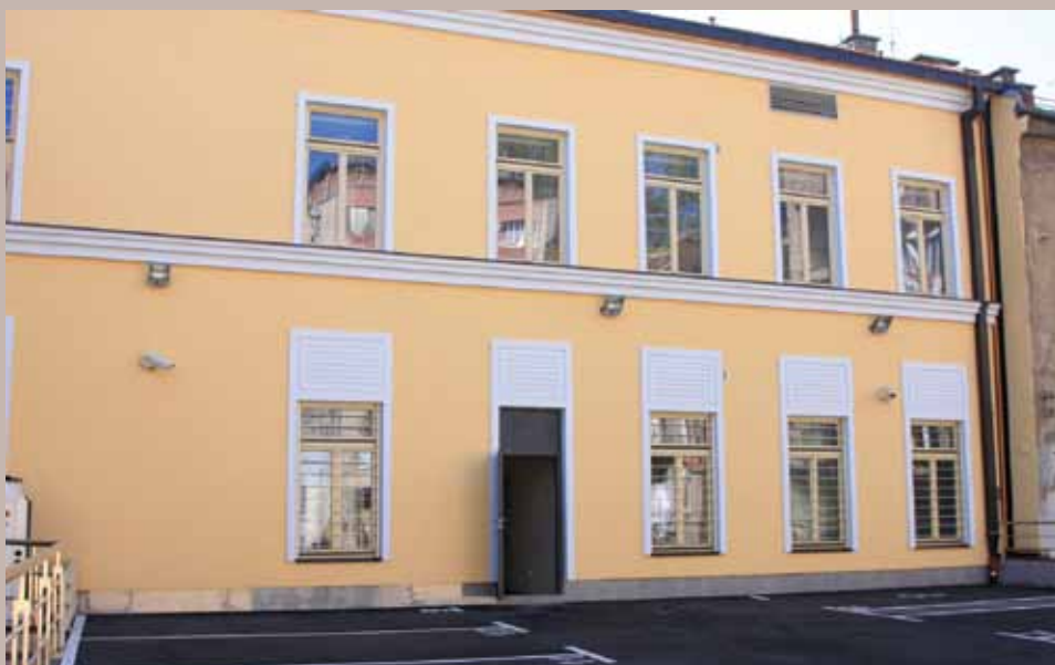
Poslovni objekat Kvadrant XII

Podsjetio je kako će poslovni prostori u Kvadrantu XII korisnicima biti dodjeljivani putem javnog konkursa.