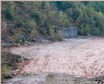
Teren za novo igralište

U oktobru ove godine urađeni su grubi građevinski radovi na pročišćavanju pomoćnog igrališta u starogradskom naselju Brusulje. Za osposobljavanje igrališta bilo je neophodno očistiti prilazni put i teren, kao i nasipanje terena na pojedinim lokacijama.