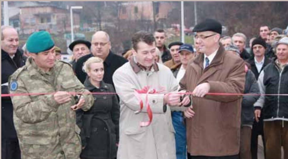
Sa otvaranja novog puta

Izgradnja nove saobraćajnice u naselju Obhodža počela je krajem septembra. Izgrađena je potpuno nova