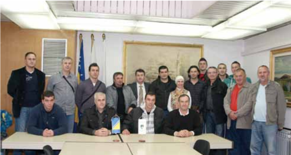
Bh. reprezentativci u Općini Stari Grad

Reprezentacija BiH u sjedećoj odbojci sedam puta zaredom ponijela je titulu evropskog prvaka.