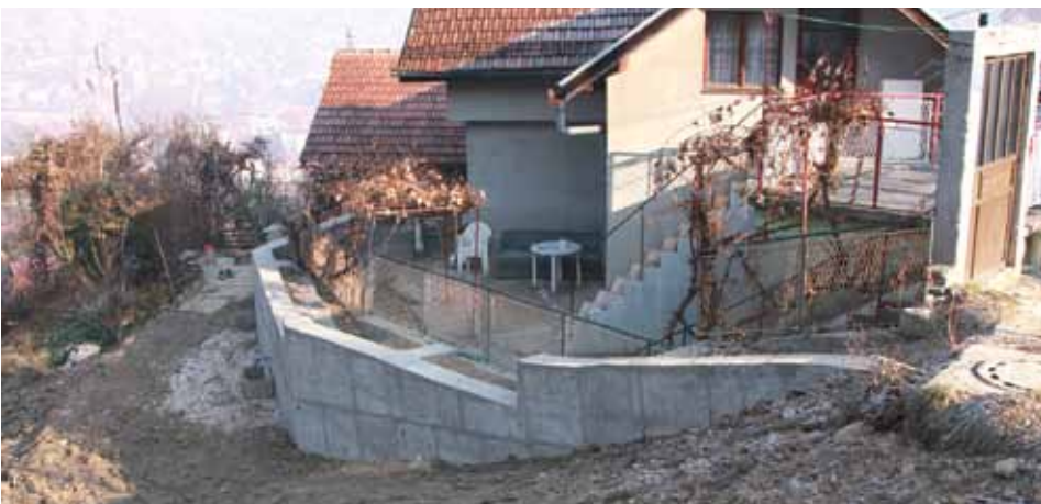
Sanirano klizište u Pastrmi

Vrijednost projekta je oko 190.000 KM i zajedno su ga, u omjeru pola – pola, finansirali Općina Stari Grad i Zavod za izgradnju Kantona Sarajevo, koji je bio nadzor nad realizacijom projekta. Izvođač radova bila je kompanija „Mibrall“ iz Sarajeva.