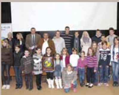
Članovi PK Stari Grad

„Općina Stari Grad će finansijski, u skladu sa svojim mogućnostima, pomagati aktivnosti ovog kluba. Zahvaljujem se i čestitam prije svega djeci, njihovim roditeljima, ali i rukovodstvu kluba na izuzetnim rezultatima koji su ostvarili u proteklom periodu“, kazao je načelnik Hadžibajrić, podsjetivši kako je ovaj klub na dosljedan način prezentirao Stari Grad, svoju matičnu općinu.