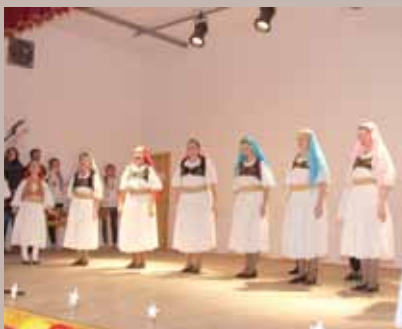
S bajramske manifestacije

Učenici i nastavnici Osnovne škole „Šaburina“, pod pokroviteljstvom Općine Stari Grad 9. novembra, 2011. godine su organizovali prigodnu bajramsku manifestaciju u Domu kulture Vratnik. Bajramska manifestacija, koja je postala tradicionalna, ove godine organizovana je pod motom „Dar daruje dijete djetetu“. Osim učenika Osnovne škole „Šaburina“ svoj doprinos manifestaciji dala su i djeca iz Zavoda za specijalno obrazovanje i odgoj djece „Mjedenica“, i članovi Udruženja za brigu o osobama sa umanjenim sposobnostima „Radost života“. Djeca su kroz igru, pjesmu, ples i igrokaz svim posjetiocima dočarali radost Kurban bajrama.