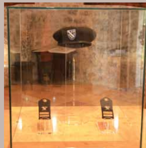
Ekspонат u Muzeju Alije Izetbegovića

U prostornom konceptu javlja se osnovni modul karakterističan za većinu objekata stambene arhitekture XVII. i XVIII. stoljeća, a čini ga veća prostorija