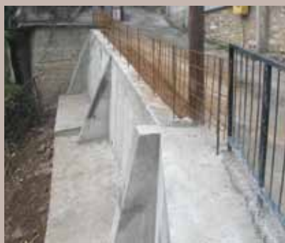
Potporni zid u Ulici Višegradska kapija

Saniran je potporni zid u Ulici Višegradska kapija do broja 7 u Mjesnoj zajednici Vratnik. Zbog dotrajalosti dijela starog potpornog zida, povremeno je dolazilo do odrona i obrušavanja terena. Zbog toga je Općina odlučila sanirati ovaj potporni zid. Radovi su podrazumijevali mašinsko-ručni iskop zemlje za temelj, ugradnja plastičnih drenažnih cijevi i tamponskog sloja uz potporni zid, betoniranje donje konzole, temelja i tijela zida, ugradnju mrežaste i rebraste armature.