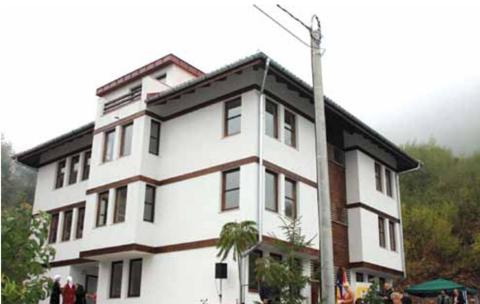
Novoizgrađeni objekat na Brusuljama

„Općina Stari Grad je osigurala zemlju, oslobodila sve subjekte od plaćanja