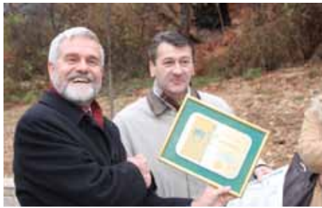
Ambasador Donatus Kock i načelnik Hadžibajrić

„Ova lipa je simbol prijateljstva, veza i dubokih korijena. Nadam se da će ovo drvo narasti, kao što raste i partnerstvo između Švicarske i BiH i da će donijeti plodove od kojih ćemo svi imati koristi, kao što imamo i iz naše saradnje“, rekao