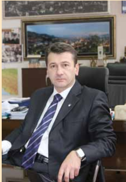
Investicije od 14,1 milion KM

Imao sam informacije da su određeni vijećnici zauzeli politički stav u vezi sa ovim odlukama. Odnosno da neće podržati ni ovu, a ni tačku za podzemne garaže. Nisam želio da dođemo u situaciju da se trošimo na ovoj tački. Ako neko razmišlja menadžerski onda je bolje odjednom uzeti novac za 600 metara kvadratnih. To je negdje oko četiri do 4,5 miliona KM i to pod uslovom da hipermarket u Kvadrantu XII