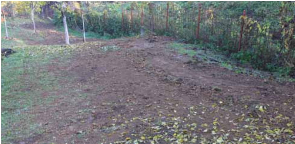
Kanalizaciona mreža u Ulici Komatin

Postavljanjem nove kanalizacione mreže u Ulici Komatin riješen je problem porodica čije se kuće nalaze ispod nivoa ulice. U pitanju je bilo desetak kuća koje su napravljena poslije rata, a koje do sada nisu imale riješen problem kanalizacione mreže.