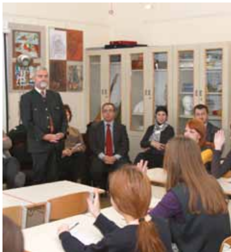
Evropski čas u gimnaziji

U ovoj obrazovnoj ustanovi održan je čas za učenike o evropskim integracijama i razmijenjena su znanja o procesu približavanja Evropskoj uniji.