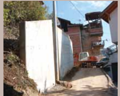
Izgrađeni zid u Ulici Alije Nametka

Izgrađen je novi potporni zid u Ulici Alije Nametka 42b. Radi se o novom armirano-betonskom potpornom zidu dužine 26 metra i visine od četiri metra.