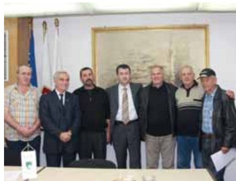
Potpisnici sa načelnikom i pomoćnikom načelnika za privredu

„Općina Stari Grad dodjelom ovih plastenika ne podstiče samo poljoprivrednu proizvodnju, nego i pruža pomoć po-