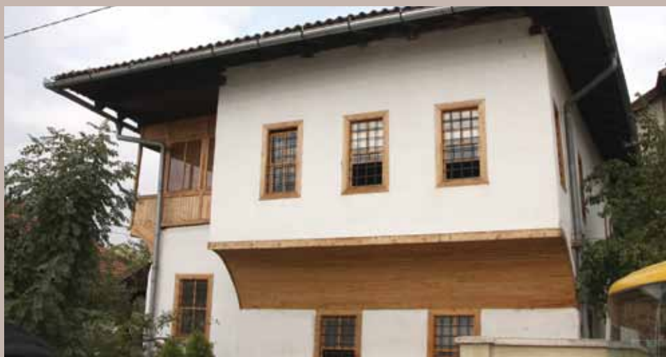
Kuća porodice Sabur

građevinama, odnosno po ambijentalnoj arhitekturi koja svjedoči o prošlim vremenima, ljudima i običajima. Osim objekata iz osmanskog perioda Mjesnu zajednicu Sumbuluša ukrašavaju i objekti iz novijeg doba.