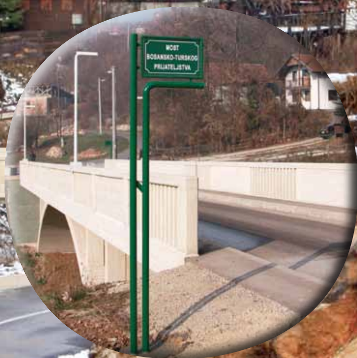
Tabla s nazivom mosta