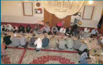
Iftar za džematlije

Općina Stari Grad i ove godine tokom Ramazana, u saradnji sa svojim partnerima, u holu Velike sale organizovala je iftare za postače.