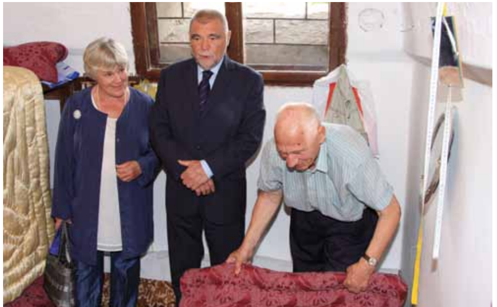
Rehn i Mesić s jedinim jorgandžijom u Sarajevu