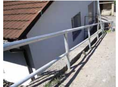
Rukohvat kod Mjesne zajednice Toka-Džeka

Samo desetak dana nakon što su u Ulici Mala Berkuša postavljeni novi pocinčani rukohvati, nepoznati počinitelj ih je otuđio. Predstavnici Službe za komunalne poslove i investicije izašli su na teren te obavili uvidaj, te konstatovali kako je otuđeno oko osam metara novih rukohvata.