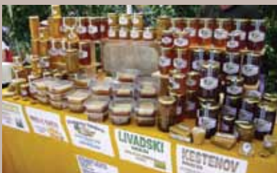
Bogata ponuda meda

Deveti Internacionalni sajam pčelarstva i pčelarske opreme – Dani pčelarstva Sarajevo 2011. godine, održan je od 7. do 11. septembra, 2011. godine na Trgu oslobođenja – Alija Izetbegović. Domaćin ovogodišnjeg, kao i prethodnih sajmova, bila je Općina Stari Grad Sarajevo. Više od 70 izlagača iz cijele BiH i zemalja regiona predstavili su se na ovogodišnjem „BEE FESTU“.