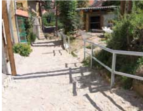
Rukohvat u Ulici Mala Berkuša

Završeno je postavljanje rukohvata u ulicama: Mala Berkuša od br.12 do br.37, Džeka kod Mjesne zajednice Toka-Džeka, Mahmutovac 60-62, Boguševac 15-27 i Paje 1-3. Postavljeni su pocinčani rukohvati koji su kvalitetniji od običnih crnih željeznih cijevi.