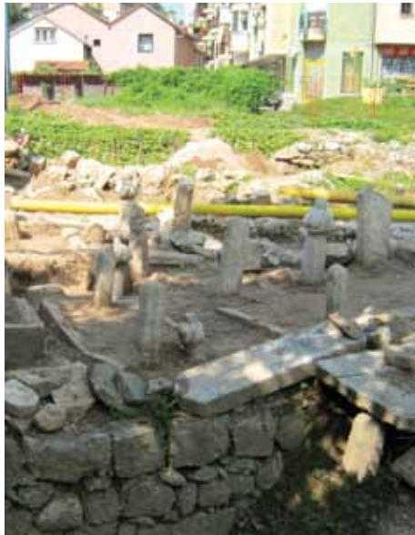
Uskoro konzervacija parka

„Levha će biti klesana u kamenu, duga 40 metara i široka 60 cm, te će stajati na sva četiri zida u unutrašnjosti džamije. To će je činiti jednom od najdužih levhi ove vrste u svijetu“, istakao je Garibija.