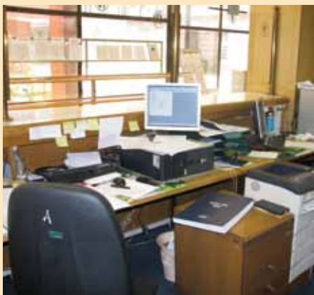
Olakšano izdavanje matičnih izvoda

U Odsjeku rade četiri osobe. Poslovi koji su u njegovom domenu su pružanje informatičke podrške osnovnim djelatnostima Općine, jer kao moderna institucija lokalne samouprave mora biti sposobna da odgovori zahtjevima vremena koje pred nju postavljaju njeni građani. U tom cilju smo servis i Općine i građana. Sve što Općina radi je u korist njenih građana tako da smo dio tog mehanizma i na taj način dajemo svoj doprinos.