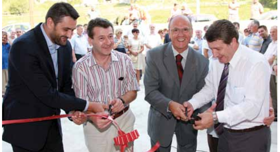
Presjecanjem vrpce otvorena nova škola

zovanja i nauke Kantona Sarajevo obezbijedilo je 55 odsto od ukupnog iznosa, a preostali dio novca obezbijeđen je iz budžeta Općine Stari Grad“, podsjetio je Hadžibajrić.