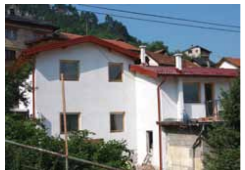
Objekat Pastrma 1-3

Objekat Pastrma 1-3 nastradao je u požaru. Tada su u ovoj kući izgorjela dva stana. Bila su oštećena i dva stana, koja su se nalazila ispod onih koji su izgorjeli.