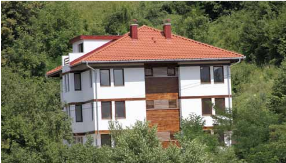
Zgrada na Brusuljama

Zgrada na Brusuljama u potpunosti je završena i u toku je vanjsko uređenje prostora oko objekta.