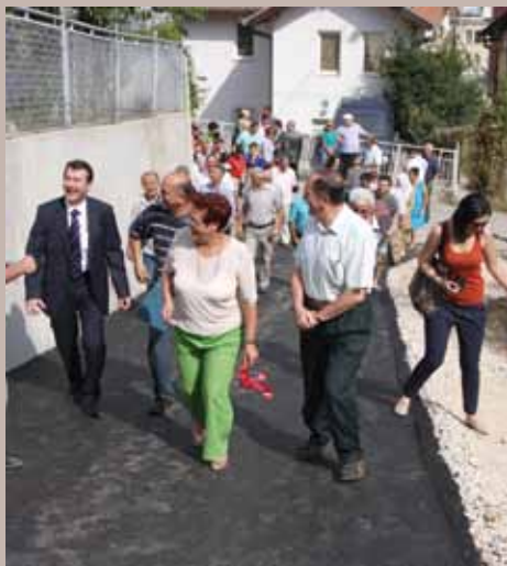
U obilasku Mjedeničkog potoka

je u julu. Podrazumijevala je postavljanje novih kanalizacionih cijevi, izgradnju potpornog zida i disipatora, kao i asfaltiranje pristupnog puta. Izvođač radova bile su firme: „Al inženjering“ i „Klico trans gradnja“.