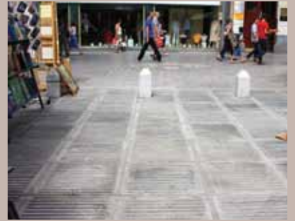
Trg oslobođenja - Alija Izetbegović

Zamijenjene su polomljene ploče na Bašćaršijskom i Trgu oslobođenja - Alija Izetbegović.