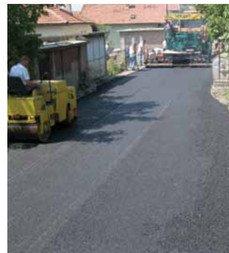
Nova kanalizacija i asfalt za Ulicu Sedrenik

„Ame“ iz Breze, a projekat je sa 120.000 KM finansirala Općina Stari Grad.