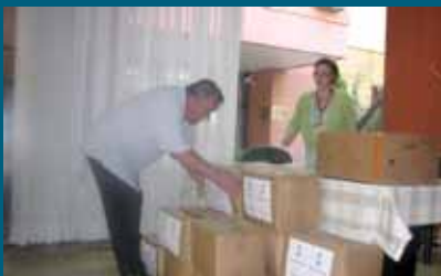
S podjele paketa

Prehrambene pakete 18. avgusta dobilo je trideset socijalno ugroženih porodica iz Općine Stari Grad. Riječ je o paketima koje je Općini donirala Ambasada Kraljevine Saudijske Arabije u Sarajevu.