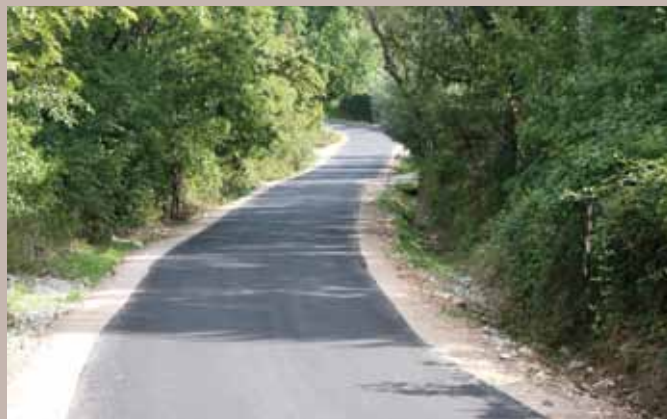
Dionica puta Zlatište - Širokača

Hadžibajrić je najavio i realizaciju novih projekata koji će biti ne samo od općinskog, nego i od entitetskog značaja. Jedan od tih projekata je sanacija dijela puta prema Istočnom Starom Gradu gdje žive povratničke porodice.