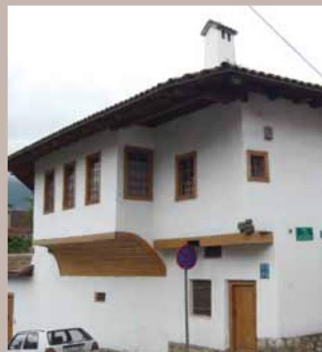
Kuća Alije Đerzeleza

Svrzina kuća predstavlja biser bosanskog graditeljstva otomanskog perioda i pod zaštitom je države kao spomenik kulture. Karakteristična je po tom što je jedina stara bosanska kuća sa očuvanim muškim i ženskim odjeljenima. Iako je izgrađena sredinom XVII. vijeka, doživljava određene transformacije od vlasnika da bi konačan izgled dobila tek pred početak Drugog svjetskog rata uz parcijalne konzervatorsko-restauratorske intervencije i to od prethodne države. Objekat je podignut u Čurčića mahali u Glođinom sokaku (koji i danas nosi identičan naziv - Glođina) i u kojem su živjeli ugledniji stanovnici Sarajeva. Sticajem okolnosti nosi naziv Svrzina s obzirom da njeni graditelji potiču iz porodice Glođo i živjeli su tu oko 200 godina. S obzirom da posljednji u nizu (Ahmed