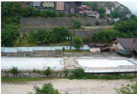
Bazen na Bentbaši

Zaključeno je ovo nakon sjednice Općinskog vijeća Stari Grad održane