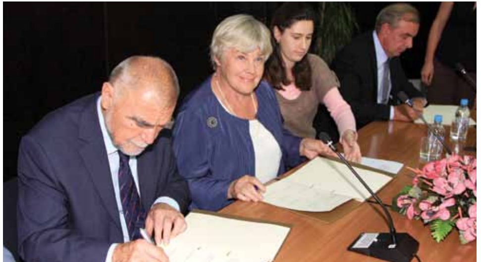
S potpisivanja Protokola