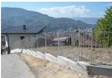
Nova ograda oko mezarja

Postavljena je ograda oko malog mezarja u Ulici Grličića brdo u Mjesnoj zajednici Medrese.