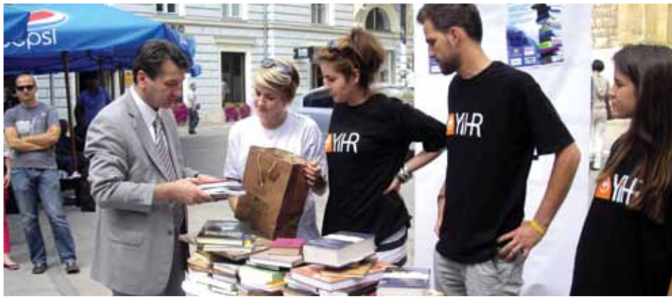
Donacija Općine Stari Grad

Inicijativa mladih za ljudska prava BiH u gradovima širom Bosne i Hercegovine, pod pokroviteljstvom potpredsjednika FBiH Svetozara Pudarića, organizovala je akciju prikupljanja knjiga za biblioteku Omladinskog centra Gornji Vakuf/Uskoplje. Sarajevska akcija bila je organizovana na Trgu fra Grge Martića pred Katedralom.