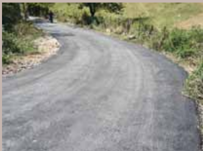
Postavljen novi asfalt

„U toku izgradnje hidroflex postrojenja postavljeno je 1.670 metara distributivne mreže, zbog čega su ulice bile poprilično oštećene. Zbog toga je bila potrebna hitna sanacija kolovoznih oštećenja u ovim ulicama“, kažu u općinskoj Službi.