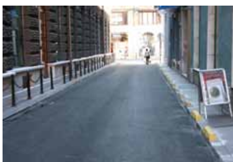
Ulica Vladislava Skarića

Izvođač radova bila je firma „Ame“ iz Breze. Vrijednost ovog projekta je 12.000 KM. S deset odsto finansirala ga je Direkcija za ceste Kantona Sarajevo, a s 90 odsto Općina Stari Grad.