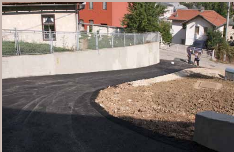
Riješen problem kanalizacije i ulice

svečanim presjecanjem vrpce 9. septembra, 2011. godine.