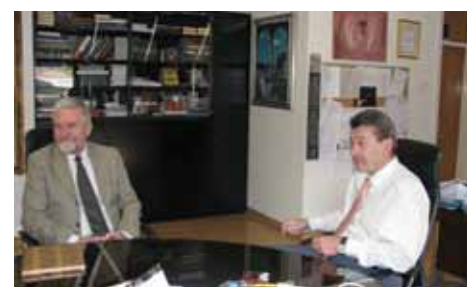
Dogovorena saradnja Austrije i Općine

Austrija je zainteresovana za ulaganja u obnovu historijskih objekata na području Općine Stari Grad Sarajevo, a posebno u one iz vladavine Austro-