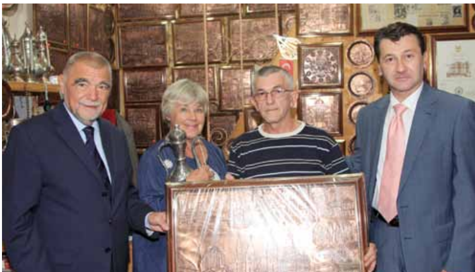
Delegacija Općine i ILH u posjeti zanatlijama

Nakon potpisivanja Protokola Hadžibajrić je s predstavnicima Internacionalne lige humanista prošetao Baščaršijom i posjetio izvorne stare zanatlije.