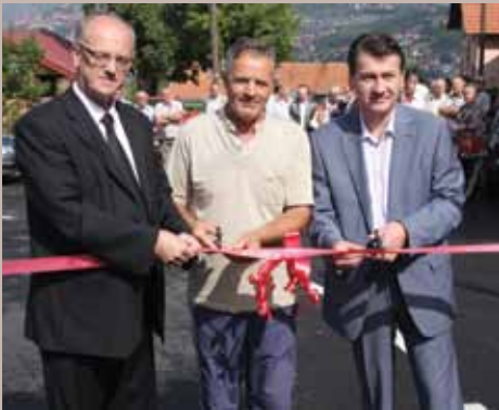
Sa otvaranja Ulice Iza gaja

Rekonstrukcija Ulice Iza gaja počela je sredinom juna ove godine. Izvođač radova bila je firma „Ame“ iz Breze. Projekat je koštao oko 550.000 KM i Općina Stari Grad finansirala ga je s 90, a Direkcija za ceste Kantona Sarajevo s deset odsto. Rekonstrukcija je podrazumijevala postavljanje nove kišne kanalizacije, izgradnju potpornih zidova i asfaltiranje ulice u dužini od oko 400 metara.