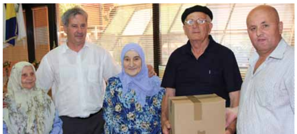
Organizovana podjela paketa

Općina Stari Grad ni ove godine, povodom mjeseca Ramazana i Bajrama, nije zaboravila pripadnike boračkih populacija.