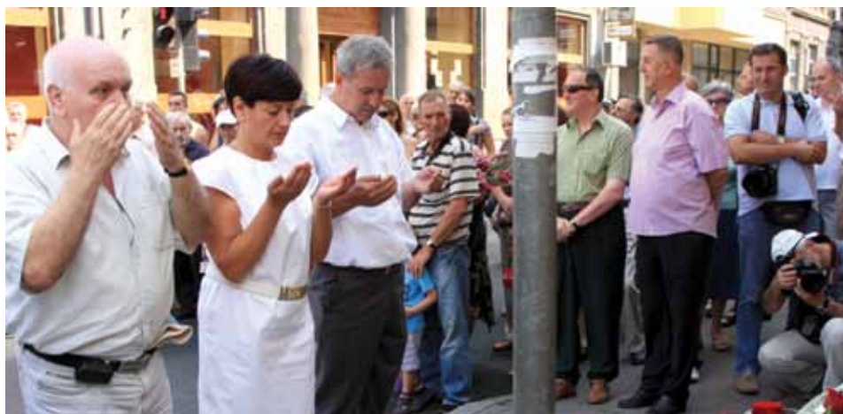
Delegacija Općine odala počast nevinim žrtvama

U Ulici Halači kod broja 5, 23. avgusta obilježena je 19.-a godišnjica od masakra u kojem je od agresorske granate poginulo osam građana Sarajeva, dok je troje teže ili lakše ranjeno. Pored delegacije Kantona i Grada Sarajeva, Udruženja roditelja ubijene djece opkoljenog Sarajeva, porodica i prijatelja poginulih na odavanju počasti prisustvovali su i predstavnici Općine Stari Grad Sarajevo.