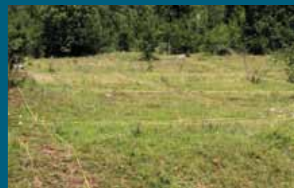
Bez mina oko kasarne Faletići

Teren oko kasarne Faletići očišćen je od mina. Tokom čišćenja terena demineri su našli tijelo mine PROM 1, dvije minobacačke granate kalibra 60 milimetara i tri nagazne mine PMA 3.