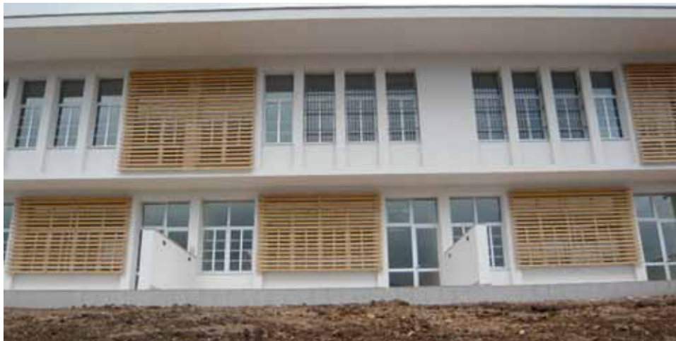
Osnovna škola "Sedrenik"

Izgradnja nove osnovne škole na Sedreniku koštala je oko 3,6 miliona KM, dok je za vanjsko uređenje oko škole i sanaciju obližnjih ulica Općina Stari Grad obezbijedila oko 500.000 KM. Izgradnjom ove škole riješen je dugogodišnji problem djece u ovom naselju koja su morala pješaćiti do najbliže škole i tako se izlagala opasnosti zbog uskih i iznimno prometnih saobraćajnica.