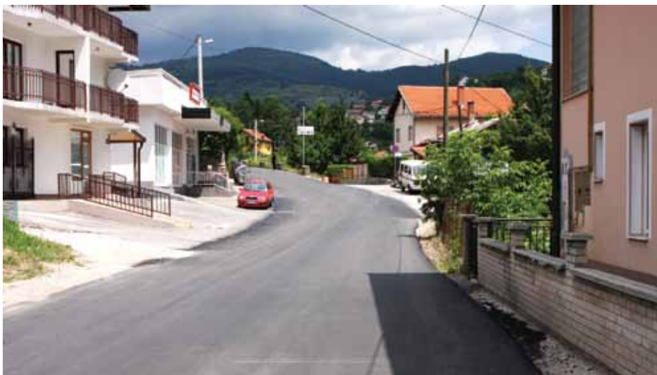
Pet dionica puta u novom ruhu