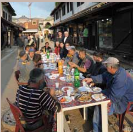
Kurban za radnike u Ulici Sarači

„U Saračima je postavljen najnoviji vodovodni sistem BAIO. Ima brojne prednosti u odnosu na stari klasični koji se do sada upotrebljavao, a po prvi put u Federaciji BiH postavljen je upravo u Saračima. Ugrađene su i nove vodovodne cijevi koje su, također, po prvi put postavljene u BiH. Cijevi su napravljene od čelika. Obogaćene su magnezijem, unutrašnji dio obložen je plastikom, dok je površinska zaštita bitumenska. Postavljena je i vrhunska ACO linijska odvodnja (predviđena za srednju i veliku oborinsku odvodnju), koja je na cijelom