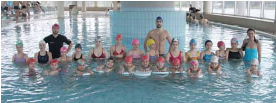
Polaznici škole plivanja

Općina Stari Grad u aprilu je finansirala školu plivanja za učenike četvrtih razreda osnovnih škola u ovoj općini. Projekat je realizovan u saradnji s ekspertnim timom Olimpijskog bazena Otoka na čelu sa Aldvinom Torlakovićem.