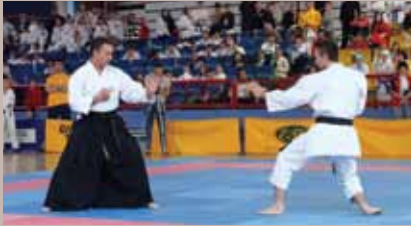
Za Karate klub "Stari Grad" 14 medalja

Deveti Tradicionalni karate turnir „Stari Grad 2011“ održan je 23. aprila u KSC Vogošća u okviru obilježavanja Dana Općine Stari Grad.