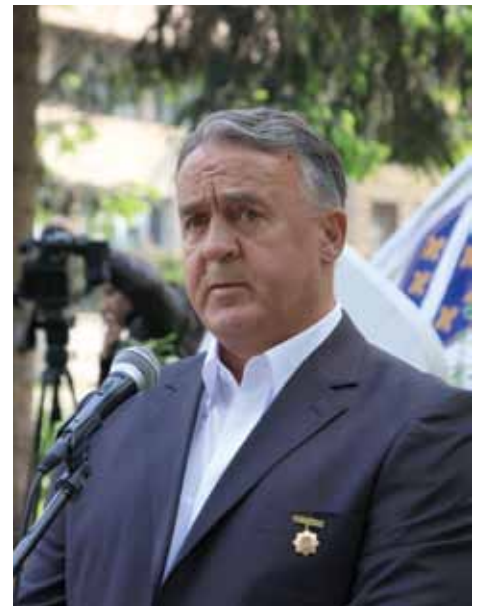
Ismet Dahić, komadant Prve brigade policije

Na Trgu oslobođenja-Alija Izetbegović okupili su se i preživjeli pripadnici ove brigade, članovi šehidskih i porodica poginulih boraca, predstavnici koordinacionog odbora udruženja boraca Kantona Sarajevo.