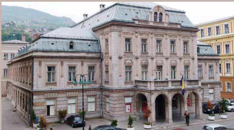
Dom Oružanih snaga

Austro-Ugarska pospremanja dijela šehar Sarajeva, naročito od Slatkog ćošeta za rad novog poretka. Ti ogromni zemljani radovi i ukroćivanje Miljacke u kamene zidove nisu mogli poravnati ni ine dragulje osmansko-dobnog graditeljstva (npr. Tašlihan,