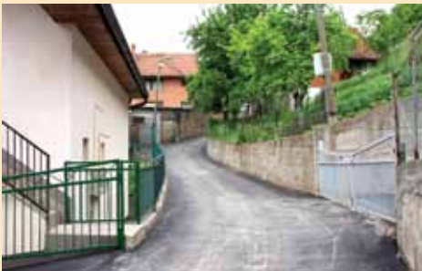
Sanirana Ulica Obhodža

Završena je sanacija makadamskog puta u Ulici Obhodža. Urađena su tri kraka: od broja 101 do 115 dužine 228 metara i širine između tri i četiri metra, od broja 83 do 89 dužine 60 metara i trećeg kraka dužine 79,5 metara. Sanacija je podrazumijevala čišćenje, postavljanje tampona od 15 cm, dizanje šibera, poklopaca, šahtova na određenu visinu, te ugrađivanje asfalt betona debljine sedam cm. Radove je izvodilo preduzeće KJKP „Rad“ na osnovu Ugovora sa Direkcijom za ceste Kantona Sarajevo i Općinom Stari Grad. Vrijednost izvedenih radova je 51.522,14 KM.