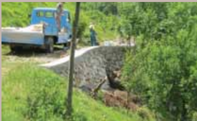
Obnovljen potporni zid u Ulici Pogledine

Radnici građevinske firme „Balkan Kamen“ d.o.o. Ilidža, završili su preslaganje kamenog zida u betonskoj podlozi i betoniranje AB kape u Ulici Pogledine do broja 11. Pri izgradnji se vodilo računa o autentičnosti zida, s obzirom da se nalazi u starom dijelu grada, tako da je građen od istog kamena koji je i ranije korišten. Projekat sanacije potpornog zida finansirala je Općina, a vrijednost investicije je 6.584,17 KM.