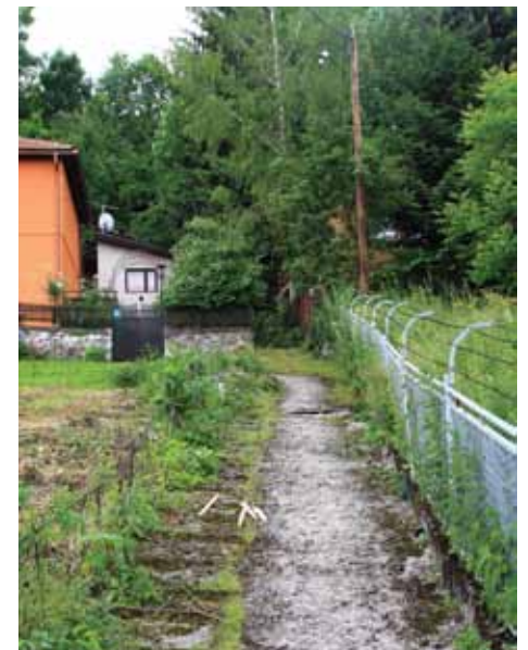
Korito Mjedeničkog potoka

Firma „Al inženjering“ d.o.o. Sarajevo na području Mjesne zajednice Mjedena počela je sanaciju Mjedeničkog potoka. Radovi će se se izvoditi u tri faze. Prva faza podrazumijeva sanaciju Mjedeničkog potoka s potpornim zidom, druga sanaciju kanalizacije, a treća izgradnju saobraćajnice, koja je još u fazi pregovaranja. Općina Stari Grad je u proteklom periodu riješila imovinsko-pravne odnose i obezbijedila projektnu dokumentaciju. U toku su pripremni radovi na terenu nakon čega će se pristupiti privremenom skretanju vode, što je neophodno za početak izgradnje novog potpornog zida dužine oko 40 metara. Rok za završetak radova u prve dvije faze je 90 dana, a vrijednost investicije je 134.782 KM.