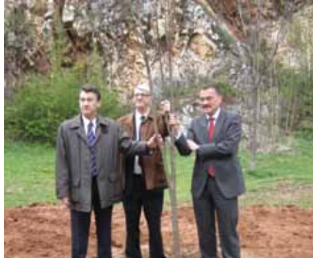
Ambasador Njemačke zasadio lipu

Ambasador Savezne Republike Njemačke n.j.e. Joachim Schmidt, 20. aprila 2011. godine je zasadio 103. lipu u Aleji ambasadora. U sadnji lipe, ambasadoru se pridružio i načelnik Općine Stari Grad Ibrahim Hadžibajrić.