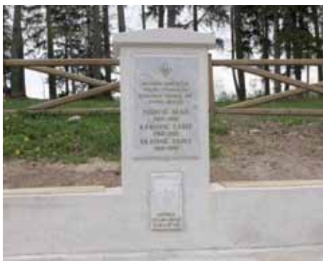
Spomenik prvom poginulom borcu ABiH

U okviru programa obilježavanja "Dani Općine Stari Grad Sarajevo: 22.04. do 18.05.2010.godine", 25. i 26. aprila 2011. godine, predstavnici izvrše i zakonodavne vlasti Općine Stari Grad, boračkih udruženja Starog Grada, te brojni građani prisustvovali su otvaranju dva spomen obilježja.