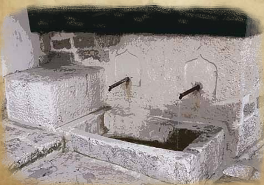
Sumbul česma sa dvije lule smještena je u istoimenoj ulici uz džamiju koju narod naziva Sumbulušom, jer je ime dobrotvora-vakifa hadži Mehmeda Balizadea (Balića) zaboravljeno. Tako danas džamija, česma i ulica-mahala nose zajedničko ime po cvijetu zumbulu, odnosno sumbulu!

„Tu se čovjeku čini da može dugo živjeti, jer na hiljadu mjesta po Sarajevu teku česme iz vrela mudrosti.“