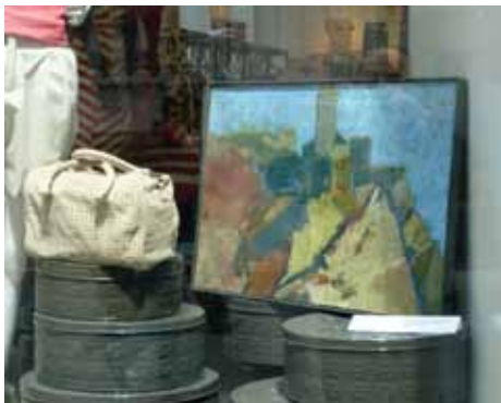
Izložba umjetničkih slika

U sklopu obilježavanja Dana Općine Stari Grad i ove godine je u izlozima radnji u ulicama Ferhadija i Štrosmajerova postavljena izložba umjetničkih slika, pod nazivom "Umjetnici Starom Gradu". Ovu izložbu organizuje općinska Služba za obrazovanje, kulturu i sport u saradnji sa Udruženje likovnih umjetnika BiH koji su ustupili umjetničke slike svojih članova u znak zahvalnosti za podršku koju im pruža Općina. Izloženi su radovi iz fundusa Internacionalne umjetničke kolonije Počitelj.