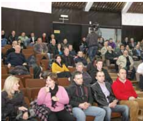
Sporazum potpisalo 100 predstavnika NVO

„Najpozitivniji dio ovog sporazuma je i da će nevladine organizacije u narednom vremenskom periodu ravnomjerno