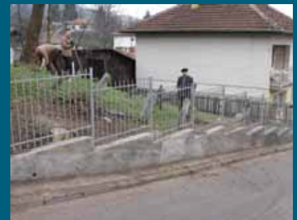
Završeno uređenje mezarja

Postavljena je nova metalna ograda oko mezarja u Nalinoj ulici, s kojeg je prethodno uklonjena stara, dotrajala žičana ograda. Projekat s 5.908 KM finansirala je Općina Stari Grad, a izvođač radova bila je firma „Librag“ d.o.o.