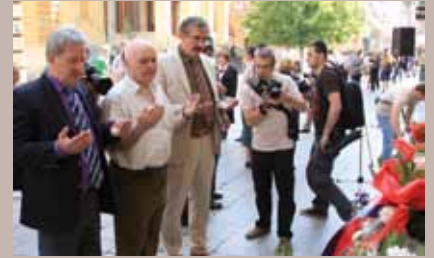
Fatiha za poginule

Delegacije Općine Stari Grad Sarajevo, Kantona Sarajevo i Gradske uprave, te preživjele žrtve, polaganjem cvijeća na spomen-obilježje u Ferhadiji obilježili su devetnaestu godišnjicu stradanja sugradana na ovom mjestu.