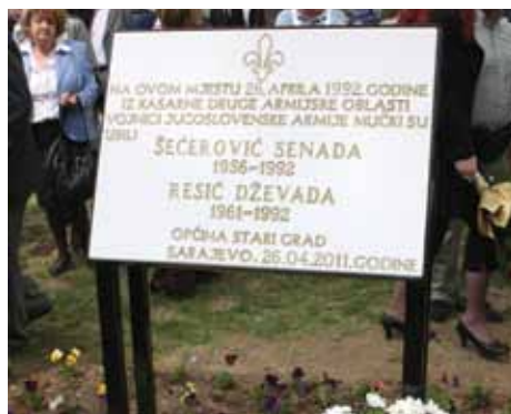
Spomenik civilnim žrtvama rata