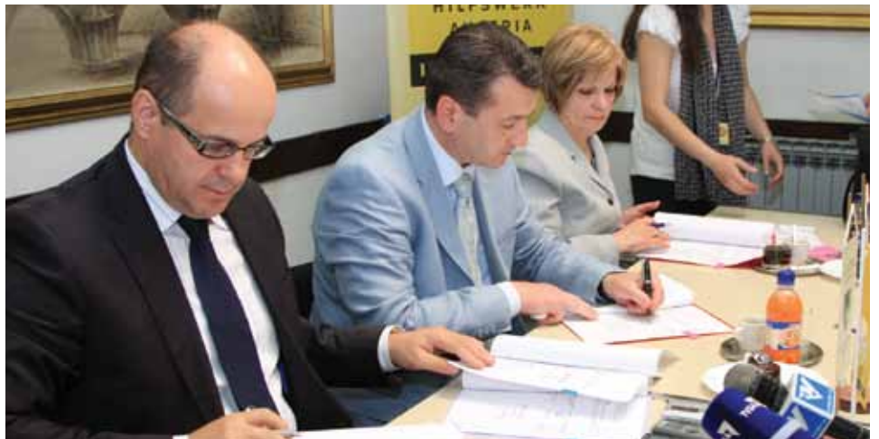
S potpisivanja ANEKS-a 2 Sporazuma

Radnici firme „Almi transport“, d.o.o. Zenica, koja je izvođač radova, do sada su završili betoniranje prizemlja, prvog i drugog sprata, krovnu konstrukciju... U toku su unutrašnji radovi i postavljanje crijeva.