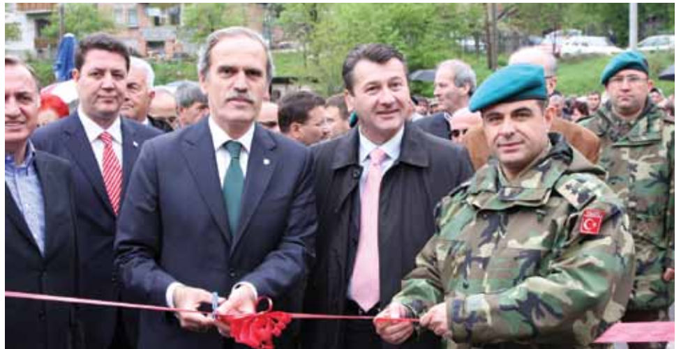
Prijatelji iz Turske otvorili most

„Želimo da narod BiH i Turske povežemo i još više ojačamo njihove prijateljske odnose. I ovaj most nije ništa drugo nego još čvršće povezivanje prijateljskih odnosa između naših naroda“, istakao je Batu.