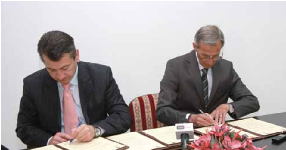
Poslovno-tehnička i sportsko-kulturna saradnja Starog Grada i Karpoša

Potpisivanju Sporazuma, koji će se prije svega temeljiti na poslovno-tehničkoj i kulturno-sportskoj saradnji, prethodile su odluke Općinskih vijeća Starog Grada i Karpoša.