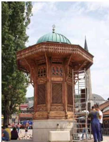
Sebilj u novom ruhu