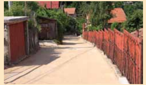
Ulica Sulejmana Zolja

Na području Mjesne zajednice Mahmutovac u Ulici Sulejmana Zolja, počela je sanacija kolovoza. Na ovoj dionici bit će uklonjen oštećeni asfalt, zakrpljena oštećenja, ugrađen tamponski materi-