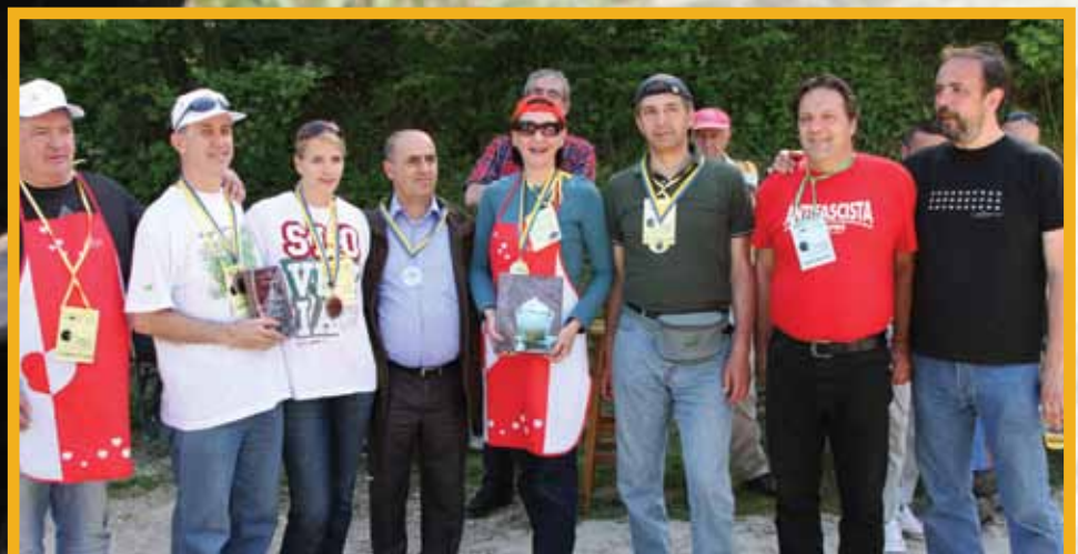
Zajednička fotografija učesnika

Manifestacija je održana u sklopu obilježavanja Dana Općine Stari Grad, tako da su joj prisustvovali brojni predstavnici zakonodavne i izvršne vlasti Općine. Svojim dolaskom učesnike je obradovao i popularni bh. pjevač Halid Bešlić. Većina diplomata, koji su tog dana bili u Aleji ambasadora, rekli su da nikada nisu spremali bosanski lonac, ali im to nije smetalo da se dobro zabave i okušaju u pripremi ovog tradicionalnog bosanskog jela.