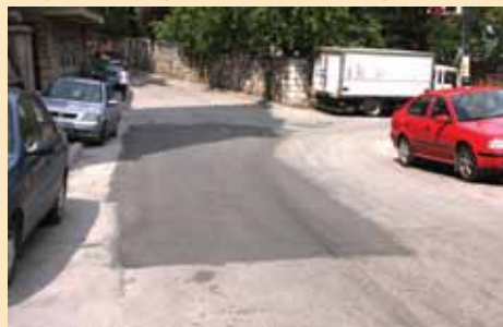
Krpljenje desetina ulica

Na osnovu Ugovora potpisanog između Općine Stari Grad, Direkcije za ceste Kantona i KJKP „Rad“ u maju 2011. godine, počelo je krpljenje udarnih rupa na području Starog Grada. Prema ugovoru KJKP „Rad“ će izvoditi asfaltnerske radove na sanaciji udarnih rupa i oštećenja na kolovozu na lokalitetu ulica: Muse Čazima Ćatića, Adžemovića, Nerkesijina, Nadmlini, Halilbašića, Brusulje (Hadžijska ravan), Donje Biosko,