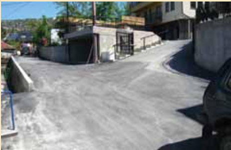
Novi asfalt za Ulicu Braće Eskenazi

Početkom maja Općina Stari Grad je finansirala sanaciju Ulice Braće Eskenazi, koja se nalazi na području Mjesne zajednice Logavina. Sanirana je kompletna ulica sa izrađenim asfaltnim kolovozom, te djelimično postavljajući betonski ivičnjaci. Realizaciju projekta u iznosu od 45.933,03 KM finansirala je Općina, a radove je izvodilo KJKP „Rad“.