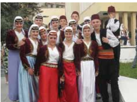
Predstavnici Starog Grada i BiH u Albaniji

Članovi starogradskog Kulturno-umjetničkog društva „Biseri sevdaha“ osvojili su zavidno drugo mjesto na Festivalu narodnih igara u albanskom gradu Lushnje.