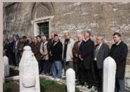
Proučena dova tvorcima BiH

Polaganjem cvijeća i učenjem Fatihe na mezarjima velikana 2. maja, ove godine delegacija Općine Stari Grad je obilježila Dan Općine Stari Grad.