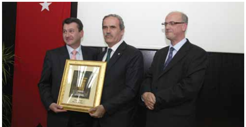
Zlatni sebilj za gradonačelnika Burse

Načelnik Hadžibajrić pozdravio je sve koji su svojim dolaskom uveličali svečanu sjednicu. Općini Centar čestitao je njen Dan, koji obilježava također 2. maja, te medijima čestitao Svjetski dan slobode medija zahvalivši im se na objektivnom izvještavanju i praćenju aktivnosti Općine Stari Grad. Pozdravivši goste iz Turske načelnik je istakao da je ova prijateljska