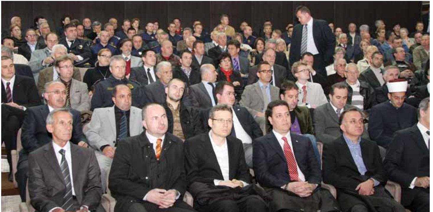
Prepuna Velika sala Općine Stari Grad Sarajevo

zemlja u posljednje dvije godine s 1,4 miliona KM učestvovala u finansiranju projekata Općine Stari Grad. Na sjednici premijerno je prikazan dokumentarni film "Stari Grad: u srcu Sarajeva".