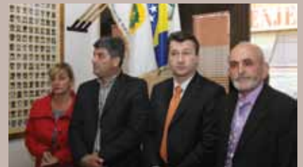
Sa otvaranja spomen sobe

U prostorijama Organizacije porodica šehida i poginulih boraca Stari Grad, 18. aprila 2011. godine otvorena je Spomen soba u kojoj su izloženi panoji s fotografijama 760 šehida i poginulih boraca Starog Grada. Ukupan broj fotografija bit će 780, čim sve budu kompletirane i spremne za postavljanje. Spomen sobu otvorili su načelnik Općine Stari Grad Ibrahim Hadžibajrić i ministar za boračka pitanja Kantona Sarajevo Nedžad Ajnadžić. Svečanom otvaranju prisustvovali su predstavnici boračkih udruženja Starog Grada, predstavnici političkih stranaka koje participiraju u Općinskom vijeću Stari Grad, pomoćnici i savjetnici načelnika Općine i drugi.