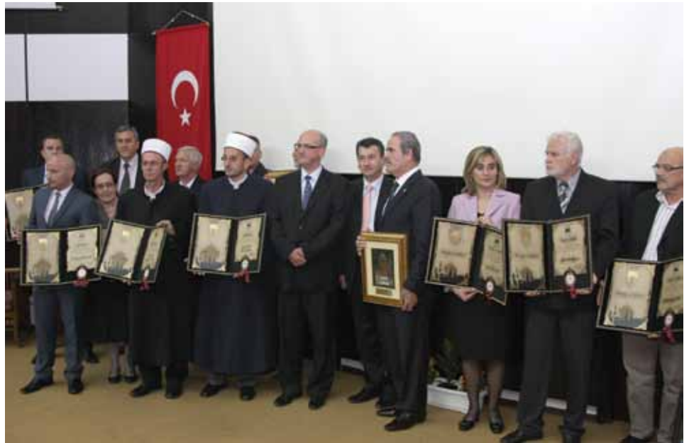
Predsjedavajući OV, načelnik Općine Stari Grad i dobitnici priznanja