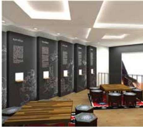
Prioritet muzejska postavka zanata

Predviđeno je ovo u planu aktivnosti „Kuća zanata“, kojeg su 2. juna u Općini Stari Grad predstavili članovi Nevladine organizacije Zona unaprjeđenog poslovanja. Osnovna ponuda „Kuća zanata“ trebalo bi da bude izložbeno-muzejska postavka zanatskih proizvoda koja će biti podijeljena na Baščaršiju nekad i Baščaršiju danas. Prva postavka predstavljat će stare zanate koji su izumrlili, a druga današnje zanatlije, njihove proizvode. U 'Kući zanata' planirana je suvenirnica u kojoj će turisti i lokalno