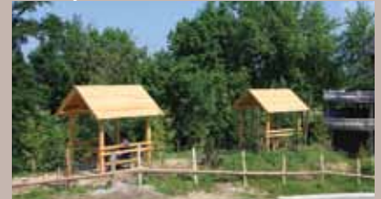
Uređeno izletište Gaj

Općina Stari Grad u saradnji sa KJP "Sarajevo-šume" realizirala je projekat "Kompletiranja vegetacijskog i ambijentalnog uređenja lokaliteta Gaj" - (Gaj kod Naline ulice). Cilj projekta je očuvanje prirodnih vrijednosti, zaštita šuma, unaprjeđenje vanprivrednih funkcija šuma i šumskog zemljišta na području Starog Grada.