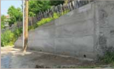
Potporni zid u Nevjestinoj

Završena je izgradnja potpornog zida u Ulici Nevjestina od broja 14 do broja 18 na Vratniku.