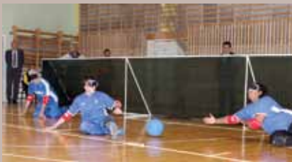
Učestvovalo 600 takmičara

Međunarodni global turnir za slijepa i slabovidna lica i Prvi međunarodni plivački miting održani su 7. maja, 2011. godine u sklopu obilježavanja Dana Općine Stari Grad.