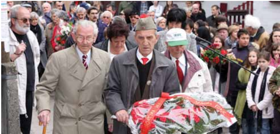
O dali počast saborcima