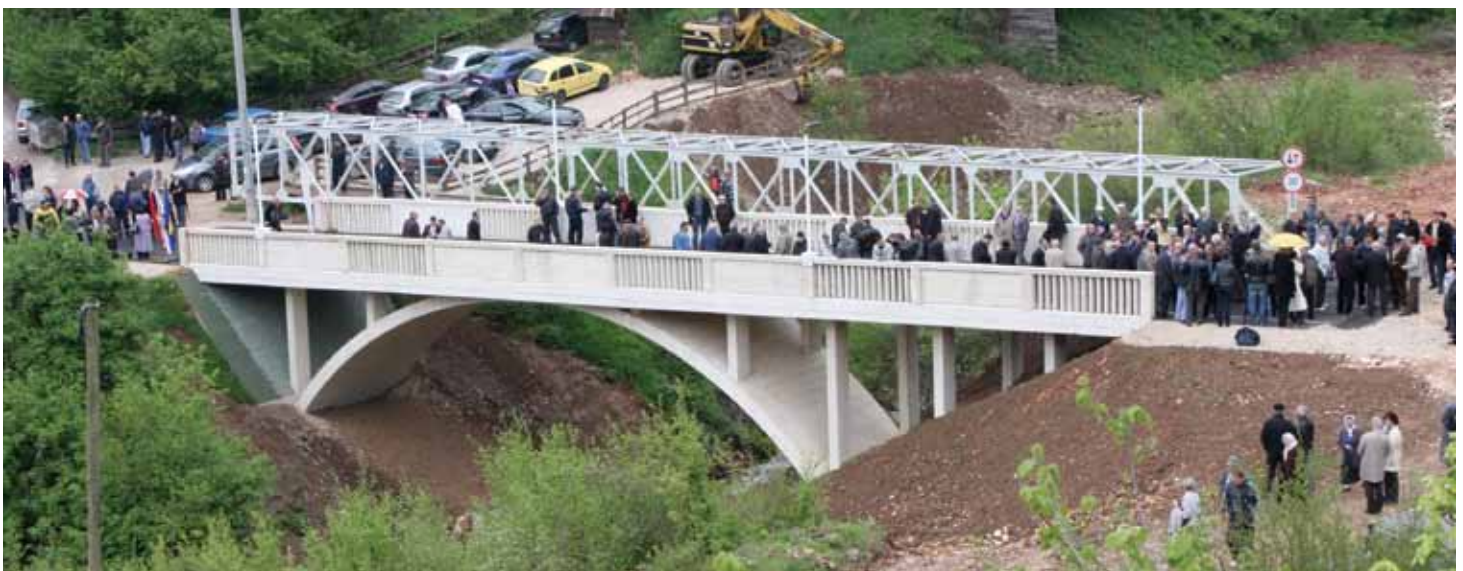
Novi most prozor u svijet za građane Obhodže