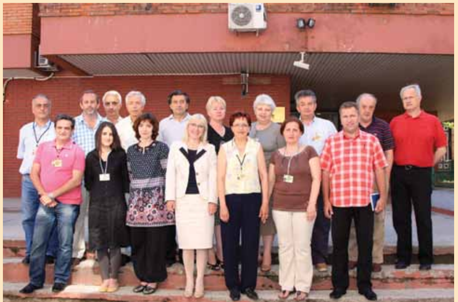
Uposlenici službe za komunalne poslove i investicije

U narednom periodu nastavljamo s realizacijom poslova i projekata planiranih za 2011. godinu. Riječ je o izgradnji i rekonstrukciji potpornih zidova, postavljanju ruko hvata i putnih odbojnika, rekonstrukcija