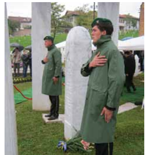
Mezar Alije Izetbegovića