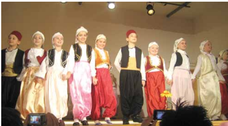
Folklorne igre u izvedbi najmlađih