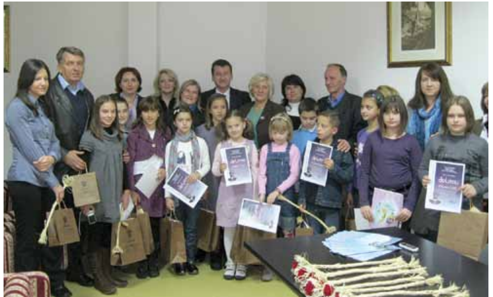
Zajedničko fotografisanje dobitnika i učitelja sa Načelnikom