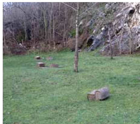
Polomljene i razbacane klupe

nisu na ovome zaustavili. U noći sa subote na nedjelju (27/28.novembar) polomljeno je još 16 lipa, tako da je ukupan broj uništenih stabala 21. Osim toga uništene su dvije ploče sa imenima ambasadora, a