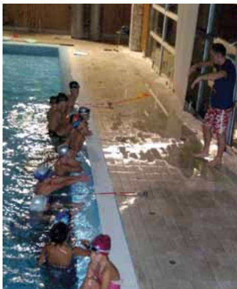
Na jednom od treninga

P.K. "Stari Grad" Sarajevo funkcioniše na volonterskoj osnovi, a sva sredstva se ulažu isključivo u plivače, treninge i trenerski pogon. Imajući ovo u vidu, P.K. „Stari Grad“ Sarajevo vjerovatno je jedini klub u kojem uposleni umjesto primanja imaju samo satisfakciju u tome da će svojoj djeci obezbijediti optimalne uslove za treniranje i napredovanje. Uprava kluba ističe da su posebno zahvalni Općini Stari Grad na podršci koju im je pružila, kao i hotelu „Hollywood“ na Ilidži na ustupljenim terminima za treninge na hotelskom bazenu, kao i sali za sastanke.