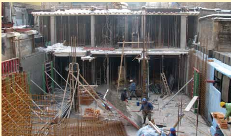
Radovi na gradilištu: Postavljanje hidroizolacije, betoniranje bočnih zidova i šalovajne stubova

da ljudima ne bude previše tijesno, pogotovo kada ulaze u takvu strukturu. Ulični dio objekta će imati trijem, jer smatram da je dobro imati nadstrešnicu i neku vrstu zaštite iznad posjetilaca koji gledaju izloge i ulaze u objekat.