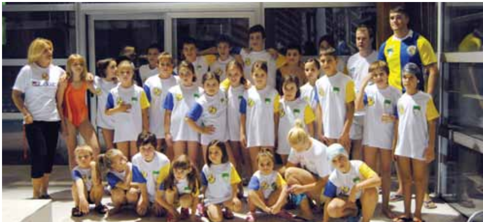
Članovi Plivačkog kluba "Stari Grad"