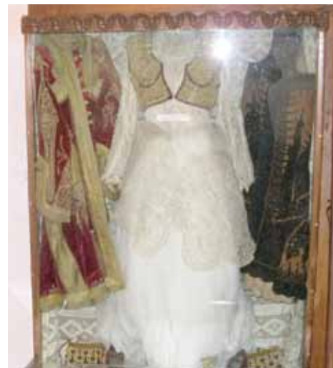
Ženska narodna nošnja