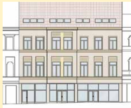
Budući izgled Kvadranta XII

□ Koliko je za Vas bio izazov Kvadrant XII, s obzirom da Vam se ukazala prilika da projektujete poslovni centar u samom srcu grada?