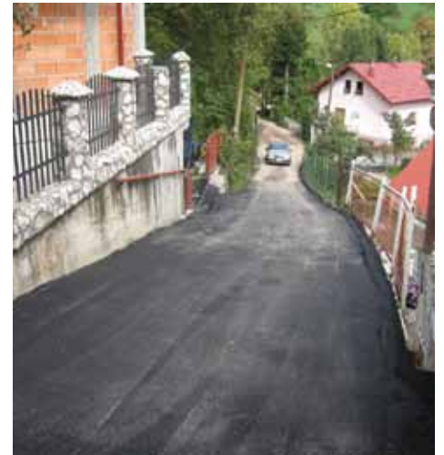
Ulica Zmajevac - Sarajevskih Gazija

Općina Stari Grad, Direkcija za ceste Kantona Sarajevo i KJKP „Rad“ potpisali su Anex na već postojeći Ugovor o izvođenju radova na ljetnom održavanju cesta na području Kantona Sarajevo za period od 15.03. do 15.11.2010. godine. Pomenuti ugovor obuhvatao je sanaciju kolovozne konstrukcije Zmajevac - Sarajevskih Gazija dužine 273 metra (ukupna kvadratura 960 m 2 ) i sanaciju udarnih rupa u ulicama Mehmedagina i Alije Nametka završena je u oktobru. Radovi su trajali su 10 dana. Realizaciju cjelokupnog projekta, u vrijednosti od 42.861,19 KM, finansirala je Općina Stari Grad.