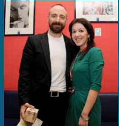
Ergenc sa novinarkom Magazina "Azra"

Najveće turske glumačke zvijezde Halit Ergenc i Berguzar Korel, koji su popularnost na našim prostorima stekli glumeći šarmantnog Onura i neodoljivu Šeherezadu u seriji „1001 noć“, boravili su, početkom novembra u Zagrebu, gdje su bili poslovno angažovani. Saznavši za ovu posjetu, te za intervju koji je ekskluzivno dobio Magazin „Azra“, odlučili smo Onuru (Halitu Ergencu), poslati prigodan poklon Općine Stari Grad, kako bi kada posjeti naš Grad bio bolje upoznat sa njegovom historijom.