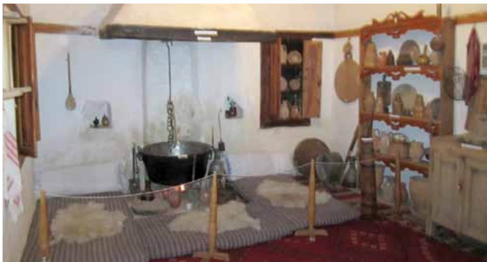
Tradicionalna albanska kuća