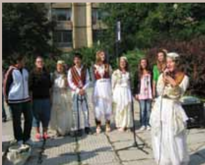
Nastup hora "Ramada Sokoli"

barijere između ove dvije zemlje. To je dijelom rezultat angažovanja ambasade BiH koja svjesno radi u tom zbližavanju u svim domenima. Također, tu je i Zajednica Albanaca u BiH koja je također dala svoj doprinos u zbližavanju i spajanju davne tradicije ova dva naroda. Drago mi je da je Općina Stari Grad i načelnik Hadžibajrić pristala da bude pokrovitelj ove manifestacije, a nadam se da će naredni korak biti prezentacija starih zanata iz Starog Grada u Skadru, te bratimljenje Općine Stari Grad i Grada Skadra,“ riječi su zamjenika ambasadora