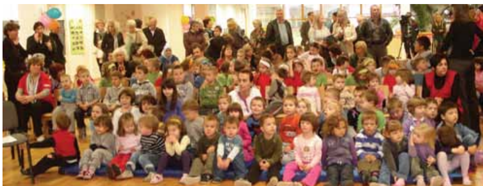
Članovi vrtića na obilježavanju 65. godišnjice

Djeca iz vrtića su pripremila prigodan program sastavljen od hora, folkloru, recitala, glume, igrokaza, plesa...Tom prilikom predstavnici Općine, najmlađima su poklonili korpu sa slatkišima i poslasticama.