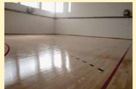
Završena fiskulturna sala

Radovi na izgradnji osnovne škole „Sedrenik“ svakim danom sve više napreduju. Završeni su priključci za vodu, a trenutno se izvode radovi na postavljanju rezevoara za grijanje. Radovi se izvode i unutar škole gdje je u toku postavljanje svjetlosnih tijela. Ranije je završena montaža spuštene stropove sa osvjetljenjem i gletovanje zidova, postavljena su unutrašnja vrata i spojeni priključci za separatnu kanalizaciju u Ramića potok. U