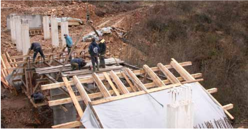
Radovi na mostu