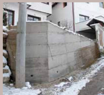
Potporni zid u ul. Turbe br. 7

U toku mjeseca novembra saniran je potporni zid u ulici Maguda br.1. Općina je pristupila sanaciji pomenutog zida jer je, usljed vremenskih nepogoda, velikog nagiba, te jakih oborinskih i podzemnih voda, došlo do odrona. Na tom dijelu saniran je potporni zid sa dvije strane: bočne i prednje. Vrijednost ove investicije je 34.430,14 KM, a investitor je Općina Stari Grad. Izvođač radova bila je firma „Klico Trans Gradnja“ d.o.o. Sarajevo.