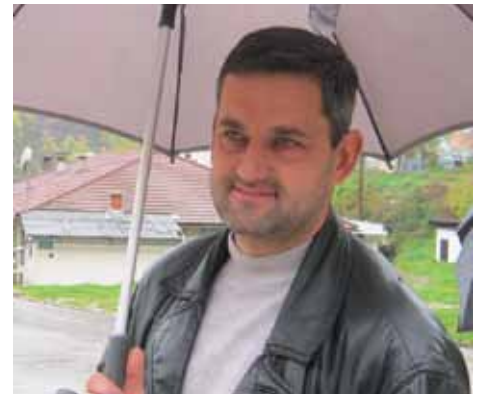
Olovčić: Teško se odvija saobraćaj

Kako je brojnim medijima, koji su prpratili početak radova, izjavila Vildana Taso-Kapetanović, pomoćnik načelnika za komunalne poslove i investicije, most će mnogo značiti građanima ovog dijela Starog Grada.