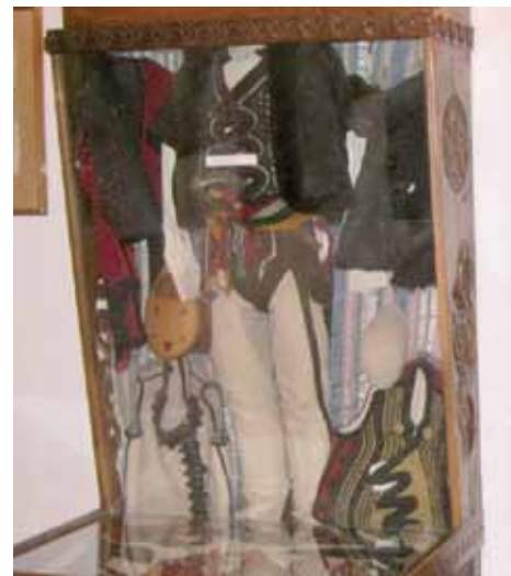
Muška narodna nošnja