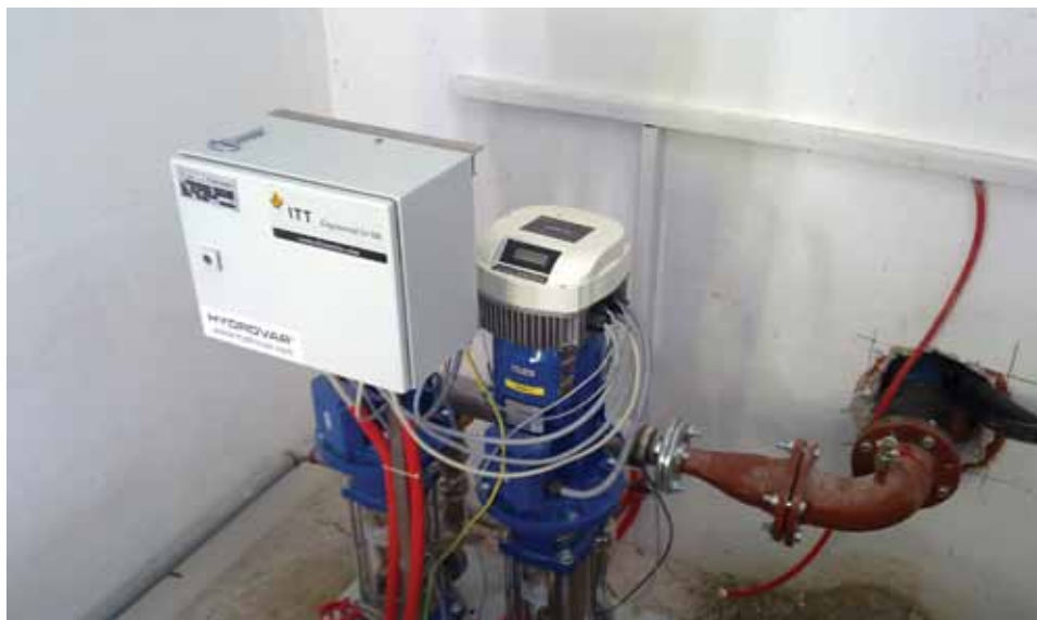
Postavljena hidroflex pompa

Kako nam je rekao općinski nadzorni organ, Sejfidin Zimić, veći dio posla je završen. Postavljeno je hidroflex postrojenje i kompletna distributivna vodovodna mreža dužine 1650 metara. Trenutno se vrše individualni priključci stambenih objekata na gradsku vodovodnu mrežu.