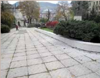
Trg Oslobođenja - Alija Izetbegović

Plato na Trgu Oslobođenja - Alija Izetbegović, na dijelu prema ulici Zele-nih beretki i Ferhadija, ponovo je uređen. Firma „Balkan Kamen“ d.o.o. Ilidža, koja je izvodila radove, početkom novembra uradila je zamjenu polomljenih betonskih ploča sa izradom betonske podloge, poliranje i brušenje kamene obloge centralnog spomenika „Multikulturalni čovjek“ na trgu, te osvježanje tj. bojenje šahovskih polja na trgu, gdje veliki broj građana svoje slobodno vrijeme provodi igrajući šah. Pored navedenih radova urađena je i ugradnja kamenih i željeznih stubića oko cijelog trga, koji su postavljeni na način preklapanja, kako bi bio moguć neometan prolazak vozila sa dozvolom. Realizaciju kompletnog projekta, u vrijednosti od 4.860 KM, finansirala je Općina Stari Grad.