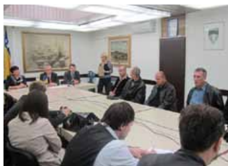
Sa potpisivanja Ugovora o dodjeli plastenika

U prostorijama Općine je 01. novembra izvršeno potpisivanje Ugovora za dodjelu plastenika u cilju stimulisanja poljoprivredne proizvodnje. Osnovni ciljevi i pravci ekonomskog razvoja Općine Stari Grad obuhvataju i oblast proizvodnje hrane. Iako je Općina Stari Grad sastavni dio urbanog područja Grada Sarajeva, njene granice obuhvataju