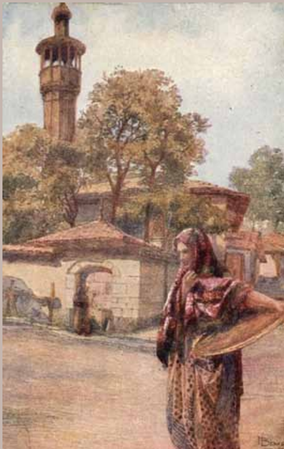
Mesdžid Arebi-atik iz 1917. god. u ul Požegina

Ramića potok je sa okolnim terenom predodredio karakter ovom administrativnom prostoru, koji se od Bašćaršije, uske dodirne tačke, lijevkasto širi prema sunčanim padinama Sedrenika upotpunjujući starogradske amfiteatar.