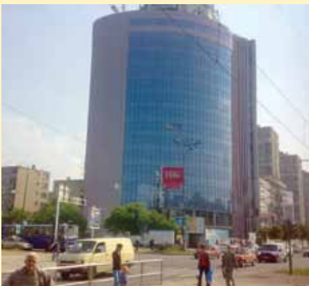
Jedan od projekata na koje je ponosan