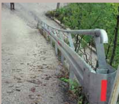
Bostarići br. 1

U ulici Bostarići kod broja 1 izrađena je i postavljena putna odbojna ograda. Naime, Općina Stari Grad odlučila je postaviti zaštitnu ogradu na zahtjev građana Mjesne zajednice Širokača, s obzirom da je u pomenutoj ulici evidentan veliki nagib terena. Izvođač radova bila je firma „Alu-co“ d.o.o. Sarajevo.