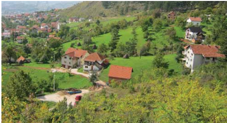
Dio naselja Sedrenik

Općina Stari Grad je krajem septembra počela sa realizacijom projekta izgradnje Hidroflex stanice Grdonj sa pripadajućom vodovodnom mrežom. Naime, dio naselja Sedrenik, koje je izgrađeno poslije rata i gdje živi oko 60 porodica, vodom se snabdijeva iz lokalnog izvora koji nije dovoljan, a ni kvalitetan. Općina je, u želji da pomogne stanovnicima ovog dijela grada, odlučila krenuti sa realizacijom ovog projekta. S obzirom da se naselje nalazi iznad nivoa rezervoara Grdonj, postojala je realna potreba za izgradnjom hidroflexa, tj. dvije pumpe koje će omogućiti