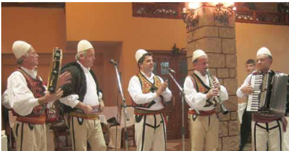
Zabava uz tradicionalne albanske pjesme i igre

Ovim svečanim dokumentima potpisnici Sporazuma preuzeli su obavezu da, na osnovu međusobnog poštovanja, uređuju odnose stalne saradnje u svim oblastima,