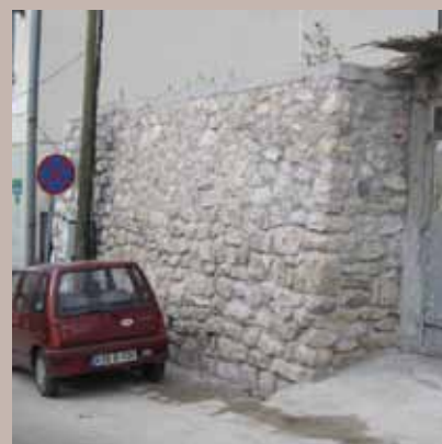
Potporni zid u ul. Maguda br. 1

U toku mjeseca novembra saniran je potporni zid u ulici Maguda br.1. Općina je pristupila sanaciji pomenutog zida jer je, usljed vremenskih nepogoda, velikog nagiba, te jakih oborinskih i podzemnih voda, došlo do odrona. Na tom dijelu saniran je potporni zid sa dvije strane: bočne i prednje. Vrijednost ove investicije je 34.430,14 KM, a investitor je Općina Stari Grad. Izvođač radova bila je firma „Klico Trans Gradnja“ d.o.o. Sarajevo.