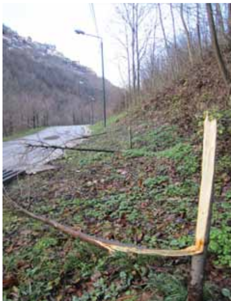
Polomljene sadnice lipa

U povodu najnovijeg u nizu napada na Aleju ambasadora, održan je hitan sastanak