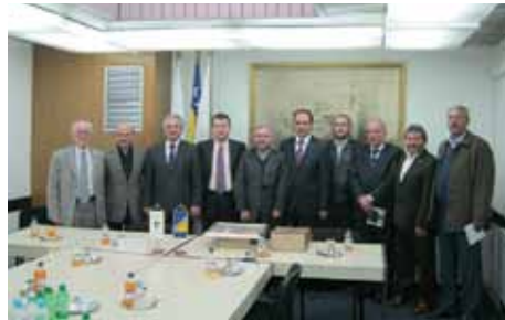
Delegacija Općine Seldžuk sa Načelnikom

Delegacija Općine Seldžuk iz turskog grada Konya, 26.10.2010. godine posjetila je Općinu Stari Grad. Delegaciju, koju je predvodio počasni konzul BiH