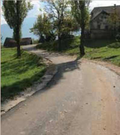
Ulica Streljačka - Hladivode

Asfaltiranje kolovozne konstrukcije na dionici ulice Streljačka - Hladivode izvršeno je krajem oktobra. Radove su izvodili radnici KJKP „Rad“ na osnovu Ugovora sa Direkcijom za ceste Kantona Sarajevo i Općinom Stari Grad. Urađeno je skidanje starog, oštećenog asfalta, postavljanje tampona, te završno asfaltiranje. Vrijednost izvedenih radova je 32.687,93 KM.