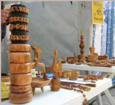
Izloženi predmeti od drveta

„Ovaj današnji kulturni događaj tj. promocija kulturnih vrijednosti starih zanata Albanije u Bosni i Hercegovini je dokaz i rezultat da ne postoje nikakve