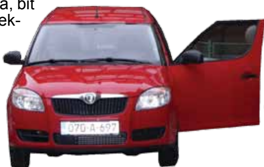
Poklon Turističke zajednice Kantona Sarajevo