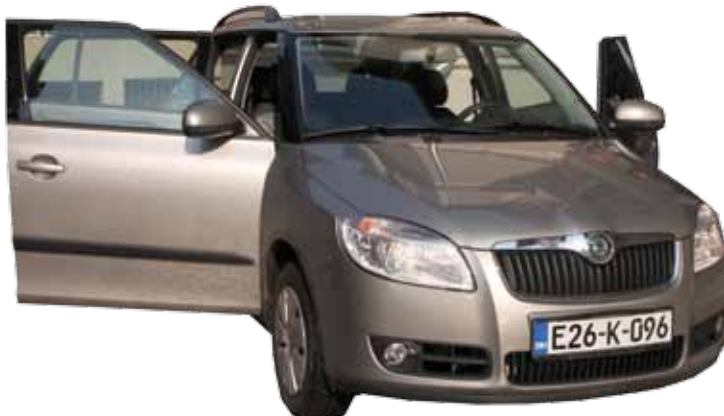
Poklon Fabrike duhana Sarajevo

Turistička zajednica Kantona Sarajevo pomogla je obnovu voznog parka Općine Stari Grad, izdvojivši sredstva u iznosu od 35.000,00 KM za kupovinu dva vozila Škoda roomster. Vozila će služiti za efikasniji rad službi. Osim toga, bit će korištena i u okviru projekta turističkih patrola koji je pokrenut prošle godine. U okviru ovog projekta angažuju se mladi ljudi koji u ulozi turističkih vodiča-informatora stoje na usluzi turistima koji posjećuju Stari Grad i daju im sve potrebne informacije tokom sezone, koja počinje 01. juna 2010. godine.