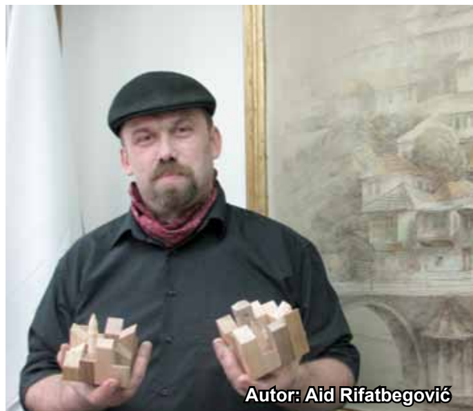
Autor: Aid Rifatbegović

Kocka je izgrađena od četiri vrste drveta: orah, bukva, hrast i jasen. Svojim šarenilom i toplinom daju vjeran prikaz Starog Grada na tako maloj površini. Stilizovane građevine, šarenilo kulture i tradicije nikada dosad nisu bili smješteni u ovako malim dimenzijama u formi suvenira. Stoga, ne čude riječi autora da mu je pobjeda bila važna, ali ne zbog novca, nego zbog ideje. Različite forme i oblici drveta savršeno se uklapaju u „Sarajevsku kocku“, jednako kao što se različite kulture, religije i tradicija savršeno uklapaju u sklad i harmoniju Starog Grada.