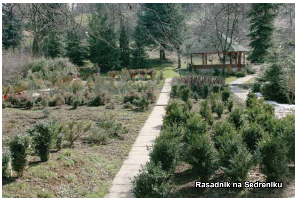
Rasadnik na Sedreniku

Velika kula na Pašinom brdu (nad. vis. 965 m) je fortifikaciona utvrda iz austrougarskog perioda sa ostacima temelja neidentifikovanog objekta. Na objektu su vidljivi otvori u obliku puškarnica, kao i otvori za cijevi artiljerijskog oružja. Prema istraživanjima Šumarskog fakulteta u Sarajevu iz 2005. godine, kula na Sedreniku je jedno od dva preostala gnijezdilišta sivog sokola, kojeg nemilosrdno uništavaju uzgajivači golubova. Nišani sa ekshumiranog muslimanskog groblja, čiji natpisi nisu evidentirani u literature, ispred Doma Armije, koje je 1912. godine Austrougarska pretvorila u parkiralište, nalaze se u haremu džamije na Sedreniku, čija je izgradnja započeta 1998. godine, a na opštu radost stanovnika je u funkciji od 2000. godine. Špicasta stijena, za vrijeme agresije na BiH i opsade Sarajeva, zloglasno agresorsko snajpersko uporište sa kojeg je ubijen i ranjen veliki broj Sarajlija. Ostaci snajperskih rovova i tranšea zajedno sa ostalim sadržajima su u sklopu spomen-parka na Grdonju, općina Centar, kako bi podsjećali na herojski put boraca 105. motorizovane brigade ARBiH.