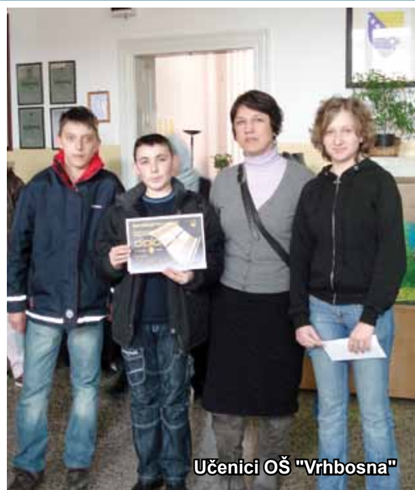
Učenici OŠ „Vrhbosna“