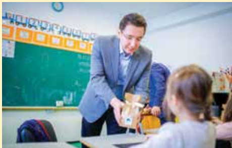
Pokloni za najmlađe

him Hadžibajrić u Starom Gradu je uveo mjesečnu naknadu u iznosu od 150 KM za lica s poteškoćama u razvoju bez obzira na godine života. Servis centar „Dajte nam šansu“ otvoren je 2017. godine, u prostorijama koje im je ustupila Općina Stari Grad