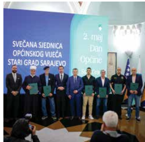
Priznanja uručena na Svečanoj sjednici

u vremenu i prostoru. Pitamo se šta bi Bosna bila bez Sarajeva, a Sarajevo bez Starog Grada, Baščaršije, Sebilja, džamija, sinagoga, crkva i katedrala. Sarajevo je nastalo ovdje u Starom Gradu kao dobro djelo, kao vakuf u čemu jeste njegova kobna vrijednost i nepotrošena blagodat. Izdržljivost ovog grada u nesreći sa kojom se suočio vagana je na mnogim svjetskim vagama, političkim, idološkim i vjerskim. To vaganje još uvijek traje. Priznanje 'Zlatni sebilj' doživljavam kao obavezu u budućnosti, da se lično i još više založim za napredak Starog Grada, Sarajeva i cijele zajednice u cjelini", istakao je u svom govoru reisu