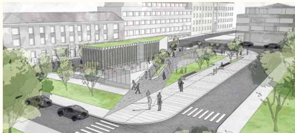
Podzemna garaža na Trgu Austrije

da, preko puta Vijećnice, u najavi je još jedna u neposrednoj blizini.