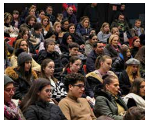
Ulaganje u obrazovanje mladih