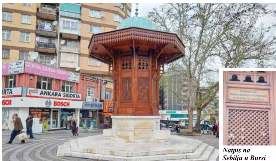
Sebilj u Bursi

općine najbolje pokazuju zajednički projekti. Općina Osmangazi je finansirala izgradnju Bakr-babine džamije i restauraciju arheološkog parka At mejdan, te sufinansirala rekonstrukciju Bašçaršijskog trga. Općina Stari Grad je pomogla izgradnju sebilja po uzoru na bašçaršijski sebilj u samom središtu Burse, a tokom nedavne posjete Bursi, načelnik Hadžibajrić je najavio da će Stari Grad u znak prijateljstva sagraditi fontanu ispred čuvenog Muzeja Panorama 1326 u Bursi.