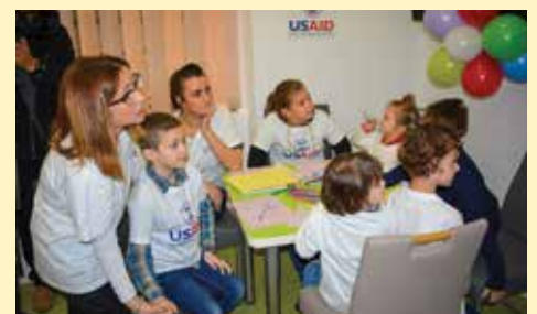
Servis centar otvoren 2017. godine