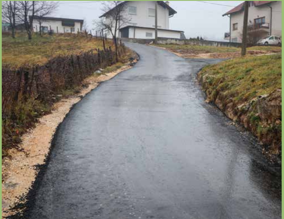
Hladvode i Baruthana

U mjesnoj zajednici Medrese u ulici Arapova, oko 25 domaćinstava dobilo je novu kanalizacionu mrežu, zahvaljujući velikom infrastrukturnom projektu koji je nedavno završen. Radovi su obuhvatili zamjenu stare kanalizacione mreže prošle godine, nakon čega je početkom ove godine asfaltirano preostalih 120 metara ove ulice. U sklopu radova, ugrađene su nove cijevi, uključujući 120 metara za fekalnu kanalizaciju i isto toliko za oborinsku odvodnju, a ukupni troškovi projekta iznosili su 190.000 KM.