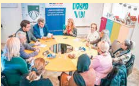
Podrška u iznosu od 10.000 KM

Zgrada Zavoda Mjedenica je 2013. godine dobila novu fasadu i stolariju kroz projekat energetske efikasnosti. Finansiranje od 500.000 dolara je obezbijedila Evropska komanda američkih snaga (US EUCOM) putem svog Ureda za saradnju u oblasti odbrane pri ambasadi SAD-a u BiH, a na preporuku Općine Stari Grad. Također, 2014. godine Općina Stari Grad i Fondacija "Asmir Begović" su zajedno izgradili sportsko igralište za Zavod Mjedenica.