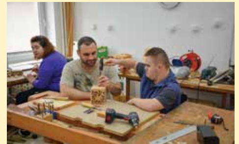
Zavod ima oko 200 korisnika

him Hadžibajrić u Starom Gradu je uveo mjesečnu naknadu u iznosu od 150 KM za lica s poteškoćama u razvoju bez obzira na godine života. Servis centar „Dajte nam šansu“ otvoren je 2017. godine, u prostorijama koje im je ustupila Općina Stari Grad