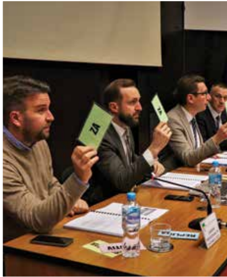
Dobra saradnja vijećnika i općinskih službi

“Predložio sam predsjedavajućem Općinskog vijeća Seidu Škaljiću da Općinsko vijeće donese zaključak kojim će se tražiti od Skupštine KS da ubrzaju rješavanje ovog pitanja i drago mi je što su vijećnici jednoglasno