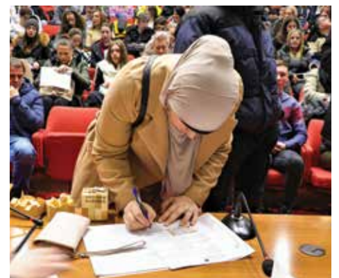
150 KM za učenike i 200 KM za studente

Sve je veća potražnja, kako u BiH, tako i drugim evropskim zemljama za kvalitetnim kadrom iz oblasti deficitarnih zanata. Kako bi podstakli mlade da se opredjeljuju za zanate, Općina Stari Grad Sarajevo već sedmu godinu zaredom osigurava im stipendije. To je razlog i zašto su njihove stipendije u istom rangu kao i studentske i iznose 200 KM mjesečno. Ove godine takvih stipendista je osam i to za zanimanja: zlatar-draguljar, pomoćni dekorater, automehaničar, poslastičar (x2), elektroenergetičar, krojač i tapetar.