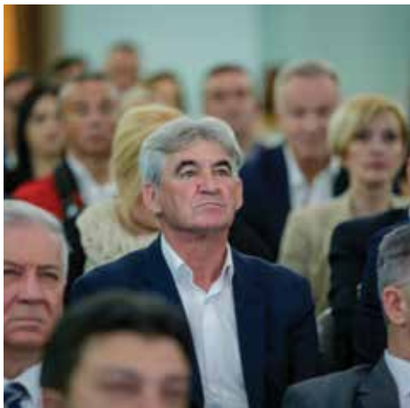
Veliki broj uglednih zvanica

Reisu-l-ulema Husein efendija Kavazović se zahvalio za uručeno priznanje kazavši da je velika čast biti izabran među stotinama građana Staroga Grada. "Stari Grad je utisnuo svoj pečat