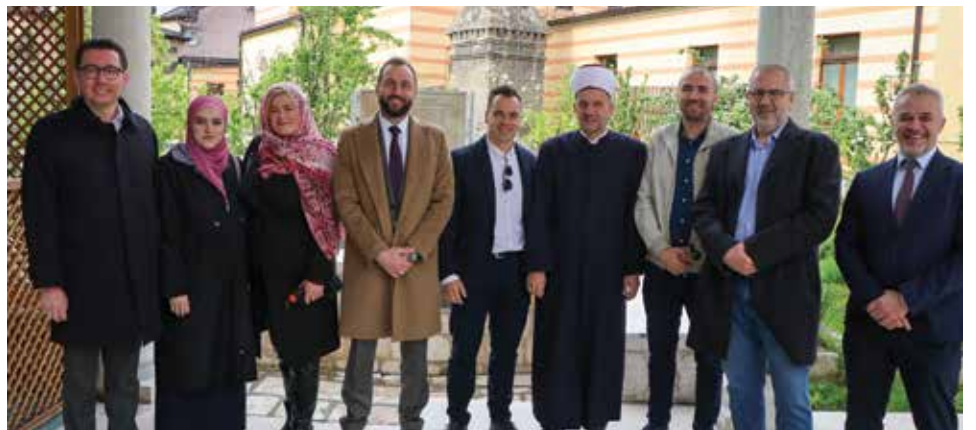
Vijećnici na obilježavanju 02. maja, Dana Općine