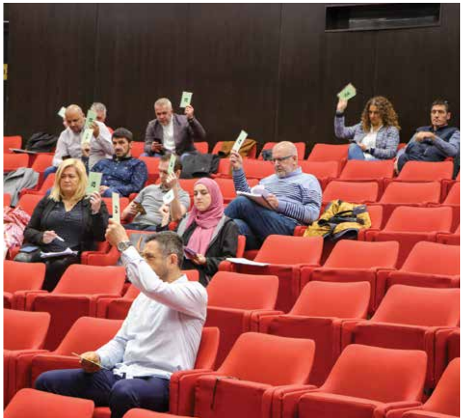
Predočene informacije o aktivnostima vezanim za revitalizaciju Bazena Bentbaša