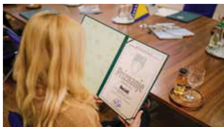
Priznanja za 14 studenata

Studenti poručili: Ne namjeravamo otići iz BiH!