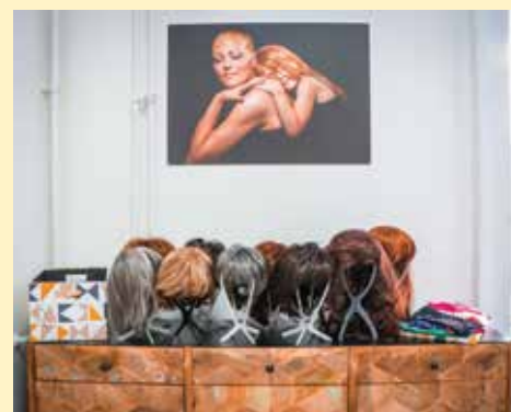
Pomoć i podrška za sve žene

"Nakon 20 godina naših aktivnosti, uticaja na društvo i promjena koje smo donijeli, spašenih života kroz preglede koje smo omogućili, danas se se ostvaruje naš san i otvara Think Pink Centar za koji moram istaći da ne bi postojao bez dobre volje Općine Stari Grad Sarajevo na čelu sa načelnikom Hadžibajrićem i cijelim njegovim timom koji su