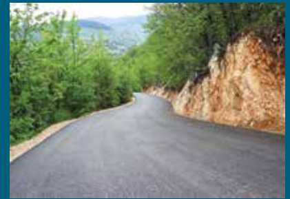
Saniranu 750 metara puta

Naselje Borije nalazi se na istočnoj strani Sarajeva u općini Stari Grad, na nadmorskoj visini od 1.000 metara i pripada mjesnoj zajednici Moščanica. Suprotno uobičajenom mišljenju javnosti da su Borije samo izletišta zbog njihove udaljenosti od centra grada i bogate flore i faune koja se razvila, u ovom naselju nalazi se oko 60 domaćinstava koji na Borijama žive i mahom se bave poljoprivredom i stočarstvom. Naselje je nastalo prije rata i brojalo je svega nekoliko kuća, a poslije rata je doživjelo nagli razvoj i naseljavanje. Ipak, infrastruktura naselja nije bila na zadovoljavajućem nivou, a prvi makadamski put od Obhodže do Borija prokopan je davne 2014. godine, u dužini od 900 metara. Tada je na Borijama sagrađeno i spomen obilježje za 172 šehida i poginula borca 2. brdske brigade 1. korpusa ARBiH koji su bili raspoređeni u tranšejama duž Borija.