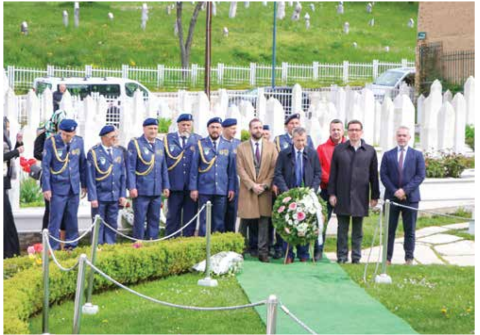
Na Kovačima odata počast šehidima i prvom predsjedniku Aliji Izetbegoviću

Sjednici su prisustvovali predstavnici drugih institucija, boračkih i građanskih udruženja, posebni gosti su bile delegacije pobratimskih općina i gradova iz regiona i Republike Turske: Opština Karpoš Skopje, Grad Makarska, Grad Kragujevac, Općina Selçuklu Konya, Općina Karşıyaka Izmir, Općina Ulcinj, Općina Osmangazi Bursa i Opština Ohrid.