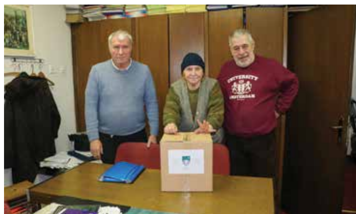
Srpsko građansko vijeće KS dobilo pomoć