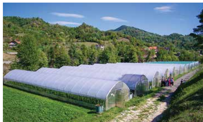
Projekat Merhameta - proizvodnja povrća