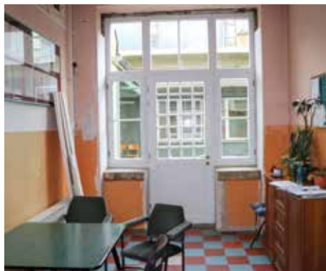
Nova stolarija na objektu

Projekat zajedno realizuju Općina Stari Grad Sarajevo i Ministarstvo za odgoj i obrazovanje KS.