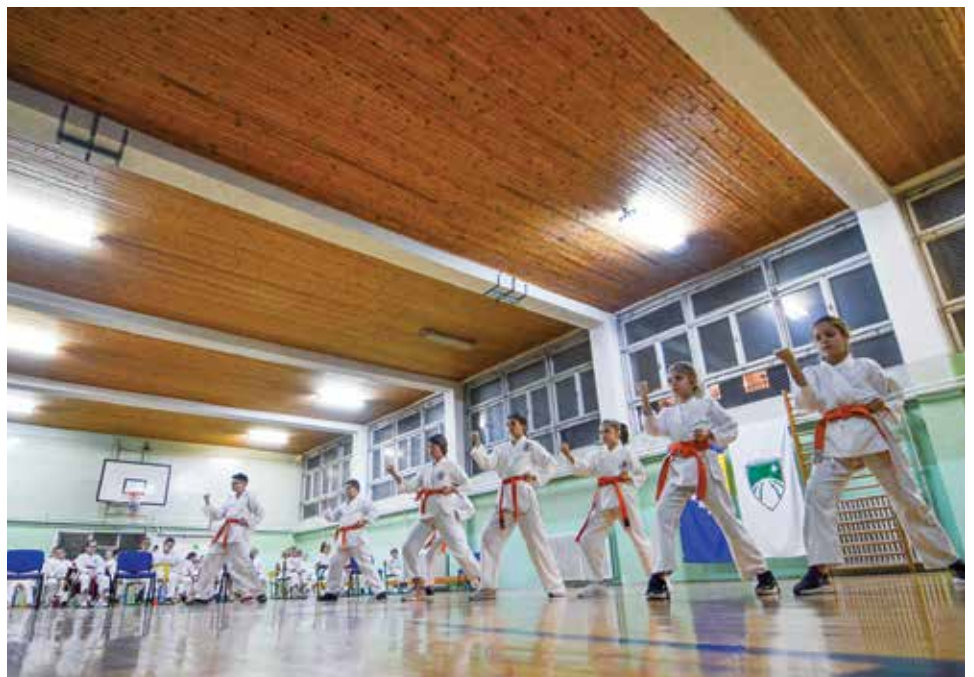
KK "Bašćaršija" jedan od najuspješnijih klubova u zemlji

njihov rad u iznosu od 10.000 KM. „Karate klub ‘Bašćaršija’ okuplja desetine djece, što je pravi uspjeh. Djeca vrijedno treniraju, korisno i zdravo provode svoje