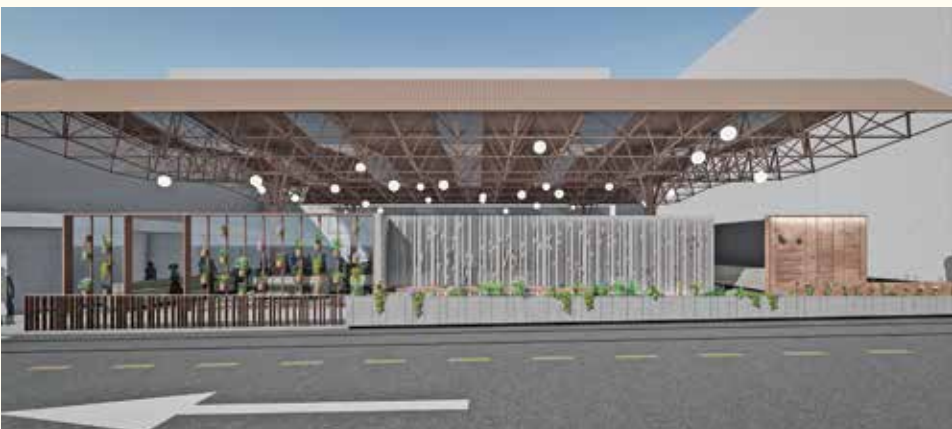
Spomen obilježje na Markalama