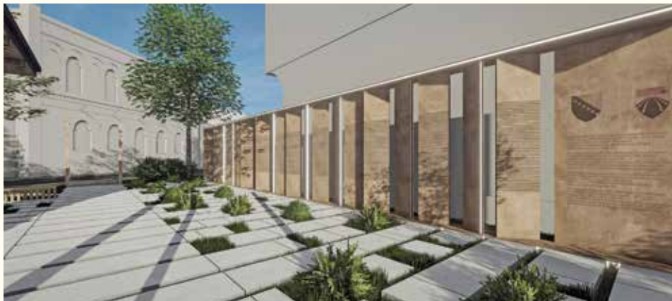
Spomen park Putevi vječnosti

U Stari Grad se dolazi da bi se uživalo i njegovim ljepotama, historiji, gastronomiji, a broj posjeta iz godine u godinu raste. Kako raste broj posjeta, tako rastu i potrebe posjetilaca, ali i građana, a među najvećim potrebama su parking prostori. Općina Stari Grad i načelnik Hadžibajrić misle i na to. Pored prve javne podzemne garaže koja je sagrađena prije tri godine u samom sru Starog Gra-