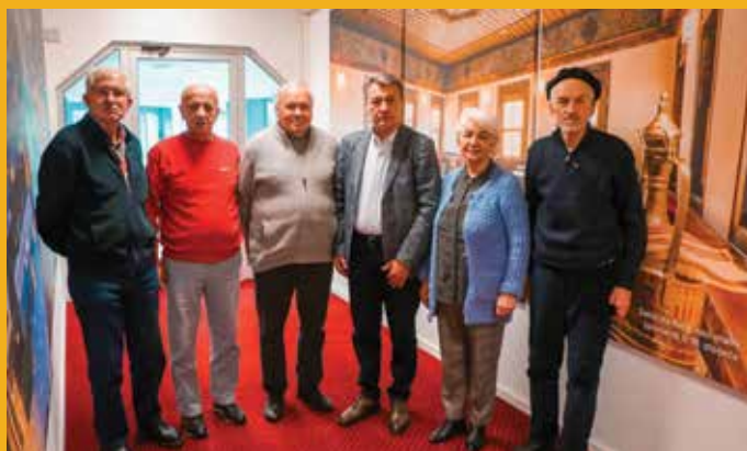
Podrška penzionerima koji primaju minimalne penzije

Centar za promociju i unapređenje zdravlja Općine Stari Grad, kojim upravlja Udruženje Generacija, predstavlja značajnu podršku za građane Kantona Sarajevo već šest godina. Ovaj Centar postao je omiljeno okupljalište osoba treće životne dobi, nudeći im brojne aktivnosti i usluge koje pomažu unaprijediti njihovo zdravlje i kvalitet života. Ove godine, Centar je dobio redovni godišnji grant od 20.000 KM za projekte i aktivnosti. Načelnik Hadžibajrić je istakao da