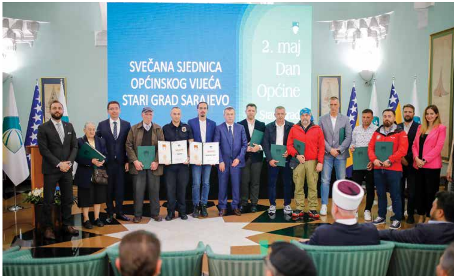
Priznanja i zahvalnice dodijeljene najistaknutijim pojedincima i kolektivima