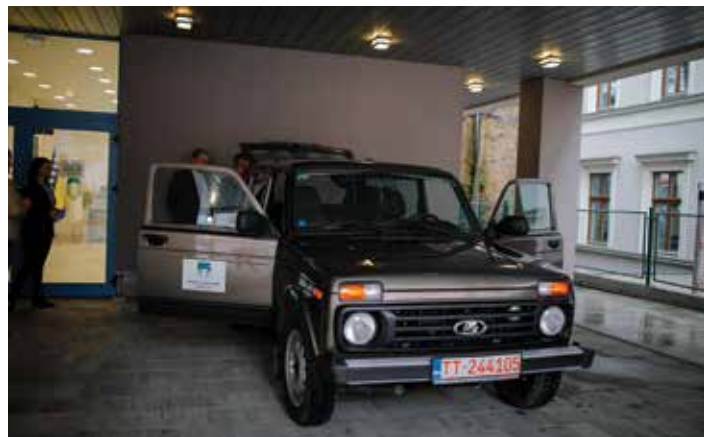
Donirano vozilo Lada Niva