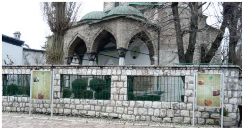
Ispred Baščaršijske džamije su dva panoa

Na panou ispred Ekonomskog fakulteta je 47 fotografija sa kratkim opisima svih sadržaja panoa iz prve i druge generacije, a takav je i pano kod Sebilja. Jedino po čemu se ova dva panoa razlikuju su dijelovi koji se odnose na kulturno-historijske sadržaje. Također, ova dva panoa su većih dimenzija i oni su centralni panoi. Svi panoi su dvostrani sa istovjetnim sadržajima sa obje strane, osim dva panoa ispred Baščaršijske džamije i jednog ispred Katedrale koji imaju različite sadržaje.