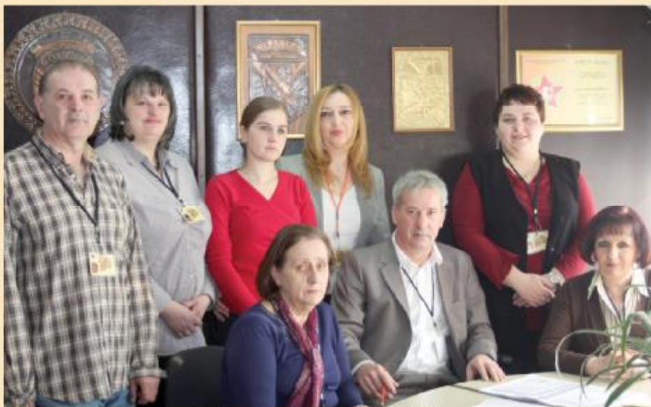
Pomoćnik sa uposlenicima Službe za boračko-invalidsku zaštitu

Za ove namjene ranijih godina izdvajala su se veća novčana sredstva jer je i budžet bio veći, ali svi moramo shvatiti da je prioritet menadžmenta svake lokalne smouprave prije svega infrastruktura i komunalije, a onda sve ostalo. U budžetu za 2012. godinu za boračku populaciju bilo je izdvojeno