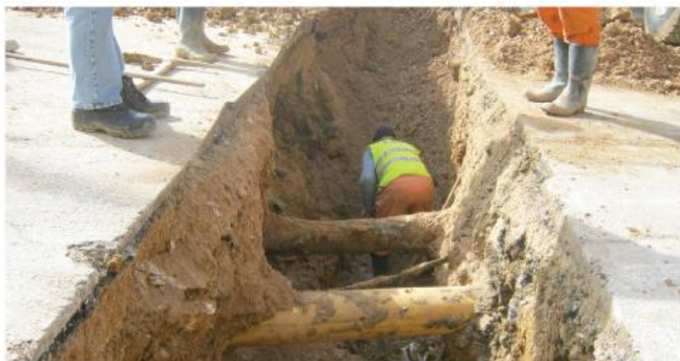
Četrdeset metara nove kanalizacije

U martu je počeo projekat postavljanja nove oborinske kanalizacije na području Mjesne zajednice Hrid - Jarčedoli na saobraćajnici Iza Gaja. Na saobraćajnici se izljevala voda što je predstavljalo opasnost za građane, posebno zimi kada se voda ledila. Do izlivanja vode dolazilo je zbog začepjenja starih kanalizacionih cijevi, zbog čega je Općina Stari Grad zajedno sa Direkcijom za puteve i Fondom za zaštitu okoliša FBiH pristupila realizaciji projekta