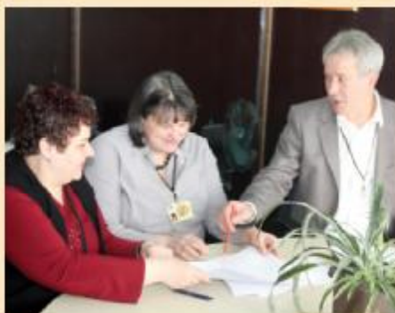
Jedan od redovnih sastanaka

oko 335.000 KM. Za ovu godinu planirana su sredstva u iznosu od 386.500 KM, plus 70.000 KM za nabavku plastenika i sadnog materijala, čija dodjela ide preko Službe za privredu. Većina ovog materijala dodjeljuje se pripadnicima boračke populacije. Pored navedenih projekata izdvajaju se sredstva i za jednokratne i materijalne pomoći. Ovaj vid pomoći također nije u nadležnosti Općine, to je obaveza Ministarstva za boračka pitanja Kantona Sarajevo, ali se ostavlja prostor i Općini da u skladu sa mogućnostima izdvoji sredstva i za te namjene.