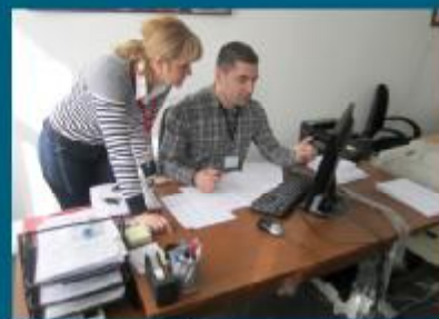
Radna atmosfera u Sektoru za lokalni razvoj

"Osnovna svrha ove baze podataka je sistematična evidencija, a ujedno baza će služiti kao izvor informacija za sve one koji saraduju sa organizacijama civilnog društva," pojasnili su iz Sektora.