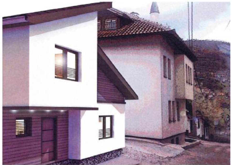
Prvi ovakav objekat u Starom Gradu

A gencija za arhitekturu i dizajn "Archigreen" iz Sarajeva uputila je Općini Stari Grad pismo namjere za realizaciju projekta "Naša pasivna kuća", koji bi bio prvi pasivni objekat u Bosni i Hercegovini izgrađen u saradnji državnih institucija i izvođača pasivnih kuća. Pasivne kuće svojom vrhunskom toplotnom izolacijom i korištenjem energije iz obnovljivih izvora potrošnju energije smanjuju i do 10 puta, a istovremeno osiguravaju maksimalnu udobnost. Realizacija projekta gradnje ovakvih kuća, početak će upravo u Starom Gradu. Ovakvi primjeri izgrađenih pasivnih kuća govore sami za sebe i već se primjenjuju u Austriji, Hrvatskoj, Sloveniji i drugim zemljama.