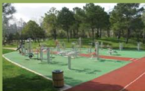
Prostor za vježbanje

Uprave za šumarstvo KS i Udruženja inženjera i tehničara šumarstva FBiH, iste godine su posjetili predviđeni lokalitet za Park šuma na Grdonju, nakon čega je u Generalnoj direkciji "Turskih šuma" u Ankari urađen idejni projekat.