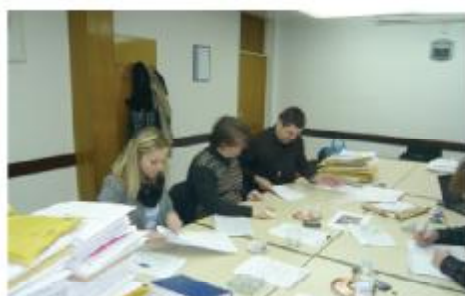
Komisija za evaluaciju projekata