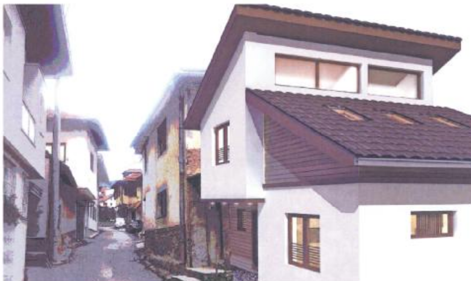
Budući izgled pasivne kuće

"Pasivna kuća je niskoenergetski objekat koji osobinama ugrađenog materijala i načinom izbora grijanja i hlađenja pruža ugodan unutrašnji prostor i udoban boravak tokom cijele godine (zimi je prosječna temperatura 20 stepeni, a ljeti 26 stepeni), uz vrlo malu potrošnju energije. Prema energetske razredu, kuća se nalazi u grupi A ili B, a to znači da je potrošnja toplotne energije (i rashladne energije tokom ljeta) 15-20 Kvh/m 2 . Primjera radi, cijena potrošnje 1Kvh je oko 0,15KM, što znači da bi ova kuća trošila godišnje oko 2,50KM po m 2 . Ukupna površina kuće iznosi oko 103m 2 ," kazao je Tarik Poturović, šef Sektora za lokalni razvoj Općine Stari Grad, zaduženog za realizaciju projekta.