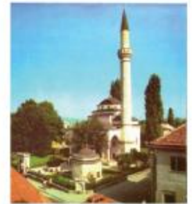
20.000 KM obnova Ferhat-pašine džamije

Općinsko vijeće Stari Grad usvojilo je na četvrtoj sjednici Odluku o izmjenama i dopunama Statuta Općine Stari Grad Sarajevo. Ovim izmjenama omogućen je izbor i drugog zamjenika predsjedavajućeg Općinskog vijeća, te definisano trajanje njihovih mandata i odredbe za razrješenje sa dužnosti koje će se vršiti 2/3 većinom glasova. Sekretara Općinskog vijeća bira Vijeće, ali u skladu sa Zakonom o državnoj službi FBiH i putem Agencije za državnu službu FBiH. Također, urađeno je usklađivanje Statuta sa odredbama Zakona o izboru, prestanku mandata, opozivu i zamjeni Načelnika Općina u FBiH, kojim je utvrđeno ko zamjenjuje Načelnika Općine u slučaju odsustva ili spriječenosti. U nadležnosti Općinskog vijeća uveden je i izbor delegacije u Gradsko vijeće, što je Vijeće i do sada radilo, ali nije bilo definisano Statutom. Izvršeno je usklađivanje odredaba Statuta sa Zakonom o principima lokalne samouprave u FBiH u smislu nadležnosti za utvrđivanje organizacije jedinstvenog organa uprave i donošenja Pravilnika o unutrašnjoj organizaciji. Prijedlog Budžeta Općine Stari Grad Sarajevo za 2013. godinu, u iznosu od 19 212,000 KM, Općinsko vijeće usvojilo je sa 25 glasova za, jednim protiv i dva suzdržana. Usvajajući prijedloga budžeta protudilo je usvajanje dva zaključka: