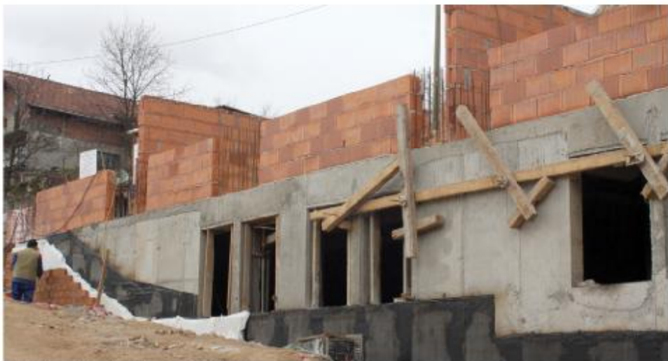
U toku zidanje prizemnog dijela

Izgradnja zgrade namijenjene za smještaj interno raseljenih porodica na lokalitetu Baruthana-Gazin Han odvija se planiranom dinamikom. "Završeno je betoniranje suterena prve etaže vertikalne konstrukcije i izgradnja jednog dijela potpornih zidova, a u toku je zidanje prizemnog dijela. Pored toga, postavlja se hidroizolacija na zidove suterena, a uporedo se iz-