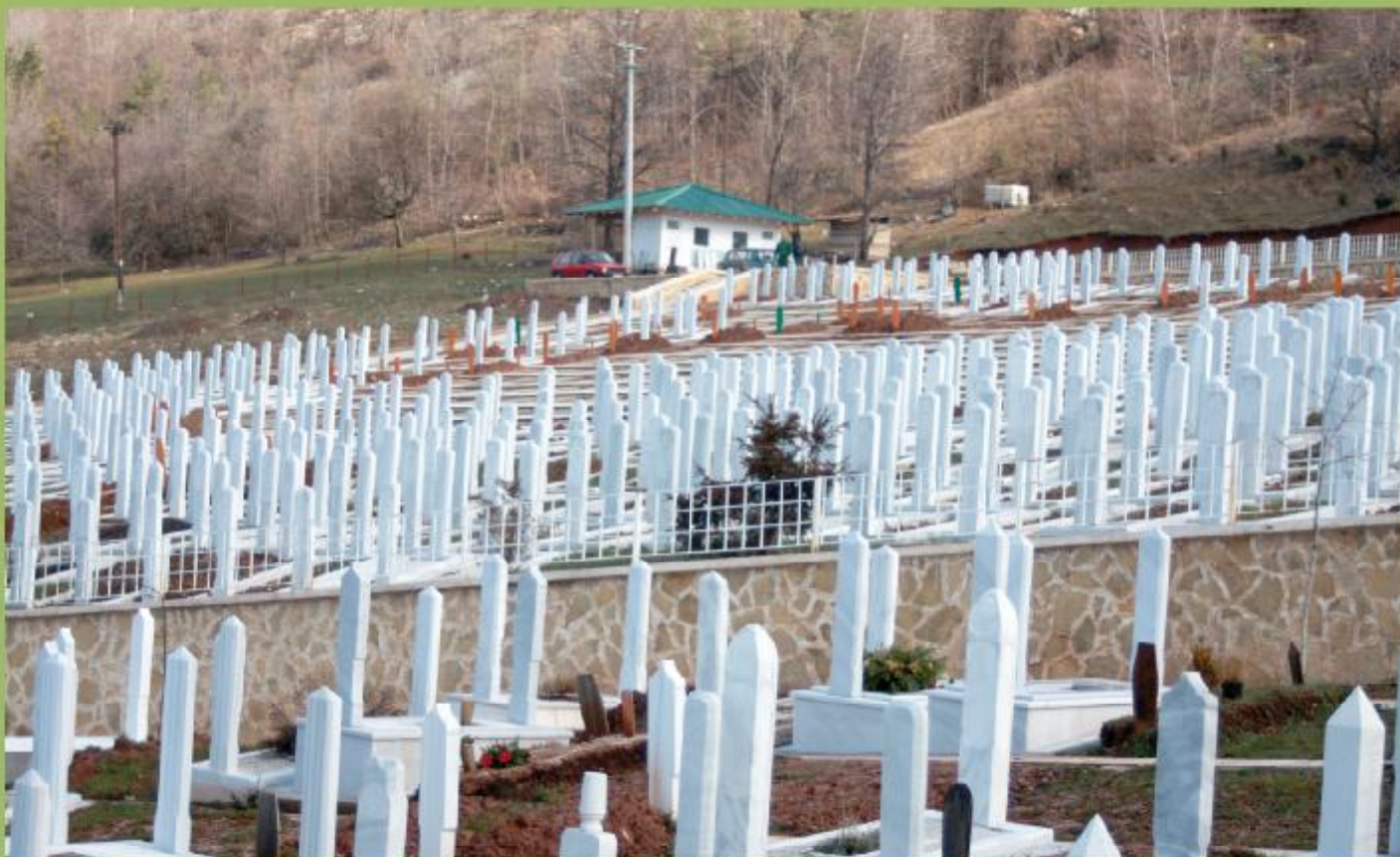
Bakijsko mezarje u Faletićima

Jedileri u Bakije 6 koje se zadržalo do danas.