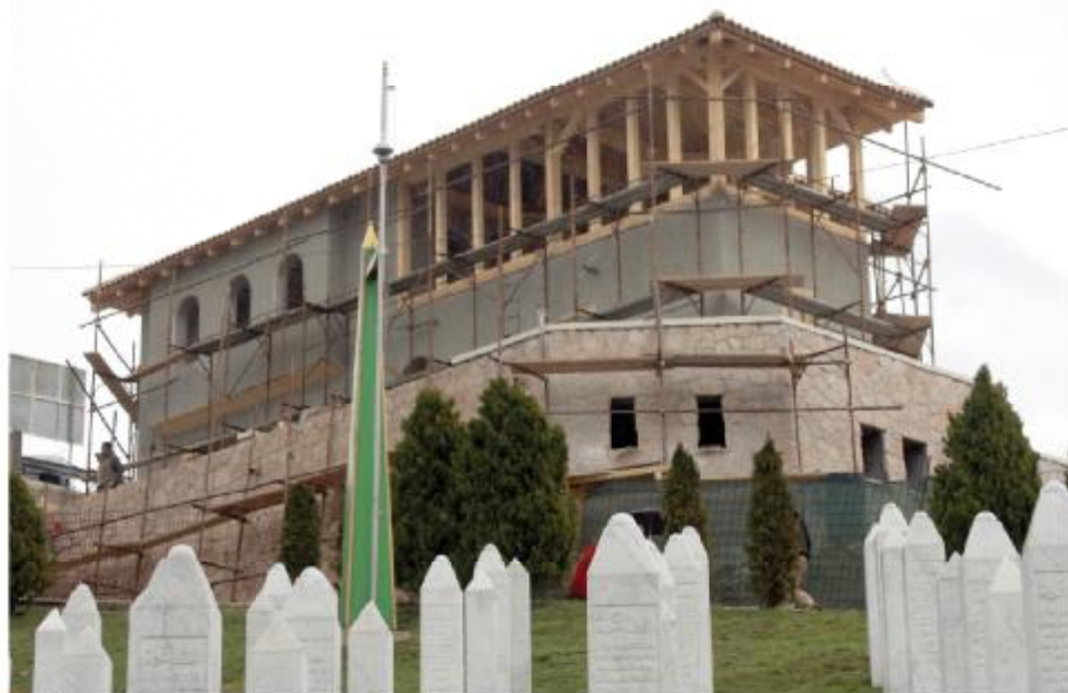
U toku radovi na Mevlevijskoj tekiji

M evlevijska tekija koja se gradi na Kovačima srećano će biti otvorena 06. aprila, a otvorenju će prisustvovati i ministar vanjskih poslova Republike Turske, Ahmed Dautoglu. Rečeno je ovo prilikom zvanične posjete delegacije Općine Seldžuk – Konya iz Turske Općini Stari Grad (februar, 2013. godine), kada je dogovoren i zvanični naziv tekije. “Općine Stari Grad i Seldžuk su pobratimljene općine i iz te saradnje izrodila se ideja gradnje tekije na Kovačima koju finansira Seldžuk. Na posljednjem sastanku smo potpisali i Sporazum kojim smo definisali naziv tekije i ona će se zvati ‘Balkanski mevlevijsko-istraživački centar’,” rekao