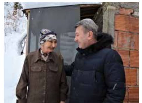
Jednokratna pomoć do 800 KM

Od sljedeće godine jednokratna finansijska pomoć licima u stanju potrebe iznositi će 800 KM u toku jedne kalendarske godine, zahtjevi će se podnosti na početku godine i sredstva će se isplaćivati odmah po obradi zahtjeva i utvrđivanju opravdanosti.