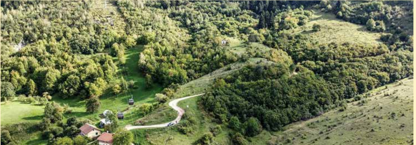
Apelova cesta - veza između Trebevića i gradske jezgre