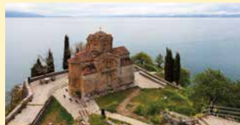
Crkva sv. Jovana Bogoslova u Ohridu - Simbol Sjeverne Makedonije

Prostor današnjeg Ohrida, uz obalu istoimenog jezera kojeg dijele Sjeverna Makedonija i Albanija, naseljen je hiljadama godina. Iz tog razloga ovaj grad ima izuzetno bogato kulturno-historijsko naslijeđe i danas važi za jedno od najpoznatijih turističkih destinacija u ovoj balkanskoj zemlji. U Ohridu živi blizu 60.000 stanovnika različitih nacionalnosti i religija. Pored Makedonaca, u ovom gradu žive i Albanci, Turci, Srbi, Vlasi, Romi i drugi.