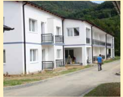
Za majke će biti sve besplatno

pomogli. Svjesni smo da će za budući boravak majki biti potrebna psihička priprema jer se one teško odvajaju od svojih ognjišta, ali mi smo spremni i na to,” izjavio je Okanović. “Za majke će sve u Domu biti besplatno i prvo ćemo njih smjestiti. Ostali zainteresovani će moći dobiti smještaj, ali prema komercijalnim cijenama,” dodao je. Ono što je majkama najvažnije u ovom projektu je da se Dom za majke Srebrenice nalazi na svega nekoliko minuta od Memorijalnog centra Srebrenica i mezarja, jer inače one ne bi pristale na dolazak.