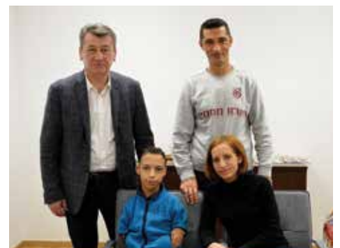
Pomoć za liječenje u zemlji i inostranstvu