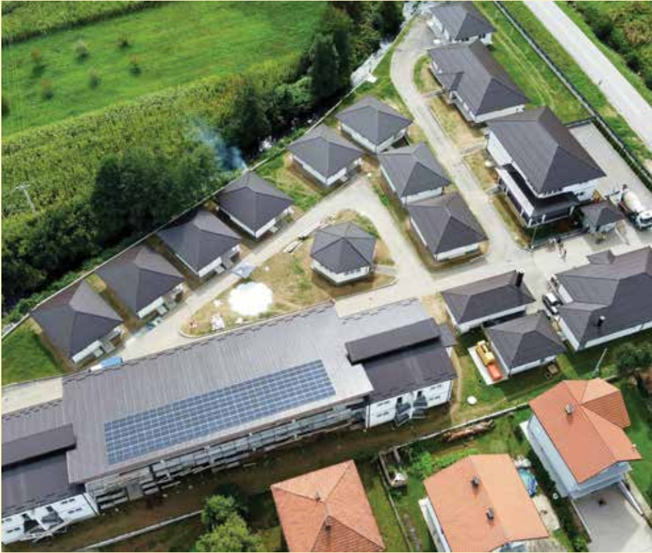
Dom za majke Srebrenice i internat