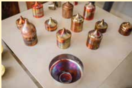
Proizvodi od bakra i mesinga