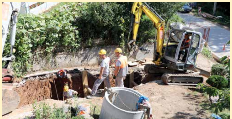
Nova mreža na Hladivodama