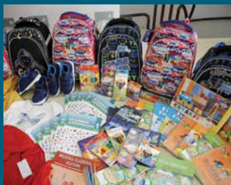
"Od glave do pete"