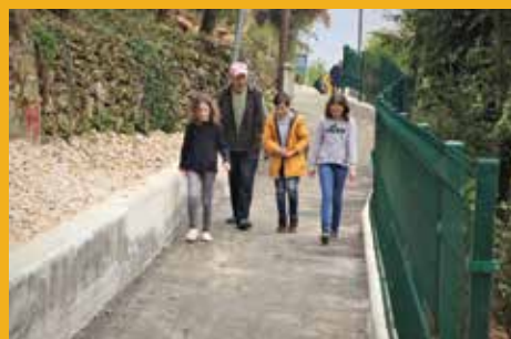
Siguran put do škole