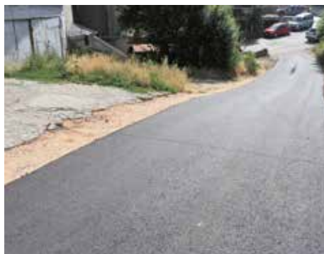
Dio ulice Bistrik

program rada. Sanirana su i dva kraka ulice Džeka. Prvi krak od broja 11 do ambulante koji je bio u veoma lošem stanju asfaltiran je u dužini od oko 25 metara. Također, saniran je i još jedan krak iste ulice Džeka, od broja 13 do broja 17, u dužini od 36 metara. Za sve tri investicije iz budžeta Općine izdvojeno je oko 30.000 KM.