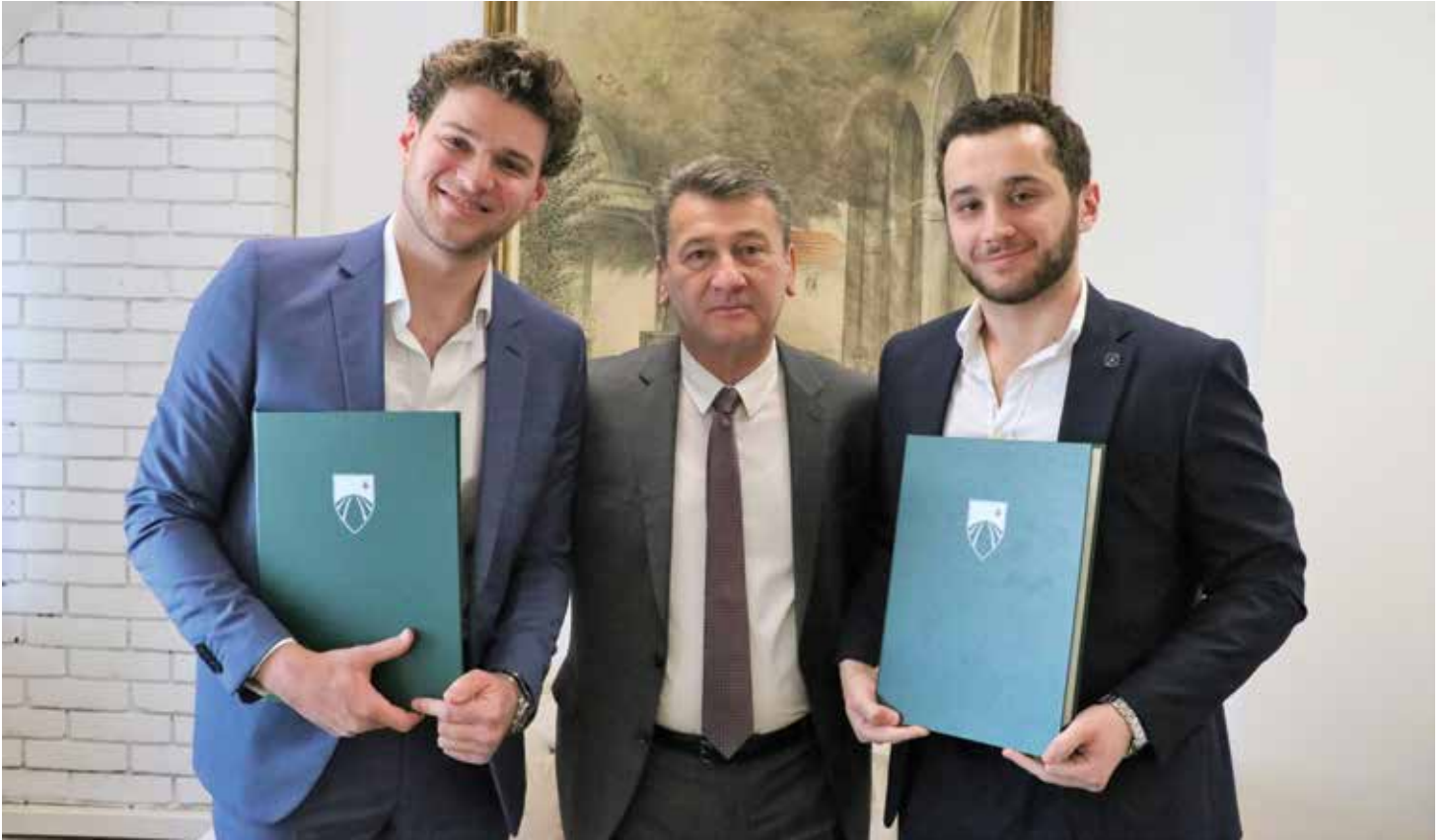
Povećanjem stipendija omogućiti mladima bolje uslove

posveti djeci sa hroničnim oboljenjima kao što su karcinom, šećerne bolesti, leukemija, celijakija, epilepsija i drugo. Porodice sa djecom sa hroničnim oboljenjima imaju velike godišnje izdatke, te će se u Općini Stari Grad od sljedeće godine uvesti praksa da ove porodice primaju mjesečnu naknadu u iznosu od 150 KM čime će im se barem malo olakšati i pomoći da se lakše nose sa životnim nedaćama. U budžetu za 2023. godinu će se za ove namjene planirati iznos od 180.000 KM na osnovu podataka o broju bolesne djece, a sredstva će se uvećavati ili umanjivati u skladu sa potrebama i zahtjevima koje roditelji budu podnosili.