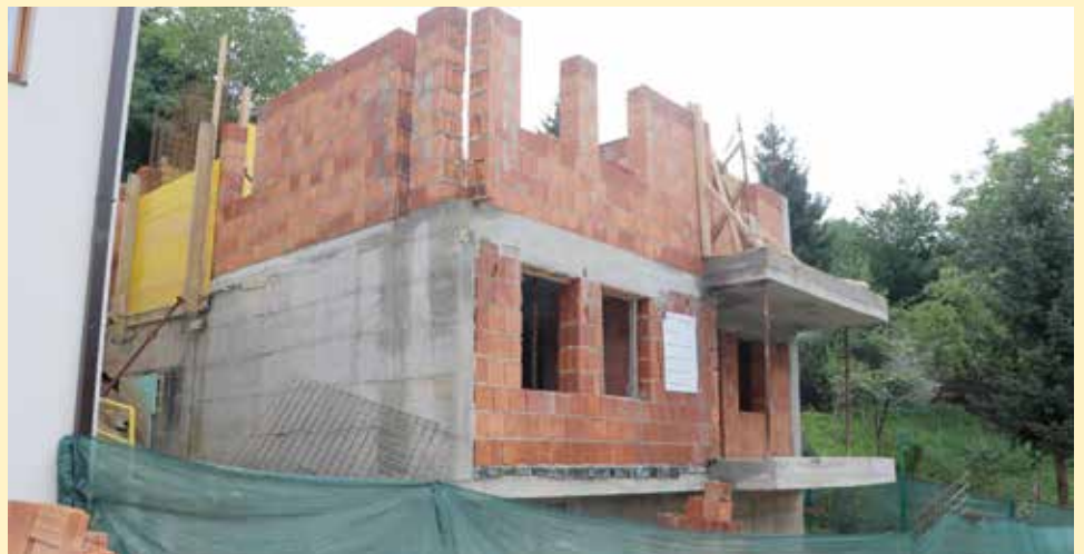
Socijalna zgrada za sedam porodica

Pomoć u rješavanju svojih problema zatražili su od lokalne zajednice i općinskog načelnika mr. Ibrahima Hadžibajrića, no kako se radilo o značajnoj investiciji, prvo su se morala osigurati neophodna sredstva u iznosu od 600.000 KM. Projekat izgradnje separatne kanalizacione mreže u dijelovima ulica Baruthana i Hladivode, tačnije na dionici od Baruthana br. 71 do Hladivode br. 70, obuhvata polaganje oko 380 metara separatne kanalizacione mreže, odnosno polaganje oko 380 m cijevi za fekalni kanal i 380 metara za oborinsku odvodnju. Sva okolna domaćinstva bit će priključena na novu mrežu.