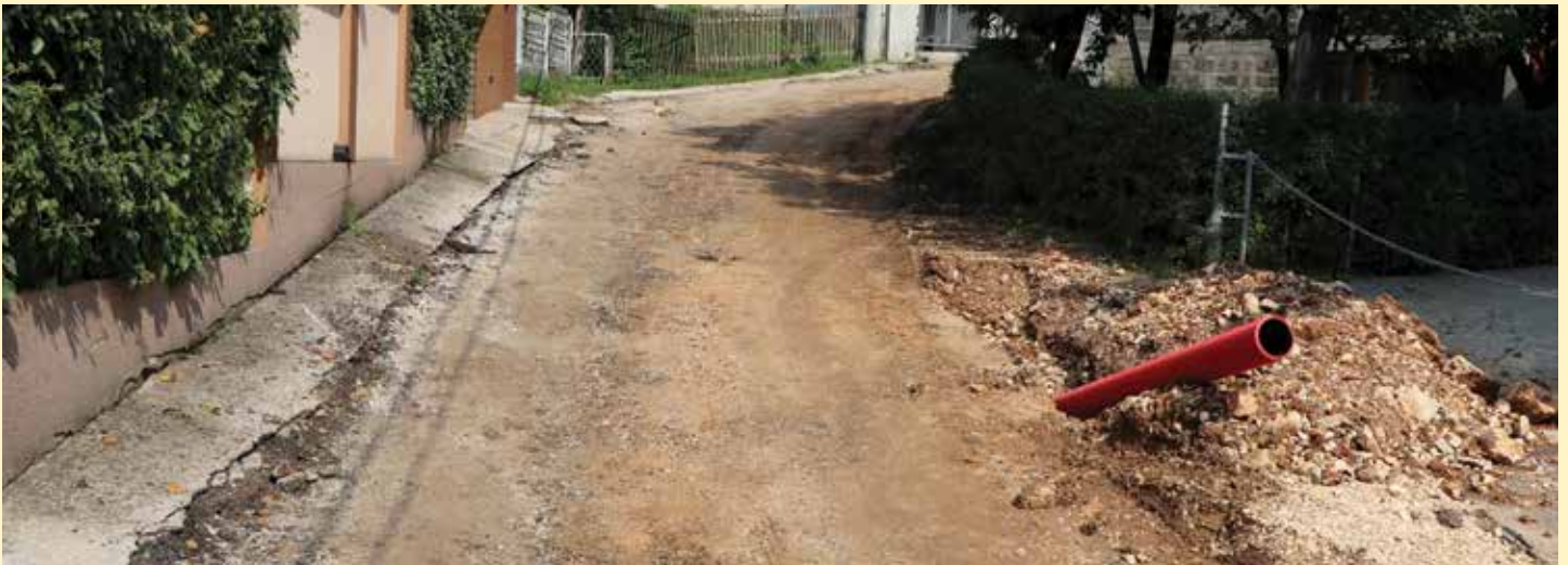
Sanacija 900 metara ulice Streljačka