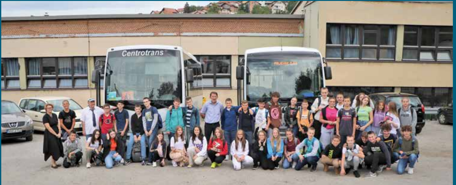
Školski prevoz do četiri osnovne škole u Starom Gradu

ugostio je 08. septembra, 2022. godine u Općini i uručio im pakete sa odjećom i obućom, dok su ruksake i školski pribor dobili prije početka školske godine.