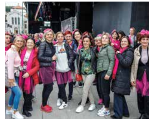
Veliki broj učesnika šetnje