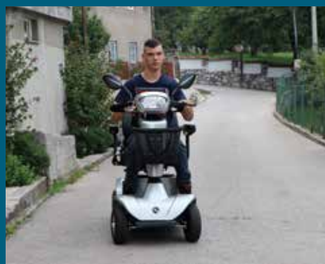
Električni skuter za Bećira

Osiguran je redovan školski prevoz za 285 učenika osnovnih škola „Vrhbosna“, „Mula Mustafa Bašeskija“, „Šejh Muhamed efendija Hadžijamaković“ i „Saburina“ tokom školske 2022/2023. godine. Već devet godina Općina Stari Grad Sarajevo, u saradnji sa nadležnim kantonalnim ministarstvima i autoprevoznikom Centrotrans d.d. Sarajevo omogućava starogradskim osnovcima siguran, pouzdan i tačan dolazak do škole i povratak kući. Djecu od kuće do škole i nazad voze savremeni i opremljeni mini autobusi prilagođeni vožnji u padinskim dijelovima. Za besplatan školski prevoz učenika u Starom Gradu se na godišnjem nivou izdvaja 350.000 KM. Općina Stari Grad je provela sve potrebne procedure kako bi se osigurao prevoz učenicima, dok će sredstva u refundirati Ministarstvo saobraćaja Kantona Sarajevo.