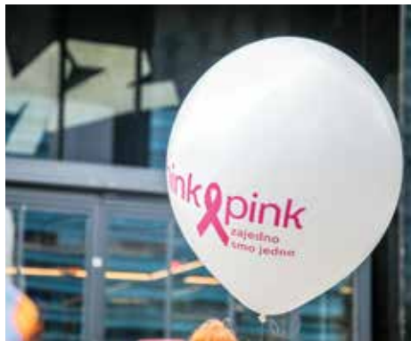
Podrška Općine Stari Grad Sarajevo