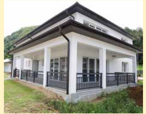
Potpuno opremljeni apartmani

“Cijeli kompleks prilagođen je potrebama majki, a sve kako bi im pružili najbolje moguće uslove za njihov boravak. Emmaus vodi svakodnevnu brigu o njima, a naš primarni cilj je da im damo maksimum do kraja njihovog života. Nemoguće je njima nadoknaditi ono što su izgubile, ali mislim da smo kroz program „Ljubav za majke Srebrenice“ puno