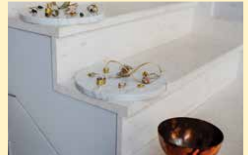
Nakit na drugačiji način