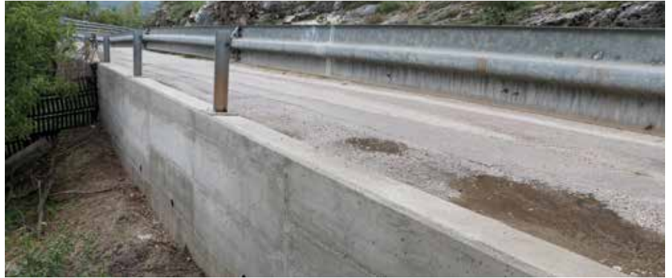
Potporni zid na Boguševcu

Izgrađen je armirano-betonski potporni zid, dužine 12 metara i prosječne visine oko 1,8 metar. S obzirom na to da je lokacija veoma nepristupačna većina radova se izvela ručno.