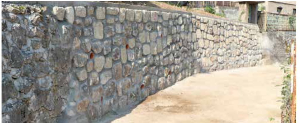
Novi zid na Trčivodama dužine 12m

Na Boguševcu je izgrađen novi zid dužine 13 metara i prosječne visine oko 2,3 metra.