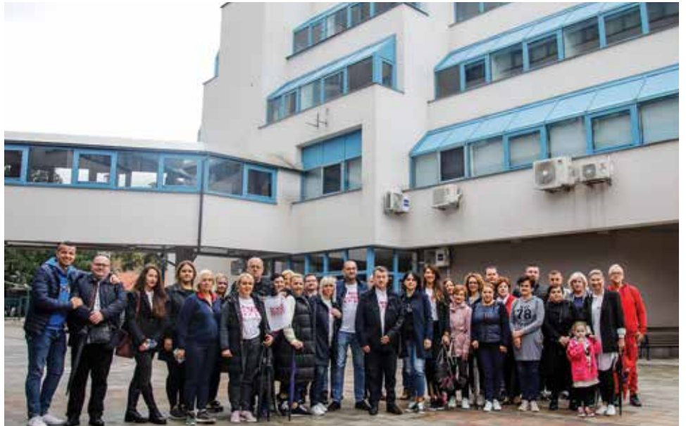
Tim Općina Stari Grad u šetnji za ozdravljenje

I ove godine Općina Stari Grad Sarajevo bila je jedina institucija koja je na