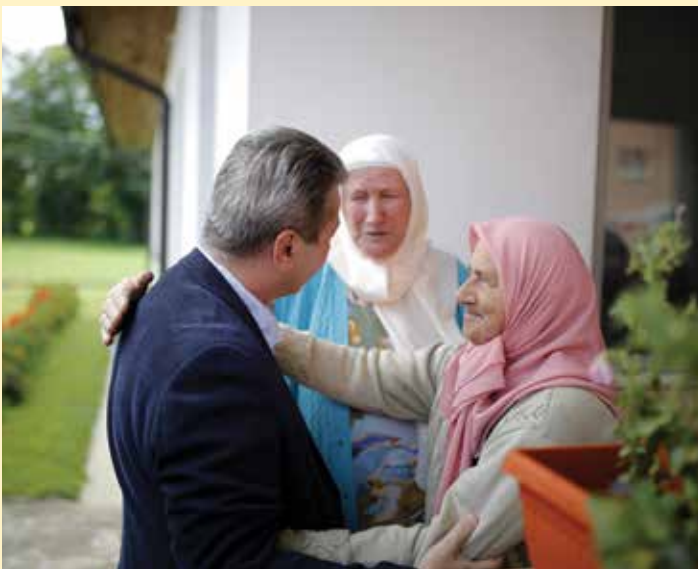
Majke će već ove zime biti smještene u Domu

pomogli. Svjesni smo da će za budući boravak majki biti potrebna psihička priprema jer se one teško odvajaju od svojih ognjišta, ali mi smo spremni i na to,” izjavio je Okanović. “Za majke će sve u Domu biti besplatno i prvo ćemo njih smjestiti. Ostali zainteresovani će moći dobiti smještaj, ali prema komercijalnim cijenama,” dodao je. Ono što je majkama najvažnije u ovom projektu je da se Dom za majke Srebrenice nalazi na svega nekoliko minuta od Memorijalnog centra Srebrenica i mezarja, jer inače one ne bi pristale na dolazak.