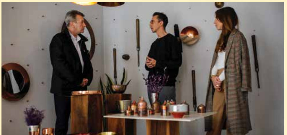
Oživjeli tradiciju na moderan način

ute tradicijom, “ ispričali su brat i sestra Lisica.