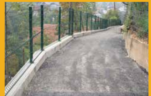
Nova pješačka dionica

„Ranije je put bio toliko loš i uzak, da se nisu mogle uporedo kretati dvije osobe. Ljudi su padali, lomili se. Sada kad pogledam djecu koja ovuda idu u školu, trče, voze bicikle i rolaju se, ja ne mogu da vjerujem da smo ovo doživjeli. Ne znam na koji način bih se zahvalio našoj lokalnoj zajednici za ovo što smo dobili. Svima se zahvaljujem, ali najviše našem načelniku Hadžibajriću, koji je obećao da će ovo uraditi i ispunio nam obećanje,“ ispričao je Tandir.