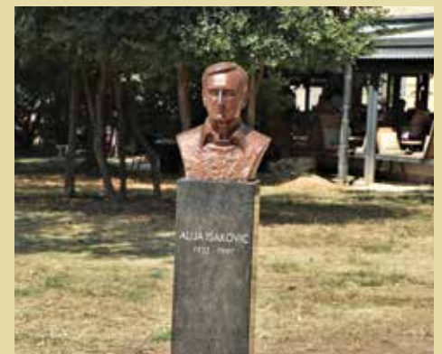
Postavljena bista Alije Isakovića

U znak poštovanja prema kulturi, tradiciji i bogatoj bosanskohercegovačkoj književnoj historiji, na inicijativu Društva pisaca BiH, na Trgu je postavljena bista književnika Alije Isakovića jer se ove godine navršava 90 godina od rođenja ovog velikog bosanskohercegovačkog pisca, kao i 50 godina od izdavanja njegovog "Biserja" – prve antologije bošnjačke književnosti.