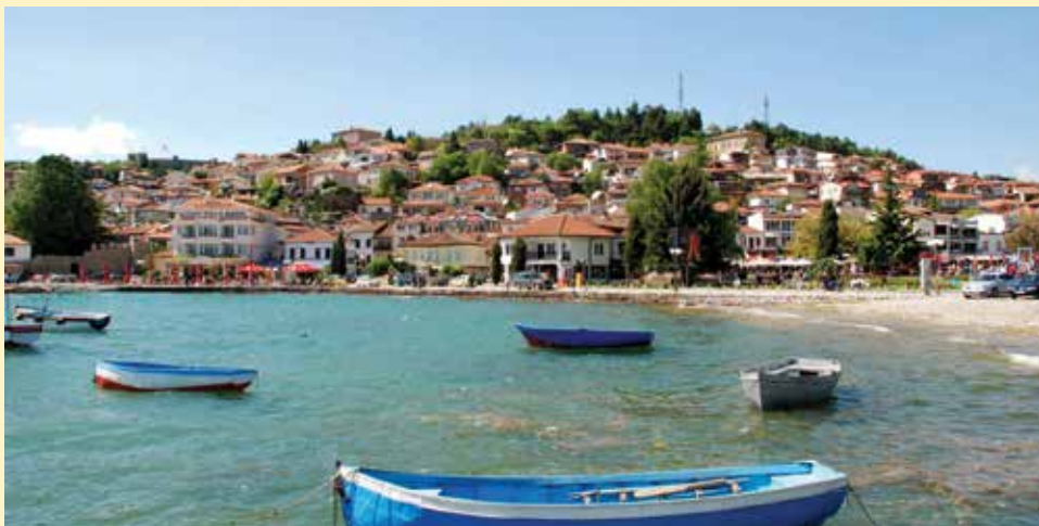
Ohrid je naseljen hiljadama godina unazad

U ovom broju biltena „Starogradski haberi“ predstaviti ćemo našu prijateljsku Opštinu Ohrid.