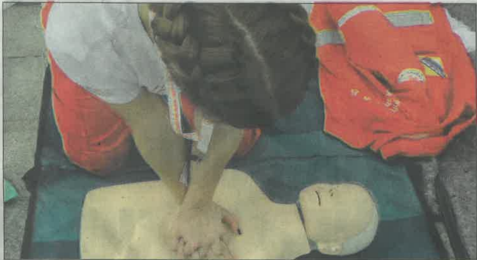
Osnove reanimacije treba znati što više građana

najčešći uzrok smrti i uglavnom se dešava izvan bolnice, Naidu Hota-Muminović ovaj prijedlog je prihvatljiv