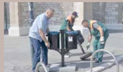
Duple korpe na više lokacija

Općina Stari Grad Sarajevo i ove godine izdvojila je oko 6.000 konvertibilnih maraka za projekat postavljanja 16 novih duplih korpi za otpad u najužem starogradskom jezgru.