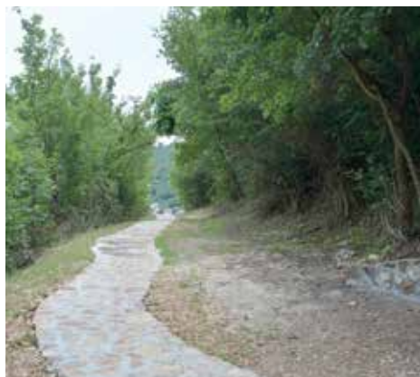
Gradani će uživati u šetnji

Na Vrelu života urađeno je produbljivanje korita i stabilizovana kamena konstrukcija, te sanacija i čišćenje fuga. Ovaj projekat izrađen je na osnovu naučno-istraživačkog rada o stanju i potrebnim radnjama za sanaciju puta od Bentbaše preko Babića bašče do Kozije ćuprije, a kojeg je uradio Međunarodni forum Bosna.