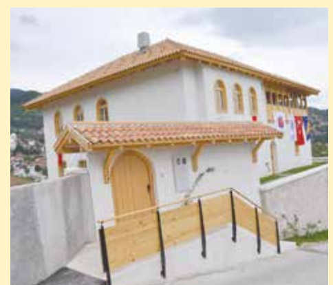
Izgradnju finansirala Općina Selcukly-Konya