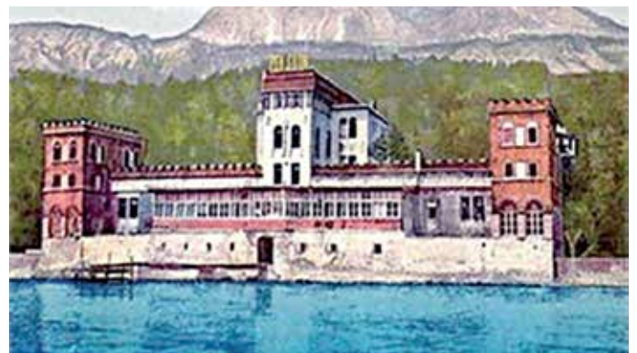
Zajednička raspodjela sredstava Centra i Starog Grada

Naime, Općine Centar i Stari Grad su 1958. godine činile jednu općinu – Općinu Centar, koja je kao takva postojala do 1977. godine kada je zakonom ponovo formirana Općina Stari Grad uz podjelu teritorije Općine Centar na dvije ad-