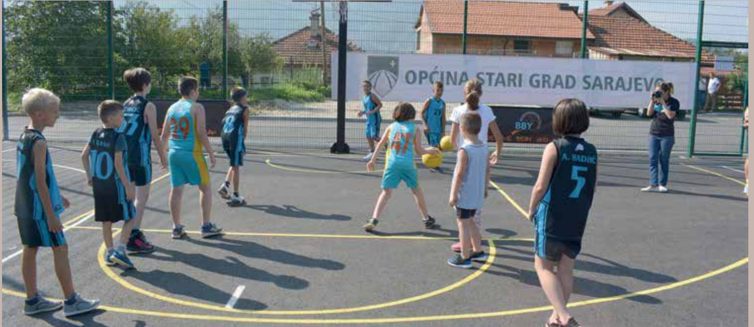
Odigrana revijalna utakmica KK BBY Stari Grad

Prvi zajednički projekat pobratimskih općina Stari Grad Sarajevo i Fatih iz Istanbula • Do kraja godine planirana izgradnja osam igrališta