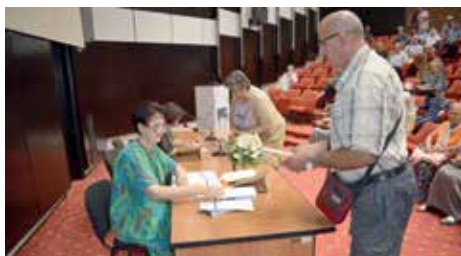
Treća podjela hedija u 2018. godini

o simboličnom poklonu: „Ova hedija je zaista hedija od srca, i dajemo je isključivo da određene kategorije našeg društva znaju da nisu zaboravljene, jer zahvaljujući njima mi danas živimo u slobodnoj Bosni i Hercegovini“, poručio je predsjedavajući Pušina.