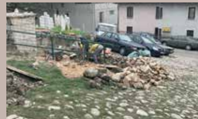
Okončanje radova u oktobru

U toku je sanacija kaldrmisanog stepeništa i platoa u blizini mezarja Alifakovac, a projekat finansira Općina sa oko 99.000 KM. „Nakon što je uređeno gradilište i postavljena neophodna signalizacija radi zaštite prolaska pješaka, počeli su radovi na mašinskom iskopu skidanja slojeva stare kaldrme“, kazali su u Službi za investicije, plan i analizu Općine Stari Grad, te dodali da će nova kaldrma biti postavljena duž cijelog stepeništa od oko 80 metara. Kaldrmisat će se i plato površine oko 200m2 uz prethodnu ugradnju kanizacionih cijevi, slivnika i linijskih rešetki. Izvođač ovog projekta je firma Klico trans d.o.o. Sarajevo, a rok za izvođenje je 45 dana.