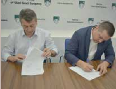
S potpisivanja ugovora

Direkcija za puteve KS za rehabilitaciju ulica u Starom Gradu izdvojila 550.000 KM