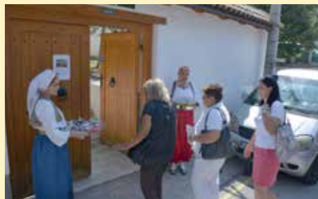
Veliki broj zainteresovanih

a zahvaljujući Općini Stari Grad restauriran je i ponovo otvoren 2014. godine. Kuća je izvanredan i reprezentativan primjer tradicionalne stambene gradnje ili arhitekture u Bosni od 16. do kraja 19. stoljeća. Oni koji dođu u ovaj objekat mogu vidjeti muški dio Saburine kuće tzv ‘selamluk’, dok ženski više ne postoji, mada se jedan njegov dio, tzv ‘haremluk’ još može vidjeti u etnografskoj zbirci Zemaljskog muzeja gdje je prenesen početkom 20. stoljeća.