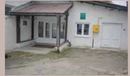
Ulaz u vrtić "Bajka"

Saradnja Općine Stari Grad sa pobratimskim općinama nastavlja se najavom još jednog projekta za najmlađe sugrađane.