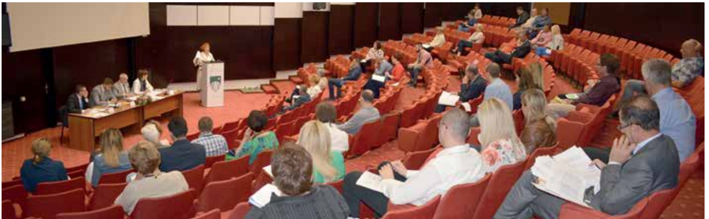
Vijećnici nezadovoljni čistoćom dijelova Starog Grada

Usvojeni su zaključci kojima: Općinsko vijeće izražava nezadovoljstvo održavanjem čistoće u općini Stari Grad; poziva Vladu Kantona Sarajevo i KJKP „Rad“ i KJKP „Park“ da poboljšaju čišćenje i održavanje javnih površina i puteva; poziva nadležne općinske službe i firme da se usaglase oko postavljanja kanti za otpad u mjesnim zajednicama Ferhadija i Baščaršija; da se isplata sredstava za čišćenje radi na kraju godine; poziva KJKP „Rad“ i KJKP „Park“ da se usaglase oko odvoza otpada iz parkova i javnih površina; da je neophodno povećati aktivnosti na edukaciji građana o važnosti održavanja čistoće javnih površina; te prijedlog obustave saobraćaja u ulicama užeg starogradskog jezgra.