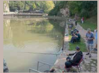
Ubačeno 600 komada pastrmke

U čast nekadašnjeg predsjednika skupštine Sportskog ribolovnog društva „Miljacka“ Nijaza Šabanovića na ovoj rijeci održan je memorijalni turnir u lovu pastrmke, a takmičare je posjetio i općinski načelnik Ibrahim Hadžibajrić. Po riječima člana Upravnog odbora društva Nedima Hodžića, ovo je prvo takmičenje u lovu na pastrmke na plovak u historiji Sarajeva, a na turnir se prijavilo 13 takmičara, uglavnom članova društva. Svake godine se vrši poribljavanje potočnom pastrmkom. Prije takmičenja je ubačeno 600 komada ove plemenite vrste. Pobjednik prvog ribarskog kupa „Nijaz Šabanović“ je Sead Katica sa ulovljena 3,4 kilograma ribe. Općina Stari Grad na razne načine pomaže SRD „Miljacka“ od njegovog osnivanja 2013. godine.