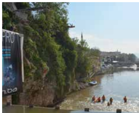
Skakalo se sa visine od 18 metara