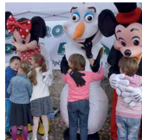
Mališani oduševljeni maskotama

Pored ruksaka za prvačiće, svaki razred dobio je paket školskog pribora, kao i korpe slatkiša kojima će se počastiti u školi. Zabavi na Bašćaršijskom trgu prisustvovali su prvačići šest osnovnih škola iz Starog Grada i Zavoda Mjedenica.