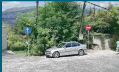
Za sigurniji saobraćaj

Saobraćajni znakovi postavljeni su u ulicama: Safvet-bega Bašagića, Pirin brijeg Arapova, Čeljigovići, Ćumurija, Nadmejdjan, Za beglukom, Terzibašina, Hadžiabdinica, Bistrik, Faletići do broja 21 i Saburina. Znakovi označavaju pješačke prelaze, izbočine na cesti, put prava prvenstva i zabranu zaustavljanja/parkiranja. Saobraćajna ogledala su postavljena u ulicama Mahmutovac i Kamenica, te u ulici Rogina na dijelu sa spojom ulice Hanin sokak i u ulici Brodac kod Vijećnice.