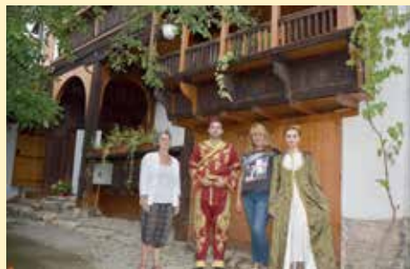
Turisti iz Beograda