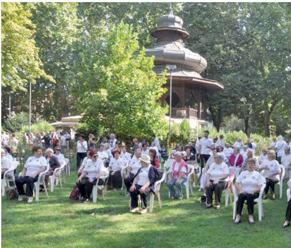
Oko 400 korisnika vježbalo u parku At mejdan