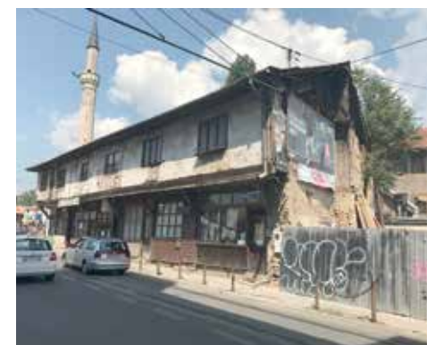
Nova fasada u srcu Starog Grada

Zgrada Muzičke akademije predstavlja povijesnu građevinu i nacionalni spomenik BiH. Projektom je predviđeno uklanjanje oštećenih slojeva fasade sa ulične strane, ukupne površine 2.400 m 2 i pranje fasade. Oštećeni dijelovi bit će sanirani, dekorativni elementi restaurirani i rekonstruirani, urađene trake i vijenci oko prozora, te ugrađeni oluci od pocinčanog lima. Projekat sanacije fasade izradio je Zavod za zaštitu kulturno-historijskih spomenika KS.