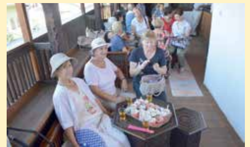
Predah na kameriji

U Saburinoj kući zatekli su se i turisti iz Francuske koji su s oduševljenjem slušali o kulturi življenja u ovom objektu. „U Sarajevu smo već nekoliko dana, a u Info-press centru smo saznali da možemo doći i u obilazak ove važne historijske građevine. Ovo je nešto neviđeno i drago nam je što smo imali priliku da vidimo ovo čudo od arhitekture“, njihove su riječi.