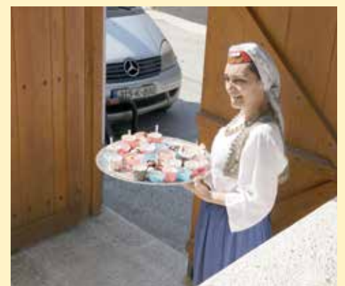
Poslužnje za sve goste

Članovi hora „Ruže“ Centra za zdravo starenje prilikom posjete Saburinoj kući obradovali su prisutne, a među njima i turiste koji su se tu zadesili izvedbom sevdalinki „Pokraj grada Sarajeva“, Sarajevo divno mjesto“, „Kad ja podoh na Bentbašu“, „Sa Igmana pogledat je lijepo“ i „Sarajevo grade“.