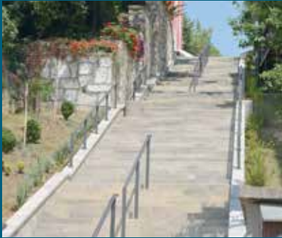
Stepenište dugo 42 metra

Izgrađeno je novo stepenište u ulici Niže banje, koje vodi prema Olimpijskom muzeju. Radove su, po završetku, obišli načelnik Općine Stari Grad Ibrahim Hadžibajrić i gradonačelnik Grada Sarajeva Abdulah Skaka, s obzirom da se radi o zajedničkom projektu.