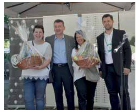
Korpe zdrave hrane za vrtiće Pčelica i Biseri

Mjedenica koji su također danas dobili poklone. Gostima su se predstavili članovi horske sekcije koji su izveli dvije numere “Razbolje se šimšir list” i “Sarajevo ljubavi moja”, a potom je uslijedio drugi dio programa uz vježbe, promocije i degustacije.