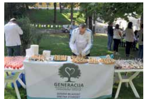
Zdrava hrana za goste